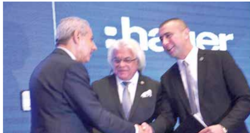
إم بي توقع عقد مع هاجر الشريسية

التطبيقية للعمليات التصنيعية طبقاً للمعايير الدولية بدعم شركة هاجر الفرنسية، إضافة إلى الاستغلال الأمثل للطاقة التصنيعية وخلق فرص جديدة للمعالم المصرية، بالإضافة إلى زيادة المكون المحلي لمحفظة المنتجات سيدعم تطويع الاستراتيجيات البيعية للشركة بهدف زيادة الحصص السوقية في ظل التغيير في النمط الاستهلاكي للمجتمع المصري تبعاً للإصلاحات الاقتصادية المستحدثة في مصر.