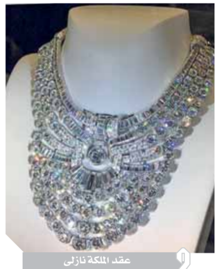
عقد الملكة نازلى