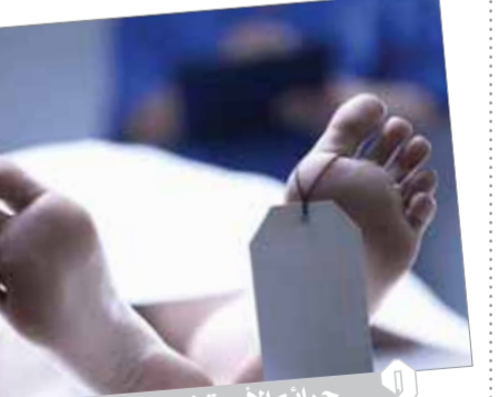
جرائم الأسرة فى زيادة

وخبراء: ٥ أسباب وراء الجرائم الأسرية فى مقدمتها تراجع الوازع الدينى