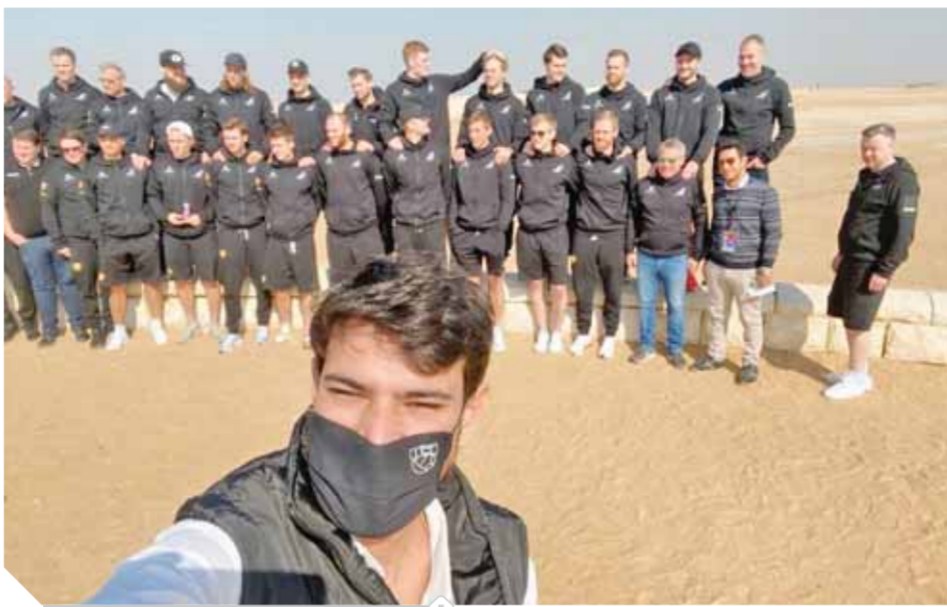
منتخب إسبانيا أثناء زيارته للأهرام

ويلتقى منتخب إسبانيا منافسه المجر في المجموعة الأولى لحسم الصدارة بينما يلعب منتخب بولندا وألمانيا في لقاء تحصيل حاصل.