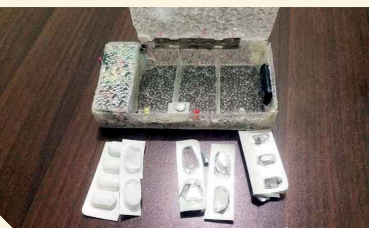
الصيدلية المحمولة تعمل كمنبه جيب