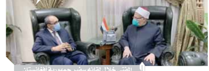
المفتي خلال لقائه سفير جمهورية أفغانستان

وأكد فضيلة المفتى أن مبدأ سيادة القانون مبدأ مهم جداً، وأن الضمانة الحقيقية لاستقرار الدول تتمثل فى الالتزام التام بسيادة القانون، والتعاون من أجل مواجهة الأفكار المغلوطة التى تسعى الجماعات الإرهابية إلى ترويضها. وقال مفتى الجمهورية: «نحتاج إلى تعاون وتشاور دولى بين المؤسسات الدينية بشأن تصحيح المفاهيم ودفع الأفكار الأخرى المغلوطة، وأن تكون جميعاً على قلب رجل واحد لمواجهة هذا الفكر المنحرف». وأبدى فضيلة المفتى استعداد دار الافتاء بالتعاون مع الجانب الأفغانى لتدريب الأئمة على الإفتاء ومواجهة الفكر المتطرف بالتشويق مع وزارة الخارجية المصرية. من جانبه أكد السفير الأفغانى فى القاهرة على عمق الصلة والتعاون بين أفغانستان ودار الإفتاء وما نتج عنها من تعاون فى مجال الإفتاء. أكد المفتى عمق العلاقات والتعاون بين دار الإفتاء والجانب الأفغانى من خلال عقد بروتوكولات التعاون والدورات التدريبية للأئمة الأفغان فى مجال الإفتاء ومواجهة الفكر المتطرف. وأشار إلى أن أفغانستان تسعى دائماً للتعاون مع دار الإفتاء المصرية ذات المنهجية الأزهريّة المتمثلة لما لها من ثقل والاستفادة من خبرات الدار فى مجال الإفتاء ومواجهة الفكر المتطرف.