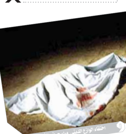
إحقتة الوازع الدينى وراء جرائم الأسرة

خبير: الضمير الحى أقوى من القانون فى التصدى لجرائم الأرحام