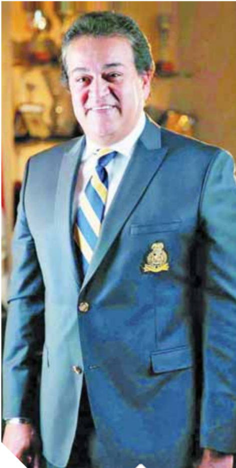
د. خالد عبدالغفار

ومؤخراً، أعلن الدكتور خالد عبدالغفار تنفيذ وزارة التعليم العالى ٣٤ مشروعاً بواقع ٨ جامعات أهلية دولية وهى جامعة الجلالة والأكاديمية العليا للعلوم والعلمين الجديدة والمنصورة الجديدة والملك سلمان والجامعة المصرية اليابانية للعلوم والتكنولوجيا ومدينة زويل للعلوم، وإعادة تأهيل الجامعة الفرنسية الأهلية بمصر، إضافة إلى ٤ جامعات حكومية جديدة، وهى: مطروح والوادى الجديد والأقصر والغردقة، و٣ جامعات تكنولوجية بالقاهرة الجديدة وقويسنا وبنى سويف و٣ معاهد ومراكز بحثية هى مدينة الفضاء المصرية ومعهد بحوث الإلكترونيات والمعهد القومى للبحوث الفلكية، و٨ أفرع للجامعات الدولية، وهى مجمع الجامعات الكندية وجامعات المعرفة الدولية وجلوبال والجامعة الألمانية الدولية ومجمع الجامعات الأوروبية وجامعة العاصمة والمجمع الأكاديمى الدولى، والجامعة المصرية الأمريكية للعلوم الطبية و٧ مجمعات تكنولوجية وبيت مصر بباريس للتمثيل الثقافى.