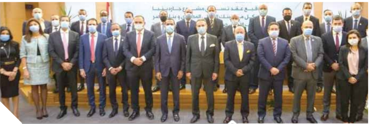
قيادات البنوك والشركة خلال توقيع الاتفاقية

أطلق بنك مصر والأهلي المصري مشروعهما العقاري الجديد «جاردينيا سيتي» بطريق السويس والطريق الدائري والذي يتولى تحالف شركة الأهلي بصور مع شركة (Founders) التابعة لشركة هايد بارك للتطوير العقاري عمليات المبيعات وتطوير المخطط التسويقي الخاصة بمشروع «جاردينيا سيتي».