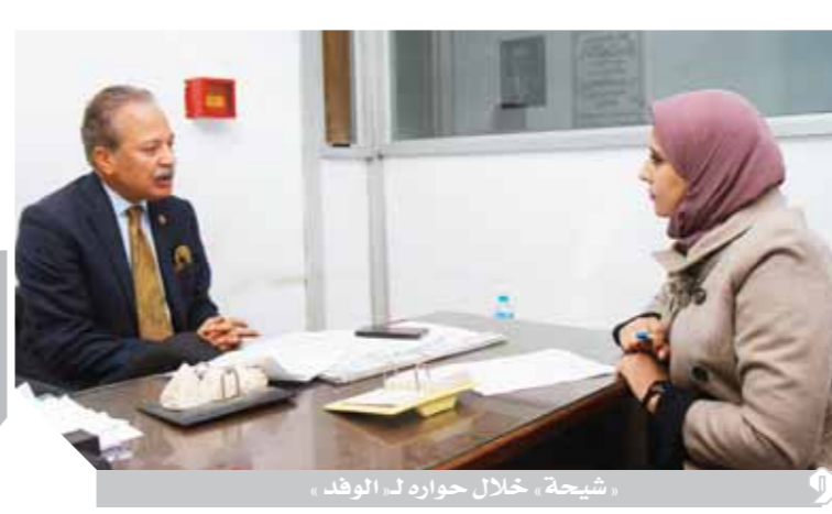
شبيحة، خلال حوار مع ربة في مكتبه.

تصحيح التشريعات أحد الأهداف النبيلة للمنظمة