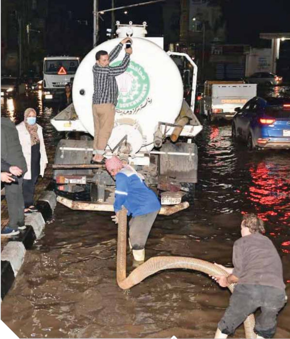
سيارات شطف المياه من الشوارع