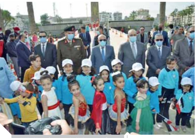
عدد كبير من اطفال المدارس حضروا الاحتفال