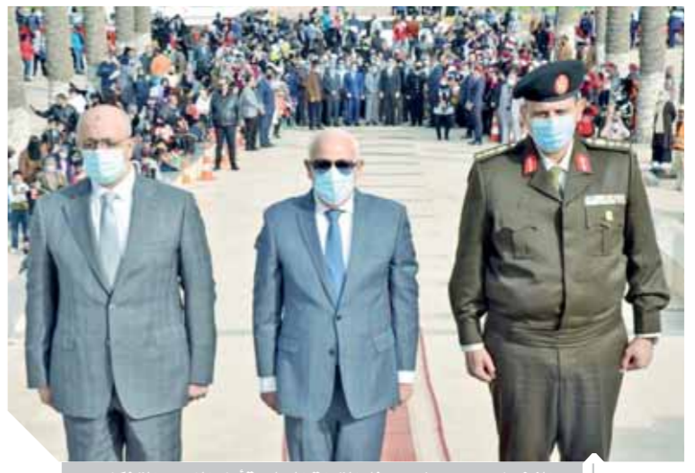
الفضيان ، و حريز، وممثل القوات المسلحة أمام النصب التذكارى

وقافية بسبب فيروس كورونا. وجه المحافظ التهتهة للرئيس عبدالفتاح السيسى رئيس الجمهورية ورجال القوات المسلحة المصرية وشعب مصر وأبناء المدينة اليابسة بمناسبة العيد القومى للمحافظة، مؤكداً أن أهل المدينة اليابسة ورجال المقاومة الشعبية قدموا خلال حرب العدوان الثلاثى