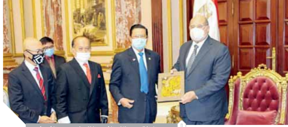
عبدالرازق يهدي نائب الشورى الإندونيسى درع الشيوخ

كتب - حازم العبيدى، استقبل المستشار عبدالوهاب عبدالرازق رئيس مجلس الشيوخ، والمستشار بهاء الدين أبوشقة وكيل أول المجلس، بحضور النائب فبى فوزى وكيل المجلس، وفهداً برلمانياً إندونيسياً رفيع المستوى، برئاسة الدكتور فاضل محمد نائب رئيس مجلس الشورى الإندونيسى، ورحب المستشار عبدالوهاب عبدالرازق بالزيارة مؤكداً أنها تعكس عمق العلاقات الوثيقة التي تربط بين البلدين الشقيقين، والتي تمتد سياسياً وثقافياً وتعود طويلاً، مؤكداً حرص المجلس بأعضائه وقياداته على العمل لتطوير ودعم هذه العلاقة للأفضل.