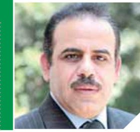
نائب رئيس الوفد

مجتمعنا التي يرفضها وتعارض مع قيمه الروحية، ولكننا في المقابل نترحم ثقافته ولا نتدخل فيها.. الأمر الثاني أن هذا البرلمان الذي يرفض اعدام قاتل وحبس مخرب أو مجرم لم ينتفض عندما ساد الإرعاب في مصر، وتملك الذعر معظم الأسر المصرية واستشهد آلاف المصريين على يد أعضاء الجماعة الإرهابية وانهكت مؤسسات وأجهزة الدولة، وانهار الاقتصاد وشرذم عشرات ومئات الآلاف من العمالة.. ليس لهؤلاء ايأنا حقوق؟ ولماذا لم ينتفض هذا البرلمان لكل ما يحدث لجوارنا على الأرضى اللبية ولماذ لا يشعر أعضاؤه بالغضب والذنب على الأرواح التي تزهر في هذا هناك، وخضوع الشعب اللبي تحت رحمة الإرهاب والمليشيات بسبب عدم توافق حكومات الدول الأوروبية على الحل في ليبيا؟