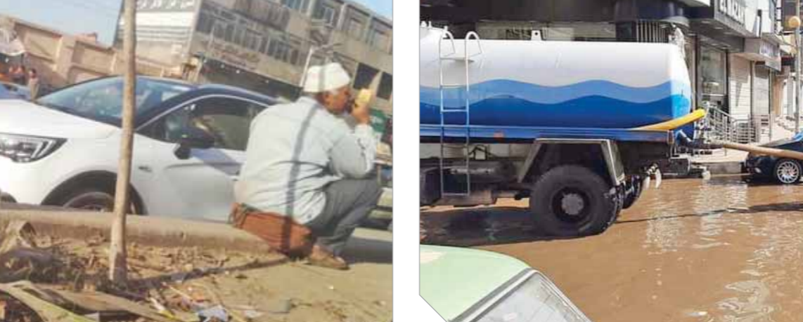
الأمطار تفرق شوارع المنصورة

مع هيئة تعاونيات البناء واكتفى بالفرجة على مخالفة الهيئة وخرقها الاتفاقات والعقود البرمة بينها والمحافظة التي تعد طرفاً أصيلاً في التعاقد على خلاف ما فعله محافظون سابقون من السعى لحل