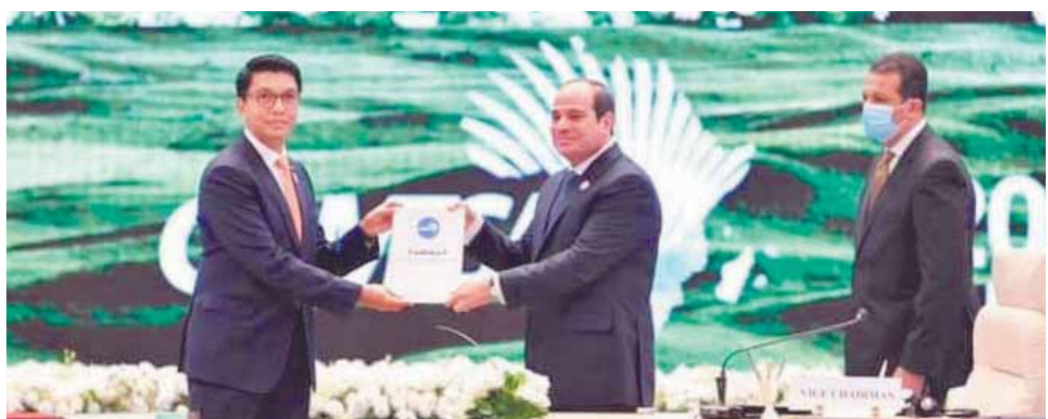
الرئيس السيسي خلال تسلمه رئاسة «الكوميسا»، من رئيس مدغشقر

ثانياً: تعزيز ألياتها رساخاً، بأهمية التكامل الإقليمي والقاري وسعى دائماً لتنمية التجارة البينية، في إطار هذا التكامل ولقد دأبت مصر منذ انضمامها للكوميسا على تطبيق الإعانات الجمركية المنقذ عليها، في إطار منطقة التجارة الحرة، وفقاً لمبدأ المعاملة بالمثل، وتسعى مصر بالتنسيق مع الدول الأعضاء والأمانة العامة، لتدعيم على إزالة أية عقبات، تحول دون قيام الدول الأعضاء، بتقديم