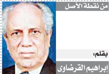
من نقطة الأصل