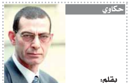
بقلم: د. وجدى زين الدين

وأختتم السيسي كلمته بالقول، «أسماحو لي في نهاية كلمتي، أن أتقدم لكم جميعاً مرة أخرى بالشكر على ثقته التي أوليتموها لمصر لرئاسة «الكوميسا»، خلال الفترة القادمة وأسأل الله تعالى» أن يوفقنا جميعاً في هذه المهمة بما يعود بالنفع على شعوب دولنا الشقيقة».