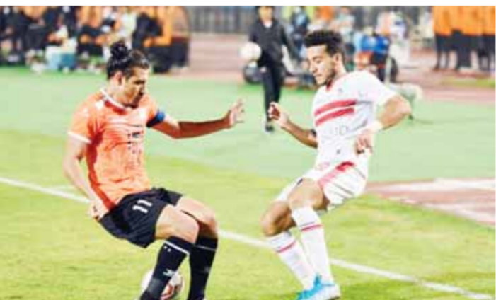
الزمالك سقط فى فخ التعادل أمام البنك الأهلى

استغلال الفرص». وتابع: «نمر بفترة صعبة للغاية منذ نهاية الدورى الموسم الماضى، لدينا غيابات عديدة ومستوانا أمام البنك الأهلى لم يكن الأفضل، كما أننا تأثرنا بإصابة أحمد سيد زيزو بنهاية المباراة». وأنتقل كارتيرون بسبب سؤال غريب من جانب أحد الصحفيين، حول أن اختلاف اللغة بينه وبين اللاعبين، سيكون عاملاً لتعيين مدرب عام بالجهاز الفنى، وقال: «لن أزد على هذا السؤال الغيبي». فى نفس السياق خضع الظهير الأيسر أحمد أبو الفتوح، لاختبار طبي مساء الثلاثاء، على هامش مران الفريق، لتحديد موقفه من مواجهة سيراميكيا كليباترا المقررة عصر الخميس المقبل فى الجولة السادسة. وأطمأن الجهاز على إصابة أحمد سيد زيزو خلال لقاء البنك الأهلى، حيث غادر الملعب فى الدقيقة ٩٠ متأثراً بها، نافياً إصابته بشرخ فى الشظية كما تردد، والحقيقة أنها التواء فى القدم وسيخضع اللاعب لفحوصات طبية لحسم فترة غيابه.