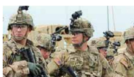
قوات أمريكية على الحدود مع جيبوتي وإثيوبيا

إثيوبيا إذا تقام الوضع هناك. وقالت «سي. إن. إن» إن نشر عناصر من القوات الخاصة الأمريكية يشير إلى تزايد مخاوف الولايات المتحدة فيما يتعلق بالحالة الأمنية المتدهورة، في وقت يتوقع فيه التحالف العسكري المناهض للحكومة الإثيوبية، في إشارة إلى جبهة الجبهة الشعبية لتحرير تيجراي وجيش تحرير أورومو، وبدأ الصراع في إقليم تيجراي في ٢٠ نوفمبر ٢٠٢٠ عندما أرسل رئيس الوزراء الإثيوبي أبي أحمد، قوات الجيش الفيدرالي للتخلص من