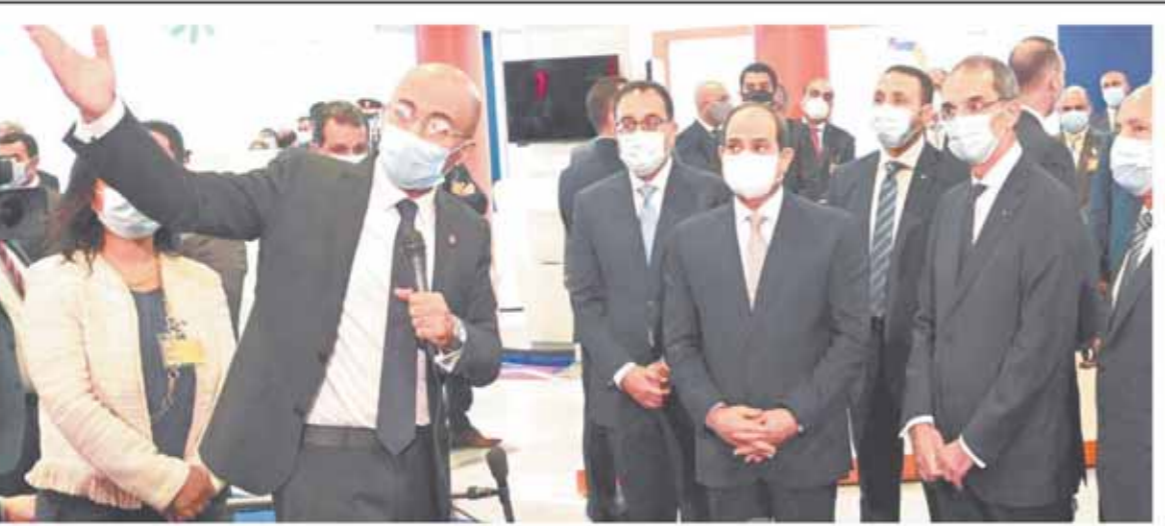
الرئيس السيسى ورئيس الوزراء ووزير الاتصالات يستمعون الى شرح الرئيس التنفيذي لاورنج خلال تفقدهم جناح الشركة بالمعرض

أعلنت أورنج مصر، الرائدة في مجال الاتصالات المتكاملة، عن مشاركتها في فعاليات الدورة الرابعة والعشرين من معرض القاهرة الدولي للتكنولوجيا Cairo ICT 2020 والتي ستعقد خلال الفترة من ٢٢ إلى ٢٥ نوفمبر الجاري تحت رعاية وتشريف فخامة الرئيس عبد الفتاح السيسي. وقد استعرضت أورنج مصر في جناحها مجموعة واسعة من أحدث حلولها وتقنياتها التي توجدها لدعم عمليات التحول الرقمي في المشاريع التكنولوجية الكبرى بالإضافة إلى الخدمات الرقمية المخصصة للشركات الصغيرة والمتوسطة وخدمات للأفراد في عدة قطاعات هامة. وخلال الفعاليات كشفت أورنج عن ابتكارات وحلول ذكية جديدة من شأنها تعزيز عملية التحول الرقمي في مصر في مجالات التعليم عن بعد والنقل الذكي والتجارة الإلكترونية، فضلاً عن العديد من الخدمات المالية الإلكترونية واستبدال نقاط الولاء والحصول على خدمات الاتصالات المتنوعة من أورنج. ومن أحدث حلول المدن الذكية المتعلقة بالنقل والطرق عرضت أورنج خدمة ITS التي تسمح بإمكانية إدارة حركة المرور والإضاءة للطرق وكاميرات المراقبة الذكية التي توفر أماناً عالية للقطاعات الحكومية والشركات والمدارس من خلال مجموعة متنوعة من الباقات التي تتناسب مع احتياجاتها المختلفة.