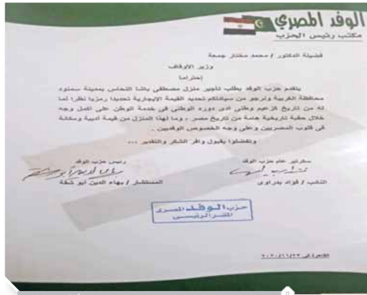
صورة ضوئية من الخطاب المرسل إلى وزير الأوقاف