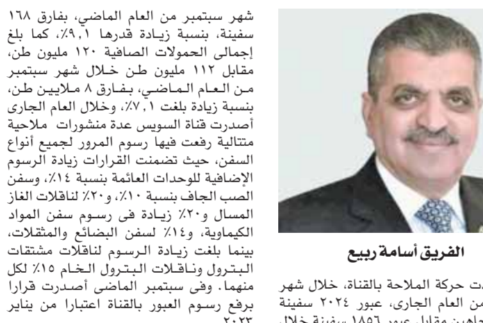
الفريق أسامة ربيع

شهر سبتمبر من العام الماضي، بفرق ١,٦٨ سفينة، بنسبة زيادة قدرها ٩,١٪، كما بلغ إجمالي الحمولات الصافية ١٢٠ مليون طن، مقابل ١١٢ مليون طن خلال شهر سبتمبر من العام الماضي، بفرق ٨ ملايين طن، بنسبة زيادة بلغت ٧,١٪. وخلال العام الجاري أصدرت قناة السويس عدة منشورات ملابية متتالية رفعت فيها رسوم المرور لجمع أنواع السفن، حيث تضمنت القرارات زيادة الرسوم الإضافية للوحدات العائمة بنسبة ١٤٪، ورسوم الصب الجاف بنسبة ١٠٪، و٢٠٪ لنقلات الغاز المسال و٢٠٪ زيادة في رسوم سفن المواد الكيماوية، و١٤٪ لسفن البضائع والمقتلات، بينما بلغت زيادة الرسوم لنقلات مشتقات البترول ونقلات البترول الخام ١٥٪ لكل منهما. وفي سبتمبر الماضي أصدرت قراراً برفع رسوم العبور بالقناة اعتباراً من يناير ٢٠٢٢.