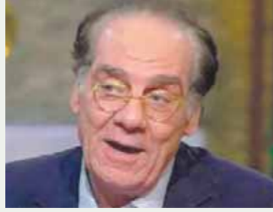
أحمد فؤاد سليم

«voiceover» في التلفزيون خلال الفترة الماضية، ويتمتع بصوت أجش مميز، بالإضافة إلى كونه واحداً من أبرز الممثلين ونجوم الدراما في التلفزيون ويلقى قبولا واسعا لدى الجميع.