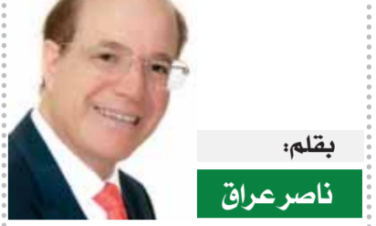
بقلم: ناصر عراق