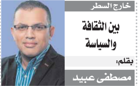
بين الثقافة والسياسة