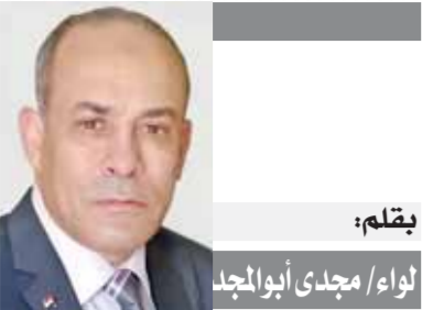
بِقلم: لواء / مجدى أبوالمجد