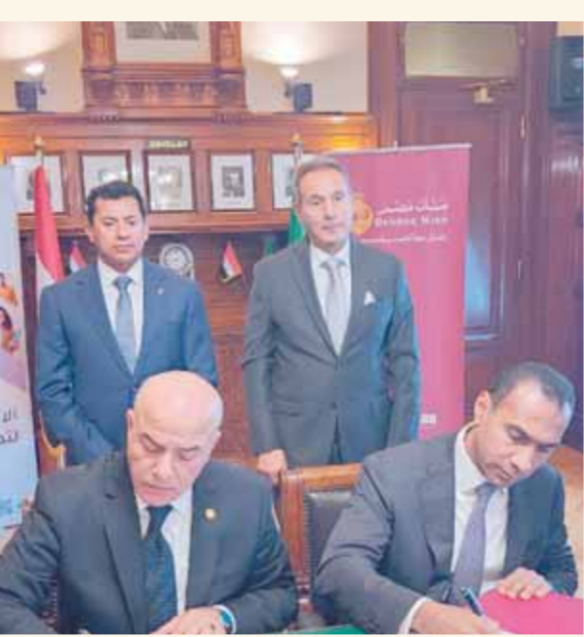
الاتريبي والفار يسهان توقيع الاتفاقية