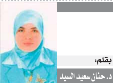
بِقلم: د. حنان سعيد السيد