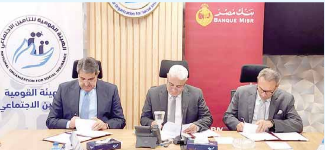
قيادات البنك والهيئة خلال توقيع البروتوكول