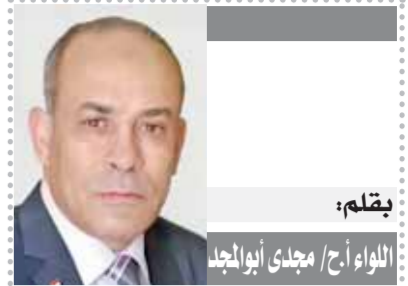
بقلم: اللواء/أح/ مجدى أبوالمجد