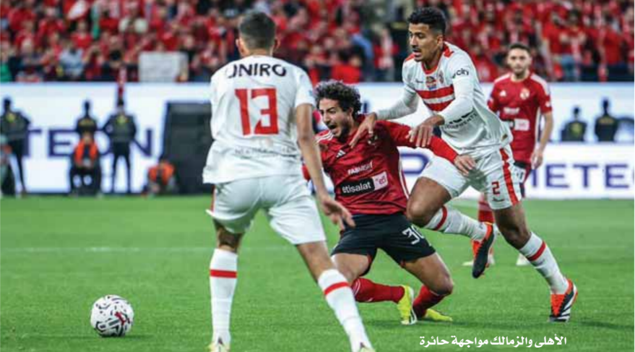
الأهلى والزمالك مواجهة حائرة