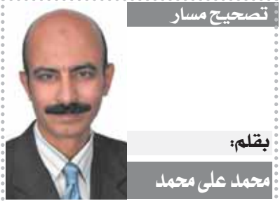
بقلم: محمد علي محمد