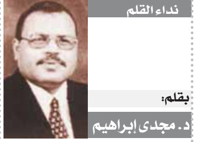
بقلم: د. مجدى إبراهيم

كتبت - نورهان فضل: تتلحق اليوم، الجمعة، منافسات الجولة الخامسة والعشرين من منافسات الدوري الممتاز لكرة القدم، بإقامة مباراتين في غاية القوة والإثارة، حيث يلتقي فاركو معه سموحة، بينما يواجه إنبي فريق سيراميكا كليوباترا. يستضيف فريق فاركو سموحة، على استاد حرس الحدود، في الساعة مساءً، في لقاء صعب على الفريقين، ويحتل فاركو المركز السادس عشر برصيد ٢٠ نقطة، بينما يأتي فريق سموحة في المركز السادس برصيد ٢٤ نقطة. وفي اللقاء الآخر يواجه إنبي نظيره سيراميكا، على استاد بتروسبور، في الساعة مساءً، في مباراة إنبي قوية، ويحتل فريق إنبي المركز الثامن برصيد ٢٢ نقطة، فيما يحتل فريق سيراميكا المركز الخامس برصيد ٢٤ نقطة.