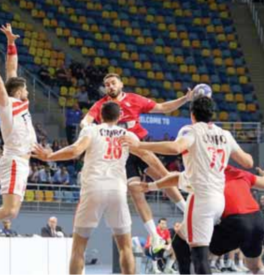
الأهلي يواجه الزمالك في قمة اليد