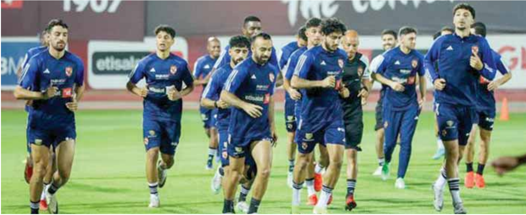
الأهلي جاهز لنهائي دوري الأبطال