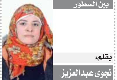
بقلم: نجوى عبدالعزيز