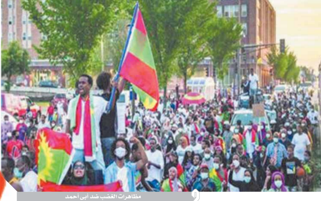
مظاهرات الغضب ضد أبي أحمد

تصاعدت أمس الضغوط الشعبية على رئيس الوزراء الإثيوبي أبي أحمد، في ظل الانتفاضة التي يواجها نظامه. وتحولت المسيرات الاحتجاجية في إقليم «أمهرة» شمال غرب إثيوبيا، إلى انتفاضة شعبية، اعتراضاً على عمليات القتل والتهجير لمواطنين من أقلية «أمهرة»، في مختلف إثيوبيا. وتحولت الاحتجاجات، المستمرة منذ ٤ أيام، إلى موجة غضب عارم ضد حزب «الأزهار» الحاكم بزعامة أبي أحمد. وغيره من كبار المسؤولين الفيدراليين والإقليميين، في ولايتي «أمهرة» و«أورواميا» الإقليميتين. وقام المتظاهرون بتمزيق صور رئيس الوزراء، الإثيوبي ولافتات حزبية كبيرة معلقة في المدن الأمهرية، متهمين مسئولى الحزب الحاكم، بمن فيهم أبي أحمد، بالمسؤولية لتصعيد التطهير العرقي لأقلية الأمهرة، رغم أن الإقليم كان من أشد حلفاء أبي أحمد في الحرب على جبهة تحرير تيجراي، التي تسيطر على الإقليم شمال غرب إثيوبيا. واستعان الحزب الحاكم في إثيوبيا بنظريات المؤامرة، وأنهم المعارضة، والحركة الوطنية لأمهرة، بأنها «عدو»، وتعهد بمواجهتهم «وجهاً لوجه»، وذلك بسبب قيادتهم للاحتجاجات الشعبية المناهضة للحكومة الإثيوبية. وبدأت الولايات المتحدة الأمريكية محاولة جديدة للوساطة في أزمة سد النهضة، تجنبا لتصعيد الموقف، في ظل التعتن الإثيوبي الواضح، ورفض أديس أبابا لجميع الاقتراحات المقدمة من مصر والسودان وأطراف دولية أخرى لحل الأزمة.