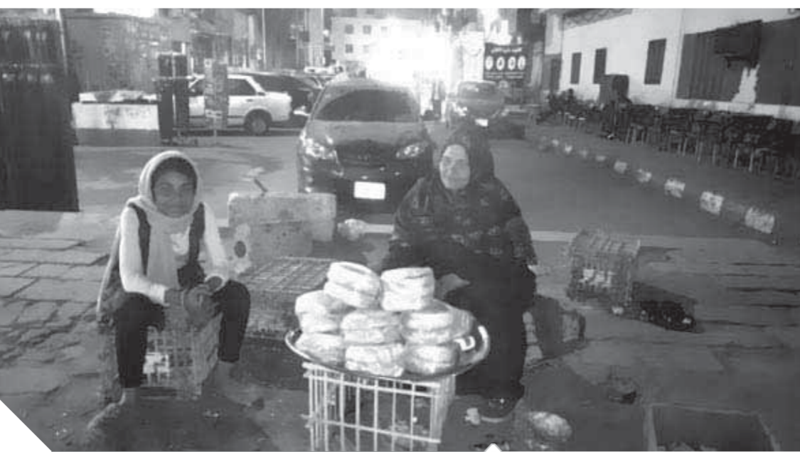
جماليات برفقة ابنتها بيع العيش الشمسي

«أمي تعبت وقدمت الكثير من أجلنا وأتمنى أن أكبر حتى أستطيع تقديم سبل الراحة لها».. زاد الحمل بعد وفاة سند الأسرة وعائلتها زوجي منذ ما يقرب من عشر سنوات وأصبحت أتحمل على عاتقي المسؤولية.