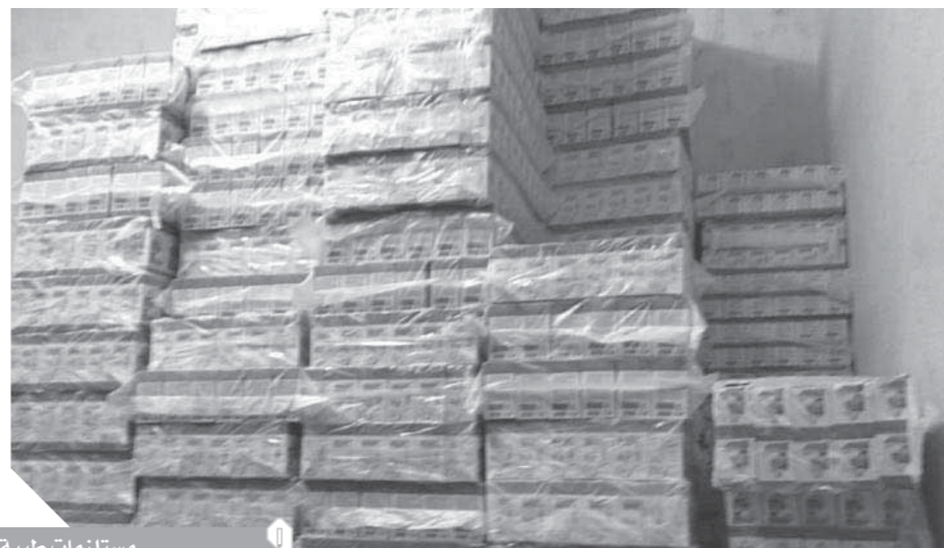
مستلزمات طبية مغموشة