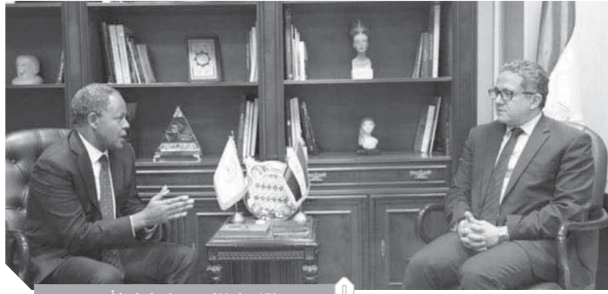
لقاء الصنائى مع السنول الأسمى