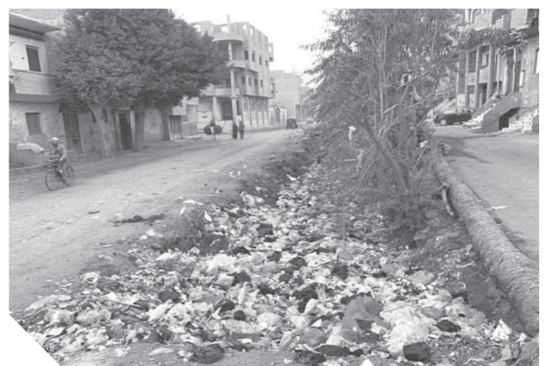
تراكم القمامة على جانبي الترعَة

بالموات إزالة هذه الاكوام وتطهير التربة ولكن دون جدوى، لذلك نشأناش محافظ الجيزة اللواء أحمد راشد، التحرك السريع حفاظاً على أرواح المواطنين.