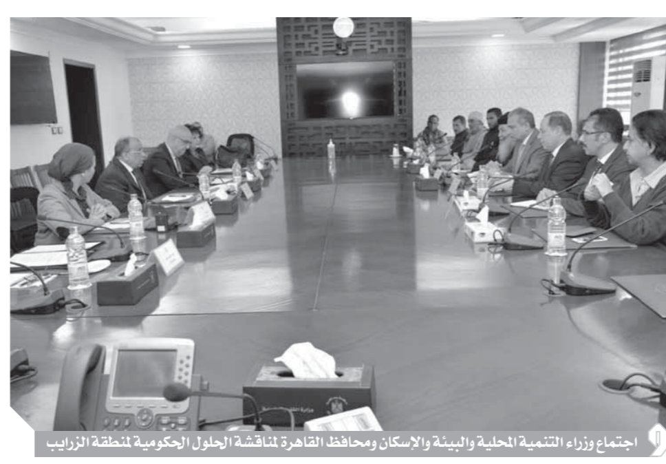
اجتماع وزراء التنمية المحلية والبيئة والإسكان ومحافظ القاهرة لمناقشة الحلول الحكومية لمنطقة الزرايب

أعلن اللواء محمود شعراوى، وزير التنمية المحلية، عن مخطط جديد لمنطقة عزبة الزرايب بمدينة ١٥ مايو التي تضررت من موجة الطقس السيئ الأخيرة. وأشار إلى أن المخطط الجديد سيكون حضارياً ومستداماً، وسيتم فيه فصل مكان السكن عن مكان العمل، مشيراً إلى أهمية دور سكان الزرايب في حل مشكلة القمامة في بعض المناطق بالقاهرة، وأنه لابد من تحويل نشاطهم إلى نشاط مرخص ورسمى وإدخالهم ضمن المنظومة الجديدة، لافتاً إلى استعداد الوزارة لتوفير قروض ميسرة من صندوق التنمية المحلية وبرنامج مشروعك التابعين للوزارة لشراء بعض المستلزمات الخاصة بعمل سكان المنطقة. جاء هذا خلال اجتماع بمقر وزارة التنمية المحلية لاستعراض الحلول الحكومية لتطوير المنطقة، شارك فيه وزير الإسكان والبيئة ومحافظ القاهرة، بحضور نفس إتاسيوس راعى كنيسه البابا شنودة