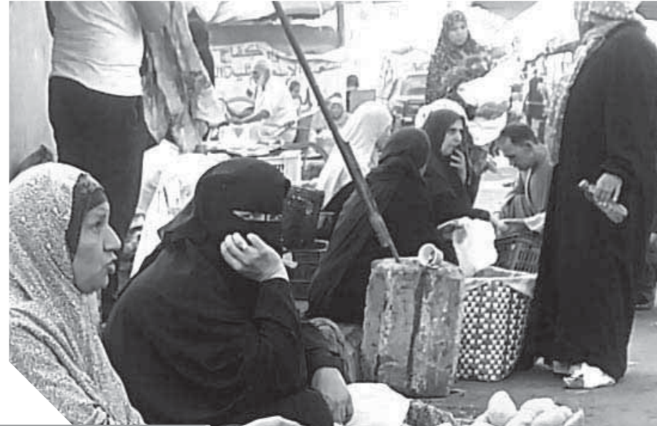
السيدات يفترشن الأسواق للبحث عن لقمة العيش ورزق أولادهن لمواجهة أعباء الحياة