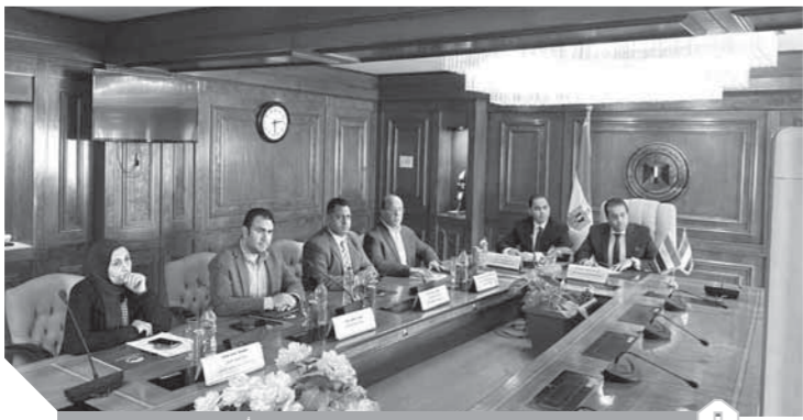
د. خالد عبدالغفار ووزراء الجامعات يتابعون سير الدراسة عن بعد في الفيديو كونفرانس.