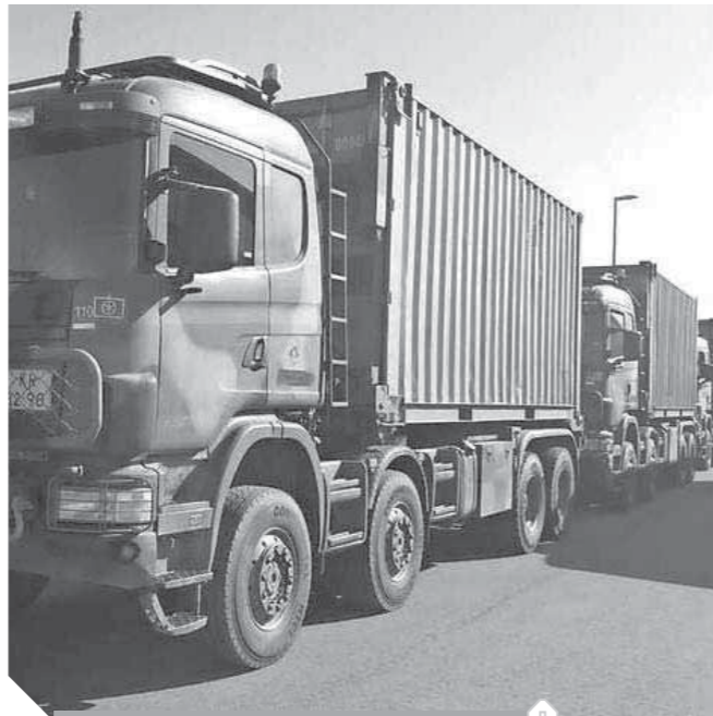
سيارات الجيش تنقل مخزونها للمستشفيات