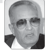
بهاء الدين أبو شققة