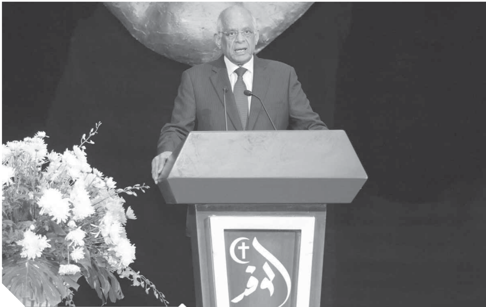
د. على عبدالعال أثناء إلقائه كلمته في الاحتفالية

قال الدكتور على عبدالعال، رئيس مجلس النواب، يسعدني اليوم المشاركة في احتفالية حزب الوفد العريق، وإلقاء كلمة في ذكرى مئوية ثورة 1919 العظيمة، التي شارك فيها جميع أطراف الشعب المصري، وهي الثورة التي تعاقب فيها الهلال والصليب، مضيفاً: أن حزب الوفد كما ذكر الأستاذ الكبير المستشار بهاء الدين أبوشقة رئيس حزب الوفد ورئيس لجنة الشؤون الدستورية والتشريعية بمجلس النواب، كان الابن الشرعي لثورة 1919، إحدى الثورات العظيمة التي جمعت كل أبناء الوطن المصري من متقنين وفنانين من عمال وفلاحين وكانت المرأة وفي أول ظهور لها وبكثافة جنباً إلى جنب مع الرجل.