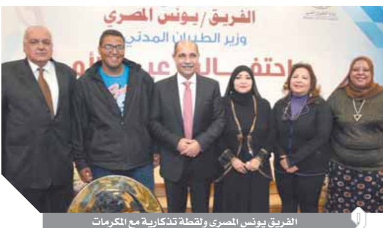
الفريق يونس المصري ولقطة تذكارية مع المكرمات

سبيله هو الحياة.. فشكراً لأمي. وقال الفريق يونس إنه كان يذهب لأمه قبل زوجته عند عودته من كتيبتى وكانت زوجته تشجعه على ذلك ووجه الشكر لزوجته على وقوفها في جواره وتشجيعه والحفاظ على أسرته. بدأت الاحتفالية بعزف أوركسترا «النور والأمل» لأمهات وزارة الطيران المدني، وكذلك فريق الأجراس والبراعم، وجرى تقديم