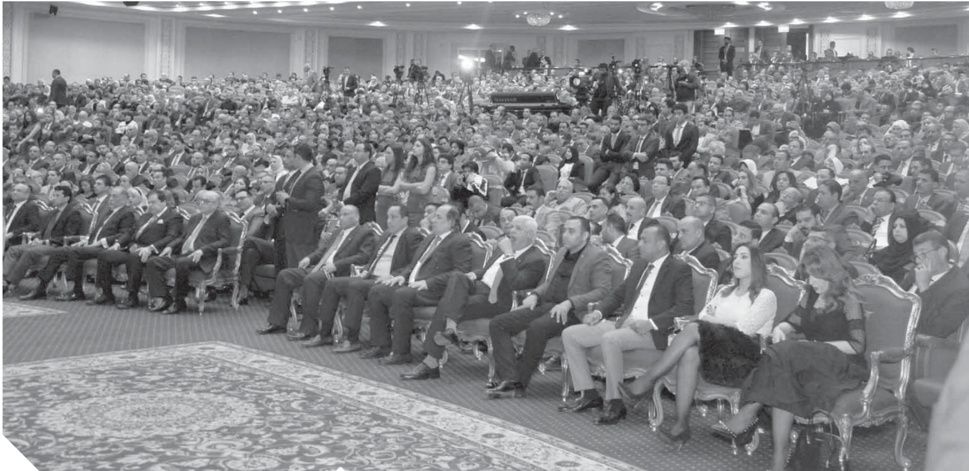
الحشود في الاحتفال بيمئوية ثورة ١٩١٩ وتأسيس حزب الوفد