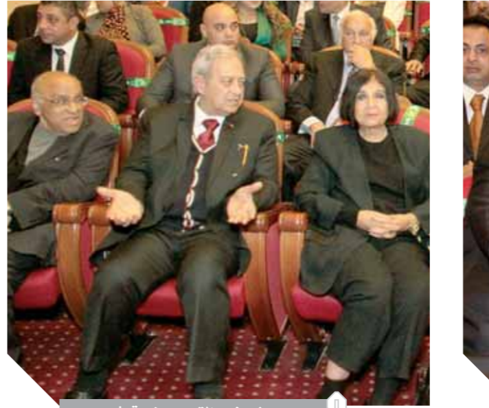
سفير نور والتعيد ومثي قشري