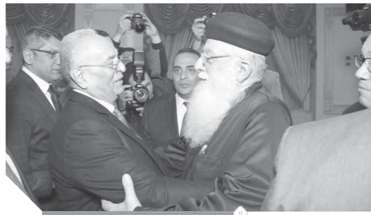
ترحيب أبوشقة بنائب البابا تواضروس

باعتقاد ويتميز أن يحمل حب واحترام وتقدير الجميع. وأضاف رئيس الوفد، إن مجلس النواب نجح في أن يقدم سمفونية برلمانية وتم إنجاز قوانين غير مسبقة وتندعي كل المغرضين الانتهازيين الذين يقولون ما لا يملكون