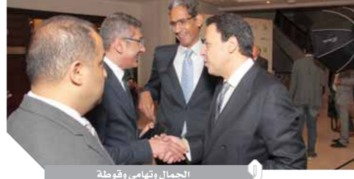
الجمال وتهامي وقوطة