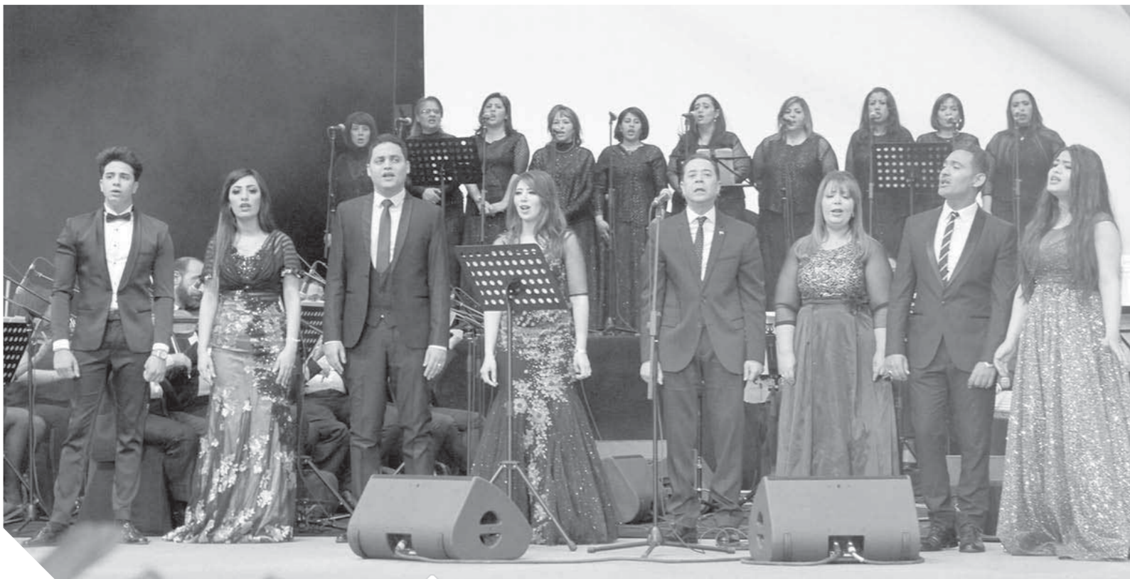
مدحت صالح وريهام عبد الحكيم وفرقة الموسيقى