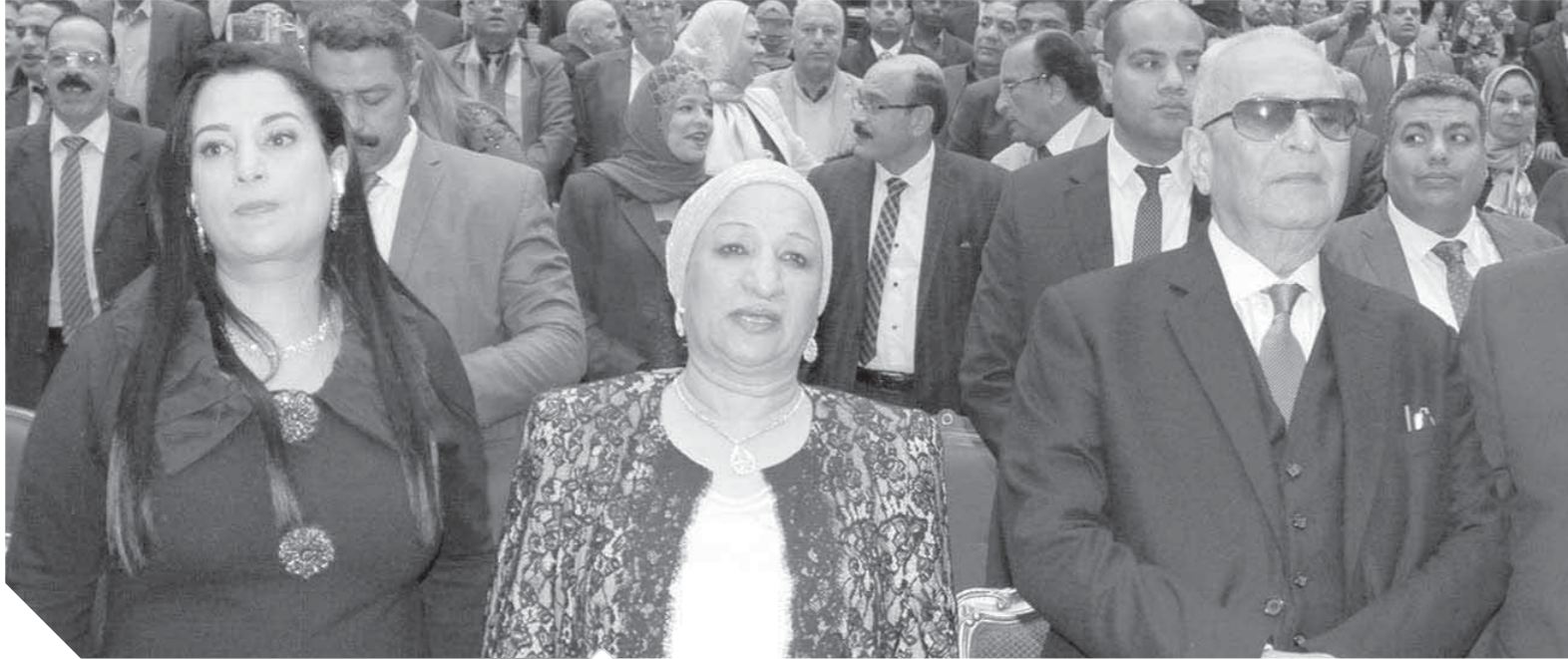
أبوشقة ورحمه وتجلته شهيرة خلال الاحتفال

لم تكن احتفالية حزب الوفد بيمئوية ثورة 1919 بعيدة عن إلقاء الضوء على العلماء والمفكرين الذين كان لهم دور بارز فى رفع اسم مصر عالياً بين الدول فى مختلف المجالات، وأثناء أداء الأغاني الوطنية وكلمات الحضور، كانت الناشئة الرئيسية فى خلفية المسرح مضيفة بصور زعماء الوفد سعد زغلول وعبدالعزيم فهمى وعلى شعراوى، والزعيم مصطفى النحاس، والزعيم أحمد عرابى، والعالم المصرى الدكتور أحمد زويل، والأديب العالمى نجيب محفوظ، وعميد الأدب العربى طه حسين، والعالم فاروق الباز، والطبيب العالمى السير مجدى يعقوب، وأبطال مصر فى مختلف المجالات.