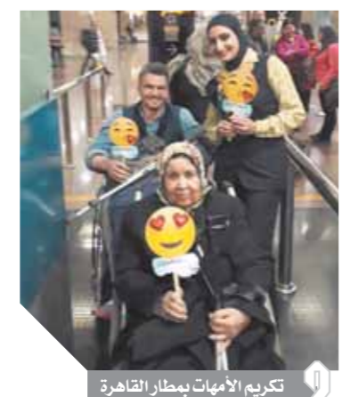
تكريم الأمهات بمطار القاهرة