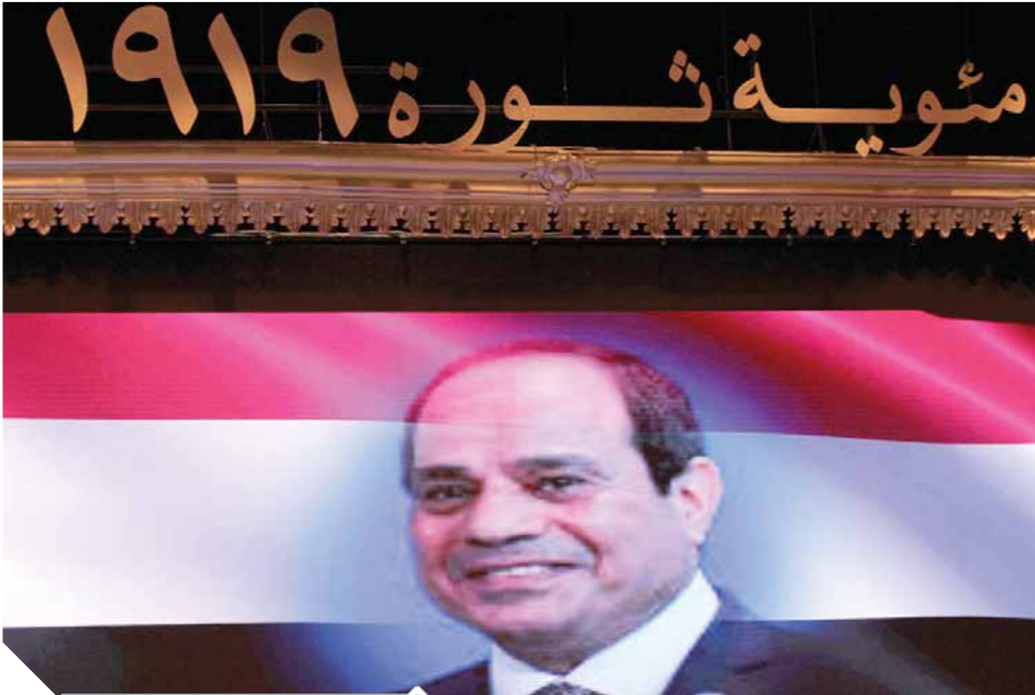
صورة السيسي تتصدر الفيلم الوثائقي لثورة ١٩١٩