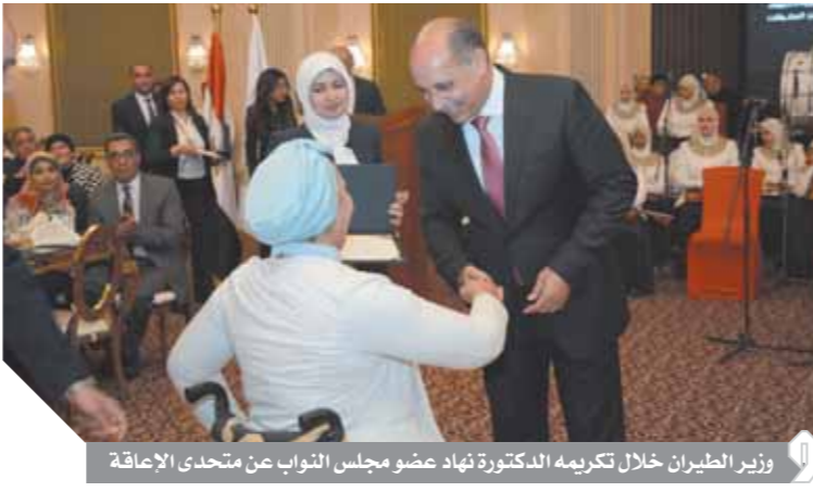
وزير الطيران خلال تكريمه الدكتورة نهاد عضو مجلس النواب عن متحدى الإعاقة

كنت أذهب لأمي قبل زوجتي عندما أعود من كتيبتى وزوجتى كانت تشجعنى على ذلك