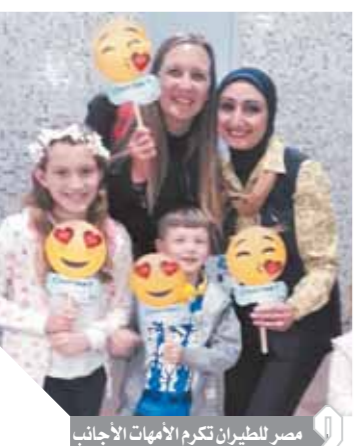
مصر للطيران تكرم الأمهات الأجنبيات