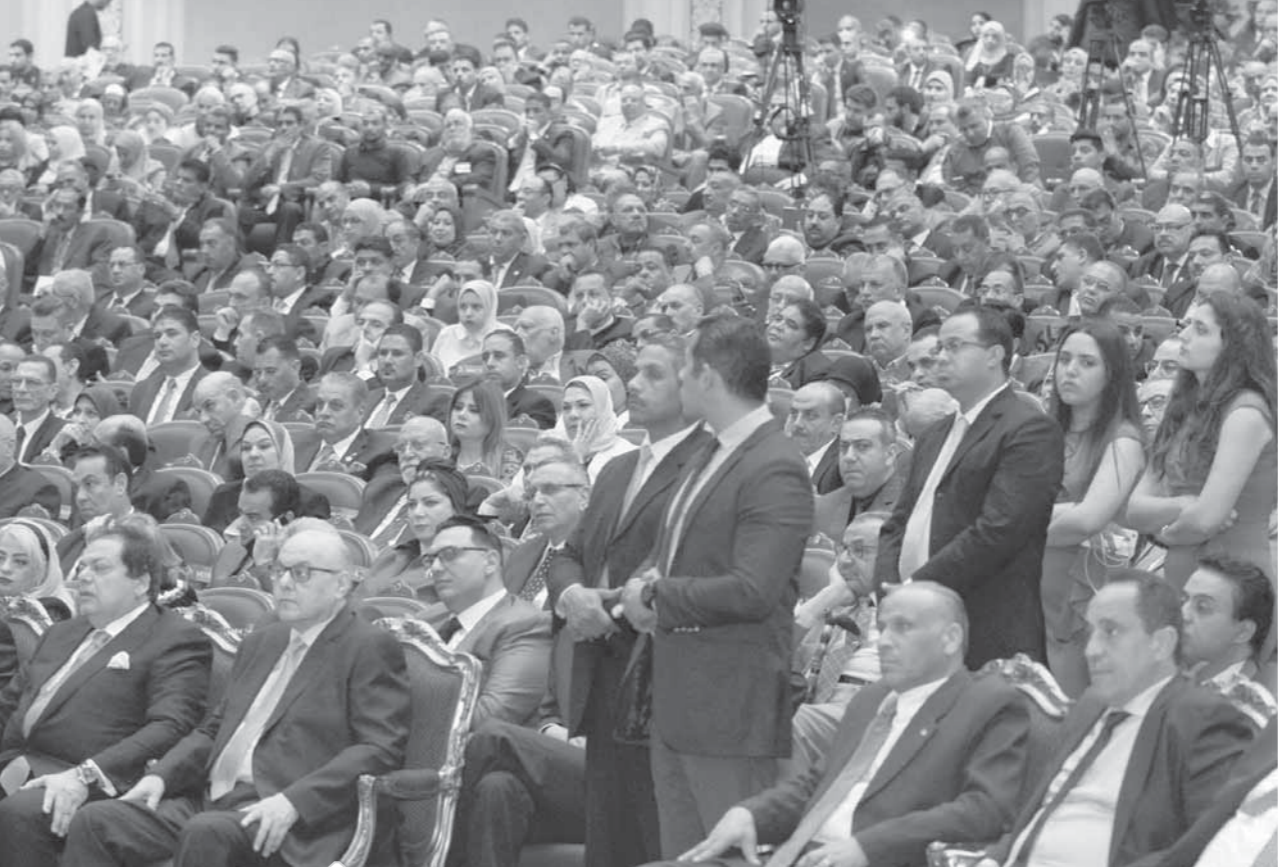
حضور كثيف فى الاحتفال بمئوية ثورة ١٩١٩

شهدت الاحتفالية عرضاً لفيلم وثائقي عن أحداث ثورة 1919، إلى جانب لقطات نادرة للزعيم سعد زغلول ورفاقه، كذلك مشاهد من الثورة، ومشاركة المرأة المصرية فى المظاهرات والكفاح الوطنى، كذلك لقطات نادرة لمشاركة طلاب المدارس فى الثورة المجيدة. وأشرف على الفيلم الوثائقي الكاتب الصحفى شريف عارف، مقرر لجنة الإعلام بحزب الوفد وجاء إهداء من الدكتور هانى سرى الدين، عضو الهيئة العليا للحزب، وسكرتير عام الحزب سابقاً. وتحدث خلال الفيلم عن أحداث الثورة وتاريخ حزب الوفد المشرف فى الحركة الوطنية كل من الدكتور خلف الميرى، أستاذ التاريخ الحديث والمعاصر، والدكتور محمود أباطة، الرئيس الأسبق لحزب الوفد، والمفكر السياسى، والكاتب الصحفى الراحل نبيل زكى، وحفيد عبدالرحمن باشا فهمى، إلى جانب كبار السياسيين والمفكرين الذين تحدثوا عن تاريخ الوفد.