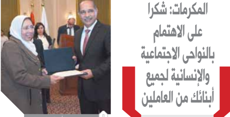
.. وتكريم مستحق لانهات الطيران للذى

استقبلت مصر للطيران عملاءها صباح يوم عيد الأم 21 مارس فى صالات السفر بمطار القاهرة الدولي، بالورود والشيكولاتة احتفالاً