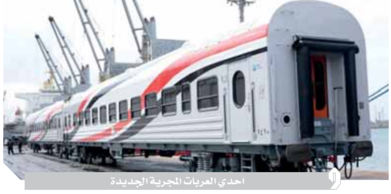
احدي العربيات المجرية الجديدة

خطة طموحة لتطوير كافة مرافق الدولة، وفى مقدمتها قطاع النقل بجميع محاوره، والذى عانى حالة من الركود والتدهور خلال العقود الماضية إلى أن تولي فخامة الرئيس عبدالفتاح السيسى رئاسة الجمهورية، حيث تم وضع خطة استراتيجية للتنمية المستدامة فى مصر فى إطار رؤية ٢٠٣٠، تضمنت ضرورة العمل على إنشاء شبكة طرق حديثة وقوية تربط أقاليم مصر وتربط مصر بالعالم، باعتبار أن النقل هو قاطرة التنمية، الأمر الذى انعكس على كافة الأصعدة فى مجالات النقل بدءاً من حفر قناة السويس الجديدة كمبر مائى عالمى فى زمن قياسي، وإنشاء منطقة اقتصادية لقناة السويس، مروراً بمشروعاتنا الطموحة فى قطاعات النقل المختلفة، وفى مقدمتها السكة الحديد التى شهدت طفرة كبيرة خلال الفترة الأخيرة.