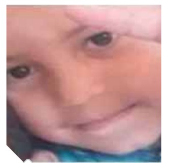
الأطفال الاربعة ضحايا الحادث