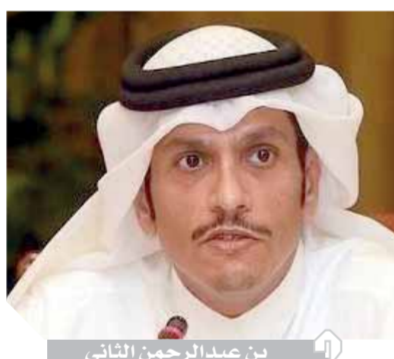
بن عبد الرحمن الثانى

وتقدم الجانبان بالشكر لدولة الكويت الشقيقة على استضافتها للاجتماع الأول بينهما، وأعربا عن التقدير لصاحب السمو الشيخ نواف الأحمد الجابر الصباح، أمير دولة الكويت، على الجهود التى قادتها بلاده لرأب الصدغ وحرصها على تعزيز العمل العربى المشترك.