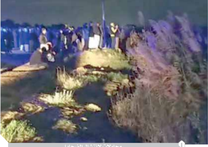
محاولات لانتشال الضحايا

تسعة متوفين من مستقل المركب وعددهم عشرون راكبا، وعلى هذا انتقل فريق من «النيابة العامة» لسؤال المصائب ومناظرة جثامين المتوفين، وفريق آخر لمعالجة موقع الحادث، حيث تبين وقوعه ببجيرة «وادي مريوط» التابعة إلى «الهيئة العامة للثروة السمكية»، والنقت «النيابة العامة» بشهود الواقعة أثناء المعالجة، فاستدعتهم لسؤالهم في التحقيقات.