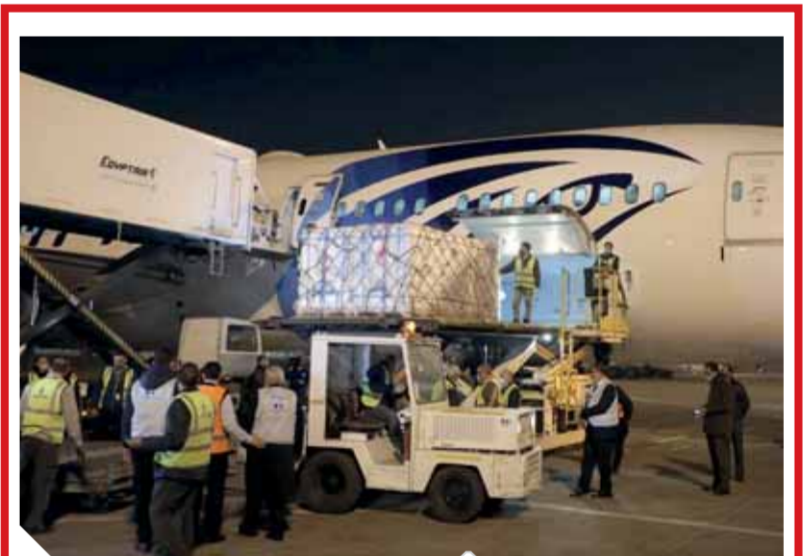
وصول جرعات لقاح كورونا إلى مطار القاهرة

وأكد بيان صادر عن وزارة الخارجية ترحيب الجانبين بالإجراءات التى اتخذها كلا البلدين بعد التوقيع على بيان العلا كخطوة على مسار بناء الثقة بين البلدين الشقيقين. كما بحث الاجتماع السبل الكفيلة والإجراءات اللازم اتخاذها بما يعزز مسيرة العمل المشترك