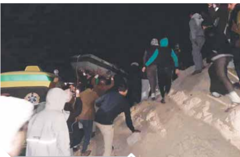
جانب من عملية انتشال الضحايا

طقس سيئ فى المحافظات.. ثلوج فى دمياط.. ونوة «القرش» تضرب الإسكندرية