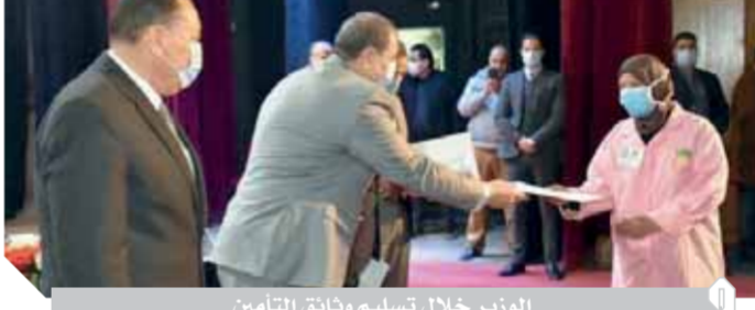
الوزير خلال تسليم وثائق التأمين

الدولة المصرية صاحبة الفضل عالياً، وفى مقابل ذلك يجب أن تكون الدرغ الحامية لها فى مواجهة أعدائها». وقال الوزير: وجهت مديريات القوى العاملة فى المحافظات بالإسراع فى استخراج شهادات قياس مستوى المهارة مجاناً للعمال غير المنتظمة المسجلة، حتى يتسنى لهم تغيير المهنة فى بطاقات الرقم القومى، مشيراً إلى أن ذلك بدأ بالفعل على أرض الواقع بخروج لجنيتين من الوزارة، الأولى لمدينة العلمين الجديدة والأخرى للعاصمة الإدارية الجديدة، لحصر وتصنيف تلك الفئة فى أماكن عملهم على أرض الواقع لشمولهم تحت مظلة الرعاية التى تقدمها الوزارة.