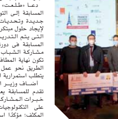
الشركات الفائزة في المسابقة الفرنسية المصرية

أشى وزير الاتصالات على جهود الشركات المصرية- الفرنسية في مجال بناء القدرات الرقمية، والبحوث والتطوير في التكنولوجيا المتخصصة، وتنمية ثقافة المؤسسات الأكاديمية بفرنسا في توطين الإبداع والابتكار باستخدام التكنولوجيا الرقمية؛ مشيراً إلى التعاون البناء مع كبرى المؤسسات الأكاديمية بفرنسا في توطين الإبداع الرقمي بالمحافظات.