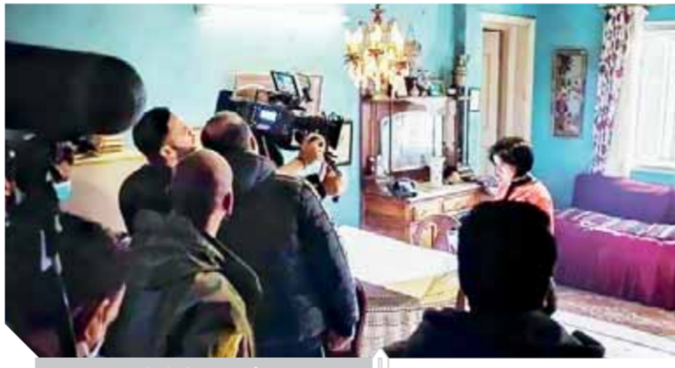
مشهد من المسلسل