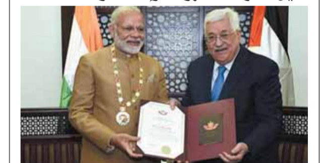
رئيس الوزراء الهندي ناريندرا مودى أثناء تسلمه أعلى وسام فلسطيني من رئيس السلطة الفلسطينية محمود عباس أبو مازن

نيو دلهي- تحرض الحكومات الهندية المتعاقبة منذ السبعينيات من القرن الماضي، على مساندة الشعب الفلسطيني، لنيل حقوقه المشروعة، ومنها حق تقرير المصير، وإقامة دولة فلسطينية مستقلة جنبا إلى جنب مع دولة إسرائيل. وتقديرا من القيادة الفلسطينية لموقف الهند الثابت من القضية الفلسطينية، منح الرئيس الفلسطيني محمود عباس أبو مازن أعلى وسام فلسطيني لرئيس الوزراء الهندي ناريندرا مودى، خلال الزيارة التي قام بها للفضة الغربية في العاشر من شهر فبراير عام ٢٠١٨، وهي الزيارة التي وصفت بالتاريخية.