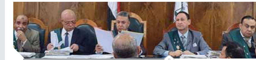
هيئة المحكمة الإدارية العليا

أصدرت المحكمة الإدارية العليا حكماً بعزل أستاذ جامعى بقسم اللغة الإنجليزية بكلية الدراسات الإنسانية وأدائها بتفتها الأشراف بالدقهلية، نقل حرفياً ٣ أبحاث من رسالة الدكتوراه لباحث أمريكية بجامعة نورث كارولينا وتقدم بها للترقية لدرجة أستاذ مساعد. صدر الحكم برئاسة المستشار عادل بريك نائب رئيس مجلس الدولة وعضوية المستشارين سيد سلطان والدكتور محمد عبدالوهاب فخاخي، ونيل علم الله وأسامة حسنين نائب رئيس مجلس الدولة.