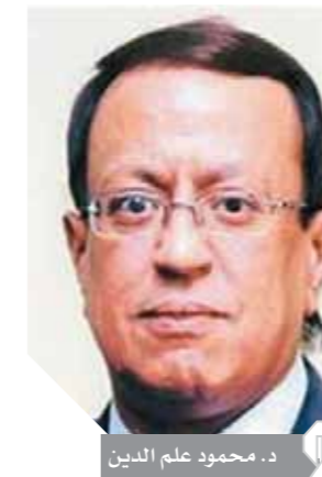
د. محمود علم الدين

المحتوى - غير الصحيح- والشائعات، والحروب الإعلامية بين الدول والحكومات من ناحية، وبين الأفراد والحكومات أو جماعات معينة من ناحية أخرى. فمثلاً: عن طريق الطباعة ثلاثية الأبعاد، وهي أحد أهم أدوات الثورة الصناعية الرابعة، وتقنيات صحافة الذكاء الاصطناعي، يمكن حصول الأفراد على استوديوهات وأدوات إعلامية سهلة وبطرق أرخص، وعمل تقارير ومحتوى بصور احترافية قد تتنافس القنوات الحكومية في دول العالم الثالث.