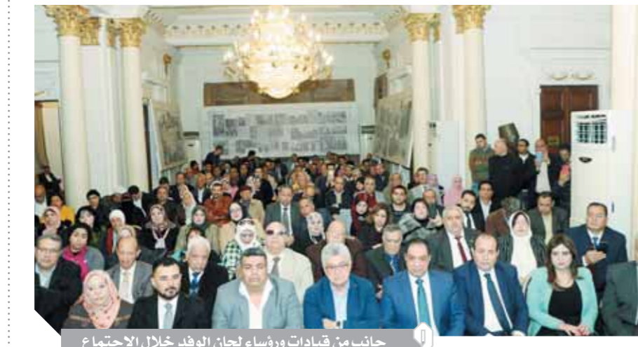
جانب من قيادات ورؤساء لجان الوفد خلال الاجتماع