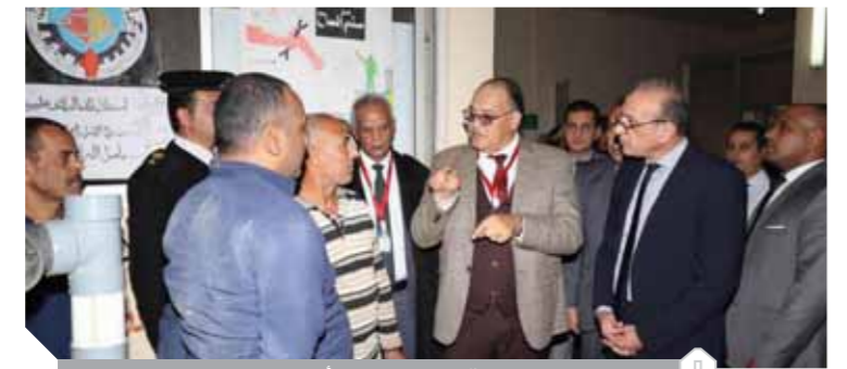
وفد المنظمات الحقوقية والوكالات الأجنبية خلال زيارة سجن المرج

كتبت - محمد عبدالفتاح: استقبل قطاع السجون وفداً ضم عدداً من مراسلي القنوات والوكالات الأجنبية من بينها (الأنوسيتد برس- قناة العربية- قناة الغد العربى) بالتنسيق مع الهيئة العامة للاستعلامات، بالإضافة إلى مستوى عدد من منظمات حقوق الإنسان (المنظمة المصرية لحقوق الإنسان- مؤسسة المحرسة للتنمية للمؤسسات الوطنية للسلام والتنمية لحقوق الإنسان- المنظمة العربية لحقوق الإنسان- جمعية حلف مصر لحقوق الإنسان- المنظمة العربية المصرية الدولية لحقوق الإنسان- المنظمة المصرية الدولية لحقوق الإنسان والتنمية- المجلس الدولى لحقوق الإنسان) حيث قاموا بزيارة (سجن المرج) وتفقدوا عدداً من مرافق السجن (فصول محو الأمية- المكتبة- دروس الوعد الدينى الإسلامى والمسيحى- المطبخ- ورشة أعمال التجارة- معرض المنتجات الزخرفية- المنتجات الغذائية).