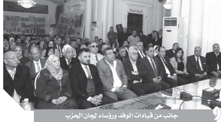
جانب من قيادات الوفد ورؤساء لجان الحزب