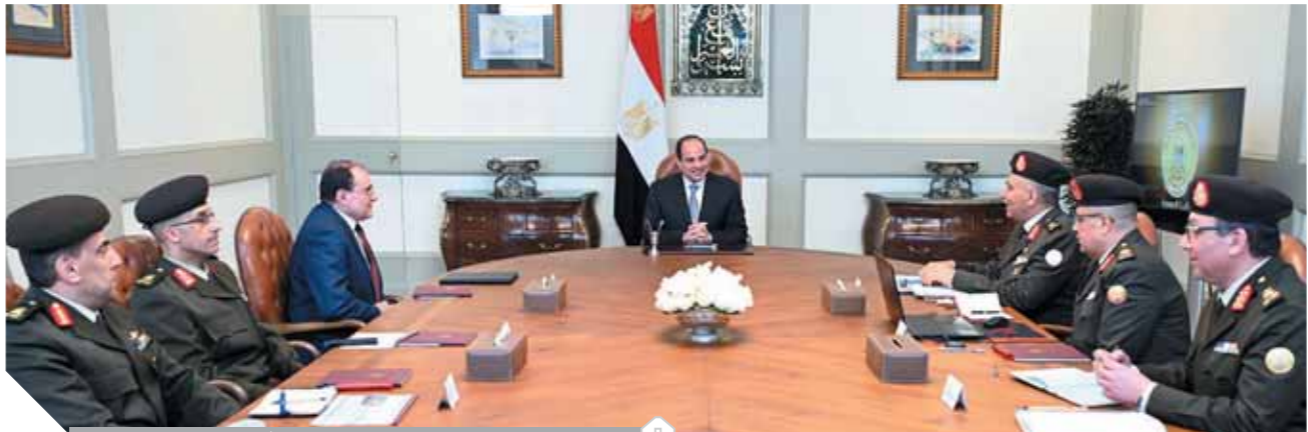
السيسى، يلتقى رئيس الهيئة الهندسية وعددا من كبار مسئولى الهيئة

وربط تلك الأحياء بالمحاور الرئيسية للجمعات العمرانية والمدن الجديدة حول العاصمة، في إطار خطة التحديث والتطوير الشاملة التي تشهدها محاور القاهرة الكبرى. كما تناول اللقاء استعراض الموقف التنفيذي والإنشائي الخاص بعدد من المشروعات الهندسية بالعاصمة الإدارية الجديدة، ووجه الرئيس بسرعة الانتهاء من مشروعات تطوير محاور الطرق والكبارى بعدة مناطق وأحياء القاهرة الكبرى وفق التخطيط الزمني والإنشائي المقرر، وذلك لتسهيل حركة المرور ورفع المعاناة عن المواطنين، وذلك بأعلى معايير الأمان والجودة الهندسية.