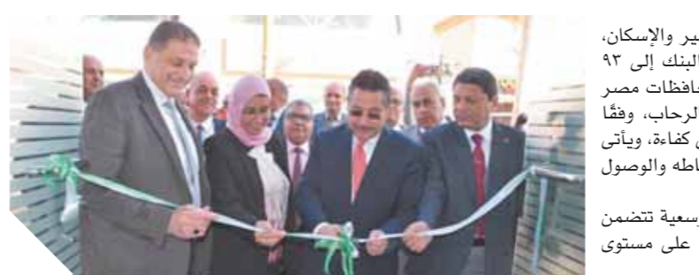
قيادات بنك التعمير والإسكان خلال افتتاح فرع الرحاب

افتتح حسن غانم، رئيس مجلس إدارة بنك التعمير والإسكان، أحدث فروع البنك بالرحاب، لتصل سلسلة فروع البنك إلى ٩٣ فرعاً، تقدم جميع الخدمات المصرفية لعملائه بمحافظة مصر المختلفة. ويقدم الفرع خدماته لجمهور العملاء بالرحاب، وفقاً لأحدث ما وصلت إليه التكنولوجيا المصرفية وبأعلى كفاءة، ويأتى ذلك فى إطار سعى البنك المستمر لتوسيع دائرة نشاطه والوصول إلى أكبر عدد من العملاء.