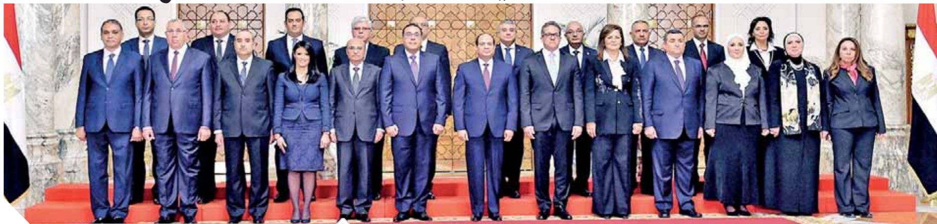
الرئيس يتوسط الوزراء الجدد بعد حلف اليمين

ضم «الاستثمار» لـ «مدبولي».. «مروان» لـ «العدل».. «هيكل» وزير دولة لـ «الإعلام» «السعيد» لـ «التخطيط والتنمية الاقتصادية».. «عنبه» لـ «الطيران».. «جامع» لـ «الصناعة»