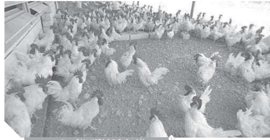
أول مرة.. تحقيق الاكتفاء الذاتى من الدواجن

وكشف معهد المحاصيل الزراعية بوزارة الزراعة عن لجنة تقاوى الحاصلات الزراعية، وافقت على تصدير ١٧ طنا ١٠٠٠ كيلو تقاوى بالإضافة إلى تصدير ٩ آلاف شتلة هالكة، خلال أسبوعين تطبق عليها جميع الاشتراطات الحجرية والصحة النباتية.