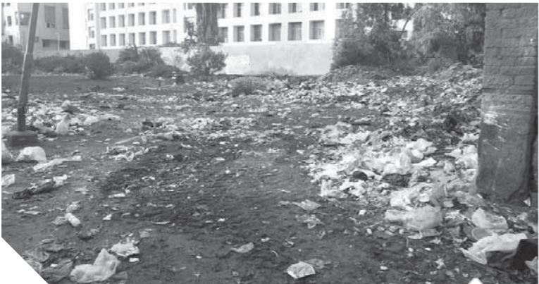
القمامة حول أسوار الجامعة