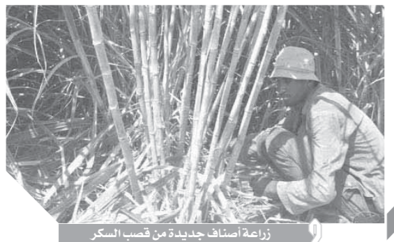
زراعة أصناف جديدة من قصب السكر