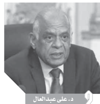
د. على عبدالعال

المحلي ستكون اجابته للمجلس المحلي، وطالب النائب سليمان وهدان، وكيل مجلس النواب، بضرورة إعادة قانون الإدارة المحلية الجديد مرة أخرى للجنة النوعية المختصة واقتصادية ومجتمع مدني وخبراء متخصصين، ليخرج قانون متوازن ومكامل. وشهدت الجلسة مناقشات موسعة بين اعتراضات على مبدأ المناقشة حيث النائب أشرف رشاد رئيس حزب مستقبل وطن، أعلن رفضه مشروع القانون، وطلب تأجيله، وقال إن حزبه حريص على صدور القانون ولكن عندما يكون القانون قادرا على مواجهة الواقع، مشيراً إلى أن القانون به مشكلات دستورية، منها كيفية تنفيذ اللامركزية في الحكم في ظل الوضع الحالي للمحليات.