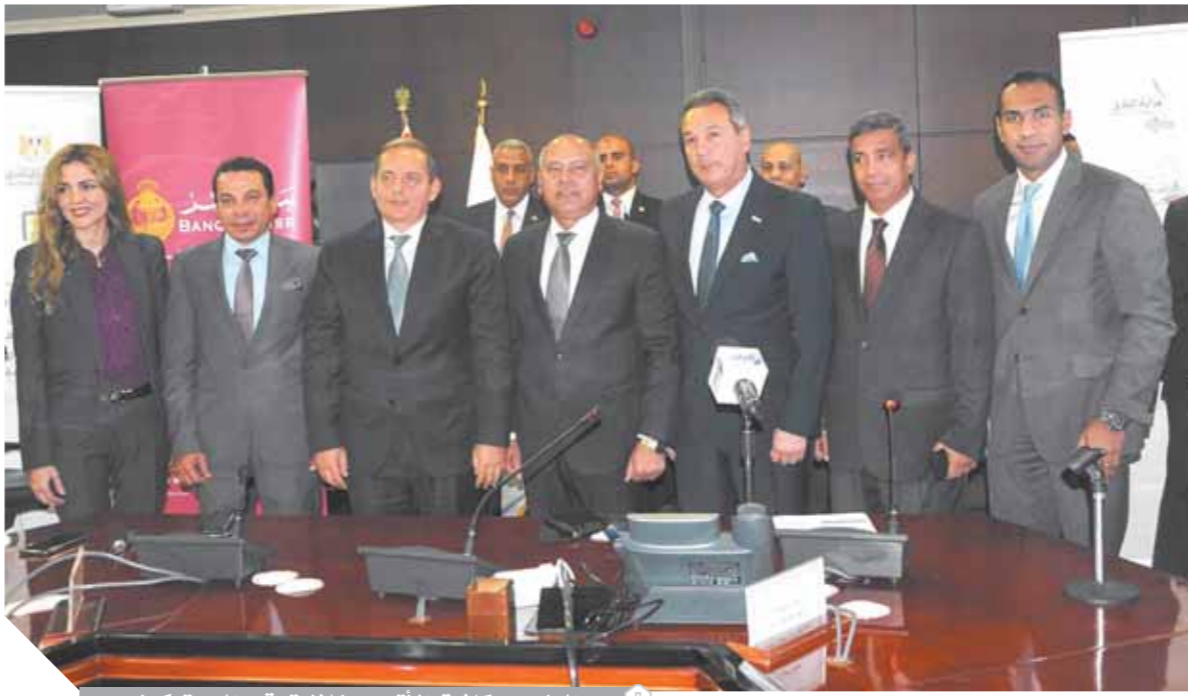
الوزير وعكاشة والاتربى خلال توقيع البروتوكول

وأضاف أن أعمال التطوير لهذه المسافة تشمل (توسعة الطريق ليصبح ٦ حارات بعرض ٢٥.٤ م لكل اتجاه بدلاً من ٤ حارات بعرض ١٨.٢ م وبطول ٧٥٠٠م، وتوسعة كوبرى المنيب العلوى على النيل بعرض ٨ م لكل اتجاه بطول ٢١٠٠م، وتوسعة عدد ٦ كبارى علوية بعرض ٧ م بإجمالى أطوال ٢٤٠٠م وتوسعة عدد ١١ نفقاً بعرض ٧ م بإجمالى أطوال ٢٢٤م.