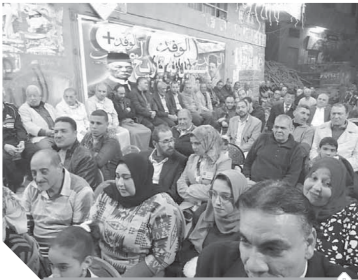
جانب من الاحتفال