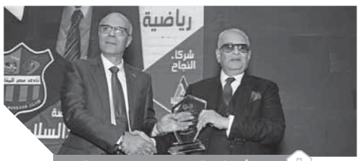
أبو شبا يكرم نادى المقاصة

اختتم العملاق الإنجليزى ليفربول، بطل أوروبا، عامه الذهبى بتتويجه بلقب كأس العالم للأندية، بفوزه الصعب على فلامنجو بطل أمريكا الجنوبية ١-٠ بعد التمديد لشوطين إضافيين، السبت الماضى فى المباراة النهائية التى أقيمت على أرضية استاد خليفة الدولى فى الدوحة. وهذه هى المرة الأولى التى يحرز فيها ليفربول اللقب، بعدما خسرت نهائي نسخة عام ٢٠٠٥ أمام ساو باولو ١-٠، لكن نجمه البرازيلى روبرتو فيرمينو كان له الفضل بعدما