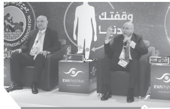
الأطباء يناقشون علاج خشونة المفاصل

أعلنت الحملة المصرية لعلاج خشونة المفاصل، التى تحمل شعار «وقفك بالدنيا» إطلاق المرحلة الثانية لحملة، وتهدف فيها للتوعية بالمرض وتوفير العلاج المجانى للمرضى، وقال الدكتور هانى موفى رئيس جمعية جراحة العظام المصرية، خلال مؤتمر صحفى إن الحملة تتم بالتعاون بين الجمعية وإحدى شركات الدواء الوطنية، واستهدفت فى مرحلتها الأولى تدريب شباب الأطباء. وقال الدكتور عادل عدوى، وزير الصحة والسكان الأسبق وأحد قيادات الجمعية، إن الحملة فى مرحلتها الثانية، ستعاجل أكثر من مليون مريض بأمراض خشونة المفاصل، وذلك عبر علاجهم، وتشخيص حالتهم، مع صرف العلاج لهم بالمجان. وأضاف الدكتور عادل عدوى أنهم بدأوا الإعداد والتخصيص لإطلاق الحملة خلال شهر سبتمبر الماضى، واستهدفت الحملة نخبة من الأطباء لتدريب شباب الأطباء، مع عقد ورش طبية عملية بالتنسيق مع كليات الطب فى عدد من الجامعات، مع استخدام خبير بلجيكي، لنقل خبراته لشباب الأطباء، والمرحلة الثانية تهتم بتوعية المرضى وعلاجهم. وقال الدكتور جمال حسنى، أمين عام الجمعية المصرية لجراحة العظام، إن الحملة تتضمن جانبًا توعويًا، يضم