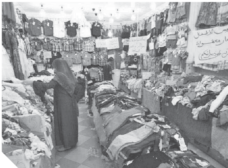
انخفاض الأسعار في ٢٠١٧ والوكالة عامل جذب للزبائن