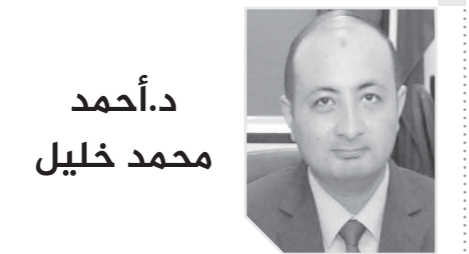
د.أحمد محمد خليل

حزب الوفد والدكتور على عبدالعال رئيس مجلس النواب وأعضاء المجلس والدكتور فتحى سرور رئيس مجلس الشعب الأسبق، ونجلا الرئيس الأسبق علاء جمال مبارك، والدكتور على مصطفى وزير التمثيل، والدكتور أشرف صبحي وزير الشباب والرياضة، والمستشار أحمد الزند وزير العدل الأسبق، والعميد شهاب الدين محمد وزير العدل الأسبق، والعميد حسان حسن مندوباً عن رئيس الجمهورية، وطاهر أبوزيد وزير الشباب الأسبق، واللواء محمود وجدي وزير الداخلية الأسبق، والمستشار محمود طاهر رئيس النادي الأهلي السابق، كما حضر العزاء نجوم الكرة حسن شحاتة وأمين يونس ومصطفى يونس ومصطفى عبده وعصام الحضري، ومن الإعلاميين وجدي زين