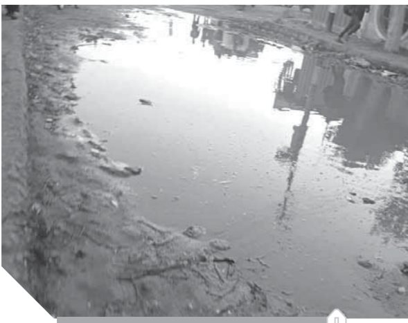
المجارى تغرق الشوارع