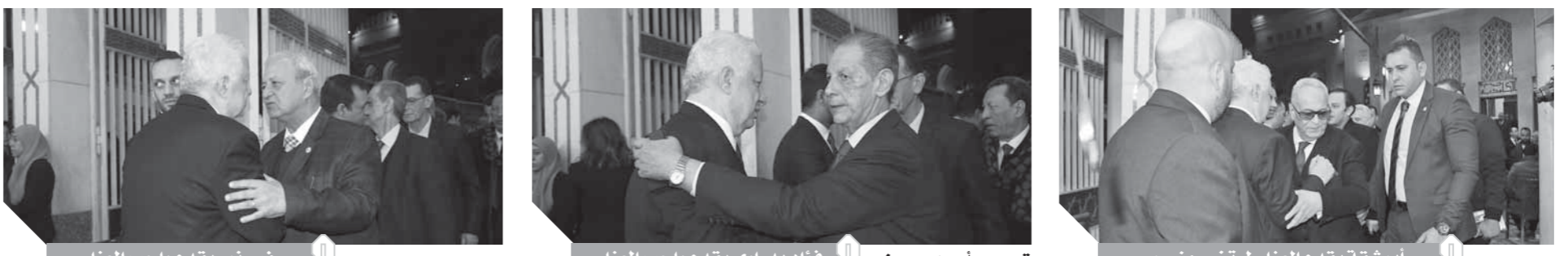
سفيرة ثور يقدم واجب العزاء