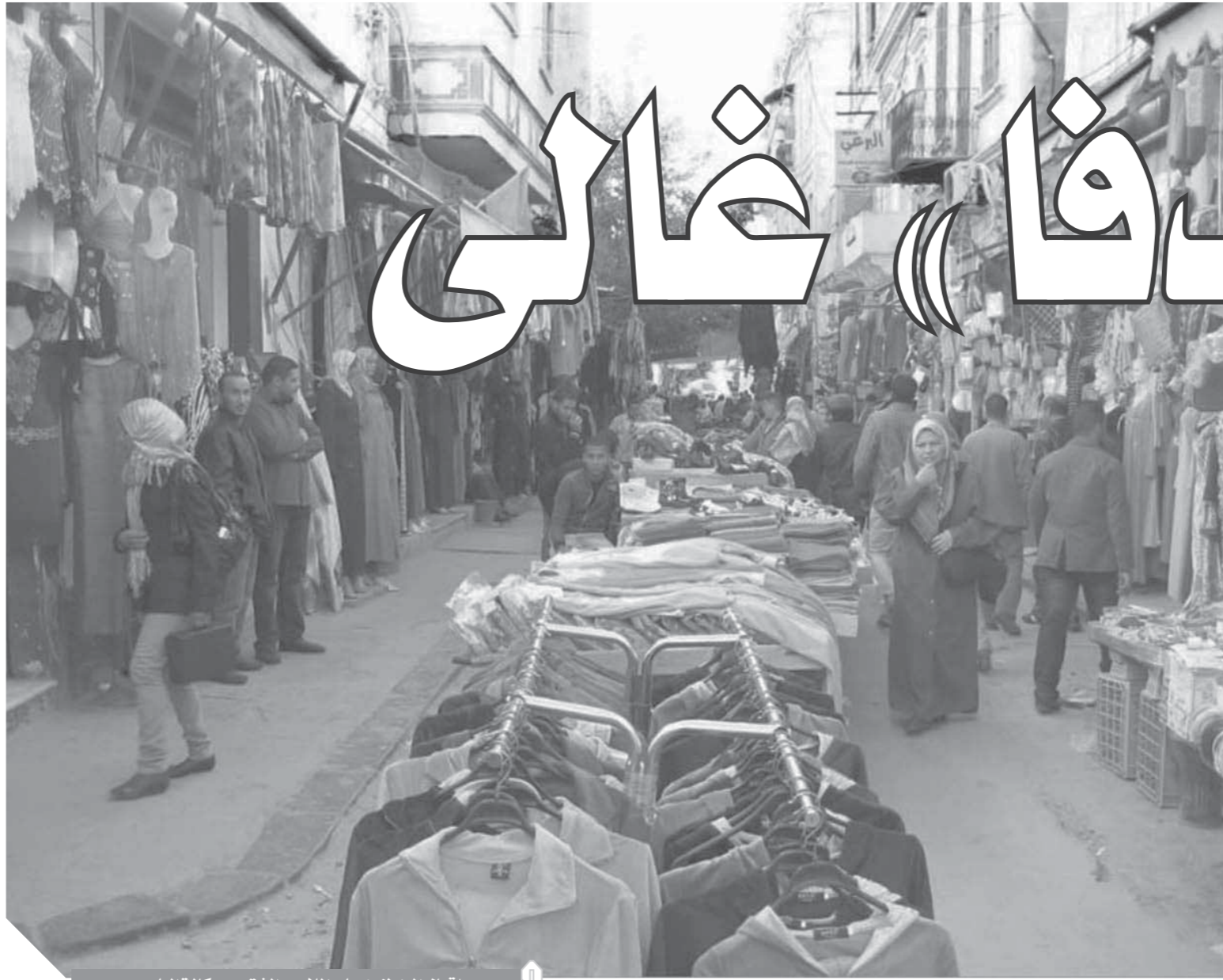
إقبال المواطنين على الملابس الشتوى بوكالة البيع