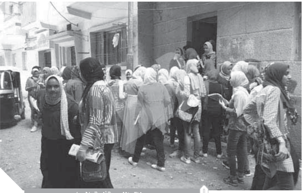
ساتر الغربية أزمة بلا حل