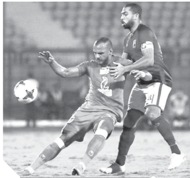
الأهلئ والاتحاد مواجهة تتسم دائما بالإنارة