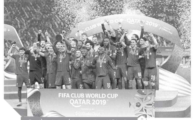
لحظة تتويج ليفربول بكأس العالم للأندية