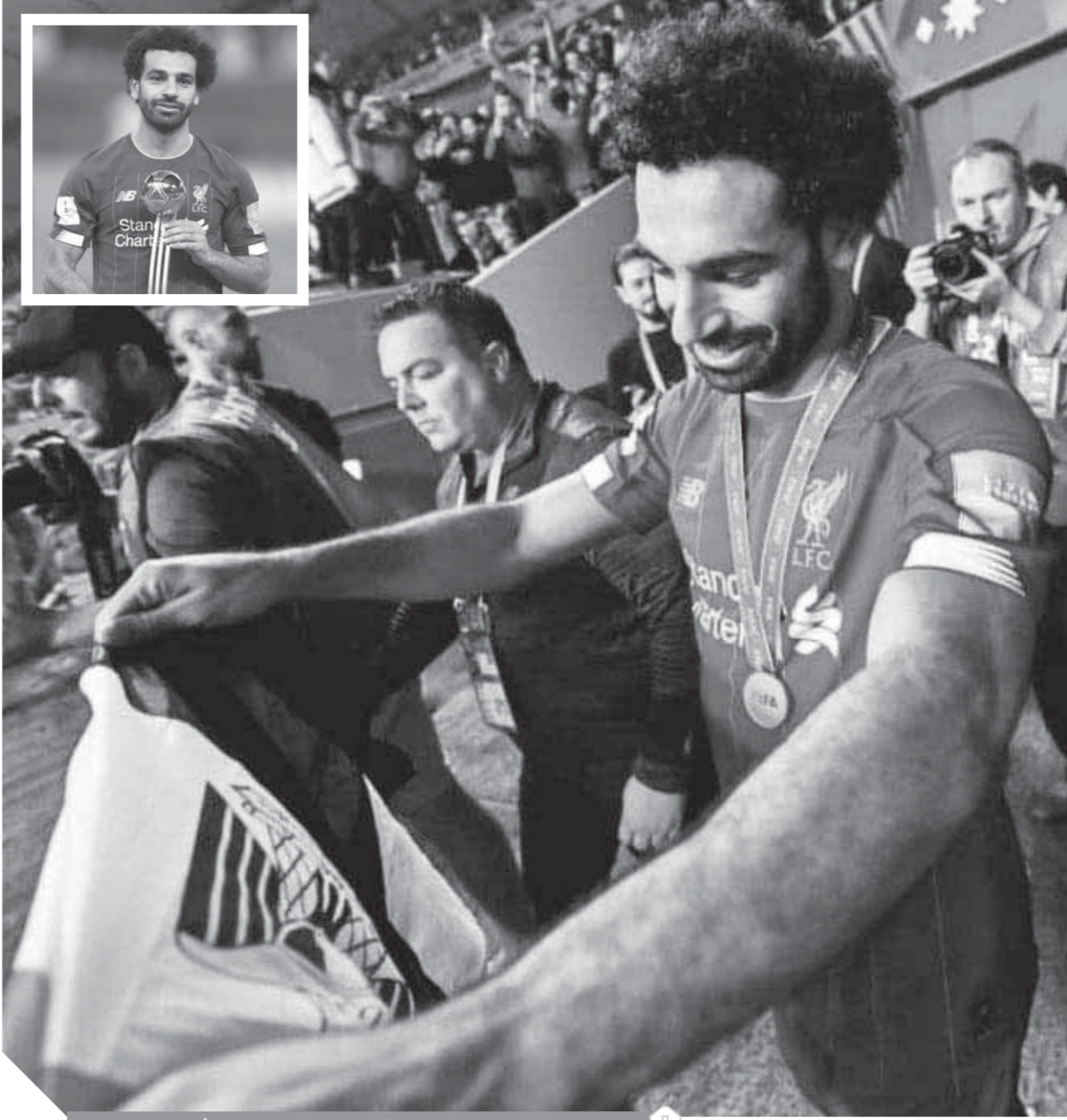
صلاح يحمل علم مصر فى قلب الدوحة بعد فوزه بأحسن لاعب

وقال: أتمنى العودة فى العام القادم للمشاركة بالبطولة ونحن أبطال أوروبا، وأيضاً مع المنتخب المصرى فى كأس العالم ٢٠٢٢. وقال صلاح أيضاً: نحتاج للدعم فى الفترة المقبلة من أجل الوصول لمونديال قطر. فنحن نبغى جيلاً جديداً وأنا شخصياً متفائل بالمجموعة المتواجدة حالياً.