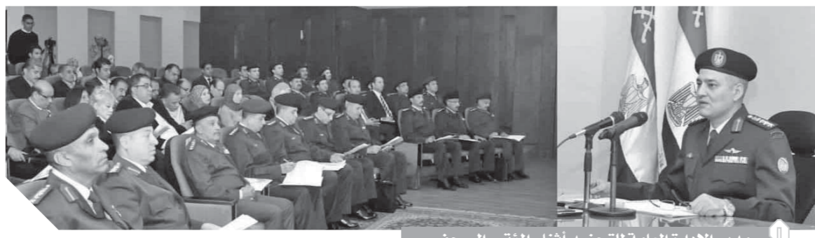
مدير الإدارة العامة للتجنيد أثناء المؤتمر الصحفي

صدق الفريق أول محمد زكي، القائد العام للقوات المسلحة وزير الدفاع والإنتاج الحربي، على الإعلان عن قبول دفعة جديدة من المجندين مرحلة أبريل ٢٠٢٠. أكد مدير إدارة التجنيد إن الدفعة تشمل أولاً المؤهلات العليا: مواليد الفترة من ١ يناير حتى ٣٠ يونيو من جميع السنوات حتى عام ١٩٩٩ من خريجي جميع الكليات والمعاهد العليا (حكومي / خاص) الحاصلين على مؤهلهم الدراسي والمعتمدة نتيجتهم خلال الفترة من أول أغسطس ٢٠١٩ حتى آخر يناير ٢٠٢٠، وخريجي كليات الطب (البشري/ الأسنان/ العلاج الطبيعي/ الطب البيطري/ التمريض) الذين أنهوا سنة الامتياز/ مدة التدريب خلال تلك الفترة، مواليد من ١ يناير إلى ٣٠ يونيو من عام ٢٠٠٠ خريجي العام الدراسي ٢٠١٨/٢٠١٩، والفترة من أول فبراير ٢٠١٩ إلى آخر يناير ٢٠٢٠، والمتخلفين من سنوات سابقة، على أن يتم استقباليهم بمكاتب التجنيد والتعبئة اعتباراً من ٢٠ يناير ٢٠٢٠ وتسجيلهم وإجراء الكشف الطبي عليهم بمناطق التجنيد اعتباراً من ٢٠-٣٠ فبراير ٢٠٢٠. ثانياً: المؤهلات المتوسطة: مواليد أشهر (أبريل/ مايو/ يونيو) من عام ٢٠٠٠ الحاصلين على مؤهل متوسط، ومواليد الأشهر الثلاثة من جميع السنوات حتى عام ١٩٩٩ خريجي العام الدراسي ٢٠١٨/٢٠١٩، والمتخلفين من سنوات سابقة على أن يتم استقباليهم بمكاتب التجنيد والتعبئة اعتباراً من ٢٥ ديسمبر ٢٠١٩، وتسجيلهم وإجراء الكشف الطبي عليهم بمناطق التجنيد اعتباراً من ٨ يناير حتى ٢ فبراير ٢٠٢٠. رابعاً: غير ذوى المؤهلات: مواليد أشهر (أبريل/ مايو/ يونيو) من عام ٢٠٠٠ والمتخلفين من سنوات سابقة، وسيتتم