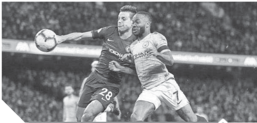
مواجهات تشيلسي والسيتي تتسم بالندية

تحت قيادة فرانك لامبارد المدير الفني للبلوز، حيث يقدم الفريق مستويات رائعة في الأسابيع الأخيرة، وفي نفس الجولة تطلق خمس مباريات في الخامسة مساء، حيث يلتقى أرسنال أمام