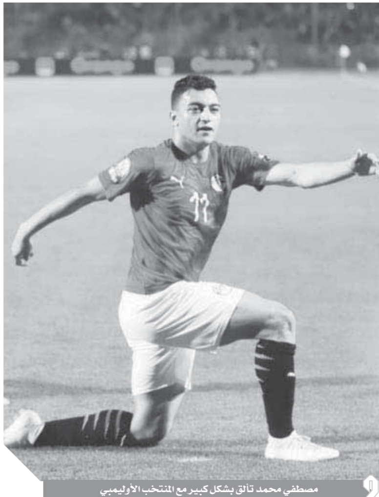
مصطفى محمد تآلق بشكل كبير مع المنتخب الأولمبى

مشيراً إلى أنه ينوي العمل على تحقيق أهدافه داخل الملعب، وسيحرص على عزله عن السليبيات لمساعدته على التآلق وتحقيق أحلامه.