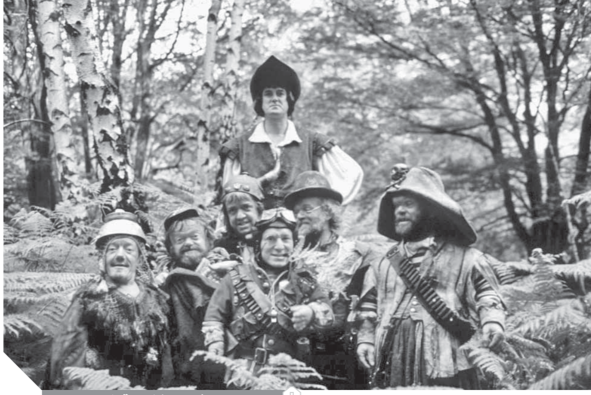
مشهد من فيلم ١٢ قردًا

كان الإصدار بالأساس مسلسلاً تليفزيونياً مقسماً إلى ثلاثة عشر فصلاً مدة كل منها ثلاثون دقيقة. وجاء تقسيم العمل إلى جزئين بمثابة نوع من الاستغلال التجاري. وأخرج الكندي آرثر هيلر للنسخة السينمائية رجل من لا مانتشا عام ١٩٧٢. ولعب الإيرلندي بيتر أوتول دور دون كيخوتي، فيما لعبت الإيطالية صوفيا لورين دور دولثينيا. وقدم الإصدار المسرحى من العمل بأكثر من خمسين لغة، ولعب الممثلان الإسبانيان خوسيه ساركيستيان