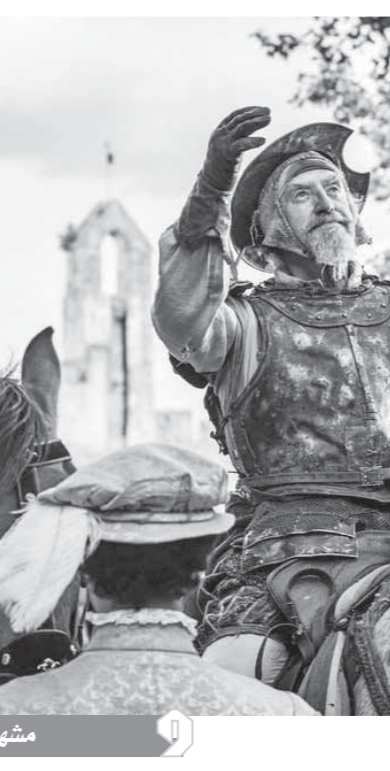
مشهد من فيلم دون كيشوت

ووضعت الرواية بجزيها الكاتب ميغيل دي ثيربانتس على خارطة تاريخ الأدب العالمى جنباً إلى جنب مع كل من دانتي وشكسبير. وفى عام ١٩٥٧، قامت الشركة المتحدة للإنتاج في أمريكا بالتعاقد مع الكاتب أندروس هكسلى ليكتب سيناريو قصة تستند إلى رواية الكيخوتى ومن بطولة مستر ماجو، من أشهر شخصيات الرسوم المتحركة. وفى عام ١٩٩٠، قامت المنتجة حنا باربريا بعمل سلسلة من الرسوم المتحركة لتقدمها فى التلفزيون، وتم تقسيمها إلى ست وعشرين حلقة، وكل حلقة مدتها ثلاثون دقيقة مستوحاة من الكيخوتى، وتحمل عنوان دون كيوتى وسانشو باندا. وكانت أول تجربة سينمائية من قبل المنتجة الفرنسية جومون عام ١٩٨٨ بعد معالجة رواية دون كيخوتى دي لا مانتشا، وتناولت مشهداً وجزياً تحت اسم دون كيخوتى. وقامت المنتجة الفرنسية بإنتاج مغامرات دون كيخوتى دي لا مانتشا، وأخرجها وكتبه جيليام وتونى جريسون، وأنتج بعد عدة مرات على مدار ٢٩ عامًا، حتى وصف بلندن دون كيخوتى» لأن غالبية المخرجين السينمائيين الذين سعوا إلى صنع أفلام مستمدة بشكل مباشر من هذه الرواية لم يكونوا قادرين على إنجازها لأسباب عديدة جعلت الكثيرين منهم يتجنبون بكل الطوق الدخول في مغامرة من هذا القبيل.