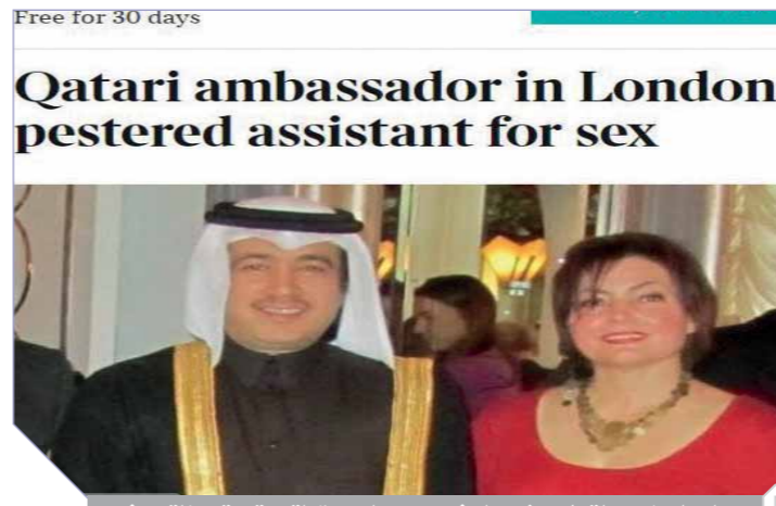
الدبلوماسى القطرى فهد المشيرى مع السيدة التى اتهمته بالتحرش

وقالت صحيفة «التايمز» البريطانية إن الدبلوماسى القطرى فهد المشيرى حاول الضغط على سيدة بريطانية فى الخمسينيات من عمرها لممارسة الجنس معه، لكنها رفضت، ما دفعه إلى اللجوء إلى حيلة أخرى لتحقيق ما يريد، عندما طلب أن يتزوج ابنتها البالغة من العمر ١٩ عاماً. وأشارت الصحيفة، فى تقرير نشرته أمس الجمعة، إلى أن وقائع تلك