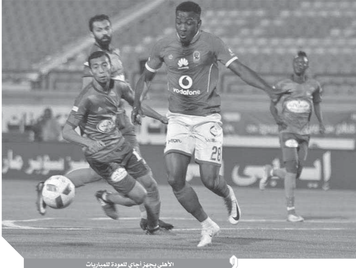
الأهلى يجهز أجاى للعودة للمباريات

وعلى صعيد آخر، تلقى النادي الأهلى موافقة رسمية من الجهات الأمنية بإقامة مباريات الفريق باستاد القاهرة ببطولتي الدوري والكأس واللقاءات المحلية، بينما يلعب اللقاءات الإفريقية باستاد السلام.