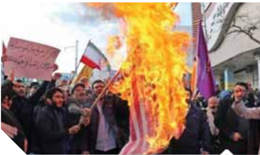
المظاهرات أشعلت الشارع الإيراني