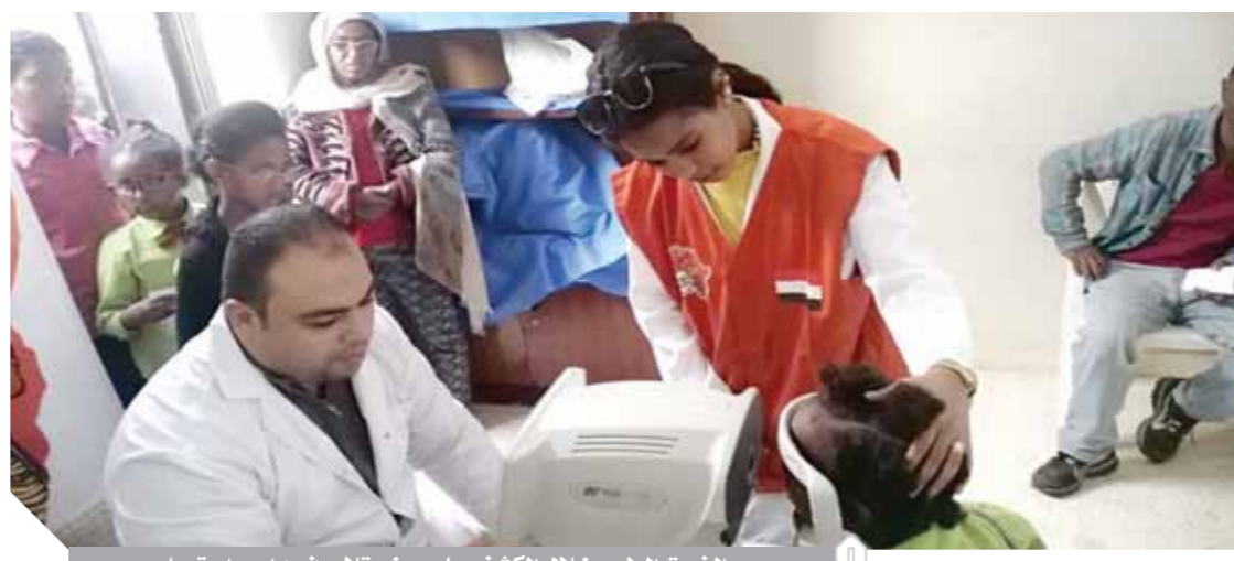
الفريق الطبي خلال الكشف على بعض تلاميذ مدارس إريتريا

وأضاف أنه تم تحويل ٦١٠ حالات للمركز الطبي المصرى من أجل صرف نظارات طبية، ومن المقرر أن تستمر القافلة أسبوعاً من أجل فحص الطلاب والشباب وإعداد النظارات لأئفى مواطن إريتري، ويجوب الفريق المصرى سائر المدارس فى إريتريا من أجل فحص العيون وتحويل المصابين بضعف البصر للمركز الرئيسى بهدف متابعة حالاتهم.