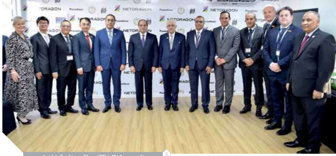
السياسي خلال افتتاح مؤتمر إفريقيا ٢٠١٩.

التنمية في القارة الإفريقية ليست مسؤولية الحكومات وحدها وتتطلب مشاركة القطاع الخاص