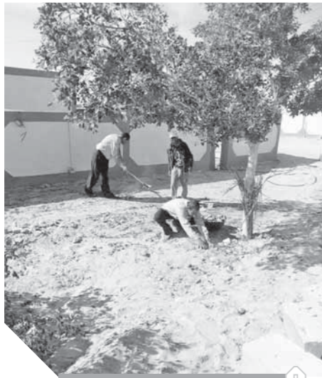
تطوير وتشجير في أماكن عديدة

لإنشاء ورفع كفاءة منازل القرية إلى جانب رفع كفاءة شبكتي الطرق الداخلية والمياه في القرية، وإنشاء تجمع زراعي وآخر خدمي. ومن المقرر وفق بيان تصريحات صحفية لمحافظة شمال سيناء اللواء عبدالفضيل شوشة، يشارك في إحياء ذكرى مسجد قرية الروضة فضيلة الإمام الأكبر الدكتور أحمد الطيب شيخ الأزهر الشريف والدكتور محمد مختار جمعة وزير الأوقاف والدكتور أشرف صبحي وزير الشباب والرياضة والعديد من القيادات الامنية والشعبية والتنفيذية والشعبية وأعضاء مجلس النواب ووفد من القيادات العربية بجانب أهالي القرية الذين أعلنوا استعدادهم لاستقبال الضيوف الزائرين من مختلف