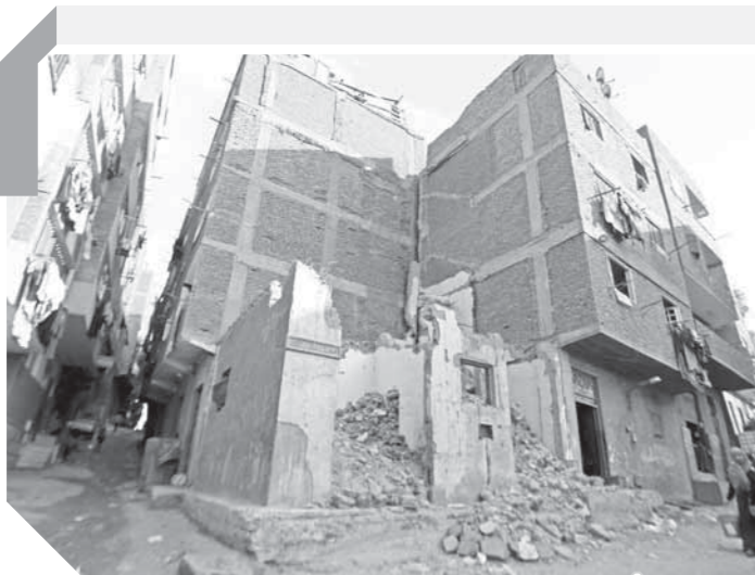
آثار التصعد تظهر على المنازل

وأكد شيوخ القبائل، أن إحياء ذكرى الروضة يعث برسالة واضحة للجميع وللجماعات المتطرفة للتأكيد على قوة وصلابة المجتمع المصري ورفضه لكل أشكال العنف والتطرف والقتل باسم الدين ونشر الأفكار المغلوطة، ورسالة أخرى ترسخ لقيم التسامح والتعايش السلمي بين الجميع. وتشهد القرية أعمال التطوير والنظافة والتجميل للطرق والإنارة في كافة شوارع ورفع كفاءة المنازل، كما تشهد القرية تشديدات أمنية موسعة لتأمين ذكرى إحياء يوم المجزرة وقيادات أمنية رفيعة المستوى تشرف على عمليات التأمين لحيط القرية ومسارات الطرق المؤدية إليها.