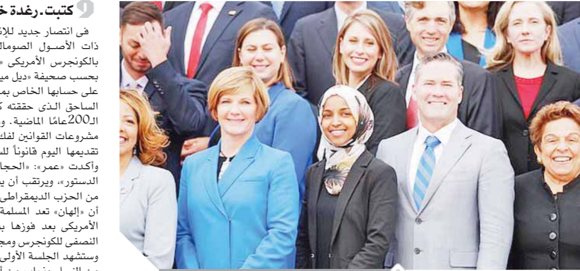
انتخاب أول امرأة صومالية مسلمة محجبة بالكونجرس

في انتصار جديد للإنسانية والديمقراطية، حضرت السيناتور الأمريكية ذات الأصول الصومالية، وأول امرأة مسلمة محجبة تنتخب عضواً بالكونجرس الأمريكي «إلهان عمر»، أولى الجلسات التمهيدية للمجلس، بحسب صحيفة «ديلي ميل» البريطانية، وأعدت «عمر» عبر تغريدة نشرتها على حسابها الخاص بموقع التديون المصغر «تويتر» عن سعادتها بالانتصار الساحق الذي حققته كأول امرأة محجبة تدخل قبة الكونجرس خلال 200 عاماً الماضية. ووعدت إلهان، ذات الـ36 عاماً، بتقديم المزيد من مشروعات القوانين لفك القيود عن المسلمين داخل الولايات المتحدة، بعد تقديمها اليوم قانوناً للسماح بإرتداء الحجاب خلال جلسات الكونجرس. وأكدت «عمر»: «الحجاب اختياري، وهو خيار يحجمه التعديل الأول في الدستور»، ويرتقب أن يصادق مجلس النواب الأمريكى الذي باتت أغلبيته من الحزب الديمقراطي على هذا التعديل في يناير المقبل. الجدير بالذكر أن «إلهان» تعد المسلمة المحجبة الأولى التي تطل قدمها مجلس النواب الأمريكى بعد فوزها بمقعد ولاية «مينسوتا» خلال انتخابات التجديد النصفي للكونجرس ومجلس الشيوخ التي جرت مطلع شهر نوفمبر الجاري، وستشهد الجلسة الأولى من الدورة البرلمانية الجديدة مشاركة عدد قياسي من النساء ونواب من أقبليات لاثينية الأصل أو من السكان الأصليين أو الأمريكيين المتحدرين من أصول أفريقية ومن مثلي الجنس.