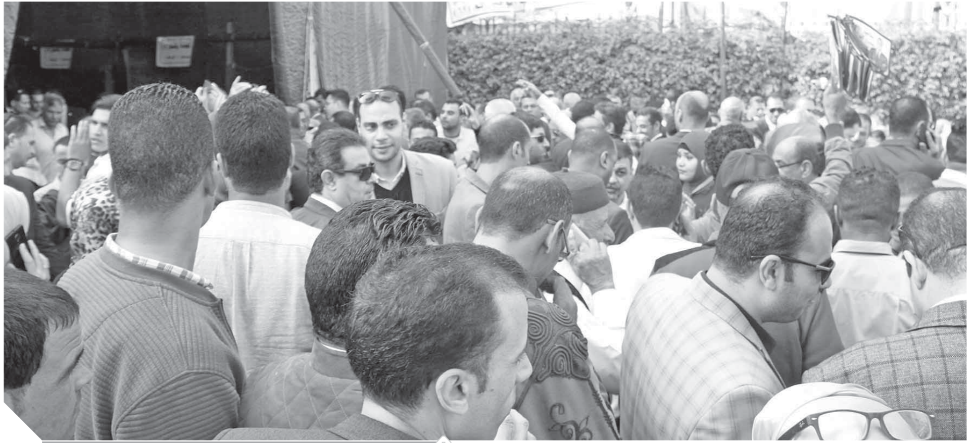
جانب من أعضاء الهيئة الوفدية خلال الانتخابات الأخيرة

«أبو شقة» حكم بين جميع الوفديين ويقف على مسافة واحدة وليس له قائمة أو شلة