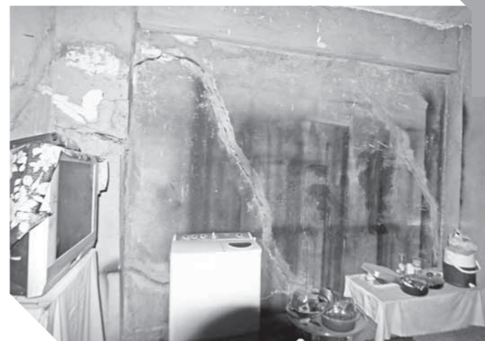
التشققات تصرب الجدران