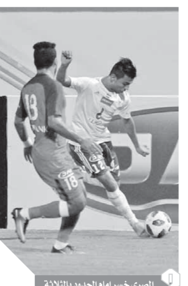
المصري خسرا امام الحدود بثلاثه