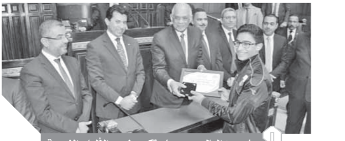
علي عبدالعال حرص على تكريم نجوم الألعاب الفردية

بوينس آيرس بالارجنتين، ومنهم أبطال الخماسي الحديث والجمباز والريشة الطائرة، وذلك بحضور رئيس البعثة محمد عبدالعزيز غنيم وبحضور شريف العريان رئيس الاتحاد المصري للخماسي الحديث.