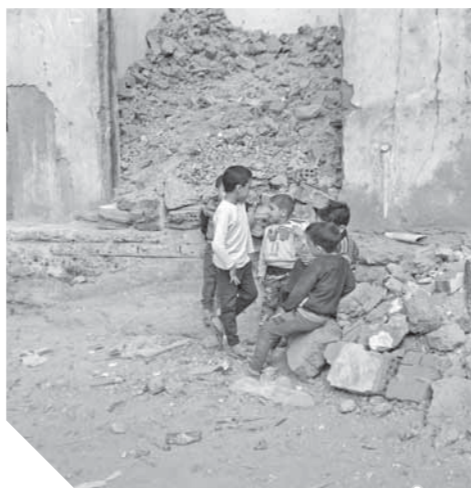
الأطفال يواهبون خطر الموت