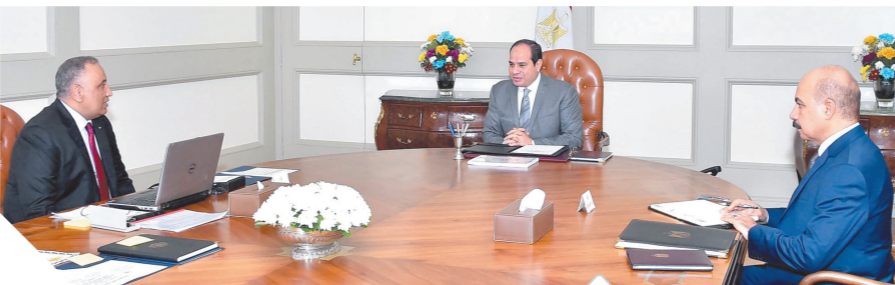
الرئيس خلال اجتماعه أمس مع رئيس هيئة الرقابة الإدارية

عقد الرئيس عبدالفتاح السيسي اجتماعاً مهماً مع اللواء شريف سيف الدين رئيس هيئة الرقابة الإدارية، وصرح السفير بسام راضي، المتحدث الرسمي باسم رئاسة الجمهورية، بأن الاجتماع تناول متابعة تطورات عدد من الملفات ذات الأولوية على جدول أعمال الحكومة على مستوى مختلف الوزارات والمحافظات، والمرتبطة بصورة مباشرة بتحسين المستوى المعيشي للمواطنين والخدمات المقدمة لهم؛ ولا سيما الموقف التنفيذي لمبادرات المسح الطبي للكشف عن فيروس سي، وكذا إنهاء فوائض الانتظار لمرضى الجراحات والتدخلات الطبية الحرجة، فضلاً عن تطوير منظومتى الضرائب والجمارك، بالإضافة إلى عدد من مشروعات