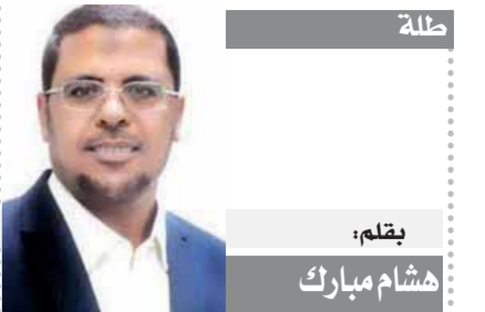
بِقلم: هشام مبارك