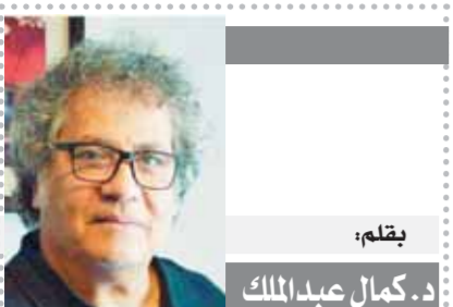
بِقلم: د. كمال عبد الملك