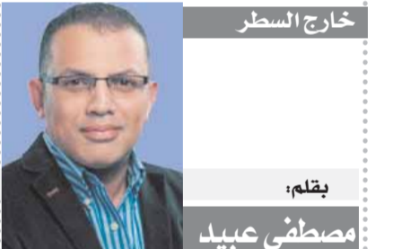
بِقلم: مصطفى عبيد