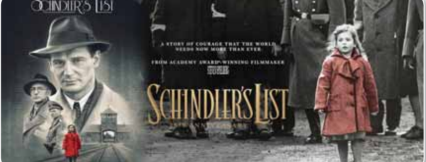
أفيش فيلم «قائمة شندلر» للمخرج الأمريكي ستيفين سيبيلبرج

ويحسب ما ذكره المؤرخون وتحديداً في المرجع الأجنبي «made of minds» ذكر المؤرخ التونسي الدكتور الصغير مع الباحث الدكتور منى زيادة حول «حقيقة وقوع مأساة الهولوكوست وبأنها ليس محل جدال»، ويعتقد الدكتور زياد أن المآسي والمصائب التي حلت بالعرب إبان فترة الحرب العالمية جعلتهم منشغلين عما يحل بغيرهم من الأسم، وأضاف أن «العرب كانوا يعتبرون الهولوكوست موضوعاً يهم تاريخ أوروبا»، مشيراً في هذا الصدد بأن «تاريخ أوروبا مختلف عن العالم العربي، حيث كانت معاملة اليهود جيدة بل إن اليهود الفارين من الاضطهاد الأوروبى سواء النازية أو حكومة فيشي الفرنسية في بداية الأربعينات، قد تم احتضانهم في بلدان المغرب العربي والدولة العثمانية»، كما أن عدداً من قادة الحركة الوطنية والنخب السياسية والدينية في بلدان المغرب العربي، أبداوا اهتماماً ووعياً مبكراً بالاضطهاد الذي تعرض له اليهود، مشيراً في هذا الصدد إلى الإعجاب الشديد لسلطان المغرب الملك محمد الخامس عام ١٩٤١ بأنه «حامي العرب المسلمين» ضد ملاحقتهم من قبل النازية، وهو نفس الموقف الذي اتخذته ملك تونس العثمانية المنصف باى عام ١٩٤٢ إبان غزو القوات الألمانية لتونس وبدأت بمضايقة اليهود وترحيل بعضهم إلى ألمانيا، كما وجه الحبيب بورقيبة زعيم الحركة