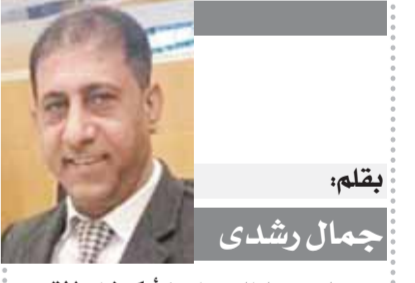
بقلم: جمال رشدي الصراع العالمي ما بين أوكرانيا وغزة

المؤتمر الصهيوني الأول للمنظمة الصهيونية، عقد بزعامة تيودور هرتزل في مدينة بازل بسويسرا عام ١٨٩٧، كان من أهم نتائجه إقامة وطن قومي لليهود في فلسطين، ومنذ ذلك التاريخ دخلت الصهيونية للحكم في القرار العالمي عن طريق نهج صهيوني للأرسالية ومشتقاتها الاقتصادية والسياسية المتمثلة في نظريات الحريات والديمقراطيات وما نتج عن ذلك من عولمة أدت في النهاية إلى نشأة تلك الصهيونية وكل مخططاتها العالمية عبر شبكة الإنترنت، الكونية، وأصبح إزاحتها عن حكم العالم أمة، فما يستحيل، ولكن بما أن يحصل أبو العلا على العزبة، من يلقى به في حجر ببعيد المنعم، ويذكر ببعيد المنعم أيضاً عن الأجهزة الأمنية التي كانت على شرطها في استئجاب لها بالطريقة التي أتت إياها، فلم تكن الأجهزة الأمنية بإعلانه أنه يختلف عن الجماعة أو مع ببعيد المنعم، بل كانت تريد أن يعلن الحرب عليهم جميعاً، وللحديث بقية.