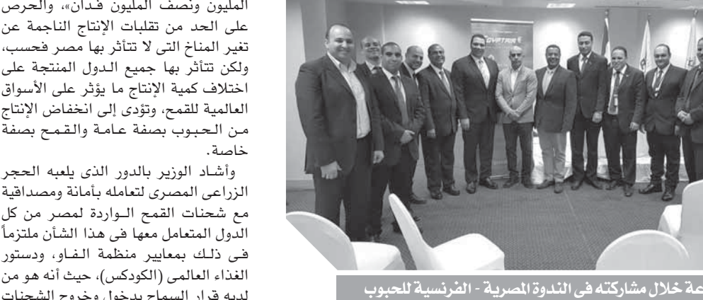
وزير الزراعة خلال مشاركته في الندوة الفرنسية للحبوب

خلال زيادة معدلات الاكتفاء الذاتي، من خلال تخصيص مساحات كبيرة لزراعة القمح في المشروع المعلق «استصلاح