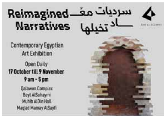
We are happy to announce our support to Art d'Egypte's next exhibition