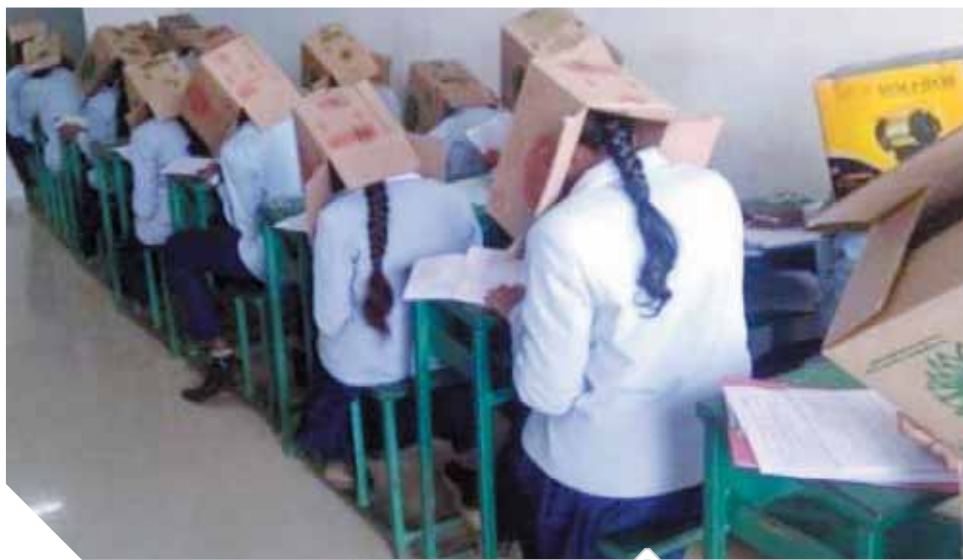
الطلاب يرتدون الصناديق على رؤوسهم خلال الامتحانات

أثارت إحدى الكليات الخاصة في ولاية كارناتاكا الهندية جدلاً واسعاً على مواقع التواصل الاجتماعي، بعد ظهور الطلاب أثناء أدائهم لامتحان الكيمياء وهم يرتدون على رؤوسهم صناديق من الورق المقوى. وهرع المسؤولون الإقليميون في ولاية كارناتاكا إلى كلية بهاعات التمهيدية للجامعة للشكوى من المعاملة «الإنسانية» للطلاب. وأوضح مسئولون في كلية بهاعات أنهم أجروا التجربة لمنع الغش، فيما أشاروا إلى أن الطلاب أعطوا موافقتهم، وحتى أحضروا صناديقهم الخاصة. وقال مدير الكلية، إم بي ساتيش، إن «التجربة كانت اختيارية، وبعض الطلاب جربوها وبعضهم لم يفعل ذلك». وأضاف: «تدبيرنا هي لتحسين حياة الطلاب (...). تم اتخاذ التدابير كتجربة وتلقينا ردود فعل إيجابية وسلبية». وأشار مدير الكلية إلى أن بعض الطلاب لم يرتدوا الصناديق على رؤوسهم، مشيراً إلى أن أعضاء هيئة التدريس طلبوا من جميع الطلاب خلع الصناديق بعد ساعة من بدء الامتحان. وأوضحت الكلية أنها أجرت التجربة الغربية بعد استخدامها في ولاية بيهار الهندية، حيث تمت الإشادة بها باعتبارها عبقرية، فيما تم استخدام الطريقة نفسها الشهر الماضي بـمدرسة ثانوية في المكسيك. من جانبه، أعلن وزير التعليم في الولاية الهندية، سوريش كومار، أن «ما حدث غير مقبول على الإطلاق. لا أحد لديه الحق في معاملة أي من الطلاب مثل