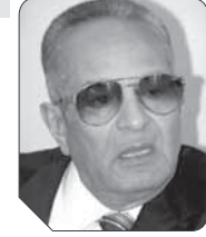
بهاء الدين أبوشققة