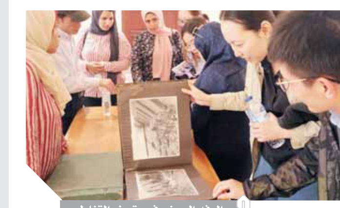
الوفد الصينى فى متحف القناطر

وترصد الإبداع المصري العظيم الذي تحكم في مياه النيل، وروى النهر الخالد للاستفادة منه بصفتها شريان الحياة الوحيد لمصر.