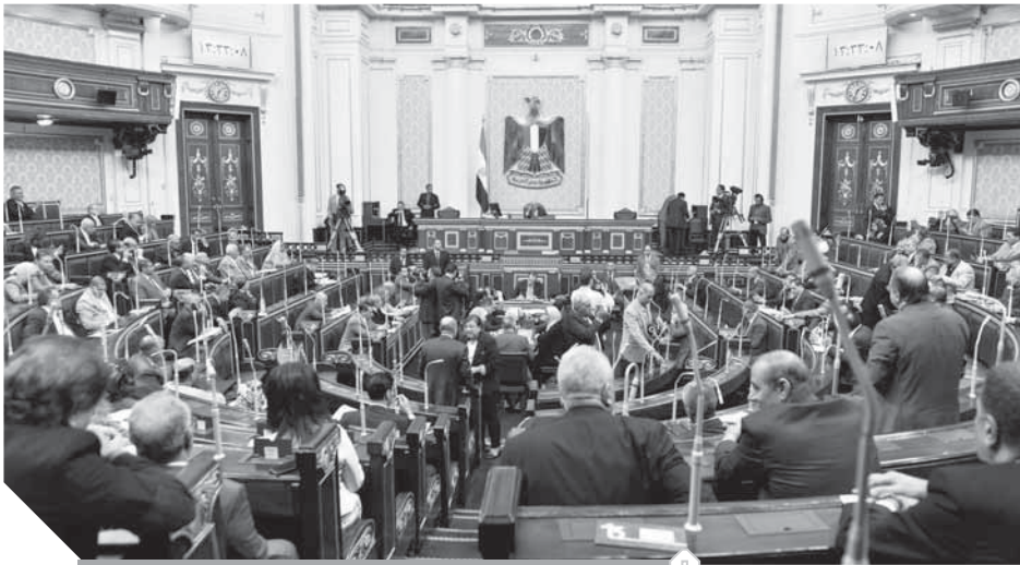
جانب من جلسة البرلمان أمس