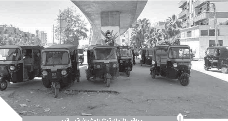
مواقف التوك توك العشوائية بـ قوص

شكا أهالى مدينة قوص بقنا، عشوائية سير التوك توك بطرق المدينة والقرى وفرضهم تعريفه ركوب على أروانهم، لاسيما فى ظل غياب الرقابة الصارمة من قبل إدارة المواقف ومجلس المدينة والمرور، وتجاهلهم فرض تعريفه ركوب على تلك الوسيلة التى تسبب الفوضى وتزيد من أعباء الأهالى. وبين المواطنين، أن وسيلة التوك توك انتشرت بشكل كبير فى الأونة الأخيرة، ما تسبب فى ازدياد مناطق عديدة خاصة شوارع المدينة، وتمتل خطورة على المواطنين فى ظل قيادة أطفال لها وعدم التزامهم بقواعد السير والمرور. وطالب الأهالى المسؤولين بتحديد خطوط سير للتوك توك ووضع تعريفه محددة لتلك الخطوط حتى لا يستغل أصحاب التاك التوك المواطنين خاصة فى فترات الظهيرة والليل ويفرضوا عليهم إجراء تزيد عن المستحقة بأضعاف.