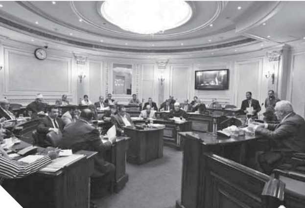
جانب من اجتماع اللجنة الشئون الدينية

النواب لتحديد صرف أموال الوقت وفقا لما أقره الواقفون. وأضاف الوزير، أن الأوقاف وقعت بروتوكول تعاون مع وزارة التضامن الاجتماعي يتم بمقتضاه منح وزارة الأوقاف ٢٠٠ مليون جنيه لصرفها على الأوصاف الأكثر فقراً، والأولى بالرعاية، وفقاً لما هو مدرج بالوزارة. وكشف الوزير عن قيام الوزارة بتأثيث ١٠٠٠ منزل في القرى الأكثر فقراً بمبلغ ٢٠٠ مليون جنيه، كما تم تخصيص ٢٠٠ مليون جنيه في بناء المدارس بالقرى الأولى بالرعاية.