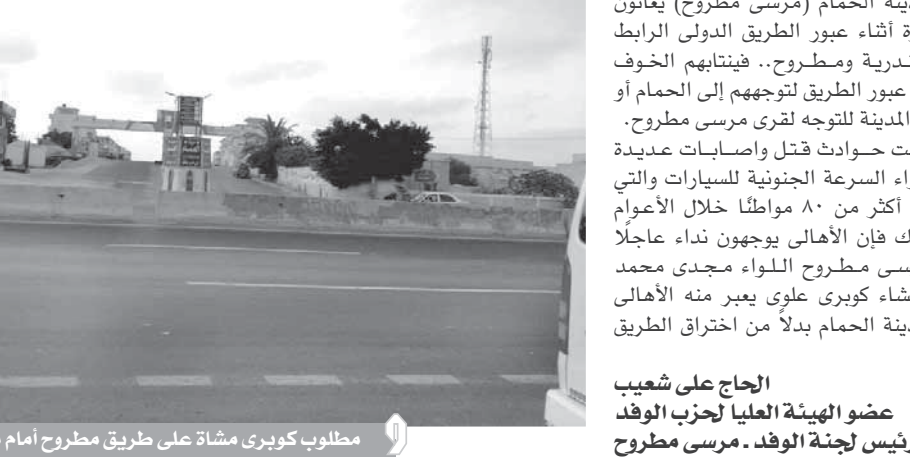
مطلوب كوبرى مشاة على طريق مطروح أمام مدينة الجمام