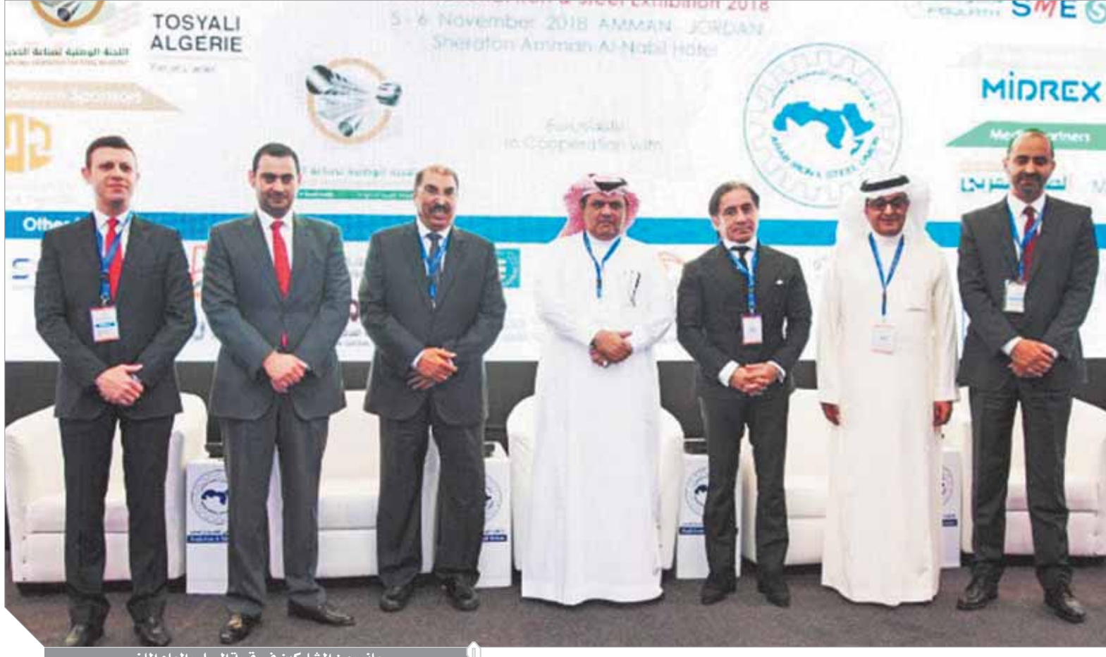
جانب من المشاركين في قمة الصلب العام الماضي

البلد الذي سيتضيف قمة الصلب خلال الأيام القليلة القادمة. يذكر أن قمة الصلب العربي يقام على هامشها، تنظيم معرض الصلب العربي والذي تعرض فيه العديد من الشركات أحدث منتجاتها من تشكيلات صناعة الصلب وأحدث التقنيات والتكنولوجيا المستخدمة في الصناعة، خاصة أن صناعة الصلب تعد المحرك الأساسي للعديد من الصناعات الأخرى، مثل التشييد والبناء والصناعات الثقيلة كصناعة الطائرات والسيارات والصناعات الهندسية والميكانيكية. يأتي انعقاد قمة الصلب وسط متغيرات كبيرة تشهدها الصناعة مثل السياسات الحثائية التي قامت برفضها بعض الدول الصناعية الكبرى لاسيما الولايات المتحدة الأمريكية ومعها بعض البلدان الأوربية بجانب الاضطرابات السياسية في بعض الأسواق، والتي تؤثر سلباً على الحصص السوقية للشركات المنتجة وارتفاع الأسعار. كان صناع الصلب العرب قد أطلقوا على العام الماضي ٢٠١٨ عام صناعة الصلب ولتكمهم عازمون في القمة القادمة والتي ستقام في بيروت على استكمال وضع الحلول للعراقيل التي تعترض لها الصناعة في الأونة الأخيرة وفي مقدمة هذه العراقيل سياسات الإغراق التي تمارسها بعض الدول المنتجة ضد أسواق المنطقة العربية ومنها مصر. يذكر أن عدداً كبيراً من الشركات المصرية الكبيرة ستشارك في قمة الصلب العربي ومنها مجموعة عز، بشاي، السويس للصلب، المراكبي، الجارحي، الثعري، العلاء، الحديد والصلب المصرية، وغيرها.