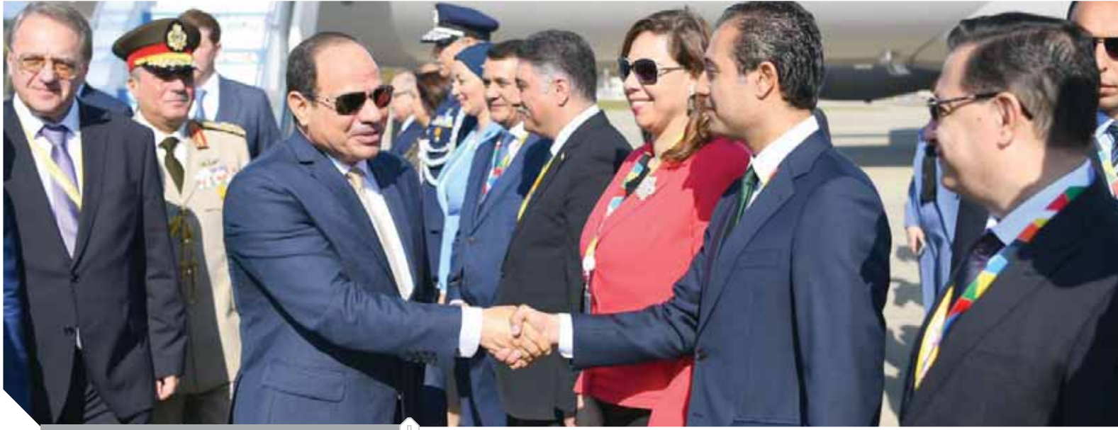
استقبال حافظ للرئيس في روسيا

الإفريقية، إلى جانب مشاركته في إطلاق المنتدى الاقتصادي الإفريقي الروسي، الذي سيركز على عدد من المحاور لتنمية التعاون التجاري والعلاقات الاقتصادية بين روسيا الاتحادية ودول القارة الإفريقية بحضور الزعماء الأفارقة ومجتمع رجال الأعمال والمستثمرين من الجانبين. وأوضح السفير بسام راضي، المتحدث الرسمي لرئاسة الجمهورية، أن القمة الإفريقية الروسية، التي هي الأولى من نوعها، ستضمن جلستين عامتين، وسيصدر عنها إعلان ختامي، يهدف إلى دعم وتعميق العلاقات المتميزة والتاريخية بين القارة الإفريقية وروسيا، بالإضافة إلى تعزيز التشاور بين الجانبين حول كيفية التصدي للتحديات المشتركة.