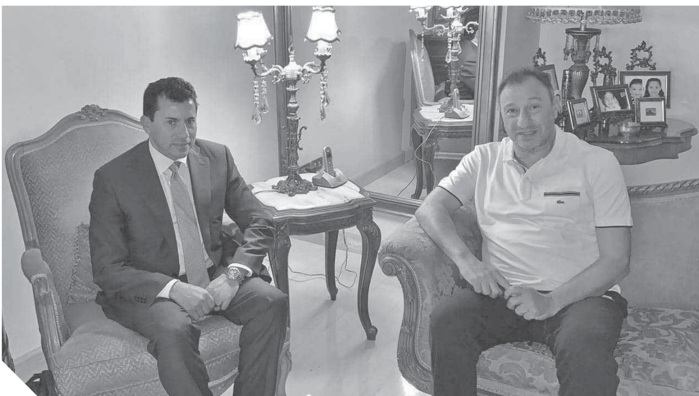
وزير الرياضة في جلسته مع الخطيب