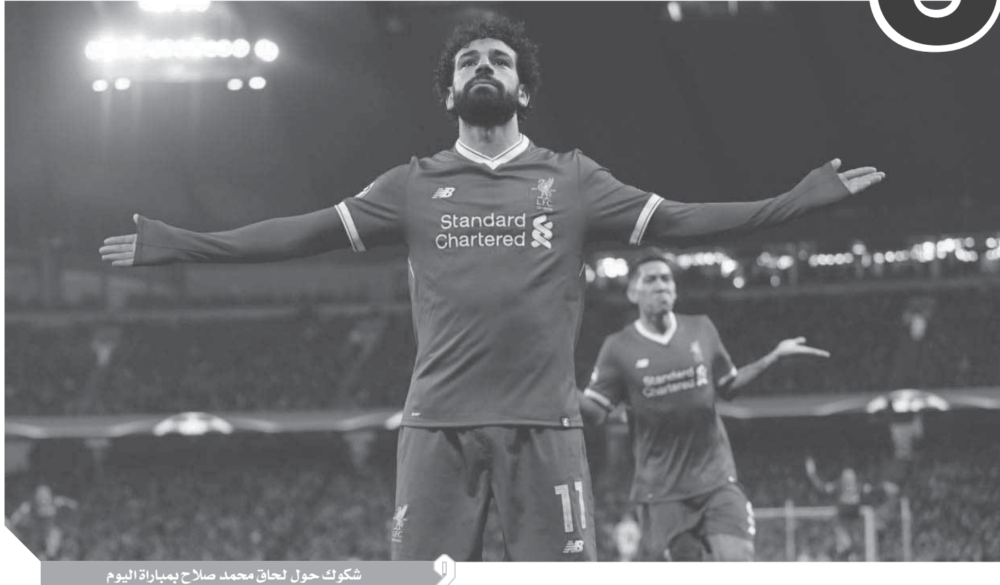
شكوك حول لحاق محمد صلاح بمباراة اليوم