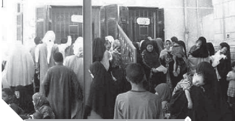
استياء الأهالى من مستشفيات الفيوم

الإهمال الطبي فى مستشفيات الفيوم لا حدود له، المرضى لا يجدون أدوية، والمستلزمات الطبية يشترونها على نفقتهم غالباً، والمعاملة من الأطقم الطبية أقل ما توصف به أنها سيئة، والزحام فى العيادات الخارجية يجعل الحصول على الخدمة الطبية حلماً بعيد المنال مع تأخر الأطباء فى الحضور لعملهم، ناهيك عن قلة الأسرّة فى وحدات العناية المركزة والإهمال بها. أما أقسام الأشعة فى المستشفيات فهى شبه معطلة ويضطر المرضى إلى إجرائها فى المراكز الخاصة، وتادراً ما يجد أهالى الأطفال أسرة فى المستشفيات بالمحافظة ويذهبون بأطفالهم إلى المستشفيات الخاصة. مستشفى الفيوم العام يتعرض لضغط