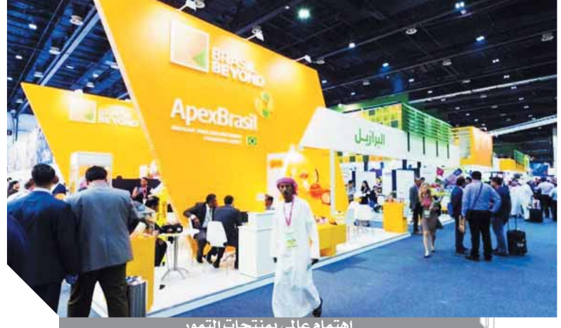
اهتمام عالمي بمنتجات التمور