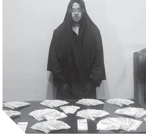
كتب - محمد التهامي

لجأ عامل إلى حيلة شيطانية للخروج من أزمته المالية، تخفى في شكل سيدة وارتدى النقاب وقام بسرقة ٣٣ ألف دولار و١٠٠ ألف جنيه من شركة يعمل بها في الموسكى، تم ضبط المتهم بعد أن اشتبهت فيه قوة أمنية من مباحث شرطة الموسكى، وبمواجهته اعترف بأن ما بداخل الحقيبة التي يحملها من أموال تخص الشركة التي يعمل بها، مبرراً فعلته بمروره بضائقة مالية. وقال المتهم: إنه اصطنع نسخة من مفتاح مكتب رئيس الشركة واستغل عدم وجود أي عامل، واقتحم المكتب بالزى النسائي وسرق الخزينة.