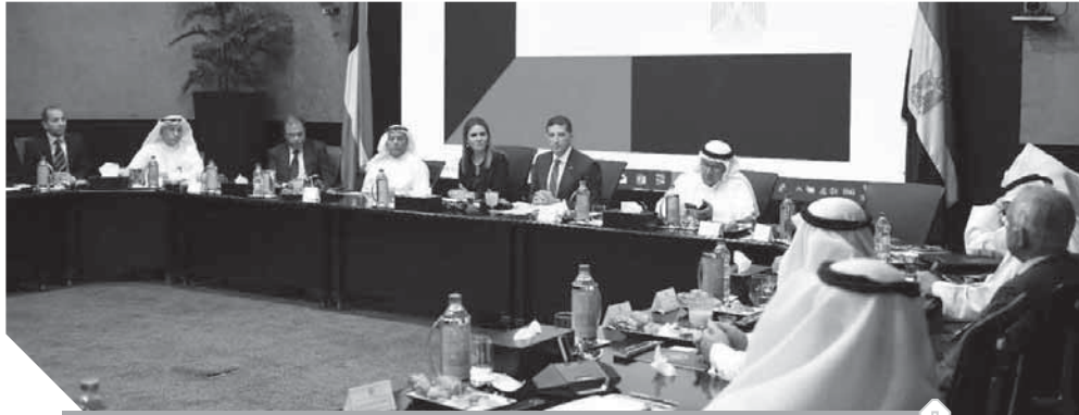
لقاء وزيرة الاستثمار مع وفد المستثمرين الكويتيين

ودعت وزيرة، الوفد الكويتي لحضور منتدى إفريقيا ٢٠١٩، مصر، سواء في الجانب التنفيذي أو الجانب التشريعي، مشيراً إلى أن البنك استثمر في مصر نحو مليار دولار، منذ دخوله السوق المصري في عام ٢٠٠٧، حيث تم إعادة استثمار كل أرباح البنك في السوق المصري بسبب بيئة الاستثمار الجديدة والمعائد المرتفع للاستثمار، ليصبح عدد فروع البنك ٥٠ فرعاً، يعمل بها ١٦٠٠ موظف.