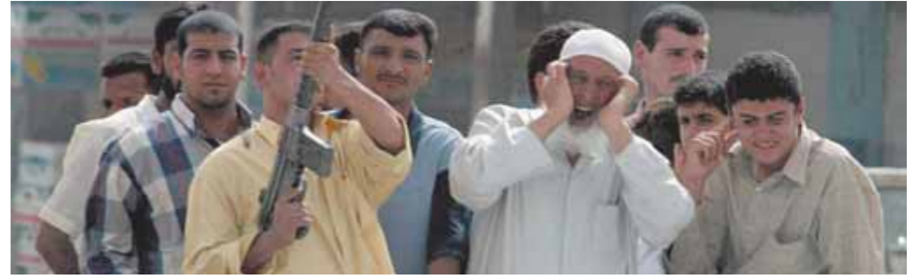
لمزيد من الأخبار والتقارير المصورة ALWAFD.NEWS