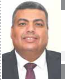
بقلم: محمد فؤاد