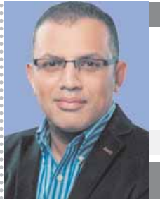
بقلم: مصطفى عبيد

وأدعو شباب مصر جميعاً وشباب الوفد خاصة إلى الاقتداء بالزعماء الثلاثة والسير على خطاهم والتمسك بالمبادئ التي رسخوها والتلاحم مع المواطنين في الشارع المصري ونقل مشكلاتهم إلى المسؤولين للعمل على حلها، وتكريس جهودهم لخدمة البسطاء والمحتاجين، ومساعدة الدولة في البناء والتنمية، حتى يشعر المصريون أن الوفد كان وما زال وسيظل هو ضمير الأمة ونبض الشارع المصري.