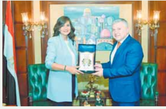
السفير الأرميني بالقاهرة كارين كريكوريان تتسلم درع التكريم من وزيرة الدولة للهجرة وشؤون المصريين بالخارج، نبيلة مكرم.

كرمت السفارة نبيلة مكرم، وزيرة الدولة للهجرة وشؤون المصريين بالخارج، كارين كريكوريان سفير أرمينيا بالقاهرة، ومنحته درع التكريم بالتزامن مع انتهاء فترة توليه منصبه. قالت السفارة نبيلة مكرم: إن المصريين الأرمن جزء لا يتجزأ من النسيج الوطني المصري ولعبوا