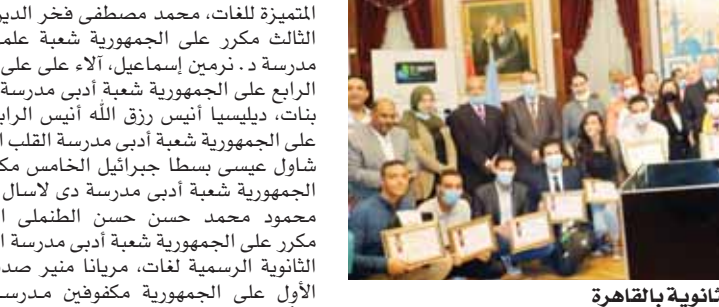
حفل تكريم أوائل الثانوية بالقاهرة

كرمت محافظة القاهرة أوائل الثانوية من أبناء المحافظة وذلك في الحفل الذي أقامته المحافظة بالتنسيق مع مديرية التربية والتعليم، حيث شملت الاحتفالية توزيع شهادات تقدير وهواتف محمولة ودروع تكريم لكافة الطلبة الأوائل تكريماً لهم على حرصهم على التفوق والتميز.