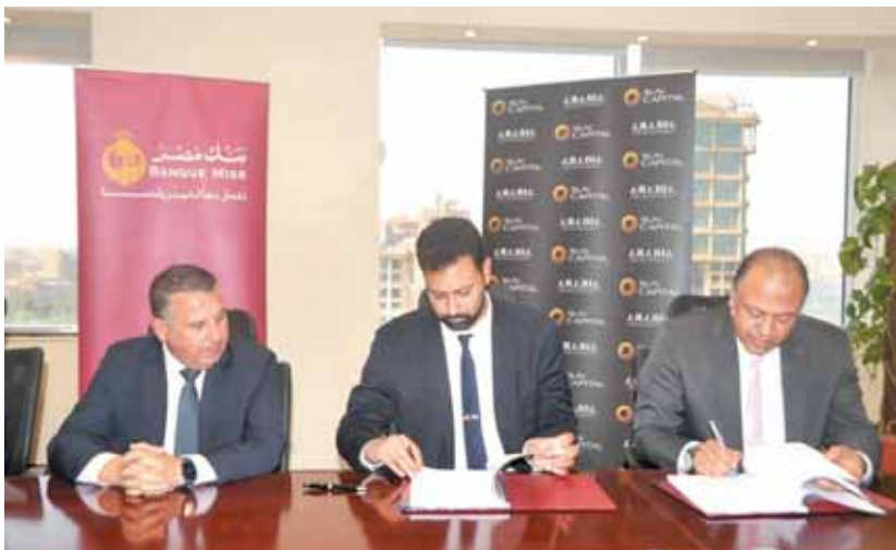
قيادات البنك والشركة خلال توقيع العقد

أهم القطاعات المؤثرة في الاقتصاد المصري، لما يمثله من توفير فرص استثمارية في مختلف الأنشطة سواء المباشرة أو غير المباشرة والتي تتماشى مع خطط التنمية، لارتباطها بمجموعة كبيرة من الصناعات والأنشطة والصناعات الوسيطة التي يحرص البنك على تمويلها لتوفير المزيد من فرص العمل في مختلف التخصصات بما يخدم بشكل عملي خطط التنمية، حيث يؤمن البنك بضرورة تضافر الجهود من أجل تحقيق انتماءاً في السوق العقاري المصري والذي يعكس على النهوض بجميع القطاعات الاقتصادية الأخرى بشكل مباشر أو غير مباشر، حيث يقوم البنك بدور حيوي في مساندة كافة الأنشطة التي تساهم في خلق حياة أفضل للمواطن المصري. وأضاف أن البنك حريص دائماً على دعم خطط الدولة لتحقيق التنمية الشاملة، وتوفير السكن اللائق للأفراد بهدف التخفيف عن كامل كافة شرائح المجتمع، والارتقاء بمستوى معيشتهم، من خلال سبل التمويل المتعددة التي يوفرها البنك سواء للأفراد من خلال تمويل الوحدات السكنية، أو للمطورين العقاريين بما يتناسب مع احتياجات الشرائح المختلفة، وذلك داخل نطاق المحافظات أو في نطاق مدن المجتمعات العمرانية الجديدة للتخفيف من التكدس السكاني. وأوضح البيان أن بنك مصر يعمل على تعزيز تميز خدماته والحفاظ على نجاحه طويل المدى والمشاركة بفاعلية في الخدمات التي تلبي احتياجات عملائه، حيث إن قيم واستراتيجيات عمل البنك تعكس دائماً التزامه بالتتميم المستدامة والرأى لصر، كما يحرص بنك مصر دائماً كونه مؤسسة مصرفية رائدة على الدخول في المبادرات والبروتوكولات التي تهدف لتقديم خدمات تتناسب مع احتياجات كافة شرائح العملاء.