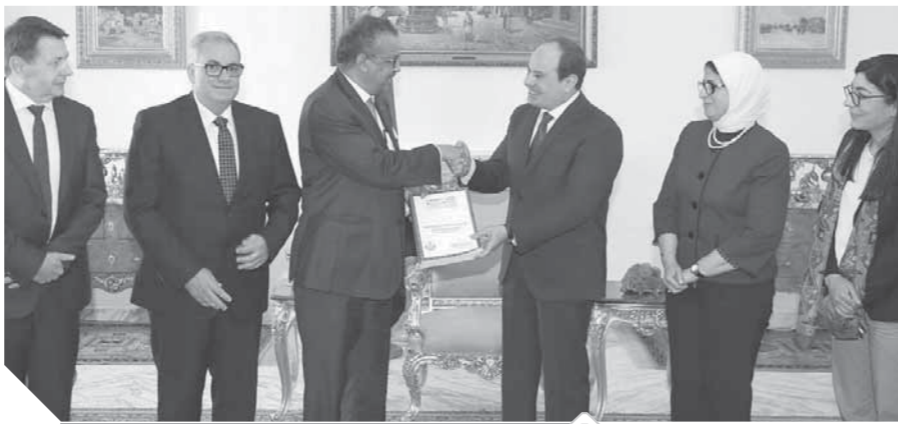
الرئيس، يتسلم تقرير منظمة الصحة العالمية

ومن جانبها، أكدت رئيسة الجمعية الوطنية التوجولية اعترازاً بلأدها الكبير بمصر قيادة وشعباً، وبدورها التاريخي في القارة الأفريقية، والذي تعزز خلال السنوات الأخيرة الماضية، وتم تويجه برئاسة مصر الحالية للاتحاد الإفريقي.