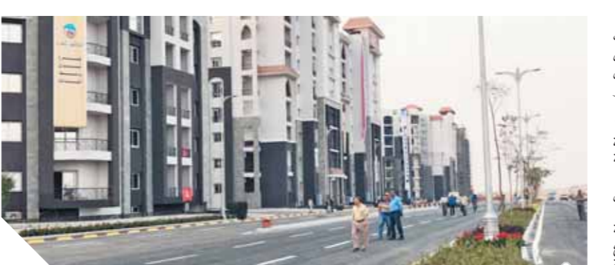
العمل يجرى على قدم وساق فى العاصمة الإدارية الجديدة تمهيدا لنقل الوزارات والمصالح الحكومية من القاهرة خلال العام المقبل

والخدمات الموجهة للمواطنين وتأمين التنمية المستدامة، ومن الاعتماد على المصادر التقليدية للاعتماد على المصادر المتجددة التى توأك العالم فى القرن الـ ٢١. ونفى المركز الإعلامى وجود أى تلاعب فى طرق شحن العدادات مسبقة الدفع، مُشدداً على توافر كافة معايير الدقة والتأمين فى العدادات مُسبقة الدفع.