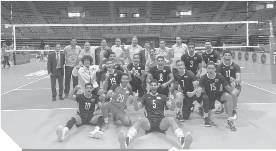
فرحة كبيرة لشباب الطائرة بعد الفوز على ألمانيا

الفريق فنيا حسن المصري يعاونه ناصر علي مدرب المحلل التقني مصطفى صالح، والمدير الإداري ناصر حمدي، والدكتور مصطفى يسري للعلاج الطبيعي، وكان الدكتور أشرف صبحي وزير الشباب والرياضة قد حضر حفل افتتاح البطولة، وذلك على هامش زيارته لدولة تونس لحضور منتدى الشباب في المنطقة العربية، وقد قام صبحي بزيارة البعثة المصرية بعد انتهاء مباراة منتخبنا الوطنى مع ألمانيا، وأعرب صبحي عن سعادته بفوز منتخب مصر على المنتخب الألماني بطل أوروبا، مشيدا بالأداء الرجولي طوال أشواط المباراة وطالب لاعبي المنتخب المصري ببذل مزيد من الجهد لمواصلة الانتصارات والوصول إلى الأدوار النهائية في البطولة وتحقيق إنجاز جديد يضاف لسجل الرياضة المصرية.