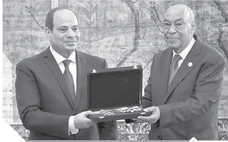
الرئيس يمنح رئيس الهيئة السابق وسام الجمهورية