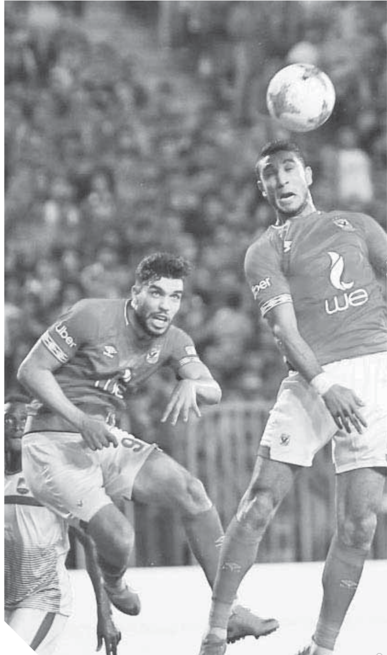
الأهلي حقق فوزاً مريحاً في لقاء الذهاب أمام «اطلع بره»