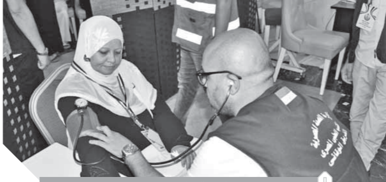
طبيب البعثة يوقع الكشف على احدي الحجاج

متابعة مستمرة وزبارة للحالات المحجوزة بالمستشفيات لتلقي الرعاية الطبية والتأكد من تلقيها جميع الخدمات. واستقبلت عيادات البعثة الطبية المصرية للحج حتى أمس الخميس ٧٤٥٣٠ حالة مرضية، حيث تم الكشف عليها وصرف العلاج اللازم لها، من بينها ٦٩٤٩٢ حالة مرضية بكافة المبرمجة و٥٠٢٨ حالة في المدينة المنورة.