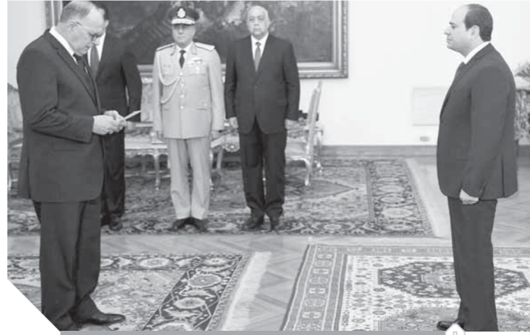
رئيس هيئة قضايا الدولة يؤدي اليمين الدستورية أمام الرئيس