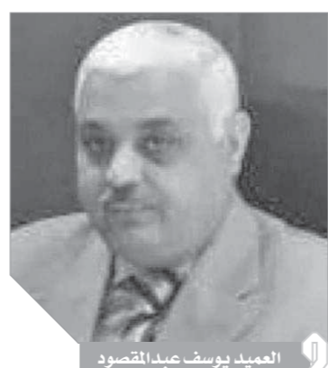
العميد يوسف عبدالمقصود

بدأ فريق البحث الجنائى الذى تم تشكيله برئاسة مدير مباحث سوهاج فى العمل ليل نهار لكشف خيوط الجريمة، وكانت المهمة شاقة لعدم اتهام أهلها لأى شخص بارتكاب فى قرى المركز والمعروف عنهم ارتكاب مثل هذه الجرائم، ولكننا لم نتوصل إلى شيء، واستمر العمل لأسبوعين متتاليين، وكادت القضية أن تقيد ضد مجهول، لولا عناية الله التي شاعت أن تكشف غموض تلك الجريمة البشعة وينال المجرم عقابه على أيدى العدالة.