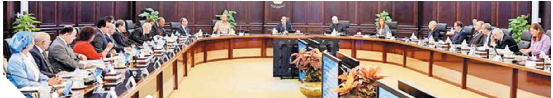
جانب من اجتماع مجلس الوزراء أمس

إنشاء صندوق لمواجهة الطوارئ الطبية للقضاء على قوائم الانتظار ودعم شراء الأدوية