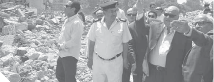
محافظة القاهرة يتابع عملية إزالة أكشاك أبوالسعود

وتقرر اعتبار منطقة أبو السعود وسور مجرى العين بمصر القديمة منطقة إعادة تخطيط، حيث تعد منطقتي عشوائية من الدرجة الثانية ومقامة على أملاك دولة في ضوء صدور قرار المجلس الأعلى للتخطيط والتنمية وقرار المحافظ، تنفيذاً لخطة أجهزة الدولة لتطوير المناطق العشوائية.