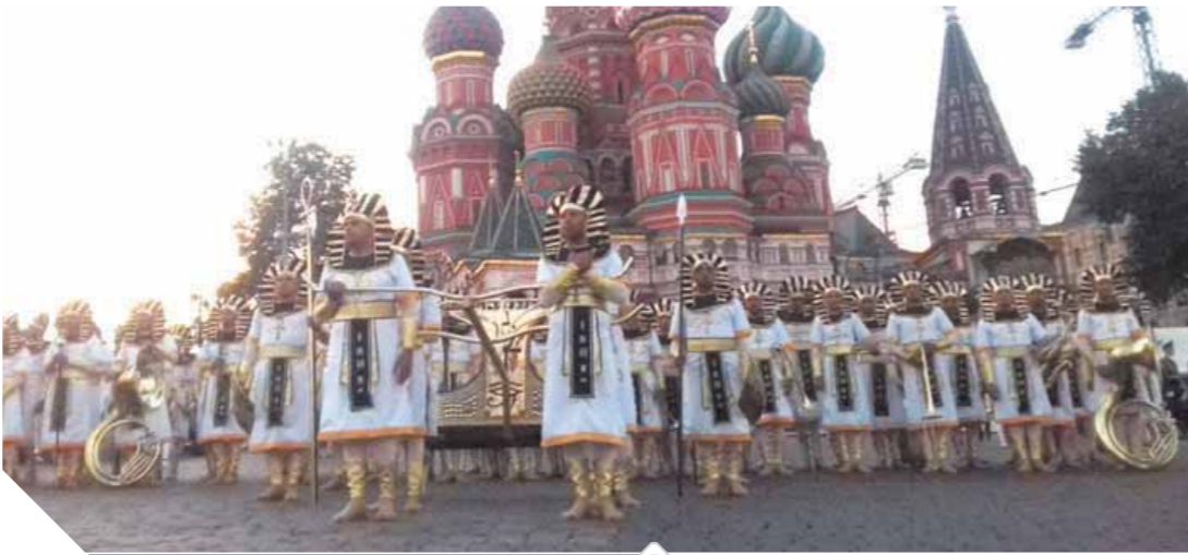
جانب من مهرجان الموسيقى العسكرية فى روسيا