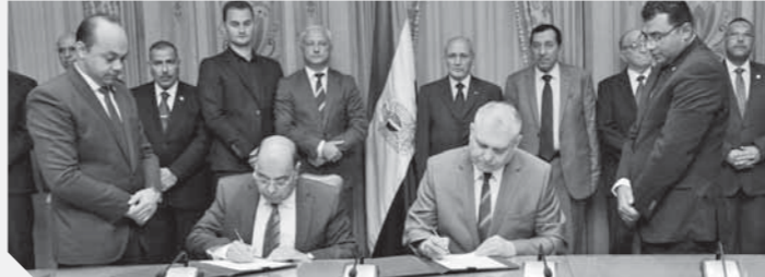
العصار وستير بيلاروسيا يوقعان بروتوكول التعاون

المحلى لتصل إلى ٤٥٪ بحلول عام ٢٠٢٢. وأش، راتشكوف، على إمكانيات شركات الإنتاج الحربى المصرية وعلاقتها المتميزة مع الشركات البيلاروسية والتزامها بالدقة، وهو الأمر الذى يشجع على عقد المزيد من الشراكات مع شركات الإنتاج الحربى، مؤكداً أن بلاده مهتمة بتوسيع مجالات التعاون ونقل التكنولوجيا وتوفير التدريب