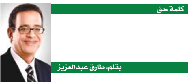
بقلم: طارق عبدالعزيز