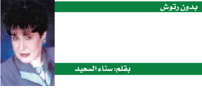
بقلم: سناء السعيد

لقد تركت هذه الأحداث جرحاً غائراً خاصة لدى الشعب المصري، من العلم أن ٨٠٪ منهم من حجاج ما يسمى تأشيرة الزيارة، ولم يكن لديهم تصريح بالحج، ساكنون نصفاً وأؤكد أن هناك مسئولية مشتركة بين من أراد أن يحج بدون تصريح وبدون خدمات لوجيستية من مخيمات ووسائل نقل جعلت كبار السن والمرضى يهلكون في الصحراء في أيام شديدة الحرارة، وبين شركات سياحية أوهمت المصريين بأن تأشيرة الزيارة هي حج رسمي، بالأحبال على قوانين البلد المنظمة للحج، وحصل من هؤلاء الراغبين في أداء الفريضة المقدسة على مئات الألاف وتركهم في الصحراء بدون خدمات، روايات كثيرة سمعناها من أهالي المتوفين عن عدم قدرة بعض المستشفيات في مكة والقريبة من عرقات على تقديم الرعاية الطبية اللازمة، أو بمعنى أصح تركت البحث لأيام دون أن تسلم لأهلهم، أياً كان التصريح فانا على يقين بأن السلطات السعودية، لم تترك الأمر يمر مرور الكرام، وسكون هناك محاسبة ومراجعة لكافة الإجراءات والأحداث، ونتظر بياناً يكشف حقيقة ما حدث، والإجراءات التي سيتم اتخاذها لمنع وقوع هذه الحوادث مرة أخرى.