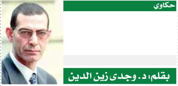
بقلم: د. وجاهد زين الدين

ارتفعت تلك الأبحار تلك الارتفاعات، ثم قاموا بعد البناء بكساء الأهرام بالبحر الجبدي، كلها تؤكد أن هؤلاء القدماء والحضارة الفرعونية كانوا أكثر من علماء، كان لديهم علماء في كل علوم الأرض في الهندسة والطب والفلك، لم يبق من تلك العلوم إلا آثارها وأخبار الحروب والمعارك التي انتصروا فيها، ليعلم الجميع أن ما يقع الناس دائما إلى زوال، والذي كان سبب موتهم من حروب ومعارك ما هي إلا ذكرى تسمى قائدها، ولكن الآن الكل يعمل لصالح هذا القائد ولا يهمه غير بقاء ذكراه حتى لو وصلوا إلى ما وصلوا إليه من علوم، لم تقصد أحدا!!