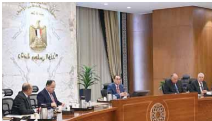
وزير الطيران خلال مشاركته في اجتماع اللجنة المعنية بتعزيز العلاقات المصرية الأفريقية برئاسة رئيس الوزراء