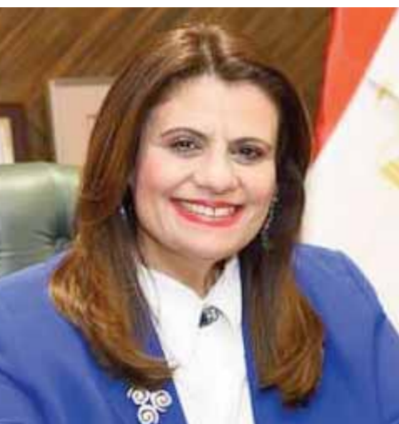
السفيرة سها جندي