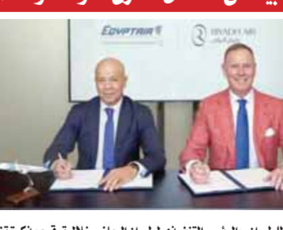
رئيس القابضة لمصر للطيران، والرئيس التنفيذي لطيران الرياض خلال توقيع مذكرة تفاهم

وقعت مصر للطيران الناقل الوطني لجمهورية مصر العربية وشركة طيران الرياض الشركة الوطنية الجديرة بالملكية العربية السعودية، مذكرة تفاهم للتعاون الاستراتيجي الذي يهدف لتقديم مجموعة متنوعة من المزايا الحصرية للضيوف المشتركين عند السفر بين جمهورية مصر العربية والمملكة العربية السعودية ووجهات ريثية أخرى، وذلك على هامش اجتماع الجمعية العمومية للاتحاد الدولي للنقل الجوي (IATA) الذي عُقد في دبي. كما تمز تلك الشراكة الاستراتيجية العلاقات الراضية بين البلدين وتدعم سبل التعاون بينهما، وتهدف مصر للطيران للتعامل العدي من الخيارات عند السفر مع مجموعة من الوجهات الأفريقية والدولية الأخرى عبر الشرق الأوسط وأفريقيا، وأصبحت رئيس مجلس إدارة لخطوط القابضة لمصر للطيران عن سعادته لدخول مصر للطيران في هذا التعاون الاستراتيجي مع طيران الرياض، والذي يعزز استكمالاً لتطلعات الشركة الوطنية لاستهداف أسواق جديدة، وتلبية احتياجات عملائها، وذلك