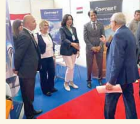
جنحة مصر للطيران في المعرض الدولي للسياحة والسفر بالجزائر

شاركت مصر للطيران لأول مرة هذا العام في المعرض الدولي للسياحة والسفر بالجزائر والذي يعد حدثاً تاريخياً هاماً شارك فيه عدد كبير من الشركات والمنظمات الدولية في مجال السياحة والطيران. أقيم المعرض بالعاصمة الجزائرية.. وتأتي مشاركة مصر للطيران هذا العام من منطلق حرص الشركة على التوسع في منطقة المغرب العربي وتعزيز تواجدتها في هذا السوق الحيوي، العدي من الوجهات الجديدة على مدار شبكة الاتحاد للطيران إلى جانب عدد وجهات أخرى في آسيا وأستراليا، فضلاً عن منح خدمات الاتحاد للطيران فرصة زيارة وجهات جديدة من مصر للطيران إلى جانب الوجهات المتوفرة حالياً.