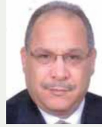
بقلم: حسين حلمي