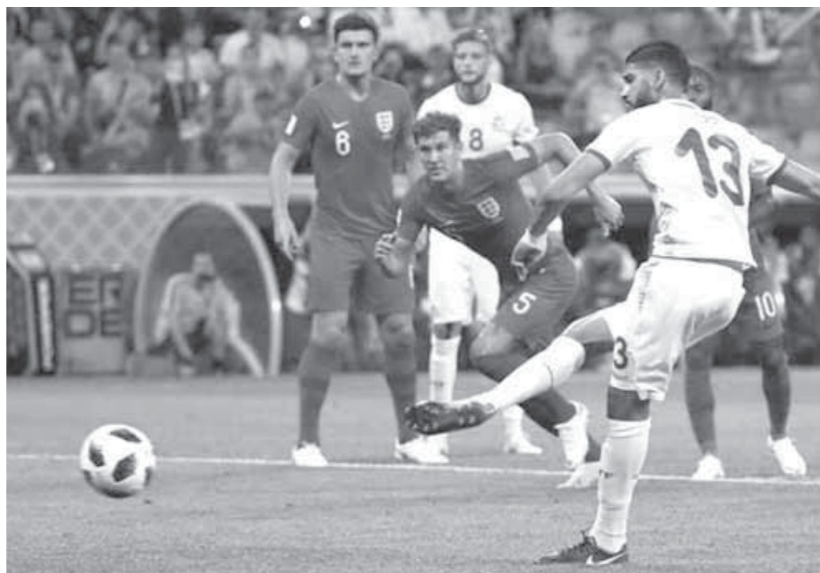
تونس تتمسك بالأمل رغم الهزيمة أمام إنجلترا