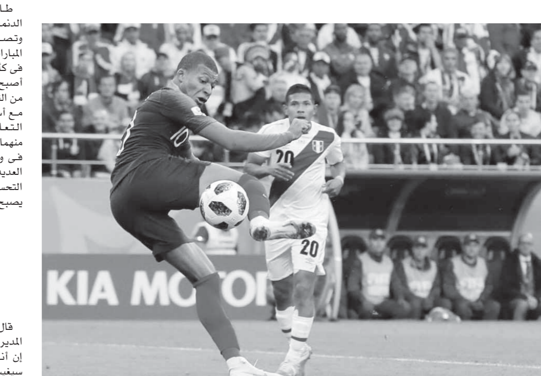
مبابي تألق أمام بيرو