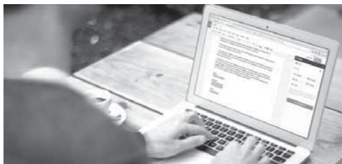
تطبيق يحدد تاريخ الوفاة

من الواضح إذا كان الرئيس ترامب سيستمر في الصفقة أم لا، وسخر من ترامب قائلاً: «هذه ليست علامة جيدة بالنسبة للصفقة الإيرانية، لأنه بغض النظر عما إذا كان ترامب سيستمر أم لا، فإنه يمكن أن تضمن بالطبع أنه سيختار القرار الأسوأ»، وقدم أوليفر في برنامجه الساخر خلفية تاريخية للمشاهدين، بعنوان «تاريخ قصير مثير للسخرية» للعلاقات الإيرانية-الأمريكية، بدءاً من انقلاب 1953، الذي دعمته الولايات المتحدة لصالح الشاه، وسخر من رغبة ترامب في الانسحاب من الاتفاق النووي، وقال إن الاتفاق النووي يمنع إيران من امتلاك قنبلة نووية لمدة 10 سنوات، بينما انسحاب ترامب يمنحها من امتلاكها لمدة «صفر» سنوات، وسخر من مستشار الأمن القومي ووجه سؤالاً لترامب قائلاً في سخرية: «كيف يمكنك أن تثق برجل متكوش الشعر كهذا؟»، وفي نهاية الحلقة وضع صورة لافتعجار ضخم، كتب عليها «لا تفجر الاتفاق النووي».