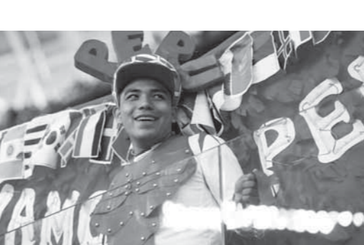
تقاعيل جماهير بيرو خلقت الأضواء بالمونديال

رغم عدم تمكنه من هز الشباك خلال مباراة المنتخب اللاتيني أمام فرنسا في الجولة الثانية بالمجموعة الثالثة لبطولة كأس العالم. وتحدث جاريكا عن جيريرو، قائلاً إنه يطل قومي وإنه: «غاب عن الفريق منذ مدة طويلة للغاية، وبالتالي لم يكن هذا هو الإعداد الأفضل له وجيريرو فعل كل ما في وسعه، نأمل فقط أن يتم حل الأمر، ونتمنى له كل التوفيق». وقال جيريرو، الهادف التاريخي لمنتخب بيرو: «لا يمكن لأحد أن يلوم زملائي.. احتفظ الفريق بروحه القتالية حتى النهاية، نشعر بالحزن لأننا كنا نتوقع تحقيق أكثر من ذلك، ولكن هذه هي كرة القدم».