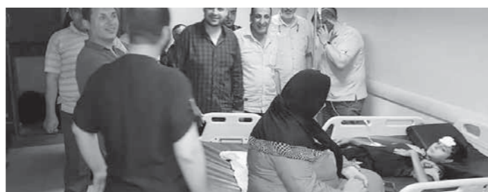
أحد المصابين يلقى العلاج في المستشفى