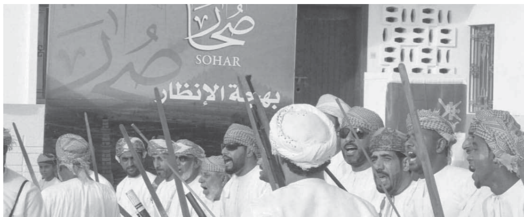
استعدادات لاستقبال قابوس في صحار

يشاء أكبر جامع في محافظة السلطنة. ويمثل منارة دينية حضارية تترى تاريخ الولاية العريقة التي تتسم بماضٍ وراثٍ ثقافي جعلها من المدن التي حظيت ولا تزال تحظى باهتمام كبير. كما يعد إنجازاً يضاف على الولاية بشكل خاص ومحافظة شمال الباطنة بشكل عام بعداً حضارياً وتاريخياً وثقافياً. يأتي الجامع إضافة إلى جامع السلطان قابوس المنتشرة في كافة محافظات السلطنة شاهدة على الاهتمام ببناء بيوت الله لتكون النبر الذي يعلو منها صوت الإرشاد والساحات التي يجتمع فيها المسلمون ليعلموا ويتعلموا ويؤدون الفرائض لله ويحمدونه وتكون منارةً للشباب الناشئين وهدايةً للمتعلمين ومنبعاً لتعلم العلوم الإسلامية، ومركزاً لتخريج النخبة المعاصرة التي تشهدنا كافة محافظات ولايات السلطنة وتقدم بعداً حضارياً وتاريخياً وثقافياً. ويقف جامع السلطان قابوس الأكبر بولاية بوشر الذي افتتح عام 2001 شاهداً أكبر من الشعراء للتعبير عن مشاعرهم، وغير ذلك من الفعاليات التي شارك فيها الألاف من المحافظة.