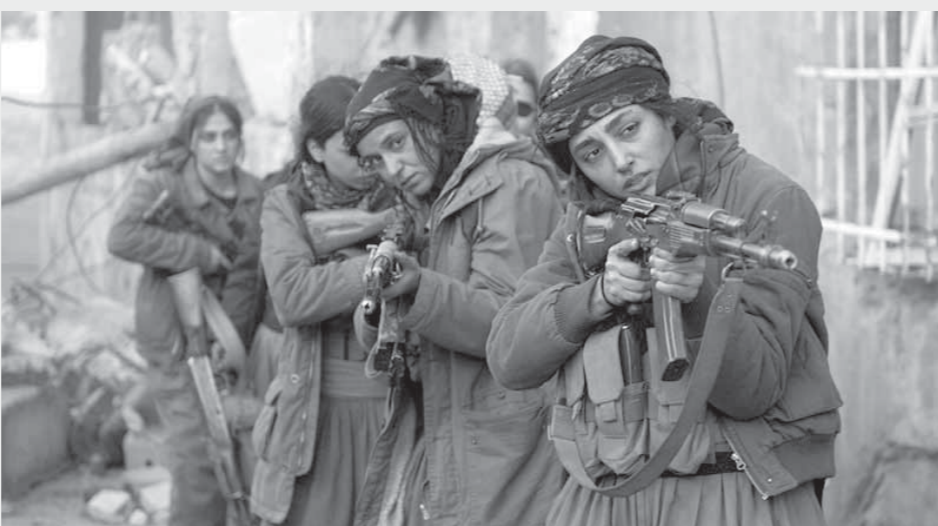
تقتل من فيلم «بنات الشمس»

غرار ما تعرضت له النساء الإيزيديات في العراق على يد تنظيم «داعش» عندما قتل المتشددون الرجال وتبادلوا النساء والبنات كسبائاً، بجانب تناول قضايا التحرش أو التمييز ضد النساء.