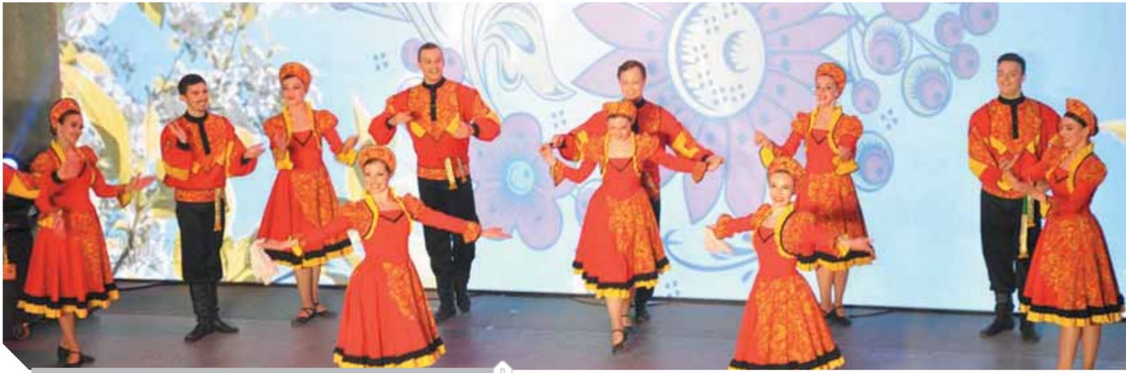
جانب من الاحتفالية الفنية

وقدم «تيفانيان» الشكر للتلفزيون المصري الذي قام بتسجيل الاحتفالية لإذاعتها للجمهور الذي لم يستطع الحضور بسبب الإجراءات الاحترازية.