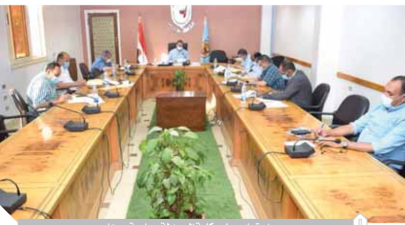
اجتماع مجلس كلية الصيدلة بجامعة سوهاج