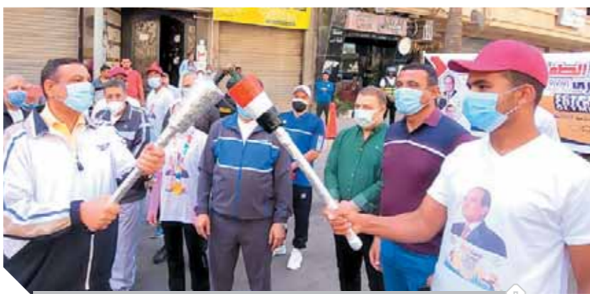
اللواء هشام آمنة يطلق شعلة أولمبياد الطفل المصري

تحت رعاية الرئيس عبدالفتاح السيسى ولعام الثالث على التوالي أطلق اللواء هشام آمنة - محافظ البحيرة، شعلة أولمبياد الطفل المصري فى نسخته الثالثة التي انطلقت بشوارع عبدالسلام الشاذلى بداية من مدخل مدينة دمنهور على الطريق الزراعى وحتى أمام ديوان عام المحافظة، ويعد الأولمبياد نموذج محاكاة لأولمبياد الرسمي للطلائع من سن ١٢ إلى ١٤ سنة. حيث شارك فى الفعاليات وانطلاق الشعلة التي تم خلالها تطبيق كافة الإجراءات الاحترازية خلالها المهندس حازم الأشموني -سكرتير عام المحافظة، والدكتور ابراهيم خضر وكيل وزارة الشباب والرياضة، ويوسف الديب وكيل وزارة التربية والتعليم، وعدد ٢٠٠ من الطلائع وحملة الأعلام وماراثون للدراجات وأبناء مراكز الشباب والمشاركين فى عدد من الألعاب من مراكز الشباب والمدارس والمعاهد وأبطال من أبناء البحيرة الأولمبيين السابقين وعدد من أبناء البحيرة الحاصلين على جوائز دولية فى المسابقات الرياضية. كما قام المحافظ بتكريم أبناء المحافظة الفائزين على مستوى الجمهورية بأولمبياد الطفل المصري فى نسخته الأولى ٢٠١٩م والثانية ٢٠٢٠م وأبناء البحيرة الأولمبيين والحاصلين على مراكز عالمية وأفريقية وعربية.