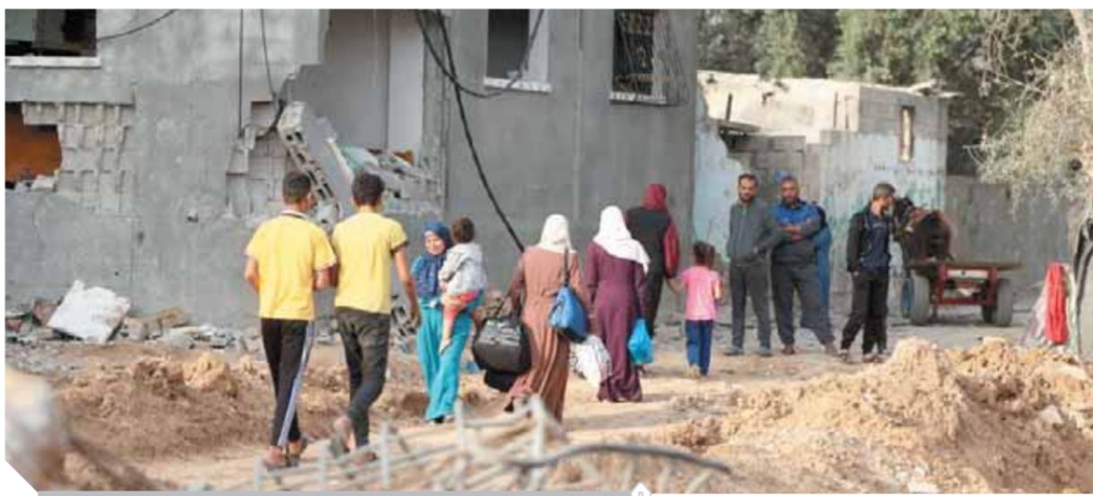
الدمار الذي خلفه العدوان الإسرائيلي على غزة وتمهدت مصر بإعمارها

عملية إعادة إعمار قطاع غزة لن تتخلفها ماطلة وستكون سريعة، وسيتم تسهيل إدخال المواد اللازمة عبر شركات مصرية، من خلال معبر رفح البري. وأرسلت الفصائل الفلسطينية رسالة احتجاج إلى الوفد المصري لوقف الاستفزازات التي تقوم بها شرطة الاحتلال في الحرم القدسي واقتحامه والاعتداء على المصلين فيه، مُحذرة من أن مثل هذه الأفعال كفيلاً بتغيير سبل أقرار السلام وتثبيت وقف إطلاق النار. كان الوفد المصري رفيع المستوى قد التقى مع قادة حماس وبحث معهم تنفيذ وقف إطلاق النار بشكل كامل، بالإضافة إلى المآلات التي ترى المقاومة الفلسطينية أنها ستعجز لتغيير الأوضاع، وستدفعها للعودة إلى المواجهة، خاصة فيما يتعلق بمدينة القدس المحتلة وحى الشيخ جراح. تأتي زيارة الوفد المصري في الوقت الذي يستعد فيه وزير الخارجية الأمريكي أنتوني بلينكن لزيارة الأراضي المحتلة الأربعة والخميس، لتثبيت وقف النار في الأراضي المحتلة. ضم الوفد المصري، لأول مرة، مسئولاً من رئاسة الجمهورية، بتكليف من الرئيس عبدالفتاح السيسي، وهو ما ترى فيه الفصائل إشارة إلى جدية كبيرة من قبل المصريين، بالإضافة إلى الموقف الإيجابي الذي تبدي فيه القاهرة دعماً لشروط المقاومة المتعلقة بإيجاد ضمانات حول مدينة القدس وعدم تغيير الواقع فيها. ونقل المسئولون المصريون إلى الفصائل الفلسطينية اهتمام القاهرة، وبشكل سريع، بالتوصل إلى تفاهات بخصوص استمرار الهدنة وتثبيت وقف إطلاق النار، وذلك بعد حصولها على تقييد وطلب أمريكيين بهذا الخصوص. وأبلغ الوفد الأمني المصري الفلسطينيين أن