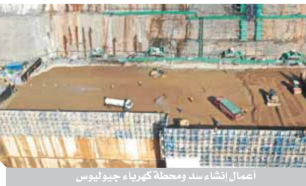
اصمات إنشاء سد ومحطة كهرياء جيوليوس

أكد الوزير أن هناك تكاليف واضحة من الرئيس عبدالفتاح السيسي، رئيس الجمهورية، بالاهتمام بالمشروع، والتشديد على جودة التنفيذ، نظراً لما يمثله المشروع من أهمية للأشقاء في تنزانيا، وكذلك ليعبر عن قدرة شركائنا الوطنية على تنفيذ أكبر المشروعات في هذا القطاع، وما تمتلكه من خبرات متميزة.