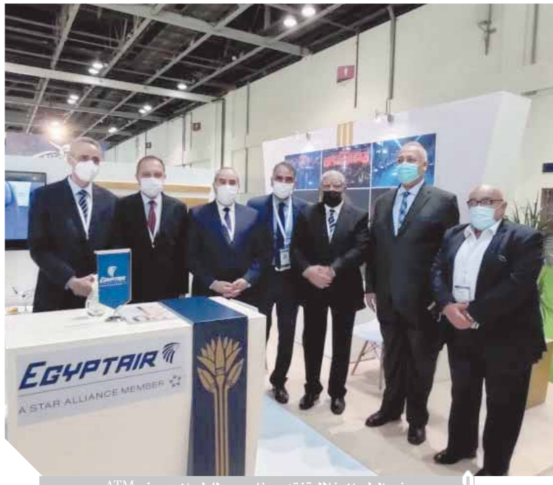
وزير الطيران خلال تفقده جناح مصر للطيران بمعرض ATM

هذا وقد تم مؤخرًا تقييم أرض رأس جميلة بشرم الشيخ البالغة نحو ٨٢٠ ألف متر، وذلك من قبل جهات متخصصة لتحديد حصة كلتا الشركتين، تمهيدًا ل طرح المشروع للشراكة مع القطاع الخاص.