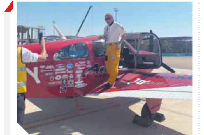
الطيار الياباني على أرض مصر يمحار سفنكس الدولي

وذلك بأعلى مستويات التأهيل. هذا وقد أشاد وفد الوكالة الأوروبية لسلامة الطيران المدني (EASA) بالحالة الفنية للجهاز. يعد جهاز الطيران التمثيلي من طراز A٢٢٠ الأول في منطقة الشرق الأوسط. وتعد هذه الاعتمادات إضافة جديدة قوية لإمكانات أكاديمية مصر للطيران للتدريب.