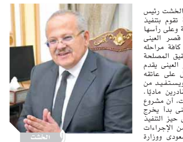
الأوراق الخاصة بطرح المشروع وتقدم ٤٥ استشارياً وتم الانتهاء إلى ٥ شركات استشارية، وأضاف رئيس جامعة القاهرة، أن الجامعة تولت مع وزارة الاستثمار

والتعاون الدولي والجانب السعودي متابعة الانتهاء من جميع الإجراءات حتى وصل المشروع إلى خطواته النهائية للتنفيذ لاختيار استشاري المشروع. وأكد الدكتور الخشت، أن المشروع الجديد يتضمن إعادة تجديد شامل وحوكمة لمستشفيات قصر العيني وأن تخضع لإدارة رشيدة بهدف تقليل قوائم الانتظار وتقديم خدمات طبية على أعلى مستوى، بالتعاون مع صندوق التمويل السعودي، مشيراً إلى أنه تم توقيع اتفاقية القرض السعودي بقيمة تبلغ ١٢٠ مليون دولار من البنك السعودي ومبلغ ٨٠ مليون دولار من الجانب المصري.