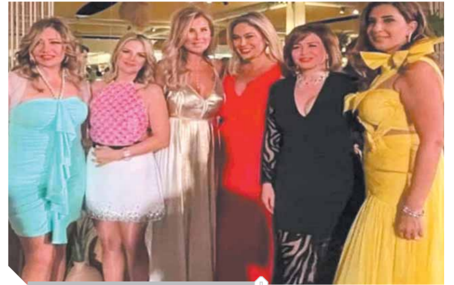
عدد من الفنانات المشاركات في حفل الزفاف