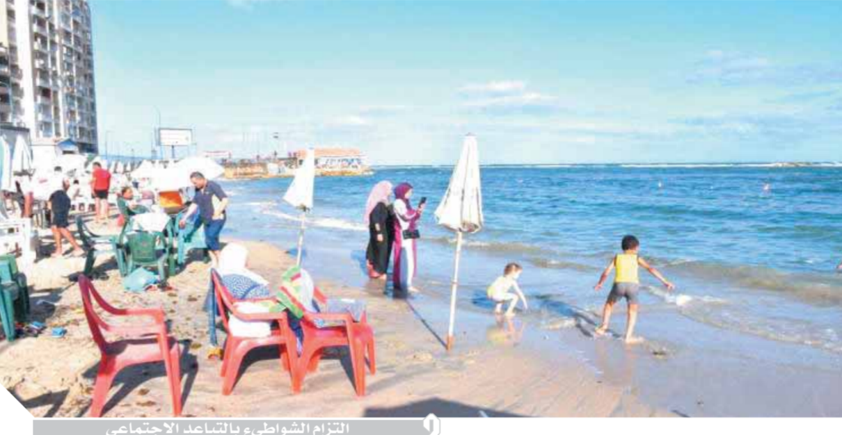
التزام الشواطئ بالتباعد الاجتماعي

وشدد رئيس مدينة مرسى مطروح على الإجراءات التي أقرها مجلس الوزراء وهي التلق في التاسعة مساءً للمطاعم والمقاهي والكافتريات والمولات، وعملها ديلفيري عقب ذلك، وحظر إقامة الاحتفالات والفعاليات الفنية والثقافية التي تتطلب تجمعات كبيرة من المواطنين، والدفع بحملات يومية لمتابعة تنفيذ قرارات مجلس الوزراء.