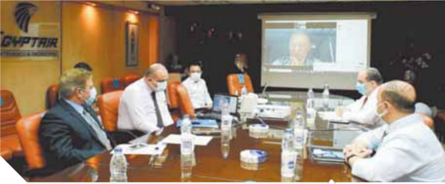
فريق عمل مصر للطيران للصيانة اجتاز تفتيش FAA

والسلامة وهنجر الشركة والمخازن الفنية والأختبارات اللا إتلافية لصيانة الوحدات وورش وحدات الفرامل وورشه البطاريات ومخزن الكيماويات ومخزن وحدات عجل الطائرات ومخزن العدد والمعايرة ومعدات الدعم وبرامج التدريب.