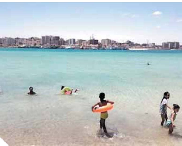
الاستقبال موسم صيف ٢٠٢١ بناء على قرار

وأشار لبيب «لأول مرة» أن الوحدة المحلية لمدينة رأس البر قامت بتجهيز عدد ٤ خيم لجميع الأطفال التائهين وعدد ٤ خيم للإسعاف وتجهيز أبراج الإنقاذ بطول الشاطئ وكذا منطقة المعدات بالإضافة لعمل الصيانات اللازمة لسدوات المياه والأدشاش ووضع اللافتات بإرشادات السلامة على الشاطئ، وذلك في إطار خطة الوحدة لتقديم أفضل الخدمات للمواطنين لاستقبال موسم صيف ٢٠٢١ بناء على قرار