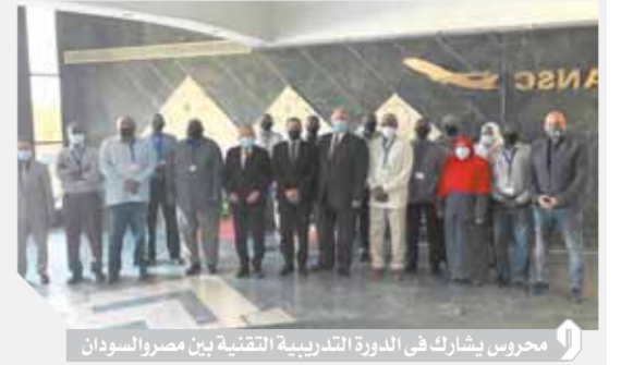
محروس يشارك في الدورة التدريبية التقنية بين مصر والسودان

بالإشارة للدور الفعال لجمهورية مصر العربية على مستوى القارة الأفريقية، ودعمًا للجهود المستمرة لتوطيد أواصر التعاون مع دولة السودان الشقيقة في مجال خدمات الملاحة الجوية، حضر المهندس محمد سعيد محروس رئيس الشركة القابضة للمطارات والملاحة الجوية الدورة المنعقدة بالشركة الوطنية لخدمات الملاحة الجوية المتخصصة عن نظم الربط البياني والتقني بين المجال الجوي المصري والمجال الجوي السوداني والمعروفة باسم (AIDC/OLDI).