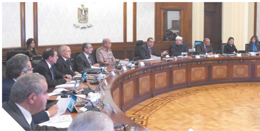
اجتماع مجلس الوزراء صورة أرشيفية

أعلن الدكتور محمد مختار جمعة، وزير الأوقاف، خلال اجتماع مجلس الوزراء أمس برئاسة الدكتور مصطفى مديبولي، رئيس مجلس الوزراء، عن تخصيص الوزارة ٣٠٠ مليون جنيه للقرى الأكثر فقراً، وصندوق دعم التعليم، مقسمة إلى ٢٠٠ مليون جنيه لدعم مبادرة حياة كريمة التي يتم تنفيذها بالتنسيق مع وزارة التضامن الاجتماعي، بحيث توجه للقرى الأكثر فقراً والأسر الأولى بالرعاية على مستوى الجمهورية، بالإضافة إلى ١٠٠ مليون جنيه لدعم صندوق دعم التعليم. وأكد وزير الأوقاف أن تخصيص تلك المبالغ يأتي في إطار الدور الاجتماعي للوزارة، وجهودها في خدمة المجتمع، وأساقفاً ما تم تخصيصه شروط الواقفين في مجال البكالوريوس وخدمة المجتمع. استعرض الدكتور عز الدين أبو ستيت، وزير الزراعة واستصلاح الأراضي، خلال اجتماع مجلس الوزراء تقريراً عن نتائج الزيارة التي قام بها مؤخراً للمملكة العربية السعودية الشقيقة، وتم الاتفاق مع الجانب السعودي على أهمية تكثيف التنسيق والتعاون المشترك في المجالات المرتبطة بالقطاع الزراعي بين البلدين الشقيقين، بما يسهم في زيادة حجم وفرص التبادل التجاري للحاصلات الزراعية، إلى جانب التأكيد على أهمية تفعيل نقاط الاتصال الزراعي الرسمية في كل من مصر والسعودية.