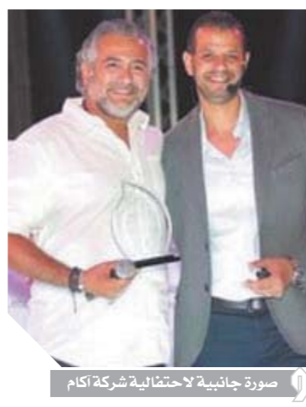
صورة جانبية لاحتفالية شركة أكام

المشروع لضخ ٣٠٠ مليون جنيه. ويقدر حجم استثمارات مشروع سيناريو العاصمة الإدارية بحوالي 5 مليارات جنيه وهو المشروع الذي يمتد على مساحة ٣٩ فدانا، حيث صمم كل مبنى كجزء فندقى قائم بذاته يضمن تكامل الخدمات لكل على حدة لتوفر خدمات حياتية غير مسبوقة تتمثل في النادي واليحييات الرئيسية، والمطبخ المركزي، ومنطقة الخدمة المركزية، وحمامات السباحة، والمسرح، ومنطقة خاصة للاسترخاء، والمركز التجاري، وخدمات الأمن والرعاية الصحية القائمة على مدار الساعة ليمثل كل ذلك نقلة نوعية في مفاهيم المجتمعات السكنية. وشهد الحفل قيام «أكام» بتكريم أفضل ١٠ شركات من شركائها لعام ٢٠١٨/٢٠١٩ بناء على إحصائيات المبيعات.