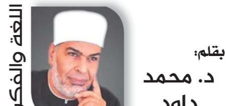
بقلم: د. محمد داود