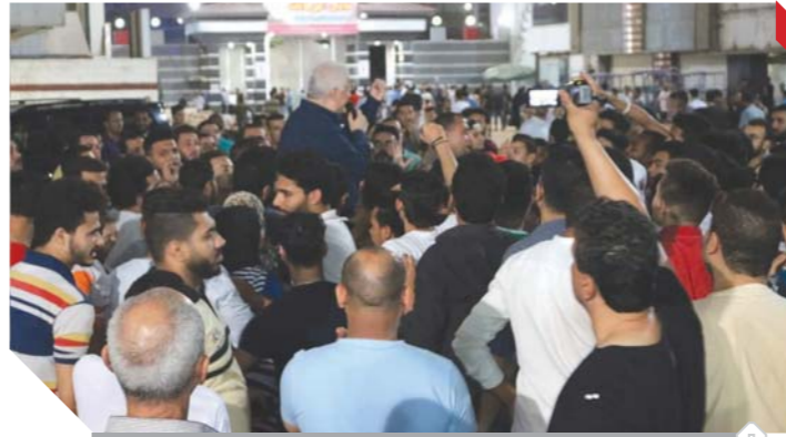
زحام شديد على ندى الزمالك للحصول على تذاكر نهائى الكونفدرالية