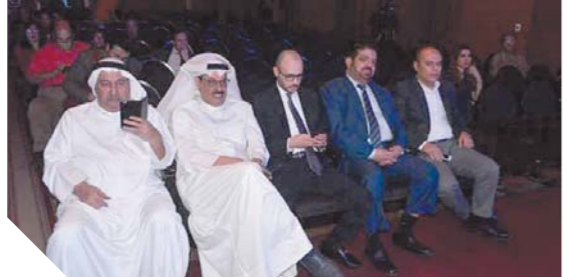
السفير الكويتى محمد صالح الذويج يتابع العرض