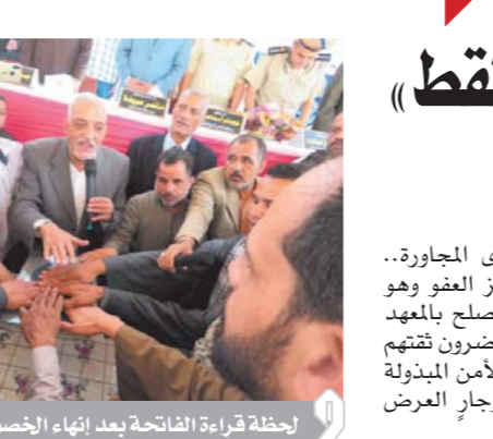
لحظة قراءة الفاتحة بعد انهاء الخصومة

احتضنت دار الأوبرا عروض «فرقة معيوف الجلى، الكويتية بالمسرح الصغير ضمن ليالى رمضان والسهرات العربية الإسلامية، التى اطلعتها الدكتورة ايناس عبدالدايم، وزيرة الثقافة، وعرضت الفرقة الإيقاعات والفنون التراثية الكويتية، التى تتنوع بين «العرضة والصوت والسامرى والدرزة»، إلى جانب الفنون البحرية التى اشتهرت بها، وتميزت الفرقة بوجود ثلاثة أجيال بين أعضائها تتراوح بين الماضى والحاضر معاً.