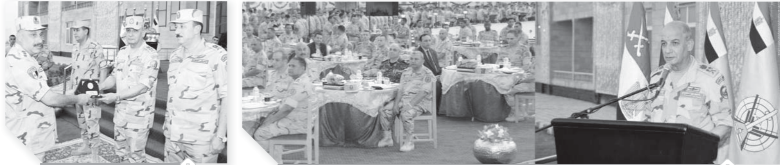
الفريق أول محمد زكى وزير الدفاع القائد العام للقوات المسلحة يلتقى رجال المنطقة الغربية العسكرية .. ويكرم عدداً من المتميزين

لمهامهم التدريبية ومواجهتهم المستمرة ضد العناصر الإجرامية وعصابات التهريب والتسليح عبر الحدود ومكافحة الهجرة التى تمر بها المنطقة، وطابعهم باليقظة الدائمة والحفاظ على الأمانة والمعدات لفرض السيطرة الأمنية الكاملة على حدودنا الغربية.