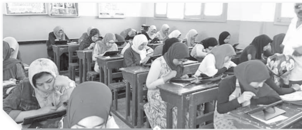
طالبة الصف الأول الثانوى أثناء تادية امتحان الجغرافيا

الذين يشكون من صعوبة الأسئلة الموجة الحارة التى تؤجل امتحان اللغة الأجنبية للصف الأول الثانوى، حيث كانت مدهم ٦ سنوات، ويتم إجراء امتحان جديد نصف كل ٣ سنوات، وكانت تحدد طريقة انتخاب التجديد النصفى بالقرعة فى أول فصل تشريعى جديد، ويخوض الانتخابات الذين تأتي عليهم القرعة من خلال اجتماع المجلس، ويتم سحب على الأسماء المرشحة لخوض الانتخابات، ويبقى الجزء الباقى الذى يحل عليه الدور فى انتخابات التجديد القادمة، طبعاً كانت القرعة تجرى للأعضاء المنتخبين فقط، ويستمر المبعوثون والذين يترك أمرهم لرئيس الجمهورية، وفى مرة أجريت القرعة فى قاعة مجلس الشورى، وفوجئ جميع النواب بأن الدكتور مصطفى كمال حلمى يسحب ورقته بنفسه ليخوض انتخابات التجديد النصفى، وضجت القاعة بالضحك.