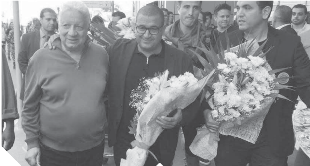
رئيس الزمالك يستقبل بعثة النهضة بالورد