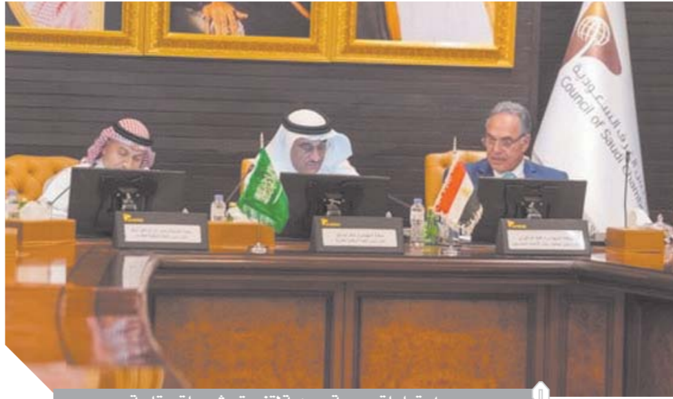
اجتماعات مصرية سعودية لتنسيق مشروعات عقارية

بيان السفارة السعودية لمواطنيها تحذيراً من الاستثمار العقاري في تركيا