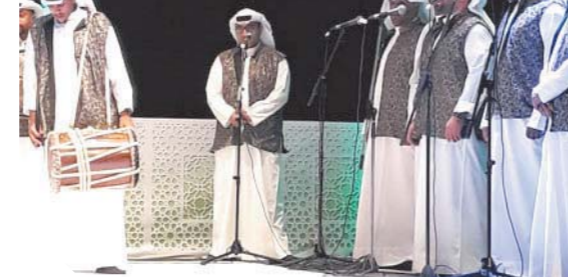
فرقة معيوف الجلى الكويتية تقدم عرضها في دار الأوبرا

هو المحافظ على تراث وطنى الذى يعد جزءاً مهماً من الموروث الكويتى ومن هوية المجتمع الكويتى من فنون قديمة كالفن السامرى والنقازى والفن القروى والروشاد والموسيقى والحسارى والردادى والشبشى والتجدى فى محاولة لتدوين هذه الفنون للجيل الجديد بأى شكل من الأشكال حتى لا تندثر.