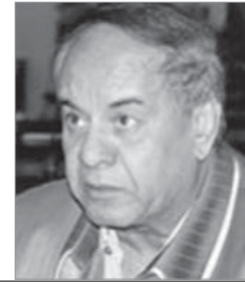
د. نبيل توقة بباوى يكتب: