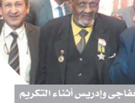
خفاجى وادريس أثناء التكريم

احتفالاً بذكرى نصر العاشر من رمضان قام المجلس الأعلى لهيئة قضايا الدولة- أقدم هيئة قضائية في مصر- بتسليم درع التميز لمقاتل أحمد إدريس، وهو بطل فكرة الشفرة النووية التى حيرت إسرائيل في حرب أكتوبر الجيدة ١٩٧٣، والعاشر من رمضان، وهو حاصل على نجمة الشرف العسكرية لبطوره الطولي في فكرة الشفرة النووية التى كانت إحدى عوامل النصر في حرب أكتوبر الجيدة، كما قام المجلس الأعلى لهيئة تسليم درع التميز للمستشار الجليل الدكتور محمد عبدالوهاب خفاجى نائب رئيس مجلس الدولة على عطاءه العلمى التميز ودراساته في ميدان الوطنية المصرية، ويبدو في الصورة محاطاً برجال القوات المسلحة البواسل، وتم تقليد درع التميز للمستشار أحمد سعد الدين الأمين العام لمجلس النواب على عطاءه التميز على الساحة البرلمانية. كما تم تكريم رؤساء الأفرع بهيئة قضايا الدولة نواب رئيس الهيئة، والأعضاء التميزيين من مختلف درجات الهيئة، وشهداء الجيش والشرطة بنطاق المحافظة وتكريم أرواح المستشارين الذين انتقلوا إلى رحمة الله عز وجل.