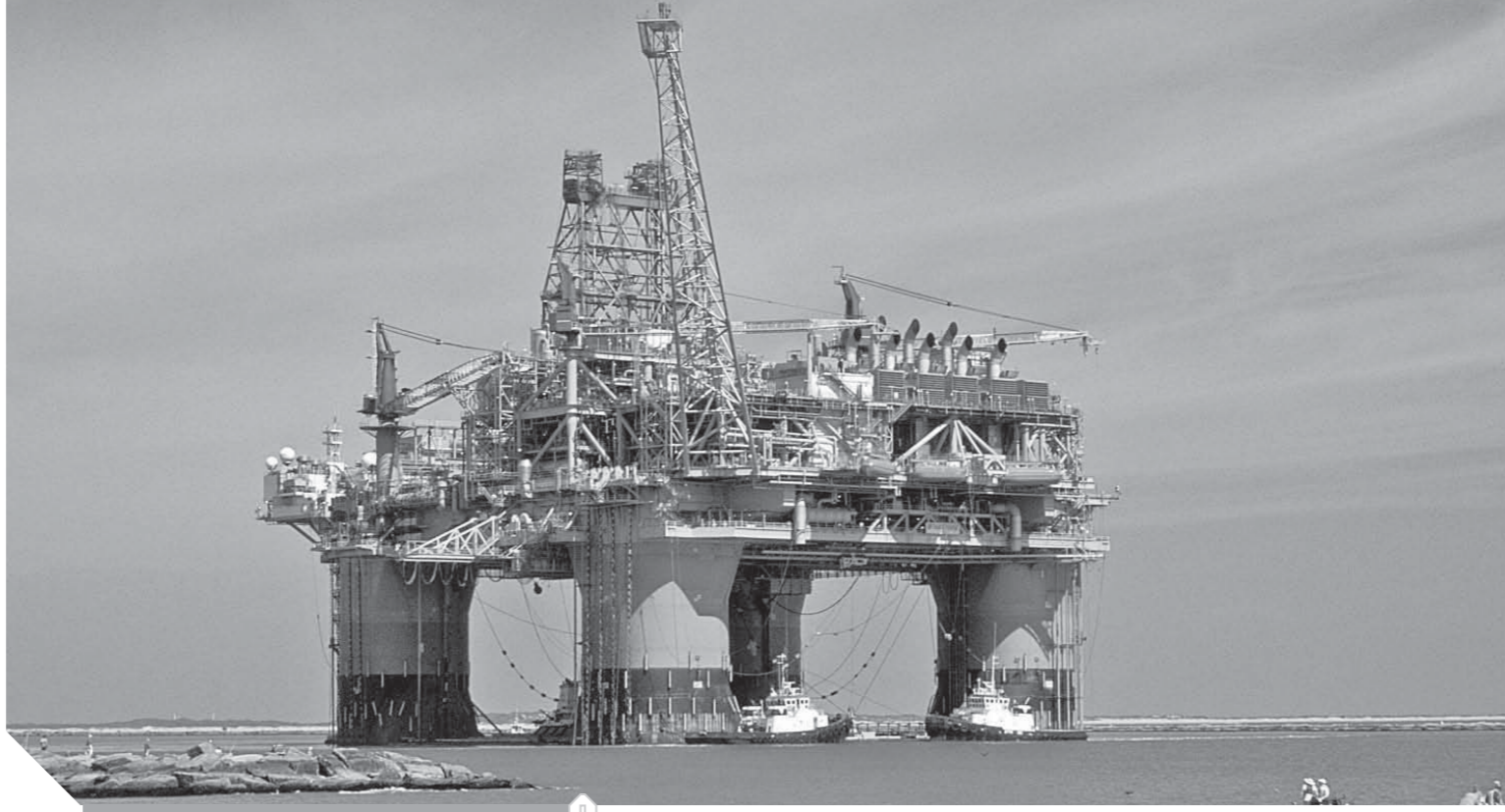
أحدى المنصات البترولية

• سؤال لوزير الخارجية سامح شكرى: عن «حرفية التوازن بين القوى الدولية الكبرى دون معاداة أحد»