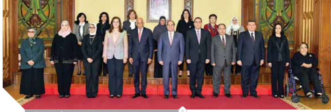
الرئيس السيسي خلال الاحتفال بيوم المرأة المصرية

السلع متوافرة ولا تتكالبوا على الشراء.. والاحتياطي آمن