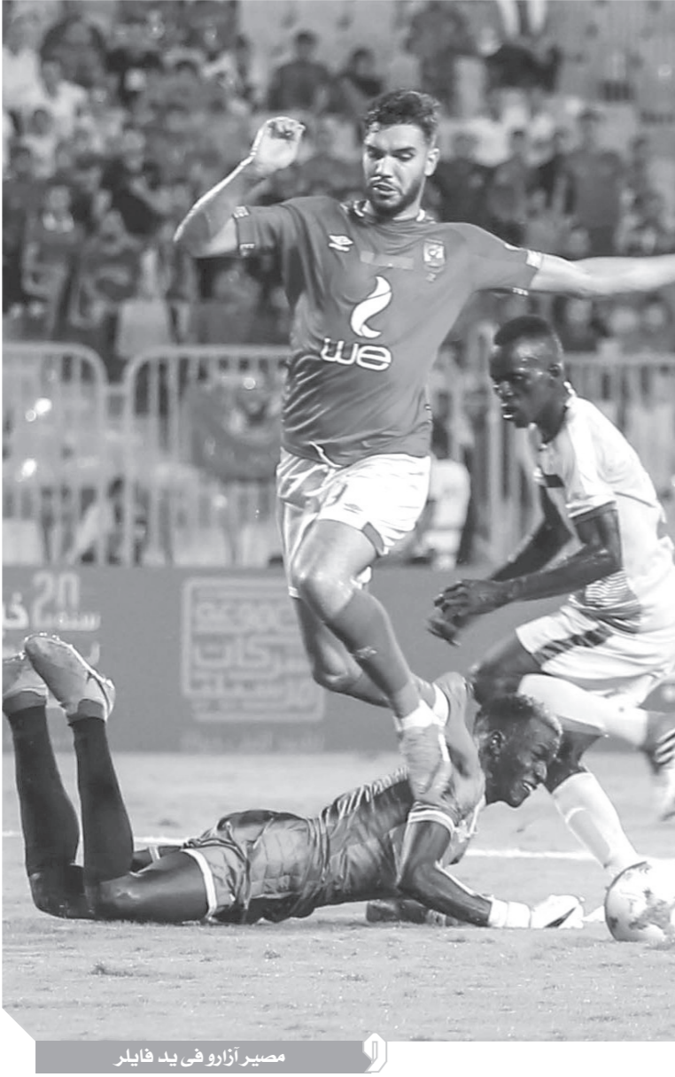
مصير آزارو في يد فايلير