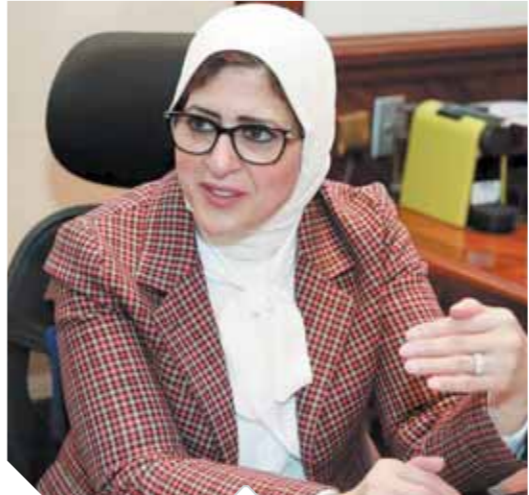
د. هالة زايد

تنفيذاً لتعليمات وزارة الصحة ووزارة التعليم العالى، وما تتطلبه بروتوكولات المستشفيات الجامعية فى ظل حالة إعلان الحرب ضد فيروس كورونا اتخذ مستشفى سعاد كفاى الجامعى التابعة لجامعة مصر للعلوم والتكنولوجيا كافة الإجراءات الاحترازية التى من شأنها مواجهة هذا الفيروس بشكل علمى دقيق وبأدوات سريعة وعاجلة.