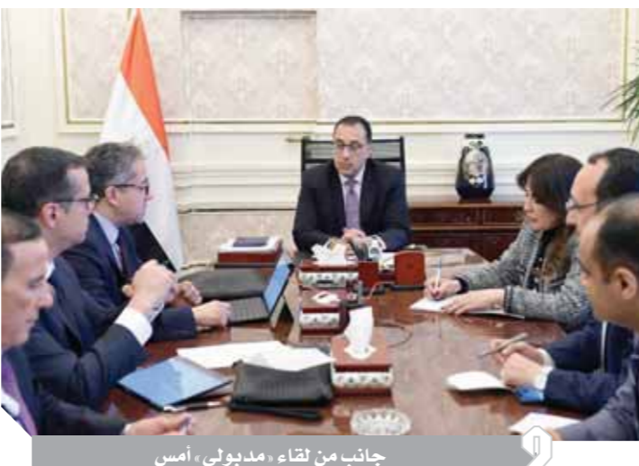
جانب من لقاء مديبول، أمس

وقدم وزير السياحة والآثار عرضاً حول التعامل مع التداعيات والآثار الاقتصادية لظهور فيروس «كورونا» المستجد، مشيراً في بداية العرض إلى مجموعة الإجراءات التي قام بها الاتحاد المصري للغرف السياحية والغرف التابعة له، فقبما يخص العاملين في المنشآت الفندقية، تم التأكيد على الالتزام بالاستمرار في دفع الرواتب