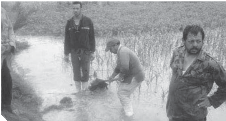
السيول تسببت في خسائر للمحاصيل

للظروف المناخية غير المناسبة وانتشاء فيروس كورونا ووقف الأسعار، فضلاً عن أن بعض أنواع الخضراوات لم تخرج العروة الأساسية لها ونحن في فترة فاصل عروات، وكثرة الحلقات الوسيطة بداية من الفلاح مروراً بتاجر الجملة فاتجر التجزئة فبائع الميزان (الكفة) ثم المستهلك.