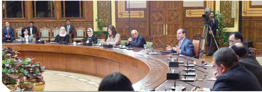
الرئيس خلال الاحتفال بيوم المرأة المصرية

وأكد السيسي أن الإعلام قام بدور إيجابي في متابعة أزمة كورونا سواء داخل مصر أو خارجها، موضحاً أن الإعلام لعب دوراً مهماً في مواجهة التشكيت وترويج الشائعات في تلك