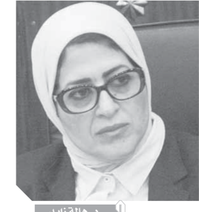
د. هالة زايد

وقد تقدم السيد زكى بتحرير محضر رقم ٣٠ أحوال بتاريخ ١٥ يونيه ٢٠١٩ رقم الجراحة التي يؤكد بأنها خطأ كما تقدم بيلا للمستشار النائب العام برقم ٧٧٢٨ بتاريخ