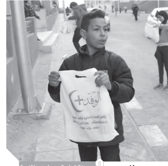
حملة الوفد تجوب شوارع القاهرة