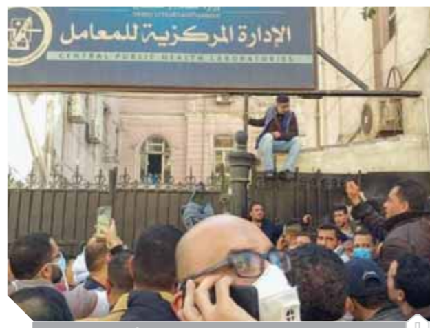
المعامل المركزية تشمل بجد واجتهاد في أزمة الفيروس

ارتفع عدد حالات الإصابة في مصر إلى ٢٩٤ حالة حتى أمس، وتم شفاء ٤١ منها وخرجت من مستشفيات العزل فيما ارتفعت الوفيات إلى ١٠ حالات، وأعلنت وزارة الصحة والسكان أمس عن ارتفاع عدد الحالات التي تحولت نتائج تحاليلها معملياً من إيجابية إلى سلبية. وسبق أن تم تسجيل ٩ حالات جديدة ثبتت إيجابية تحاليلها معملياً للفيروس، جميعها من المصريين المخالطين