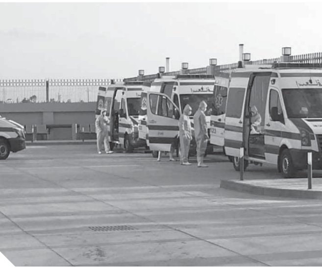
معلم والمعددة بنحو ١٤ يوماً وتسلم أطباء آخرين مهام العمل.