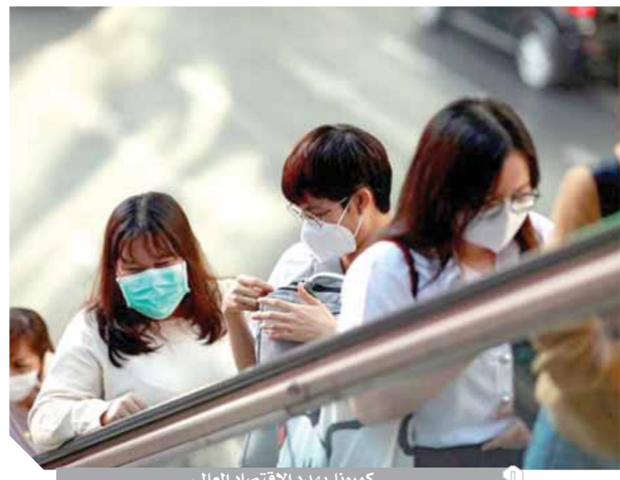
كورونا يهدد الاقتصاد العالمى