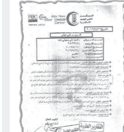
مستند يوضح التشخيص بعد الجراحة الخطأ

مكررة وارتفاع بالسكر واضطراب بالوعى وفى ٢٠١٩/٤/١١ تم إجراء فتح وتنظييت جراح عميق بالالاية واستئصال أنسجة مكررة وفى ٢٠١٩/٤/١٢ وفى ٢٠١٩/٤/١٥ غيار تحت مخدر عام وفى يوم ٢٠١٩/٤/٢٠ غرز ثانوية تحت مخدر عام.