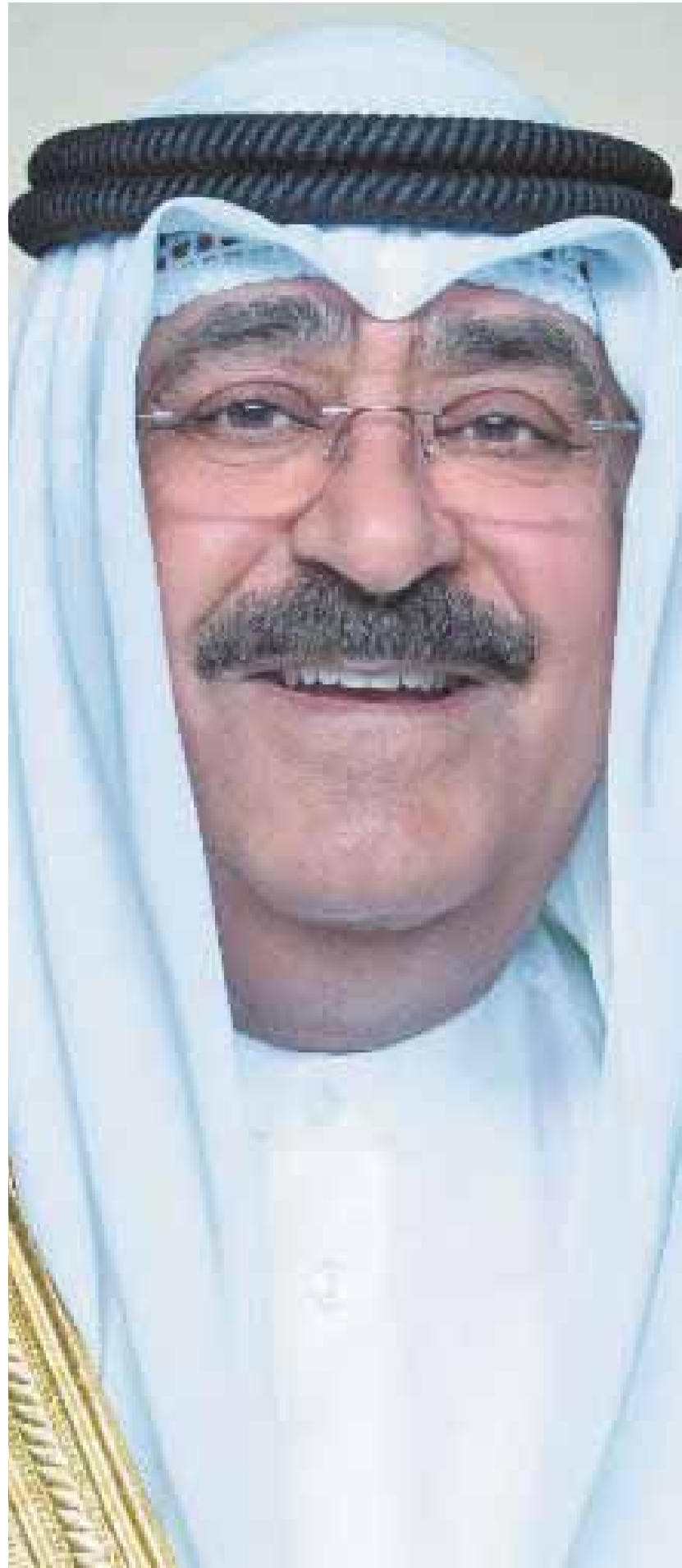
الشيخ مشعل أحمد الجابر ولي العهد