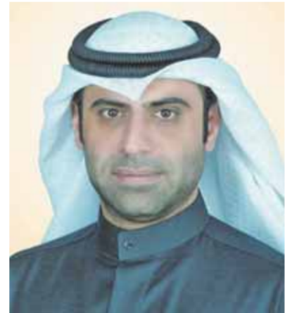
الدكتور أحمد روح الدين وزير الإعلام الكويتي

وكان لإصدار هذه المجلة العريقة قصة تمتد حتى ١٩٥٨، صدرت مجلة «العربي» من دائرة المطبوعات والنشر الكويتية التي كان يرأسها آنذاك المغفور له الشيخ صباح الأحمد الصباح أمير الكويت الراحل، في ١٩٥٨، واستخدمت لدراسة تجربتها العلامة المصرية الدكتور أحمد زكي، وعندما التقى زكي مع المغفور له الشيخ عبدالله السالم حاكم الكويت الراحل قال له الأمير: «زكيها رسالة لكل عربي ولا تتخذ طابعاً محلياً، وطبيكم أن تعودوا عن الزواجر السياسية وتبعوا إلى السلام، وهكذا سلكت «العربي» الطريق كأفضل سفير للكويت وتحت رعايته السياسية، وسعت نحو إيمان رسالة المعرفة والفكر والأدب لكل عربي، ولا تزال هكذا حتى يومنا هذا.