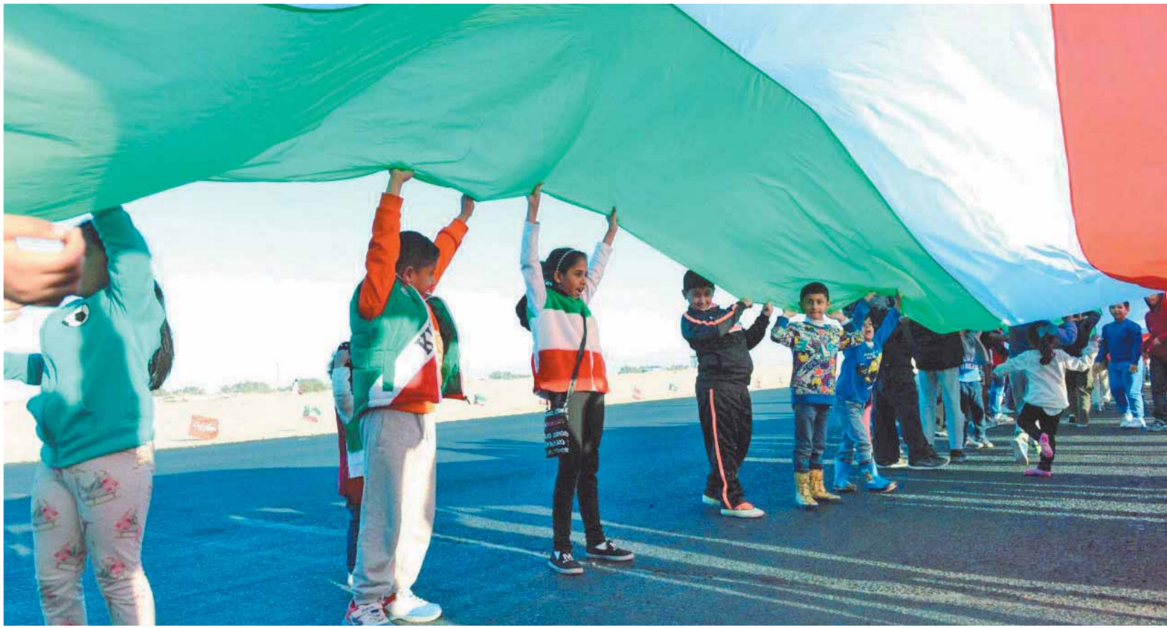
مركز جابر الثقافي

الأزهر يفتح أبوابه للطلبة الكويتيين ويرعى أول معهد ديني يتعده بالمدرسين والمناهج