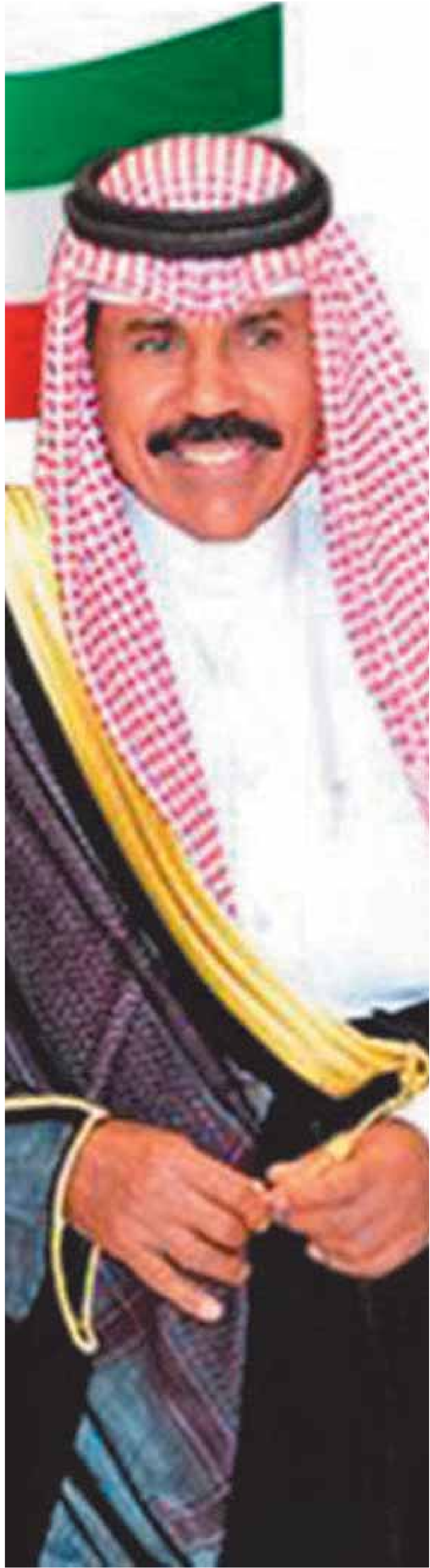
أمير الكويت الشيخ نواف الأحمد الجابر الصباح

واجب القاهي وقد وضعت الخطوط العريضة لهذه المجلة، وجرى تدويرها من خلال الجامعات التي هي عليها قرار إنشائها، والذي صدر كوثيقة رسمية صادرة عن دائرة المطبوعات ونشره الجريدة الرسمية «الكويت اليوم» بتاريخ ١٩٥٨/٢/٢٠