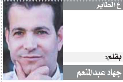
ع: الطائر بقلم: جهاد عبد المنعم