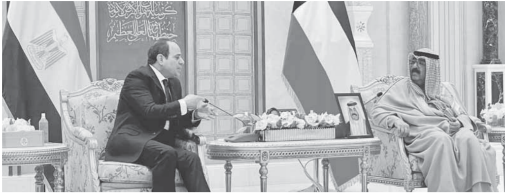
الرئيس السيسي خلال لقائه أمس أمير الكويت نواف الجابر الصباح وولي العهد مشعل الأحمد الجابر