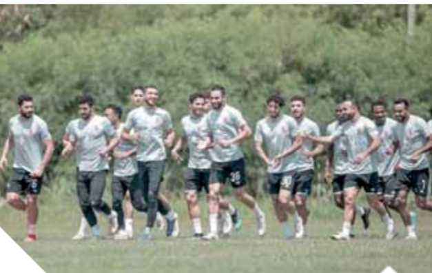
الأهلي جاهز لمواجهة سيمبا

كتب - محمد الاهلوني: يستضيف ملعب (ماكابا) بالعاصمة التنزانية دار السلام في الثالثة عصر اليوم الثلاثاء بتوقيت القاهرة لمواجهة التي تجمع بين الأهلي ومضيفه سيمبا التنزاني في ثاني جولات المجموعة الأولى لدوري أبطال أفريقيا.