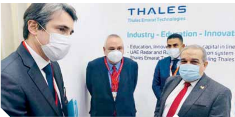
وزير الإنتاج الحربي خلال المشاركة في معرض أبو ظبي

بالشركات وتحديد أوجه التعاون على أرض الواقع. كما التقى وزير الدولة للإنتاج الحربي بوعد من البحرين ليبحث سبل التعاون المشترك، وفي ختام فعاليات اليوم الثاني بالمعرض زار المهندس محمد أحمد مرسى، وزير الدولة للإنتاج الحربي، جناح شركة تاليس الفرنسية، والتي باتت تترأس الشركة، كما أعرب عن تطلعه لزيادة التعاون بين شركة تاليس وشركات وزارة الإنتاج الحربي نظراً لما تمتلكه شركاتها من مقومات تكنولوجية وبشرية تسهم في إقامة شراكة صناعية ناجحة، كما تفقد وزير الدولة للإنتاج الحربي عدداً من أجنحة الشركات الأخرى المشاركة بالمعرض للإطلاع على أحدث ما وصلت إليه التكنولوجيا العالمية في مجال أنظمة التسليح، ووجه الدعوة لعدد من الشركات للمشاركة في معرض IDEX ٢٠٢١ المقرر إقامته في مصر نهاية هذا العام.