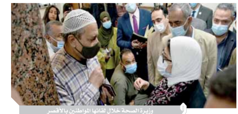
وزيرة الصحة خلال لقائها المواطنين بالأقصر

كتب - هشام الهلوتي: أعلنت الدكتورة هالة زايد، وزيرة الصحة والسكان، تسجيل أكثر من ٩٠٠ ألف مواطن بنظام التامين الصحي الشامل بمحافظة الأقصر، بمنظمة بلغت ٧٠٪ من سكان المحافظة، ومنذ بدء التامين، بالمنظومة في شهر أكتوبر ٢٠١٩ وحتى اليوم، جاء ذلك خلال تفقد وزيرة الصحة والسكان وحدة طب أسرة الشيخ موسى بمحافظة الأقصر، اليوم الاثنين، يرافقه الدكتور أحمد السبكي، مساعد وزيرة لشئون الرقابة والمتابعة، رئيس الهيئة العامة للرعاية