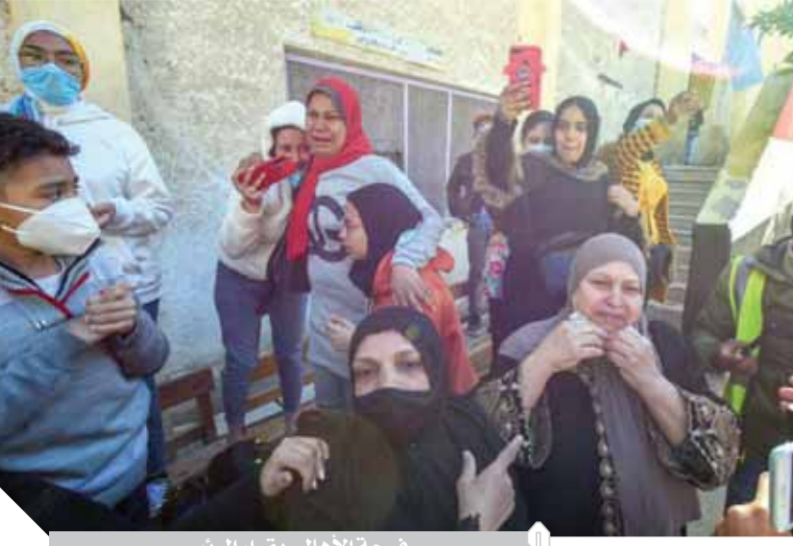
فرحة الأهالي بقرار الرئيس