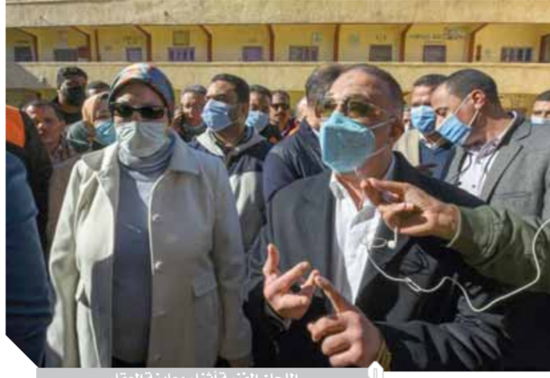
الجلسة الفنية أثناء معاينة العقار