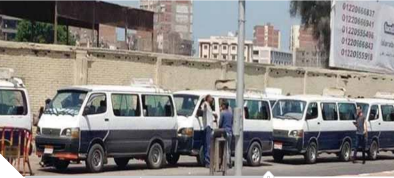
سيارات السرفيس والأجرة بحمولة زائدة