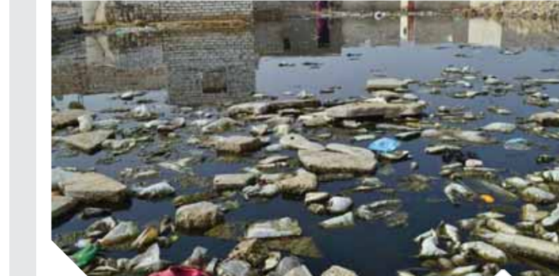
برك المياه تحاصر المنازل والصفى يفرق القرية

الفيوم- محمد الهريجي: يعانى أهالي قرية الوابور الجديدة التابعة لمركز إسطا بمحافظة الفيوم الأخرين وهم يطالبون بحقوقهم في خدمة الصرف الصحي لقريةهم بسبب تعنت المسئولين وغياب التنسيق الحكومي، وبالرغم من كونها إحدى قرى مركز إسطا التي تم اختيارها ضمن المراكز المستفيدة من مبادرة «حياة كريمة» لتطوير الريف المصري فإن القرية مازالت حائرة بين إدراجها ضمن القرى التي تشملها منحة بنك إعادة الإعمار الأوروبي وبين مبادرة حياة كريمة التي بدأ الإعداد لتنفيذها خلال الفترة المقبلة. وتعد قرية الوابور الجديدة من القرى ذات الكثافة السكانية المرتفعة باعتبارها المنتسب الوحيد لكافة قرى المركز بسبب وقوع القرى المجاورة لها وسط المناطق الزراعية مما يصعب عليها التوسع العمراني، بينما تقع قرية الوابور الجديدة وسط ظهور صحراوي ممتد العمران ويتخطى عدد السكان بها حاجز العشرين ألف نسمة وتحتوي على منشآت صناعية عديدة مثل مدرسة إسطا الثانوية الصناعية ومجمع مدارس ابتدائي وإعدادي وأكثر من خمسين دور عبادة بين مسجد وكعبة ومراكز تجارية لوجودها على طريق الفيوم الرئيسي وتتوسط قرية المركز، وبالرغم من ذلك فإن القرية مازالت محرومة من خدمة الصرف الصحي بالقرية مما حولها إلى برك ومستنقعات مليئة بالبحشرات مما تسبب في إصابة أبناء القرية بالعديد من الأمراض المعدية وتسبب في تصدع وانهار المنازل وعندما قام عدد من الجمعيات الخيرية بإعادة تأهيل منازل محدودى الدخل بالقرية غمرتها المياه مرة أخرى وهجرها ملياتر جنبه لمعالجة عدد من القرى ومن