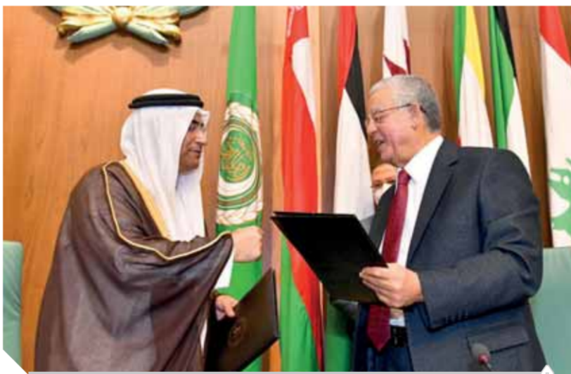
توقيع بروتوكول تعاون بين النواب، والبرلمان العربى

العربى فى مسعاه النبيل لإحياء قيم التضامن العربى المشترك. وجاء هذا فى افتتاح أعمال الجلسة العامة الثالثة للبرلمان العربى، والمقامة بمقر جامعة الدول العربية. ووقع المستشار حنفي جبالى، رئيس مجلس النواب، وعادل بن عبدالرحمن الموسى رئيس البرلمان العربى، على هامش الجلسة بروتوكولا للتعاون بين مجلس النواب المصرى والبرلمان العربى. ويشمل البروتوكول تعزيز أطر التعاون، وتبادل الخبرات، وتسيق الجهود البرلمانية العربية فى مختلف المحافل الدولية والإقليمية، كما يتضمن أيضا قيام كل من مجلس النواب المصرى والبرلمان العربى بتبادل استراتيجيات بناء القدرات، والتعاون فى تبنى المشروعات والبرامج البحثية العربية. وفى ختام حفل توقيع بروتوكول التعاون أهدى عادل بن عبدالرحمن الموسى درع البرلمان العربى المستشار الدكتور حنفي جبالى، رئيس مجلس النواب.