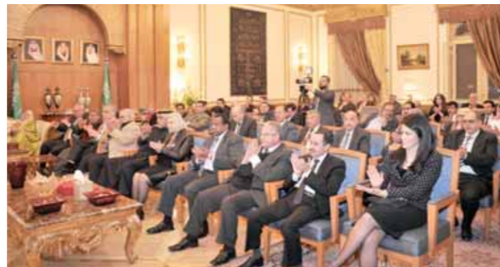
جانب من الحضور في الملتقى