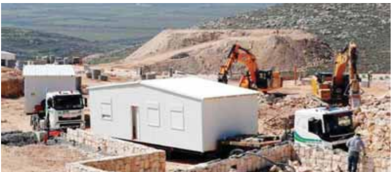
تشبيد مستوطنة إسرائيلية جديدة فى الضفة الغربية

انتهزت إسرائيل انشغال العرب والمجتمع الدولى بما يجرى فى الغوطة السورية وبادرت أمس الأول فى بناء مستوطنة جديدة فى الضفة الغربية المحتلة منذ 25 عاماً، فى خطوة جاءت لإرضاء المستوطنين الذين أخرج عدد منهم من مستوطنة عشوائية قبل سنة. وذكرت وكالة «فرانس برس» أن شاحنات إسرائيلية وضعت 12 منزلاً جاهزاً على الأراضى التي يفترض أن تستقبل هذه المستوطنة الجديدة التي سميت «عميحا».