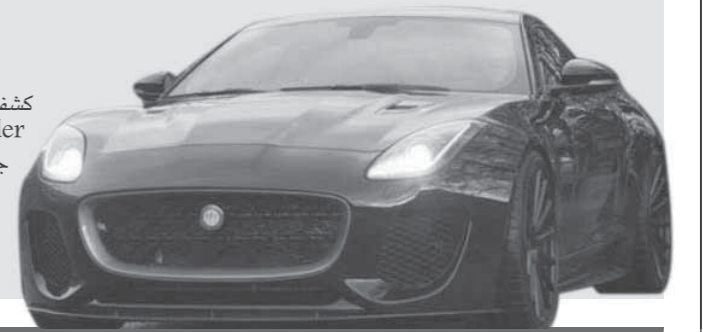
الجمعة ٧ من جمادى الآخرة ١٤٢٩هـ - ٢٣ فبراير ٢٠١٨م - ١٦ أيار ١٩٢٤ق - العدد ٩٨٣ - السنة الواحدة والثلاثون

كشفت شركة «ليستر» البريطانية عن سيارتها Thunder الجديدة، والتي تعتمد على أيقونة جاجوار Type-F كويبه، بقوة 666 حصاناً. وتطلق تحفة «ليستر» من الثبات لـ 100 كلم/س بغضون 3 ثوان تقريباً، فيما تتخطى السرعة القصوى 320 كلم/س، بفضل القوة