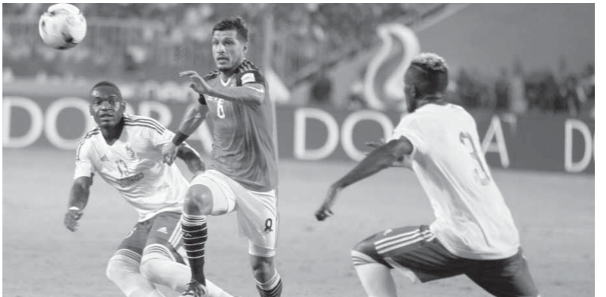
المنتخب يسعى لأن يكون في أفضل فورمة قبل المونديال