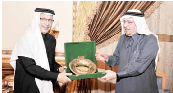
احمد قطان يكرم نزار مدنى

ومثل بلاده تمشيلاً مشرفاً في العديد من المحافل والمنظمات والمناسبات الدولية، كما صدرت له ثلاثة مؤلفات حول رحلته الدائم لدى جامعة الدول العربية، عميد السلك الدبلوماسى العربى أحمد بن عبد العزيز قطان، أمسية ثقافية «رياض النيل»، حيث كان ضيف الشرف وزير الدولة للشؤون الخارجية الدكتور نزار مدنى، الذى ألقى محاضرة تحدث فيها عن «السياسة الخارجية للمملكة العربية السعودية»، بحضور عدد من الوزراء والشخصيات العامة والمفكرين والسياسيين والسفراء ورؤساء مجالس إدارات ورؤساء تحرير بعض الصحف والكتاب والإعلاميين. واستهل السفير «قطان» الأمسية بالترحيب بوزير الدولة للشؤون الخارجية والضيوف الكرام، لافتاً إلى أن الدكتور نزار مدنى قد شغل العديد من المناصب ومثل بلاده تمشيلاً مشرفاً في العديد من المحافل والمنظمات والمناسبات الدولية، كما صدرت له ثلاثة مؤلفات حول رحلته الدائم لدى جامعة الدول العربية، عميد السلك الدبلوماسى العربى أحمد بن عبد العزيز قطان، أمسية ثقافية «رياض النيل»، حيث كان ضيف الشرف وزير الدولة للشؤون الخارجية الدكتور نزار مدنى، الذى ألقى محاضرة تحدث فيها عن «السياسة الخارجية للمملكة العربية السعودية»، بحضور عدد من الوزراء والشخصيات العامة والمفكرين والسياسيين والسفراء ورؤساء مجالس إدارات ورؤساء تحرير بعض الصحف والكتاب والإعلاميين.