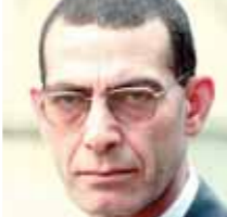
بقلم: وجدى زين الدين