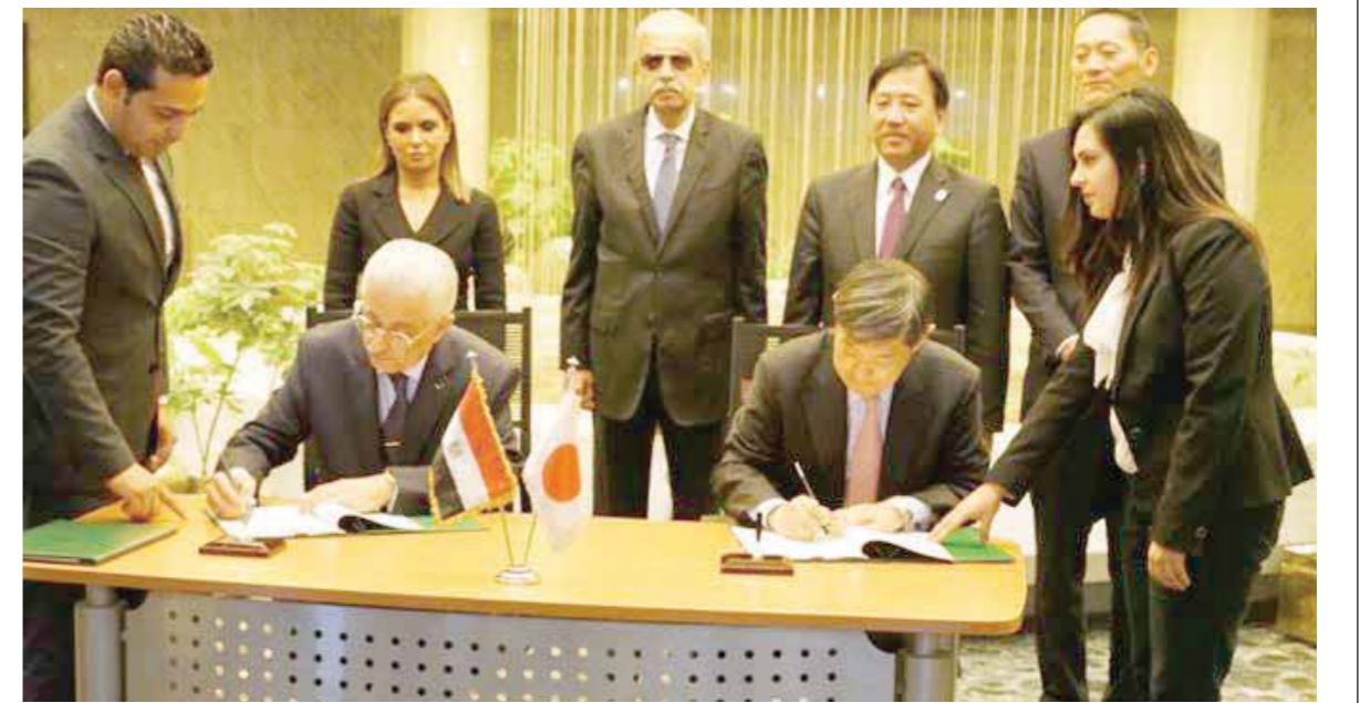
د. طارق شوقى خلال توقيع الاتفاقية بحضور شريف اسماعيل وسحر نصر