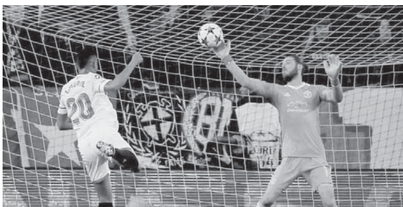
دي خيا ينقذ فرصة خطيرة من أمام مرمى مانشستر

ولم نعلمه ما يكفي، لإظهار ما يمكنه القيام به». أما الصحافة الإنجليزية، فلم تتفق مع مورينو واختارت الحارس المتألق دي خيا نجما للقاء، فتحت عنوان «ذا سبيشال وان»، أشادت صحيفة «جارديان» بأداء حارس مرمى مانشستر يونايتد الذي قام بتصديتات خرافية، جتبت فريقه الخسارة وحرمت الفريق الإسباني من تحقيق الفوز على أرضه. وسارت صحيفتا «مترو» و«تيليجراف» على النهج ذاته، فخرجت الأولى بعنوان «دي