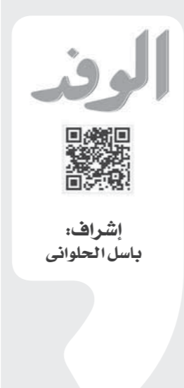
إشراف: باسل الحلواني

حكمة التاريخ الذي اهتم به ابن خلدون تقول لنا اليوم إن الفتاح الذي يفتح كل الأبواب متراح مزيف، لأن لكل باب مفتاحه، كما لكل مجال أهله ولكل علم باحثه ولكل صناعة خبزاؤها. ودينا ذلك في حقيقة أن الانتفاذ بكل الأمور مهلكة والتعصب للأفكار غلو في غير محله، وأن أعظم الفضائل تلك التي يجتمع عليها الناس دون إكراه ولا ادعاء.