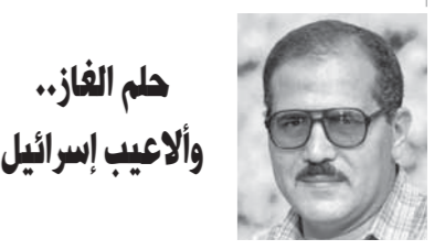
حلم الفاز.. والأعب إسرائيل