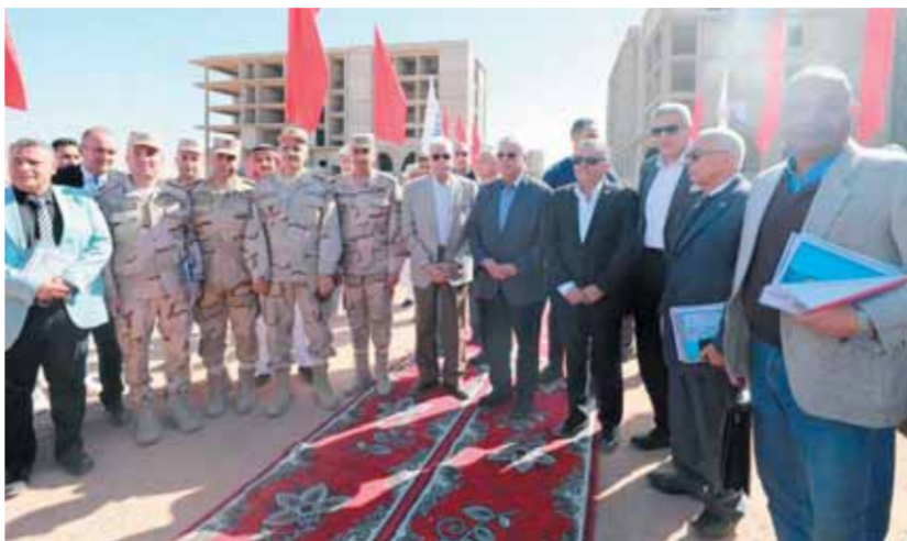
جانب من جولة الوزير