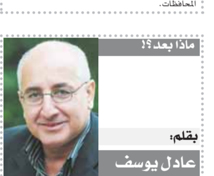
بقلم: عادل يوسف

تذكرت هذا الفيلم وأنا أتابع زيارة الدكتور خالد عبدالغفار وزير الصحة والسكان يوم السبت الماضي، مع اختلاف التفاصيل تماماً. إذ نادى لم يستعن الجهاز الطبي بالأدوات الخاصة لتأهيل اللاعب وعلاجه؟! كل هذه التساؤلات تضع اتحاد الكرة في قصص الاتهام، خصوصاً مع غياب الشفافية والمكاشفة، مما يؤكد أن الحالة التي وصل إليها المنتخب في كافة الأعمار والكرة المصرية بشكل عام ليست من فراغ. أما صلاح نفسه فقد تحول إلى مادة للاقتقاد والسخرية من الجماهير المصرية، التي وصفته بأنه يقفز من المركب، بينما دافع قطاع آخر عنه بحجة أنه يحمي نفسه من الإصابات الطويلة والمسؤول عن هذا الأمر هو اتحاد الكرة الذي لم يوفر الإمكانيات الكافية والذي كان في غفلة من أمره وتحدث فقط بعد أن خرج كلوب وكشف عن الأتفاق.