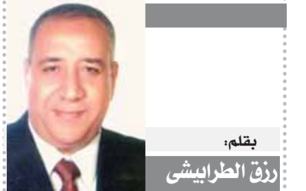
بقلم: زكي الحرابي