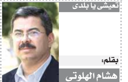
بقلم: هشام الهوتي

قطط، وأداء اللاعبين برضيني، ولدى ٢٣ لاعبا كلهم جاهزون للمشاركة، لذلك فالتدوير ضرورة، وأحد التشكيل في التدريب الذي يسبق المباراة. ويحتل منتخب أستراليا وصافة المجموعة برصيد ٤ نقاط، ويأتي منتخب عمان في المركز الثالث بنقطة واحدة، ويتبدل فيرغيزستان المجموعة بلا رصيد من النقاط. فقط، وأداء اللاعبين برضيني، ولدى ٢٣ لاعبا كلهم جاهزون للمشاركة، لذلك فالتدوير ضرورة، وأحد التشكيل في التدريب الذي يسبق المباراة. ويحتل منتخب أستراليا وصافة المجموعة برصيد ٤ نقاط، ويأتي منتخب عمان في المركز الثالث بنقطة واحدة، ويتبدل فيرغيزستان المجموعة بلا رصيد من النقاط.