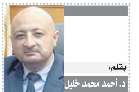
بقلم: د. أحمد محمد خليل