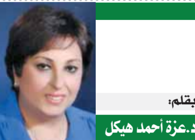
بقلم: د.عزة أحمد هيكل