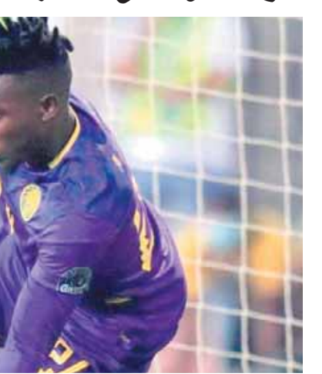
بقلم: محمد عبد الهادي

..والسنغال تسعى لتصدر المجموعة على حساب غينيا