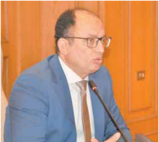
د. السيد قنديل

وقام الدكتور السيد قنديل رئيس جامعة حلوان، بجولة تفقدية لعدد من كليات الجامعة لمتابعة سير الامتحانات،