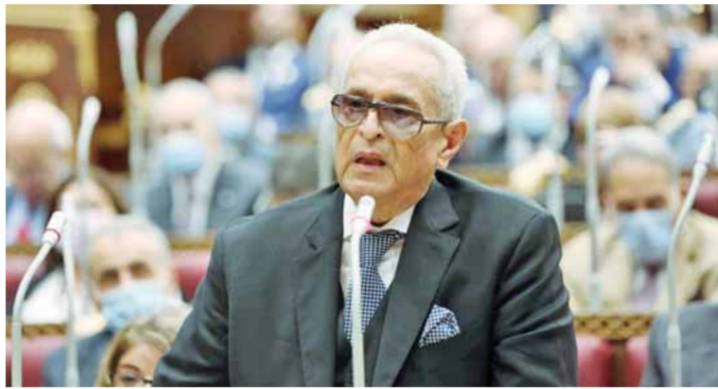
المستشار بهاء الدين أبوشقة وكيل أول مجلس الشيوخ يؤكد ضرورة الالتزام بضمان حقوق المسنين

تناسب مع قدراتهم، توفير التأهيل والتدريب والتوعية والإرشاد والمساندة اللازمة لأسر المسنين، تسير سبل إنجاز تعاملات المسنين أمام الجهات والهيئات القضائية. وقال «أبوشقة» وكيل أول مجلس الشيوخ والمستشار بهاء الدين أبوشقة وكيل أول مجلس الشيوخ موافقته من حيث المبدأ على مشروع قانون حقوق المسنين.