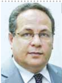
بقلم: علاء عريبي