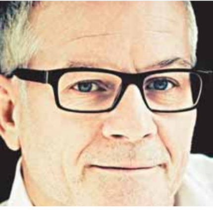
كثبت - دينا دياب،

يكرم مهرجان القاهرة السينمائي الدولي، الفرنسي تيري فريمو، مدير مهرجان «كان» السينمائي، خلال فعاليات الدورة ال ٣٤، التي تقصنا عنها أيام قليلة، حيث من المقرر أن تقام في الفترة من ٦٢ نوفمبر الجاري، وحتى ٥ ديسمبر المقبل.