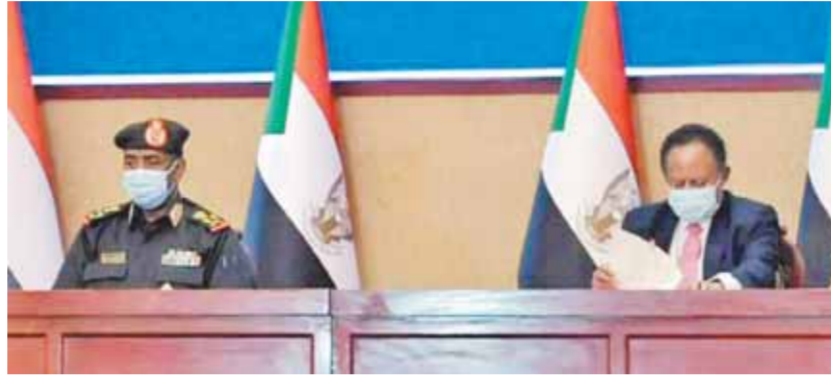
توقيع الاتفاق بين البرهان وحمدوك

وقال حمدوك: «إننا قادرون دائماً على العودة بالسودان للمسار الصحيح، وهدفنا هو حقن دماء الشعب السوداني». وأضاف حمدوك خلال توقيع اتفاق بالقصر الرئاسي: إن التوقيع على الاتفاق يعالج كل قضايا المرحلة الانتقالية، ومصصلحة السودان هي أولوية. وأضاف: تستعمل على توحيد كل القوى السودانية بنظام ديمقراطي راسخ. والتزم الاتفاق أيضاً على تنفيذ اتفاق سلام جوبا واستكمال استحقاقاته، فضلاً عن ضمان انتقال السلطة لحكومة مدنية في موعدها. وتضمن الاتفاق على إنفاذ الشراكة بثقة مع الالتزام بتكوين حكومة مدنية مستقلة تكتفياً، والتأكيد على ضرورة تعديل الوثيقة الدستورية بالتوافق بما يحقق مشاركة سياسية شاملة لكل مكونات المجتمع عدا حزب المؤتمر الوطني المنحل، وضمان انتقال السلطة الانتقالية في موعدها المحدد لحكومة مدنية منتخبة.