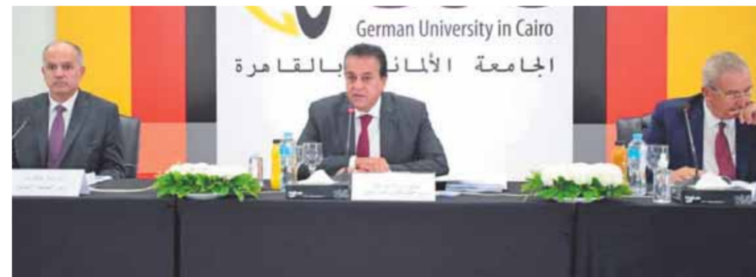
دكتور خالد عبدالغفار خلال رئاسته اجتماع مجلس الجامعات الخاصة والأهلية

القوة والضعف في هذا النظام واستخلاص أهم الدروس المستفادة لتقويم هذه التجربة الجديدة، مطالباً بأن تقدم هذه اللجنة مقترحاتها لتطوير نظام القبول الإلكتروني للمجلس في اجتماعه القادم.