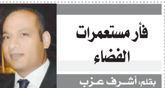
فأر مستعمرات الفضاء