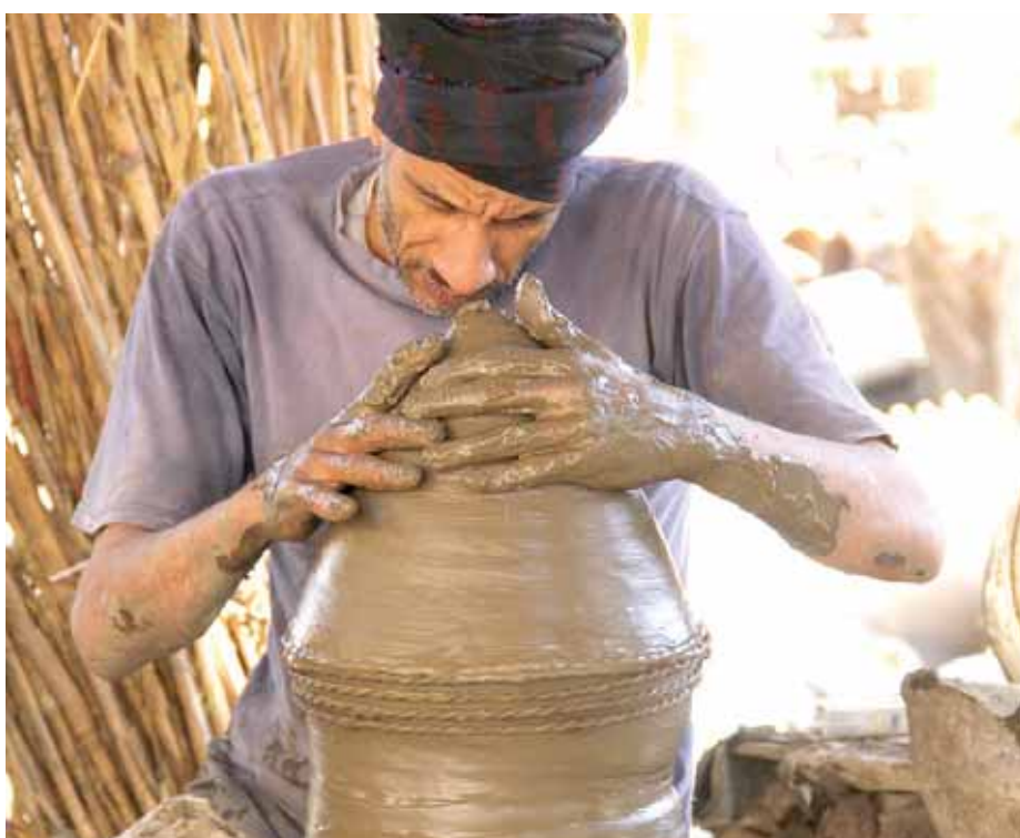
المحافظ يتفقد محتوى القافلة

كتب- سيد الشورة: يشعر الفخارون « فى مصنع الفخار بقرية النزلة بمحافظة الفيوم بالخوف من إزالة افران الفخار التراثية القديمة بالمصنع واستبدالها بأخرى حديثة بعد ان فوجئوا بقيام أحد المشروعات التنموية ببناء أفران للفخار بالمصنع غير ملائمة للطبيعة التراثية للأفران القديمة التى توارثوا بنائها عبر مئات السنين. والتي على ضفاف مصرف الوادى الذى يحتضنها تم تصوير اعظم افلام السينما المصرية دعاء الكروان والبوسطنجي وممسلسل كابتن جودة وحلقات من سر الارض وكان اخر ما تم تصويره اغنية «بنت اكابر» للفنانة اصالة. واكدوا ان الأفران مبنية من مواد طبيعية متوافقة مع شكل المكان وانه سبق ان تم تنمية مصنع الفخار بعمل مركز زوار به بعد الاستعانة بمهندسين وخبراء