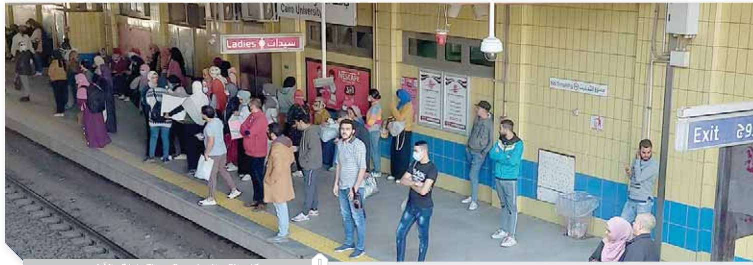
ركاب المترو ببعض يرتدى الكمامات والآخر بدون

الشركة قامت بحملات بعدد من محطات الخطوط الثلاثة، مشيراً إلى أن عدداً كبيراً من المواطنين غير ملتزمين بارتداء الكمامات، حيث يقوم المواطنون بارتداء الكمامة حتى المرور من مكبات التذاكر. وأكد عبدالهادي في تصريحات له للوفد، أن شركة المترو تقوم دائماً بتوعية الركاب عبر الإذاعات الداخلية بالمحطات، مشدداً على تطبيق الغرامة التي تصل إلى ٤ آلاف جنيه على الركاب المخالفين لقرار ارتداء الكمامة، مشدداً على أنه لا يسمح لأي راكب بدخول محطات مترو الأنفاق إلا مرتدياً الكمامة، ويوجد عدد من المفتشين