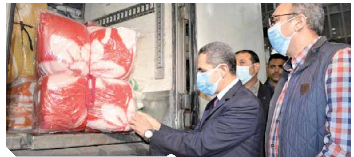
المحافظ يتفقد محتوى القافلة

والتنمية الاقتصادية والرعاية الصحية للأسر الأولى بالرعاية، وذلك بتحويل دخلات قيمته مليار جنيه على مستوى الجمهورية.