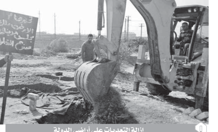
إزالة التعدييات على اراضي الدولة