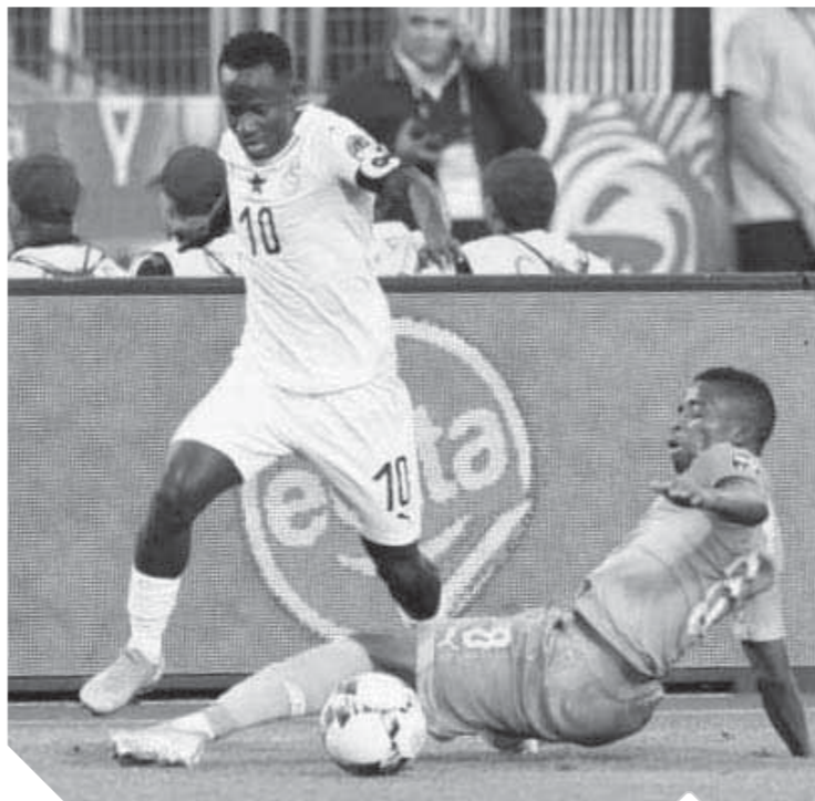
ياه ييواه يقود غانا أمام جنوب أفريقيا

حدد الاتحاد الأفريقي لكرة القدم «كاف» يوم ١٤ فبراير المقبل موعداً لإقامة لقاء كأس السوبر الأفريقي الذى يجمع بين الزمالك بطل الكونفيدرالية الأفريقية والترجي التونسى حامل لقب دوري أبطال أفريقيا. وعقد المكتب التنفيذي لل كاف اجتماعاً مهماً أمس الخميس فى مصر حدد خلالها موعد لقاء السوبر وتقرر إقامته فى قطر. وناقش كاف أيضاً عدة ملفات مهمة على رأسها أزمة الرعاية مع شركة لاجاردير الفرنسية بعد فسخ العقد بجانب مناقشة المرشحين لجائزة أفضل لاعب فى قارة أفريقيا للعام الجارى وأيضاً حسم موعد ومكان اللقاء النهائى ببطولتي دوري أبطال أفريقيا والكونفيدرالية.