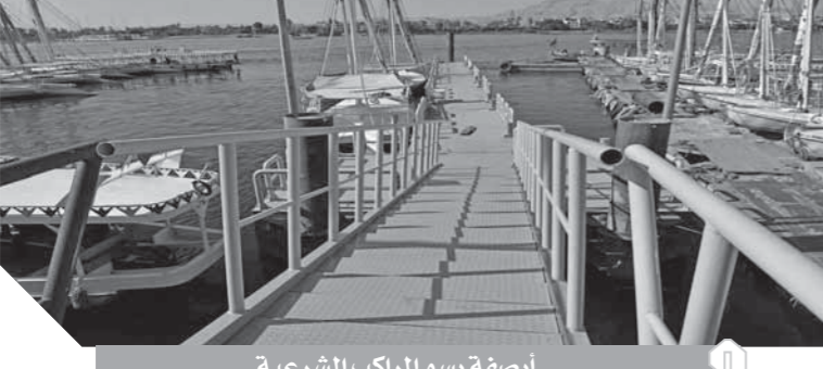
أرضية رسو المراكب الشرعية

يأتي هذا تزامناً مع أعمال التطوير التي تجري على أرض المحافظة في العديد من القطاعات وعلى رأسها القطاع السياحي، والتي تشمل تطوير كورنيش النيل العلوي والسفلي، وكذلك تطوير