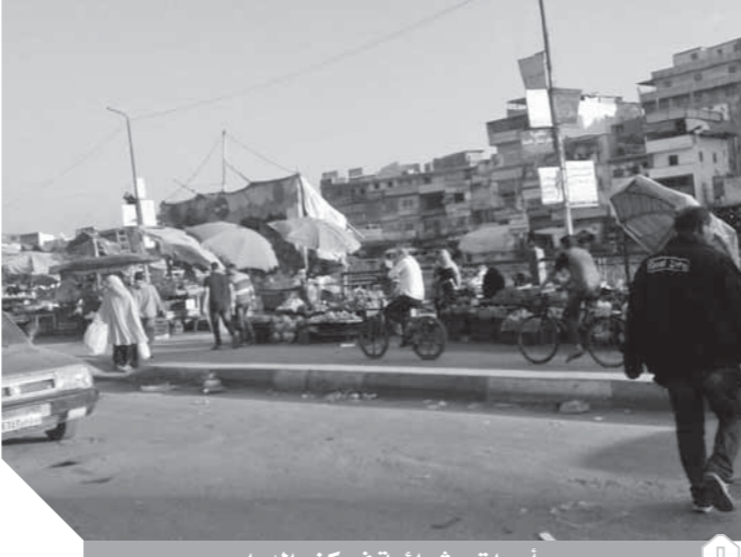
أسواق عشوائية فى كفر الدوار