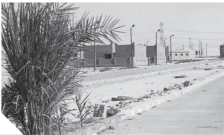
قرية السلام جاهزة منذ ١٧ عاماً وما زالت بدون سكان