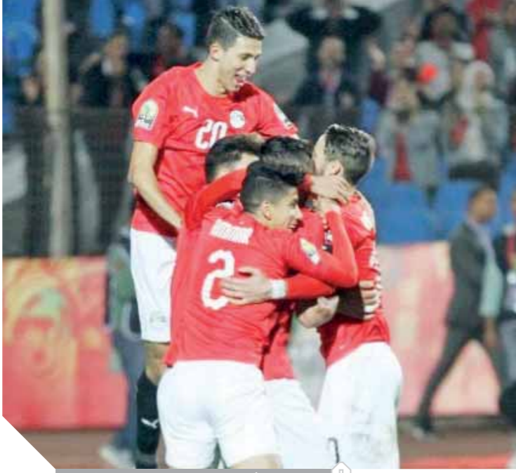
فرحة الأبطال

على حساب فريق كوت ديفوار الذي يلعب كرة جماعية رائعة ومنظم جيداً من الناحية الدفاعية. ومن المنتظر أن يخوض الفراعنة المباراة بتشكيل يضم الحارس محمد صبحي، وفي الدفاع أسامة جلال ومحمد عبدالسلام وأحمد رمضان «بيكام»، وعلى الجانبيين كريم العراقي وأحمد فتوح، وفي الوسط أكرم توفيق وعمر حمدي وأمامهما عبدالرحمن مجدي ورمضان صبحي ويقود الهجوم مصطفى محمد.