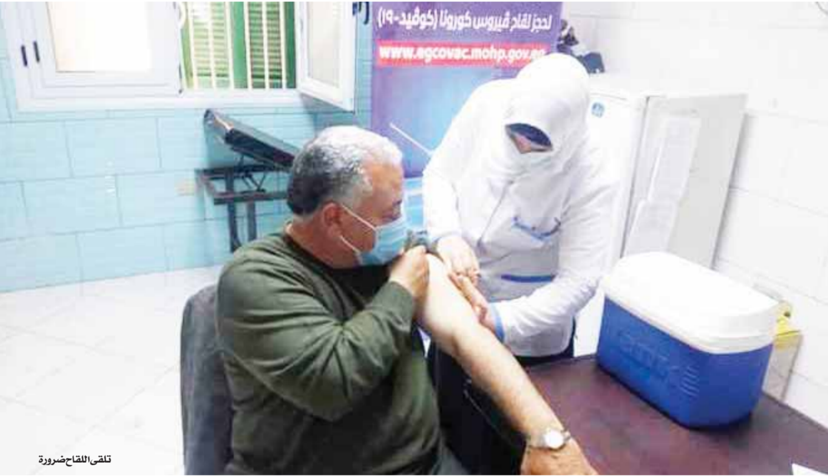
تلقي اللقاح ضرورة