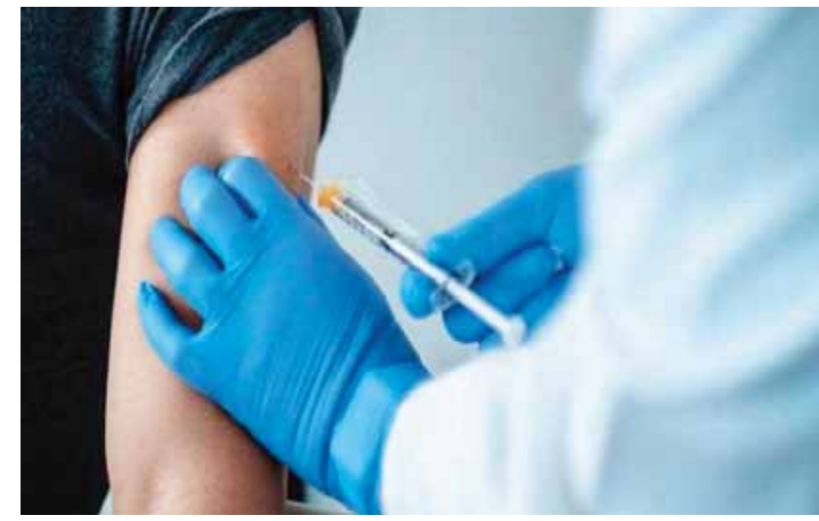
٦ شائعات تبث الخوف من اللقاح

شهادة التطعيم شرط دخول المصالح الحكومية من الشهر المقبل