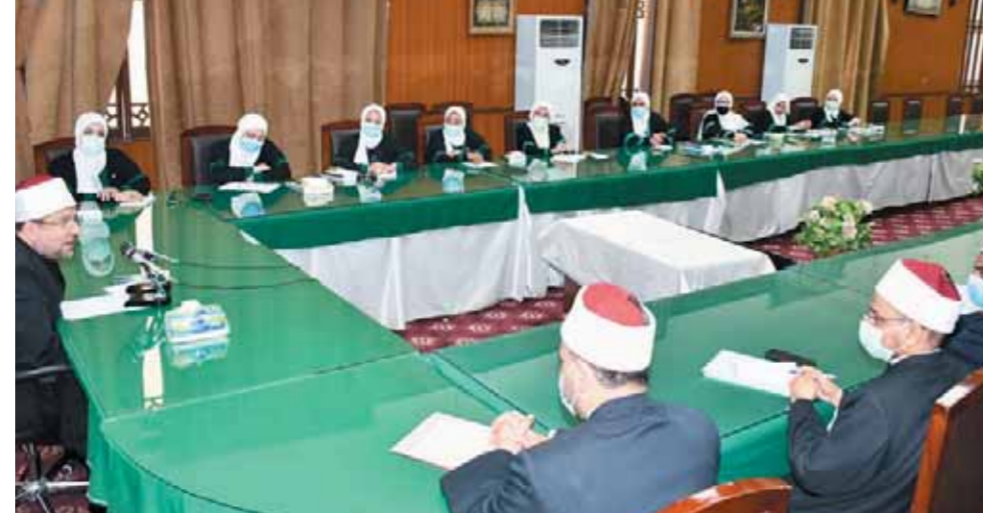
وزير الأوقاف خلال لقائه بأعضاء القافلة الدعوية المتوجهة إلى السودان

كتب- سناء حشيش، التقى الدكتور محمد مختار جمعة، وزير الأوقاف، أمس، أعضاء القافلة الدعوية المتوجهة إلى دولة السودان من الأئمة والواعظات مطلع شهر نوفمبر المقبل ٢٠٢١ وذلك بقاعة حراء بديوان عام وزارة الأوقاف. وذلك في إطار استعداد القافلة الدعوية الثانية للسفر إلى دولة السودان الشقيق.