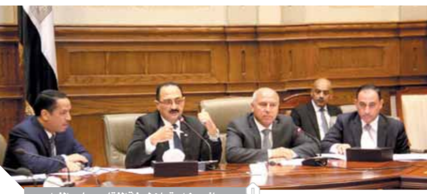
جانب من اجتماع لجنة النقل بمجلس النواب

لعمليات التطوير ولا تقع في حوزة الهيئة، أكد كامل الوزير أنه سيتم نزع ملكيتها وتعويض أصحابها وفقاً للقانون. وأشار إلى أن مشروعات الشبكة القومية طولها 1200 كيلومتر وهي ليست مطلوبة في الوقت الحالي، لذلك التركيز سيكون على الطرق بين المحافظات. وتابع الوزير يا ريت نهدى على مشروعات الشبكة القومية شوية، لحين الانتهاء من الطرق التي تحتاج للانتهاء، والانتهاء من تنفيذ محاور النيل والطرق الرئيسية، قال الوزير: «لما تجيك الموازنة خلوا مخصصات وزارة النقل 26 مليار جنيه مش 9 مليارات بس»، وفيما يتعلق بتحسين الموارد، أشار إلى أن جراج رمسيس كان يتم تأجيله 30 ألف جنيه في