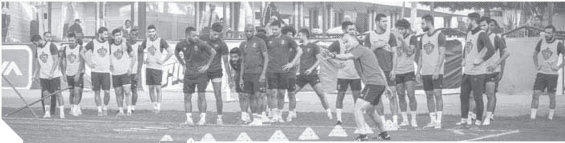
الأهلى يتدرب لحين حسم مصير لقاء الجونة