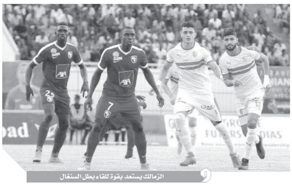
الزمالك يستعد بقوة للقاء بطل السنغال

ظل الظروف التى أدت إلى إعادة اللقاء وسنواجه منافساً عنيدا يسعى هو الآخر لتأهل إلى دورى المجموعات مشيراً إلى أن الفوز على المقاولون العرب سيكون له مردود إيجابى على لاعبي الزمالك رغم اختلاف اللغات المحلية عن الإفريقية. على جانب آخر رفض المستشار مرتضى منصور ما تردد من وجود اقتراح إقامة القمة يوم ٢٨ أكتوبر وأصفا ذلك بأنه تهريج، مشيراً إلى أن الوضع الأمنى فى مصر مازال لا يسمح بإقامة المباراة. وهدد رئيس نادى الزمالك بالانسحاب من بطولة الدورى فى حال إلغاء مواجهة الأهلي والجونة المقرر لها غد الأربعاء، مشدداً على أن اللاتحة واضحة وفريق الزمالك واجه المقاولون احتراماً لقرارات اتحاد الكرة وكذلك احتراماً لقرار الأمن. وكشف «مرتضى» عن أنه تم إرسال خطاب رسمى إلى الاتحاد الإفريقى يتضمن أسباب رفض الزمالك لعب السوبر الإفريقى فى قطر حيث إن العلاقات الدبلوماسية مقطوعة بين البلدين فى ظل دعم الإرهاب والبيء الهاربين من مصر والحملات المسعورة الموجهة ضد مصر من خلال القنوات الفضائية التى تدعمها قطر، وطالب الخطاب بأن يقوم الكاف بمراجعة الأمر حرصاً على إقامة المباراة لتكون احتفالية إفريقية.