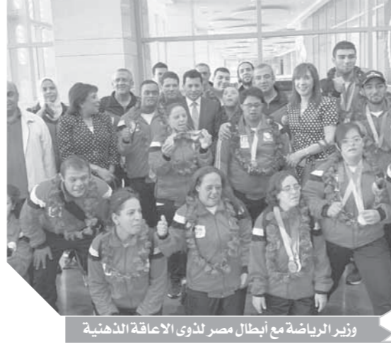
وزير الرياضة مع أبطال مصر لذوى الإعاقة الذهنية

كتب - عادل يوسف: استقبل الدكتور أشرف صبحي وزير الشباب والرياضة، صباح أمس الاثنين بمطار القاهرة الدولى، لاعبي مصر الذين شاركوا فى بطولة العالم للاعبين من ذوى الإعاقات الذهنية التى أقيمت فى الفترة من ١٢ حتى ١٩ أكتوبر بآستراليا. وحقق لاعبو مصر ١٤ ميدالية متنوعة فى البطولة متمسكين إلى ٨ ميداليات فى ألعاب القوى بواقع ٦ ذهب، وميدالية فضية وميدالية برونزية، و٤ ميداليات فى تنس الطاولة بواقع فضيتين وبرونزيتين، وميدالية فضية وأخرى برونزية فى منافسات السباحة. وحرص وزير الشباب والرياضة على تهنئة جميع لاعبي مصر من ذوى الهمم والقدرات الخاصة، والإشادة بأدائهم المشرف فى بطولة العالم.