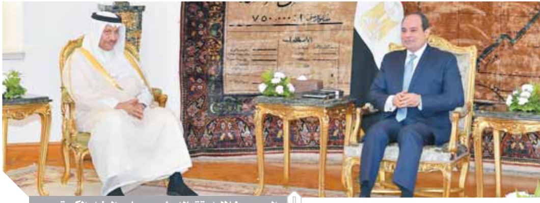
السيسي خلال استقباله رئيس مجلس الوزراء الكويتي

الكويت، معرباً عن خالص تمنياته بموفق الصحة والعافية للعاهل الكويتي. كما أشاد السيبي بمتانة وقوة العلاقات المصرية الكويتية وما تتميز به من خصوصية، مؤكداً حرص مصر على تطوير التعاون الوثيق والتميز بين البلدين على شتى الأصعدة، بما فيها تعزيز العلاقات التجارية والاقتصادية، بالإضافة إلى جذب المزيد من الاستثمارات الكويتية إلى مصر، خاصة خلال التعاون بين الصندوق السيادي الكويتي والمصري. وأضاف المتحدث الرسمي أن سمو الشيخ جابر الصباح سلم الرئيس رسالة خطية من الشيخ صباح الأحمد الجابر الصباح أمير دولة الكويت، تضمنت نقل التحيات إلى