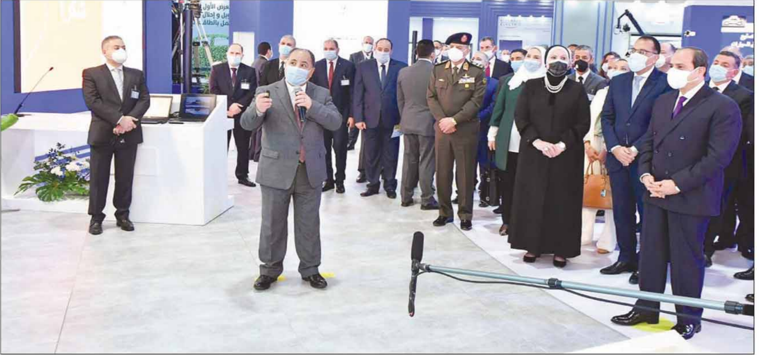
■ الرئيس السيسي يتابع بنفسه كل المشروعات من أجل غد أفضل لمصر والمصريين

التطبيق الإلزامي للمنظومة الجديدة بالموانئ البحرية.. أول أكتوبر المقبل السياسي: تطبيق المعايير الأوروبية.. وعدم السماح بدخول أى بضائع رديئة