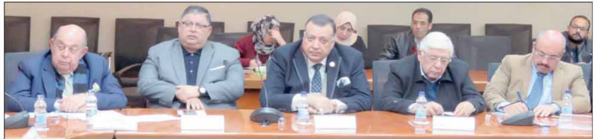
مد جسور التواصل مع مجتمع الأعمال

في حالة أن الشركة المصدرة تقوم فقط باستخراج الفاتورة المبدئية والفاتورة النهائية لكن باقي المستندات «البوليصة، والمنشأ، والشهادات الصحية، وبيان العبوة، تكون باسم المنتج فما هو الاسم الذي يتم تسجيله في النظام الجديد «ACI»؟ العبارة بالنص وليس المنتج. ماذا يحدث إذا لم يتم التحقق من رقم المتعاملين «رقم الشركة»، رغم أن الرقم صحيح؟ يجب الرجوع إلى إدارة المتعاملين بمصلحة الجمارك للتحقق من صحة البيانات للشحن من إنهاء عملية التسجيل على منصة «نافذة».