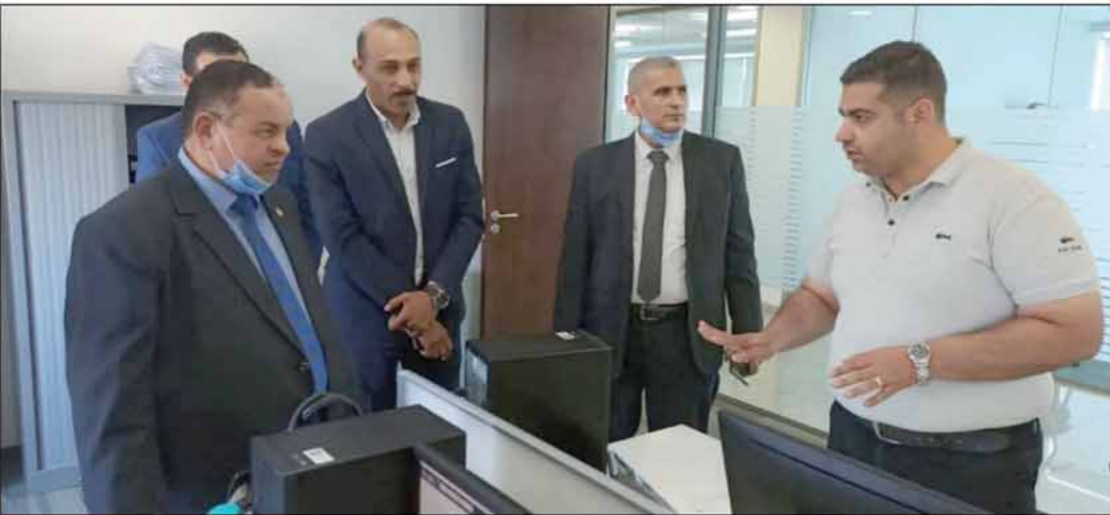
رئيس مصلحة الجمارك يتابع سير العمل بإحد المراكز اللوجيستية

مسار سريع بكل مركز لوجيستي.. وأولوية الإفراج المسبق.. وكشف فوري لأي شهادات بأرقام «ACID»