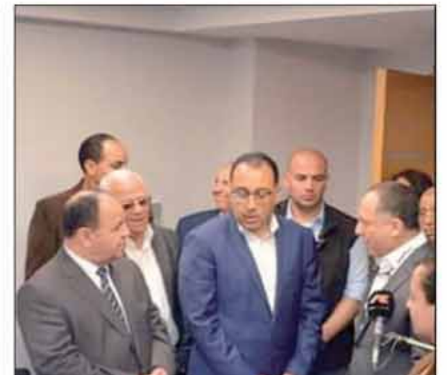
■ وزير المالية في جولات المتابعة الميدانية لأحد المراكز اللوجيستية

يحظى بدعم كبير ومتابعة دقيقة من الرئيس عبدالفتاح السيسي، بهدف تحويل مصر إلى منطقة لوجيستية عالمية متطورة، تركز على التوظيف الأمثل للتكنولوجيا الحديثة في تعظيم الاستفادة من المواقع الجغرافية المتفرد، وتسهيل حركة التجارة الداخلية والخارجية بالاعتماد على المنصة الإلكترونية الموحدة 'نافذة'، التي تربط جميع المنافذ الجمركية إلكترونياً، من خلال استحداث المراكز اللوجيستية؛ بما يسهم في تبسيط ورقمنة الإجراءات، وتقليص زمن الإفراج الجمركي، لافتاً إلى أننا نستهدف إنهاء إجراءات الإفراج مباشرة قبل وصول البضائع، بحيث تكون الموانئ بوابات للعبور، وليست أماكن للتخزين؛ على نحو يسهم في تحسين ترتيب مصر بمؤشرات التنافسية الدولية.