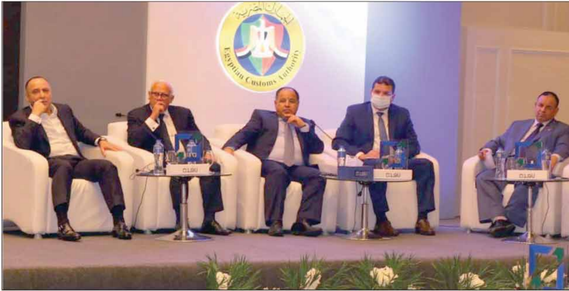
■ وزير المالية خلال رئاسته لاجتماع مؤتمرات شرح منظومة التسجيل المسبق للشحنات «ACI»

بدأ التنفيذ التجريبي لنظام التسجيل المسبق للشحنات «ACI» في الأول من أبريل ٢٠٢١، وكان من المقرر بدء التطبيق الإلزامي في الأول من يوليو ٢٠٢١، لكن تم مد فترة التنفيذ التجريبي حتى ٣٠ سبتمبر ٢٠٢١، وذلك لمنح المستوردين ووكلائهم من المستخلصين الجمركيين والشركات المصدرة لمصر والشركات العالمية متعددة الجنسيات فرصة أخيرة للتسجيل بالمنظومة الجديدة قبل التطبيق الإلزامي، وإجراء المزيد من التجارب لتحقيق التناغم المنشود بين المستوردين والمتعاملين معهم من المصدرين الأجانب.