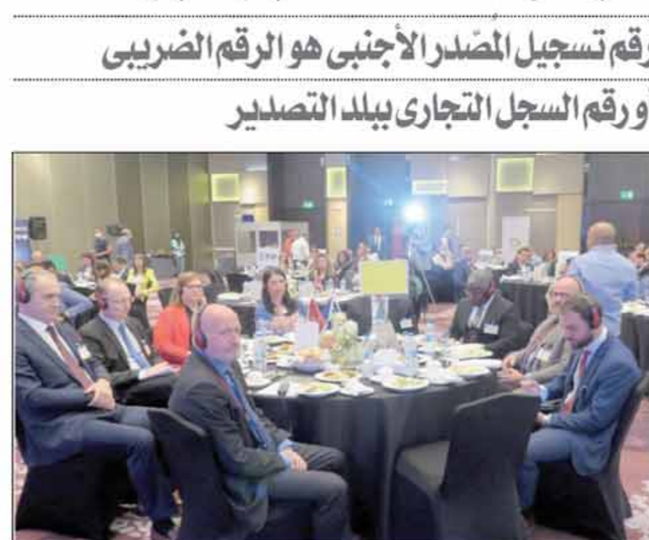
جانب من أحد اللقاءات الحوارية مع مجتمع الأعمال