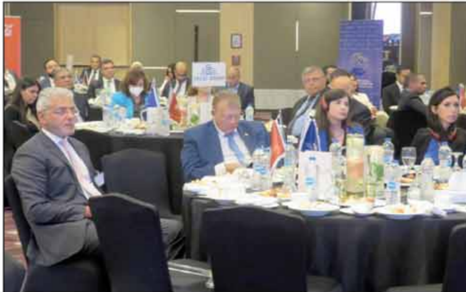
■ منصات حوارية مستمرة لوزارة المالية مع مجتمع الأعمال