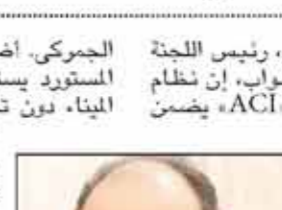
■ النائب أحمد سمير

قال النائب أحمد سمير، رئيس اللجنة الاقتصادية بمجلس النواب، إن نظام التسجيل المسبق للشحنات «ACI» يضمن مزايا عديدة للمستوردين أبرزها توفير تيسيرات في إجراءات الإفراج الجمركي وضمان جودة البضائع، بدلاً من تراكم البضائع في الميناء، وسداد العديد من الغرامات والأرضيات؛ بما يُزيل أعباء كثيرة عن كامل التجار أو المستوردين، حيث يضمن نظام التسجيل المسبق للشحنات معرفة المستوردين للمستندات المطلوبة بشكل كامل، ويقدمها للجهات المختصة وتصدر الموافقة أو الرفض قبل نقل الشحنة ووصولها إلى المنافذ الجمركية المصرية؛ بما يحقق سهولة وسرعة إنهاء إجراءات الإفراج