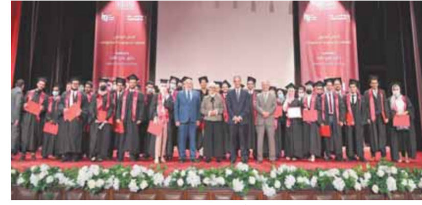
جانب من المشاركين في الحفل الختامي

شهد الدكتور عمرو طلعت، وزير الاتصالات وتكنولوجيا المعلومات، ختام أعمال العام التدريبي ٢٠٢١/٢٠٢٠ لمعهد تكنولوجيا المعلومات ITI، بحضور عدد كبير من المسؤولين في الوزارة والمؤسسات التعليمية والشركات. أكد الدكتور طلعت أن الوزارة وضعت خطة استراتيجية لبناء القدرات الرقمية تستهدف مجتمع رقمي متكامل، وأن الوزارة ضاعفت ميزانية بناء القدرات الرقمية ٢٢ ضعفا لتصل إلى مليار و١٠٠ مليون جنيه. كما أشار الوزير إلى أن الجانب قد خلقت فرصاً متميزة للأفراد والدول ومن بينها مصر لتسريع وتيرة التحول الرقمي، سواء من خلال تطوير البنية التحتية، أو رقمنة المزيد من الخدمات، أو نشر استخدامات التكنولوجيا البازغة مثل الذكاء الاصطناعي وسلاسل الكتل وإنترنت الأشياء.