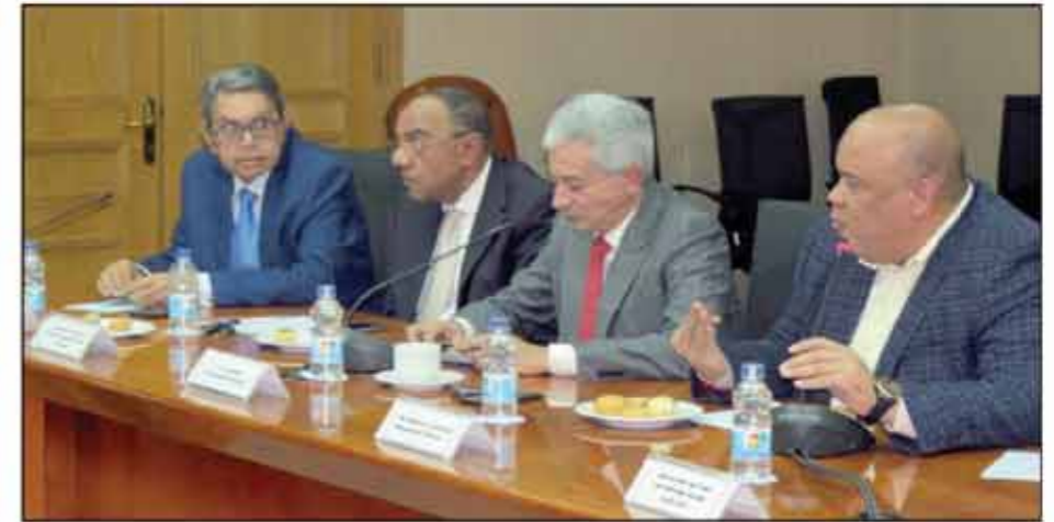
وزير المالية يحرص على الاستماع إلى مجتمع الأعمال