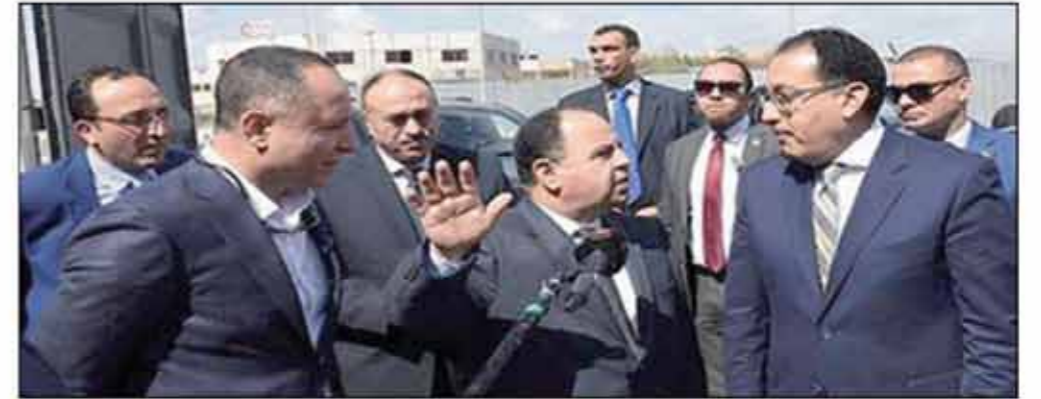
رئيس مجلس الوزراء يتابع تنفيذ المشروع القومي لتحديث وميكنة المنظومة الجمركية

صرح د. مصطفى مدبولي، رئيس مجلس الوزراء، بأن الحكومة تعمل جاهدة على تطوير جميع النظم الحالية، ومن بينها، المنظومة الجمركية من خلال تطبيق نظام التسجيل المسبق للشحنات «ACI»، وأنها سعت خلال الفترة الماضية للعمل على دخول المنظومة حيز التنفيذ الذي بدأ تجريبياً في الأول من أبريل الماضي، من أجل تقليل الوقت اللازم لدخول الشحنات لمصر، مؤكداً أنه لن يتم تأجيل التطبيق الإلزامي بهذه المنظومة