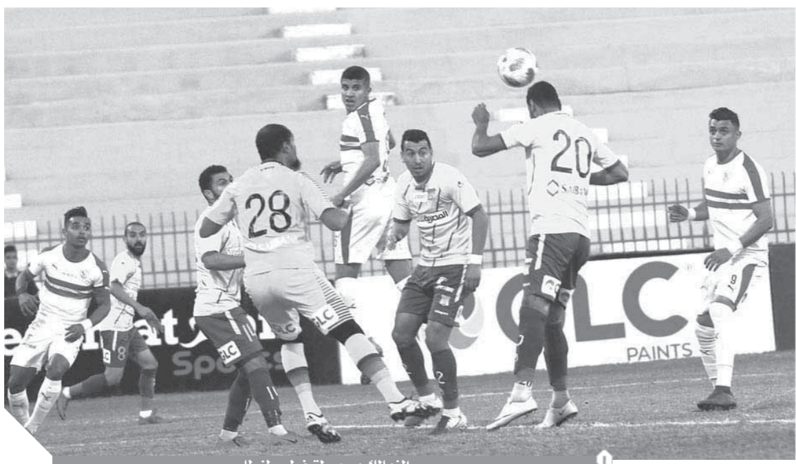
الزمالك يسعى لتخطى طنطا