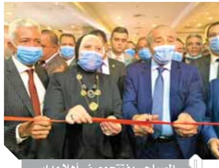
المصليحي يفتتح معرض أهلاً مدارس

المدرسية، ولضمان توفير المستلزمات بأسعار أقل من مثيلاتها فى الأسواق الأخرى. وأشار الوزير إلى ارتفاع نسبة الخصومات على المعروض سواء المستورد أو المحلى بخصوصيات أكثر من ٢٠٪، وأن أكثر المنتجات المعروضة بالمعرض صناعة مصرية.