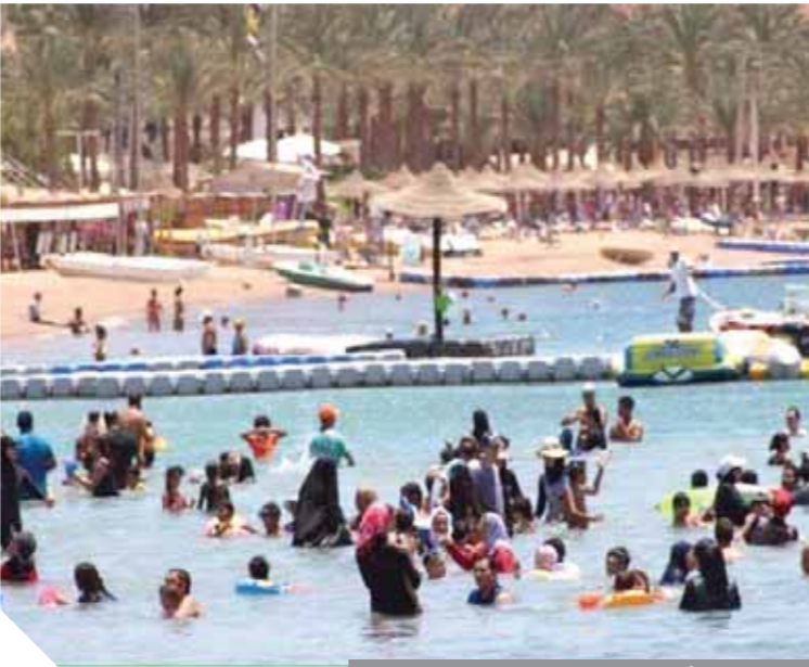
السياحة الداخلية تنفذ الموقف خلال أزمة كورونا