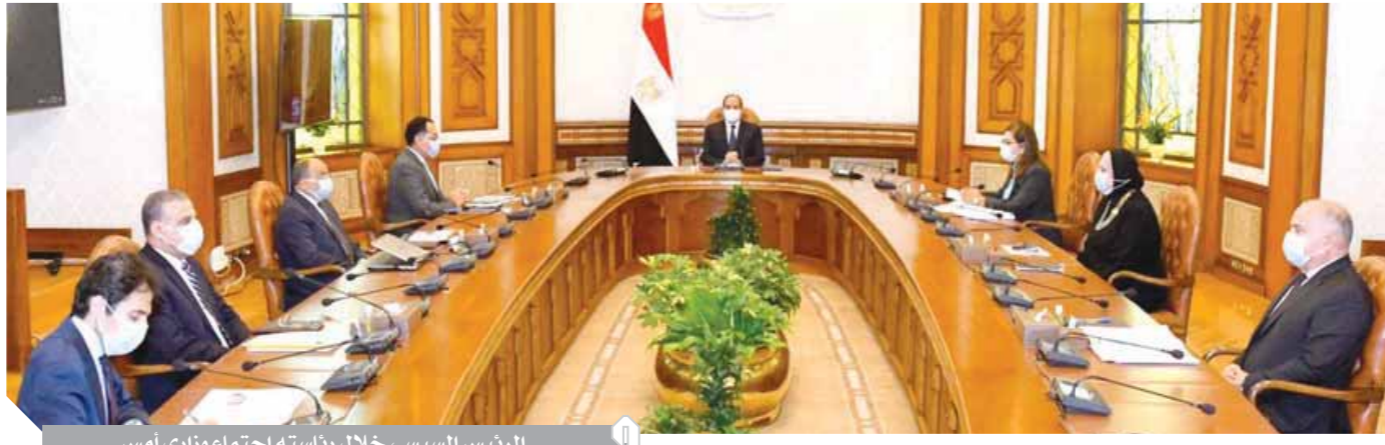
الرئيس السياسى خلال رئاسته اجتماع وزارى أمس

وعرض محمود شعراوى مستجدات الموقف التنفيذى لبرنامج تنمية الصعيد، مشيراً إلى أن إجمالي عدد المشروعات التى تم تمويلها بالمرحلة الأولى للبرنامج نحو ٢٧٠٧ مشروعات بالمحافظتين موزعة على قطاعات مياه الشرب والصرف الصحى والطرق والنقل وتغطية الترع والتنمية الاقتصادية وتدعيم الوحدات المحلية، كما قام البرنامج بتخصيص موازنة استثنائية لدعم الإجراءات الاحترازية والأنشطة الصحية لمواجهة تداعيات انتشار فيروس كورونا بمحافظة سوهاج وفقاً. كما أوضح وزير التنمية المحلية أنه جار الانتهاء من ترسية خطة المرحلة الأولى لمشروعات ترفيق المناطق الصناعية المستهدفة، حيث أسهمت المشروعات التى قام البرنامج بتفنيدها بالمحافظتين فى توفير نحو ٢٥٠ ألف فرصة عمل لأبناء المحافظة. وقد وجه الرئيس بالإسراع فى معدلات تنفيذ مشروعات البنية الأساسية فى إطار البرنامج، بما فيها مشروعات الطرق والصرف الصحى والكهرباء ومياه الشرب، فضلاً عن إيلاء الاهتمام اللازم فى هذا الإطار لتعزيز مفهوم التنمية الريفية المستدامة والتطوير الحضارى المتكامل لصالح أبناء محافظات وقرى الصعيد.