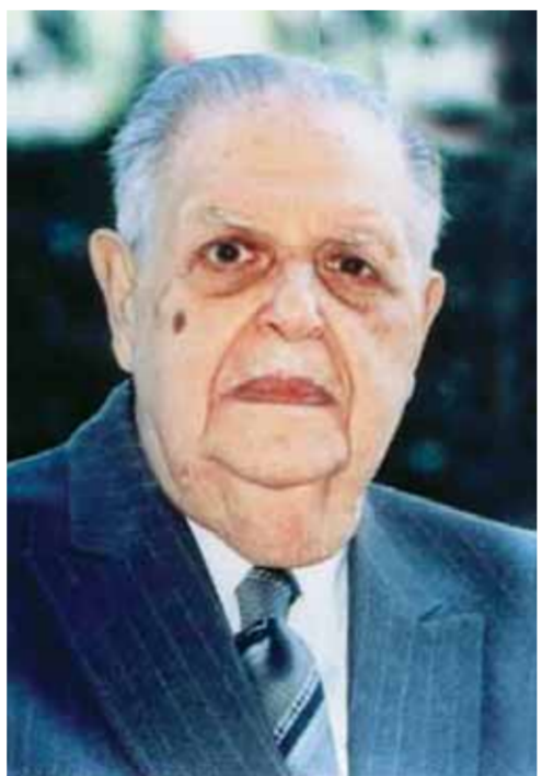
فؤاد سراج الدين