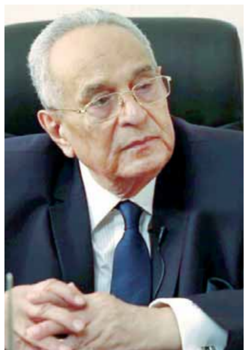
بهاء الدين أبو شقة