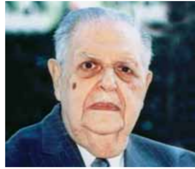
فؤاد سراج الدين