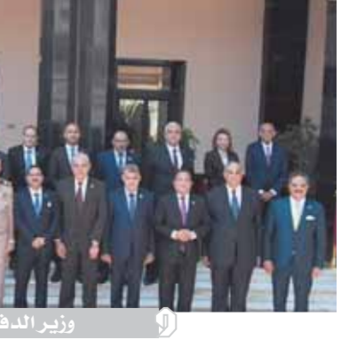
وزير الدفاع مع أعضاء لجنة الدفاع والأمن القومى بالنواب

وأشار الفريق أول محمد زكى بدور الأكاديمية وكلية القادة والأركان في تخريج قادة حملوا الأمانة وسجلوا في تاريخ مصر الوطنى والعسكرى بطولات والتضامات تحفظها ذاكرة الوطن، وأكدوا بعمقهم وتضحياتهم أن الجيش المصرى هو ركيزة القيم والمبادئ ومعانى الوطنية والشرف وإنكار الذات، مؤكداً أن القوات المسلحة أصبحت تتملك كل المقومات العلمية التي تمكثها من أداء مهامها بكل قوة، وستظل ذاتها قوية بعباء أبنائها وجهدهم، وبما يمكنه من خبرات علمية حديثة تعينهم على حماية الوطن وأمنه القومى.