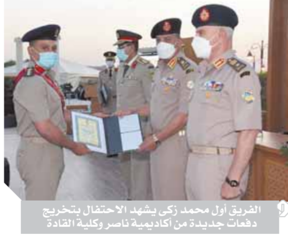
الفريق أول محمد زكى يشهد الاحتفال بتخريج دفعات جديدة من أكاديمية ناصر وكلية القادة

أكاديمية ناصر العسكرية العليا وكلية القادة والأركان تناولوا الإسهامات العلمية والبحوثية التي تقدمها الأكاديمية وكلية القادة والأركان، وما تم تنفيذه خلال العام الجارى من دورات تدريبية مختلفة لإعداد وتأهيل أجيال من قادة وضباط القوات المسلحة والمهندسين في المجالات العسكرية والسياسية والاقتصادية والاجتماعية والاستراتيجية والأمن القومى. وقام رئيس هيئة تدريب القوات المسلحة بإعلان نتيجة التخرج للدورات المختلفة بكل من أكاديمية ناصر العسكرية العليا وكلية القادة والأركان، أعقبه إعلان مدير إدارة شؤون ضباط القوات المسلحة قرار منح الدرجات العلمية وتقديم الأنواط لأول الخريجين، وقام الفريق أول محمد زكى القائد العام للقوات المسلحة بتقليد أوائل الخريجين نوط التدريب من الطبقة الثانية وتوزيع شهادات التقدير للمتخرجين من المدنيين تدبيراً لتفوقهم خلال دراستهم بالأكاديمية. وفي نهاية الاحتفال، نقل القائد العام للقوات