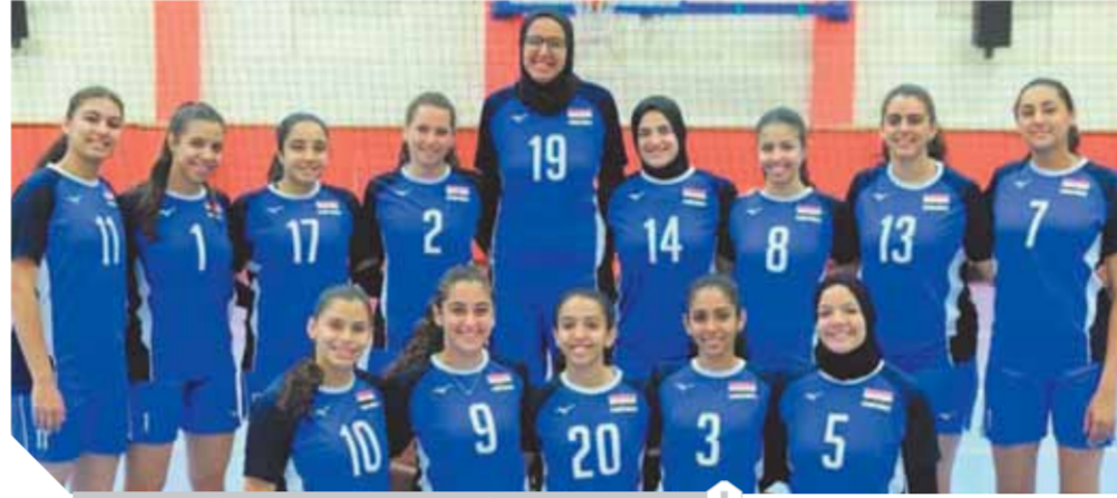
منتخب شابات الطائرة تحت ٢٠ سنة

فقد شهدت عملية اختيار اللاعبين للمنتخب المقرر مشاركته في بطولة العالم تحت ٢٠ سنة مفاجآت ومخالفات بالجملة بدأت مع تجاهل المدير الفني لكل القواعد عندما قام بضم ١٠ فتيات للمعسكر فوق الحد الذي حدده الإتحاد بخطابات رسمية وعددهم ٢٤ خطابا إلا أن المدير الفني الذي حول المنتخب إلى عربة خاصة قام بضم ١٠ لاعبات فوق العدد المحدد، ووقتها رفض رئيس الإتحاد هذا الموقف ولكن من الأمر دون حساب. ثم توالى المفاجآت مع بدء عملية التصفية للاعبات وظهرت المعاملات بشدة في مركز الليبرو بوجود لاعبة نادي الصيد الموجودة بالفعل في منتخب تحت ١٨ سنة ومعهما ثنائي النادي الأهلي وكل واحد من الثلاثي قصة محزنة، والوقت الذي تم استبعاد لاعبة وادي دجلة الموجودة في منتخب الكبار بالفعل