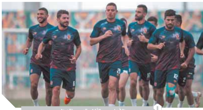
الأهلي يستأنف تدريباته اليوم