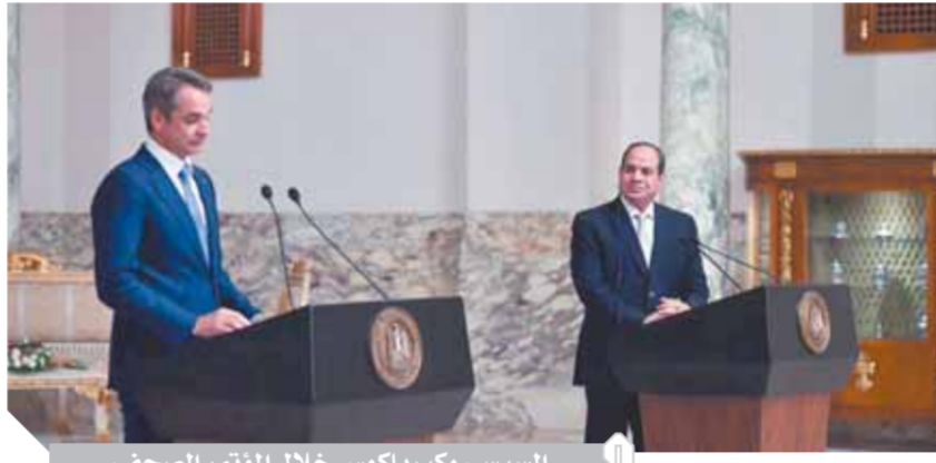
السياسي وكيرياكوس خلال المؤتمر الصحفي

كيرياكوس ميتسوتاكيس؛ اليونان ستظل أحد الداعمين لمصر داخل الاتحاد الأوروبى