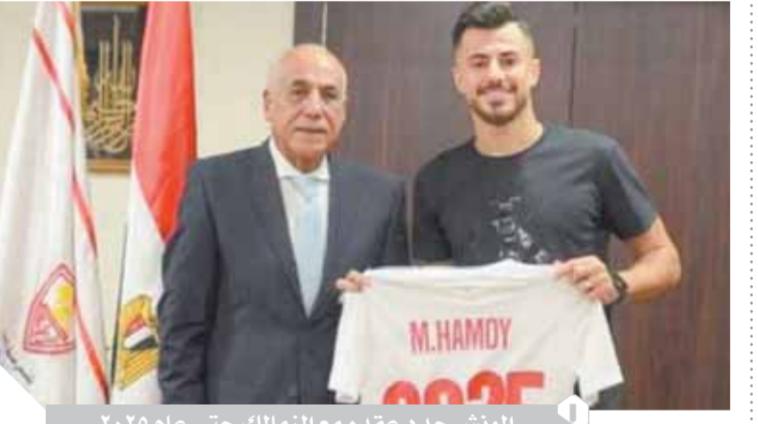
الوش جدد عقده مع الزمالك حتى عام ٢٠٢٥

كتب - محمد سعيد: يأمل المنتخب الكرواتي وصيف مونديال ٢٠١٨ في إنقاذ وضعه في بطولة أمم أوروبا «يورو ٢٠٢٠» عندما يواجه إسكتلندا في التاسعة مساء اليوم على ملعب هامبلن في الجولة الأخيرة من منافسات المجموعة الرابعة. وكانت كرواتيا خسرت في الجولة الأولى من إنجلترا بهدف سجله رحيم ستيرلينج، قبل أن ينقذ بيرزيتش فريقه ويسجل هدف التعادل في لقاء التشيك، ليحافظ بفرصته في بلوغ الأدوار الإقصائية حال الفوز على إسكتلندا.