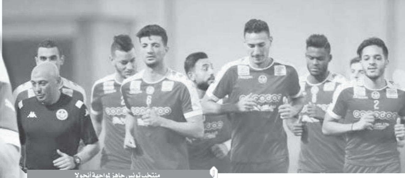
منتخب تونس جاهز لمواجهة أنجولا

ومن الطبيعي أن نستعد للمواجهة وفق ما تتطلبه خصال منافسنا، حتى نفرض أسلوبنا عليه من أجل تحقيق الانتصار، لأنه من المهم جداً أن نفوز في مباراتنا الأولى بالمسابقة الإفريقية». من ناحية أخرى، اجتمع مسئولو الاتحاد الإفريقي