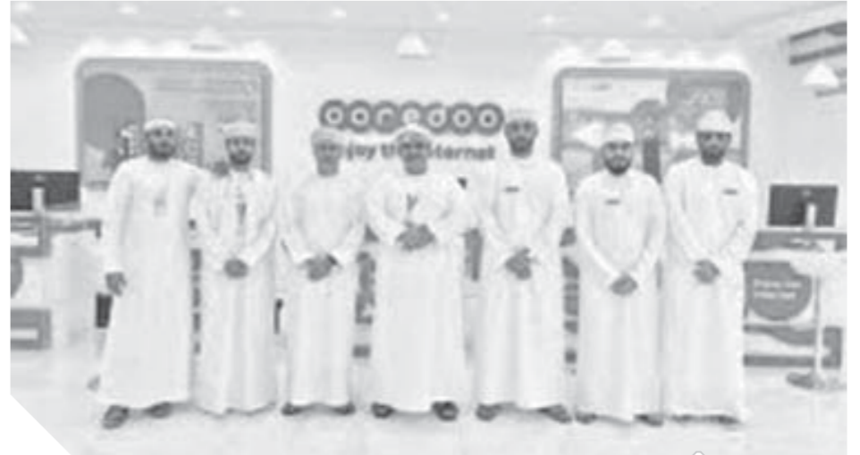
عقدت اللجنة المنظمة لفعاليات كرنفال المناطيد مؤتمراً صحفياً