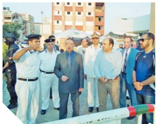
مدير أمن الإسكندرية خلال جولة تفقدية