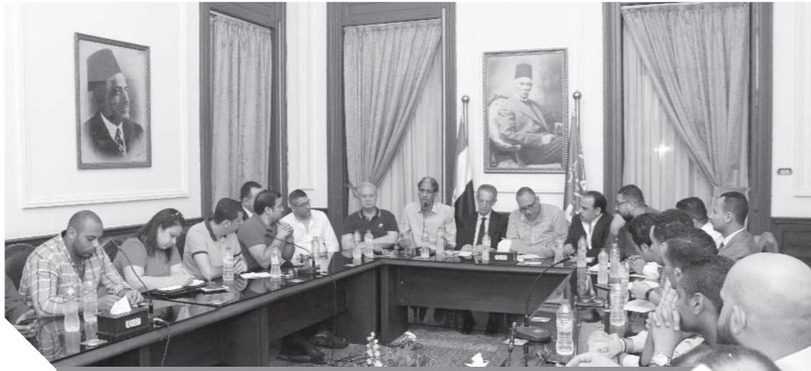
جانب من اجتماع اللجنة النوعية لشباب حزب الوفد بحضور عدد من القيادات