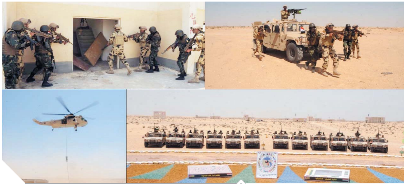
فعايات تدريبات دول تجمع الساحل والصحراء بقاعدة محمد نجيب العسكرية

كتب . محمد صلاح وأبو زيد كمال وسامية فاروق،