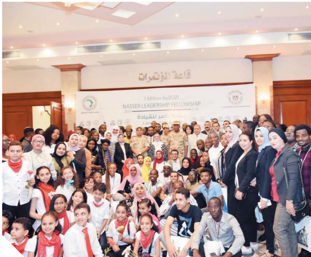
جانب من المشاركين فى الملتقى التثقيفى

كتب - محمد صلاح وأبو زيد كمال وسامية فاروق: