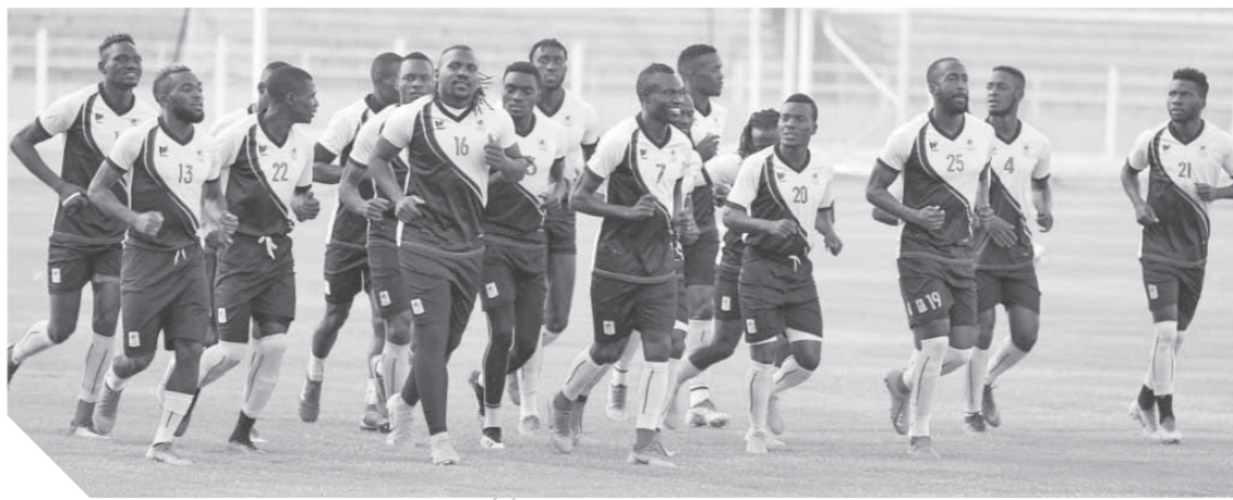
منتخب أوغندا استعداد بقوة للمباراة