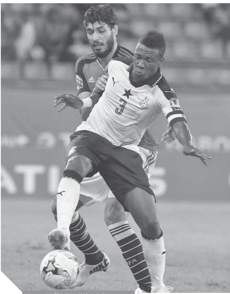
منتخب غانا وصل متأخراً