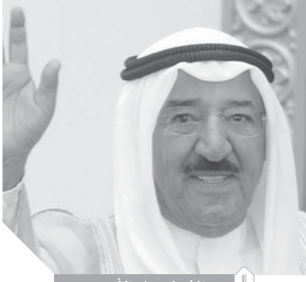
الشيخ صباح الأحمد

وفي بحر اللغة كثير وفير مما يستحق القراءة العميقة، ولكم أن تدققوا في كلامنا المصري الشعبي، من حيث المفردات والعبارة والأمثال والحكايات، وسوف تجدون ما نجد من عبقرية مصرية هذا الشعب الذي وصفه من قبل الزعيم جمال عبدالناصر بأنه «ملهم ومعلم».