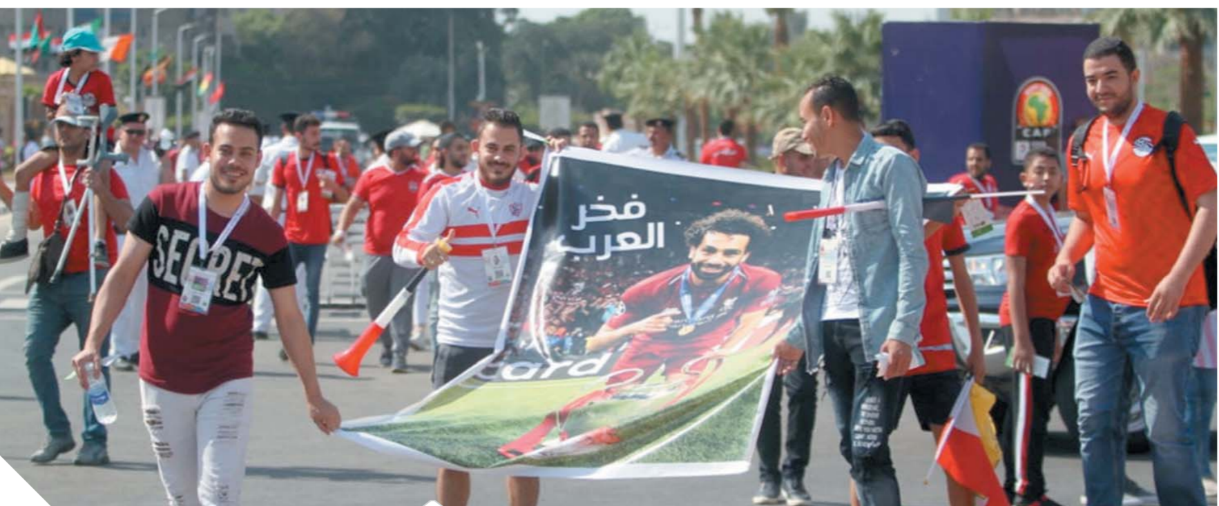
توافد الجماهير على استاد القاهرة

الثامنة، حيث سبق أن توج الفراعنة باللقب الإفريقي ٧ مرات من قبل. ورفض اتحاد الكرة وضع بند في عقد أجيرى للحصول على مكافأة في حالة وصوله إلى البطولة على اعتبار أنه أمر طبيعي أن يشارك مصر في بطولة إفريقيا التي حقق في نسخها الماضية بالجائون مقدم الوصافة، على أن يحصل المدرب المكسيكى على ٢٥٠ ألف دولار في حالة التتويج. ويمتد عقد المدرب المكسيكى مع منتخب مصر لـ ٤ سنوات وينتهي في ٢٠٢٢، مقابل راتب شهري ١٢٠ ألف دولار، ويعاناه من قيمة عقده الشهري، والعقد لا يتضمن يتحمل رواتبهم من قيمة عقده الشهري، والعقد لا يتضمن أى مكافآت في حال التأهل لكأس الأمم الإفريقية، ولكن هناك مكافأة حال الحصول على لقب البطولة وهو ٢٥٠ ألف دولار، ومكافأة الوصول لكأس العالم ٢٠٢٢ بـ ٥٠٠ ألف دولار.