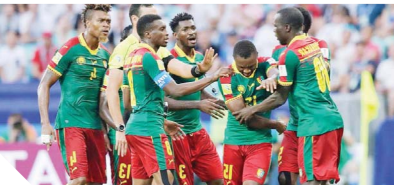
منتخب الكاميرون انهي ازمته وانضم لضرب البطولة

صرف خمسة ملايين دولار إضافية، على أن يتطلق بعثة المنتخب إلى مصر في المساء، بعد أن قام الاتحاد الكاميرونى بصرف شيكات بمستحقات اللاعبين. وكانت وزارة الرياضة في الكاميرون قد أصدرت بياناً في وقت سابق أكدت فيه أنها قد قامت بالفعل بسداد كل مستحقات ومكافآت اللاعبين التي تقدر بـ ٢٠ مليون دولار. ورد عدد من لاعبي المنتخب الكاميرونى بإصدار بيان مضاد لتوضيح موقفهم، أكدوا فيه أنهم لم يحصلوا على أية مكافآت منذ بداية المعسكر المقام استعداداً للمشاركة