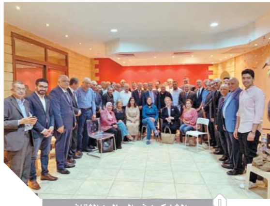
المشاركون فى الصالون الثقافى

وتقام فعاليات معسكر قادة المستقبل لطلاب جامعة القاهرة خلال الفترة من ٢٢ يونيو الجارى حتى ٧ أغسطس المُقبل، ويتضمن ٦ أفواج طلابية، يستوعب كل فوج ١٠٠ طالب وطالبة يفرض تخريج ٦٠٠ قائد لديهم القدرة والعمل على تغيير طرق تفكير زملائهم من الطلاب من الفكر الاتكالى إلى الفكر العلمى والواقعى الذى يأخذ بالأسباب. ويضم المعسكر برنامجاً متميزاً، يشمل