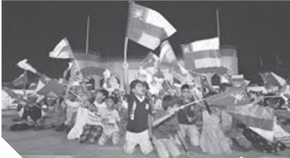
بلدية ظفار تستعد لإقامة مهرجان صلالة السياحي