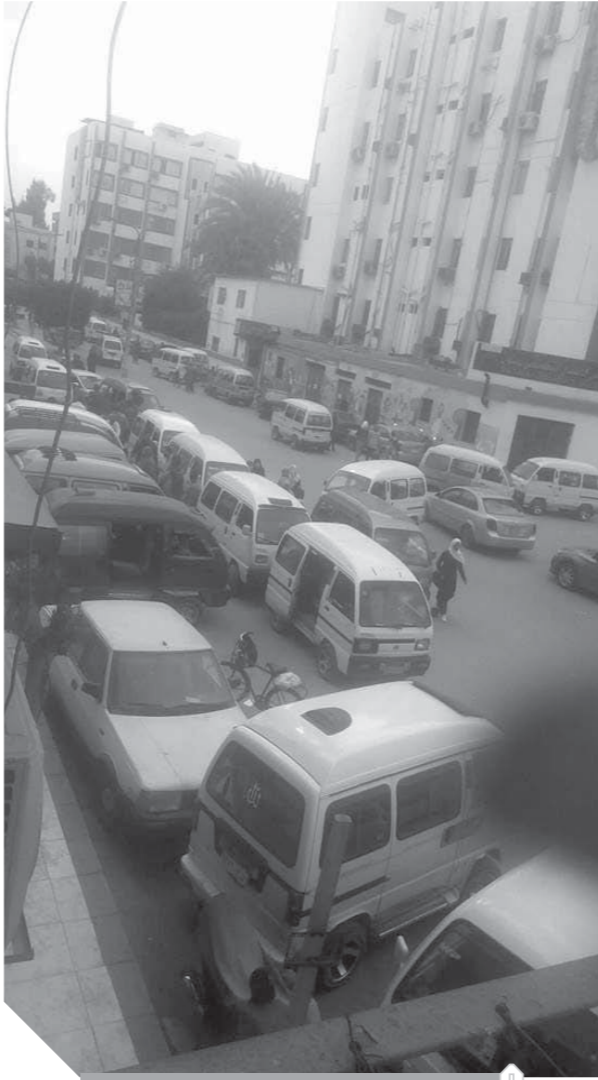
شوارع بينها تحت حصار السوزوكي