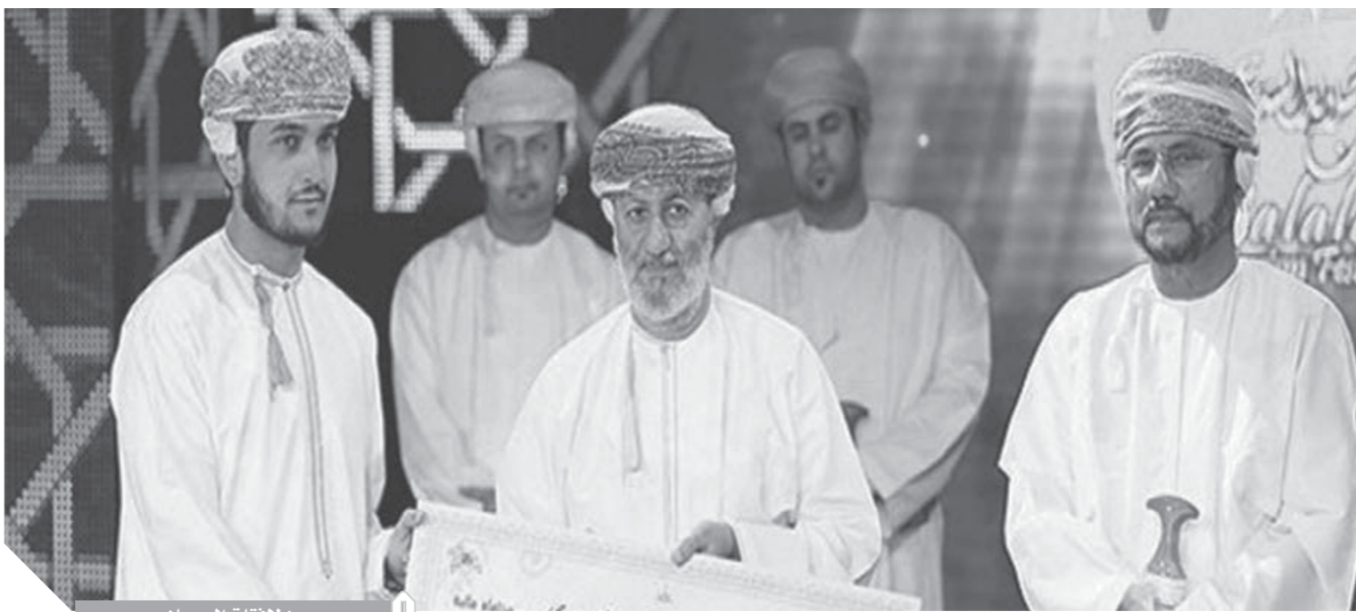
من لافتات المهرجان