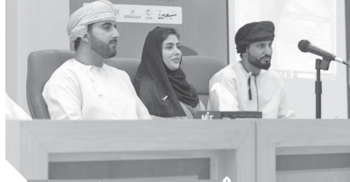
من فعاليات جائزة زيادة الأعمال

من المتوقع أن يقترب العدد إلى مليون زائر خلال هذا العام لاسيما مع الجهود التي تبذلها الحكومة ممثلة في وزارة السياحة وبلدية ظفار لتعزيز المرافق السياحية والخدمية لتكون قادرة على استيعاب الأعداد الكبيرة، وتوفير منتج سياحي يناسب جميع الفئات، في العام الماضي أنفق السياح -من داخل وخارج السلطنة- نحو ١٩٤ مليون دولار، بينما أنفقوا في ٢٠١٧ نحو ١٧٠ مليون دولار، فكل المؤشرات تدل على تامة النشاط السياحي. حقا إنها صلالة الخضراء ذات الربيع الدائم على مدار شهور العام.