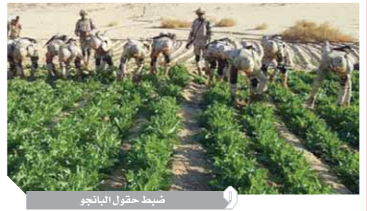
ضبط حقول البانجو