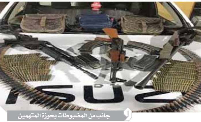
جانب من المضبوطات بحوزة المتهمين