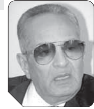
بهاء الدين أبو شققة