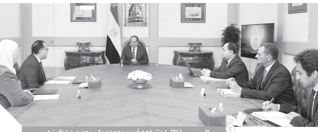
السياسي خلال اجتماعه أمس مع مديولى وعدد من الوزراء

اجتمع الرئيس عبدالفتاح السيسي، أمس، مع الدكتور مصطفى مديولى رئيس مجلس الوزراء، والدكتور محمد معيط وزير المالية، ونيقين القبايح وزيرة التضامن الاجتماعي، وذلك بحضور اللواء محمد أمين مستشار رئيس الجمهورية للشؤون المالية، وصرح المتحدث الرسمي باسم رئاسة الجمهورية، بأن الاجتماع تناول مناقشة الإجراءات المتخذة من قبل الحكومة لإدارة الوضع الحالي في ظل تداعيات أزمة فيروس كورونا المستجد عالمياً وداخلياً، خاصة ما يتعلق بتدبير الاحتياجات المالية للجهات الحكومية المختلفة للتعامل مع التطورات ذات الصلة. وقد وجه الرئيس بتركيز جهود الحكومة في هذا الصدد على دعم مختلف فئات الشعب، خاصة قطاع العمالة غير المنتظمة، إلى جانب مساعدة الفئات الأكثر احتياجاً، وذلك في إطار الخطط والبرامج التي تقوم بها الدولة في إدارتها لأزمة فيروس كورونا. من ناحية أخرى اجتمع الرئيس عبدالفتاح السيسي، أمس، مع طارق عامر، محافظ البنك المركزي.