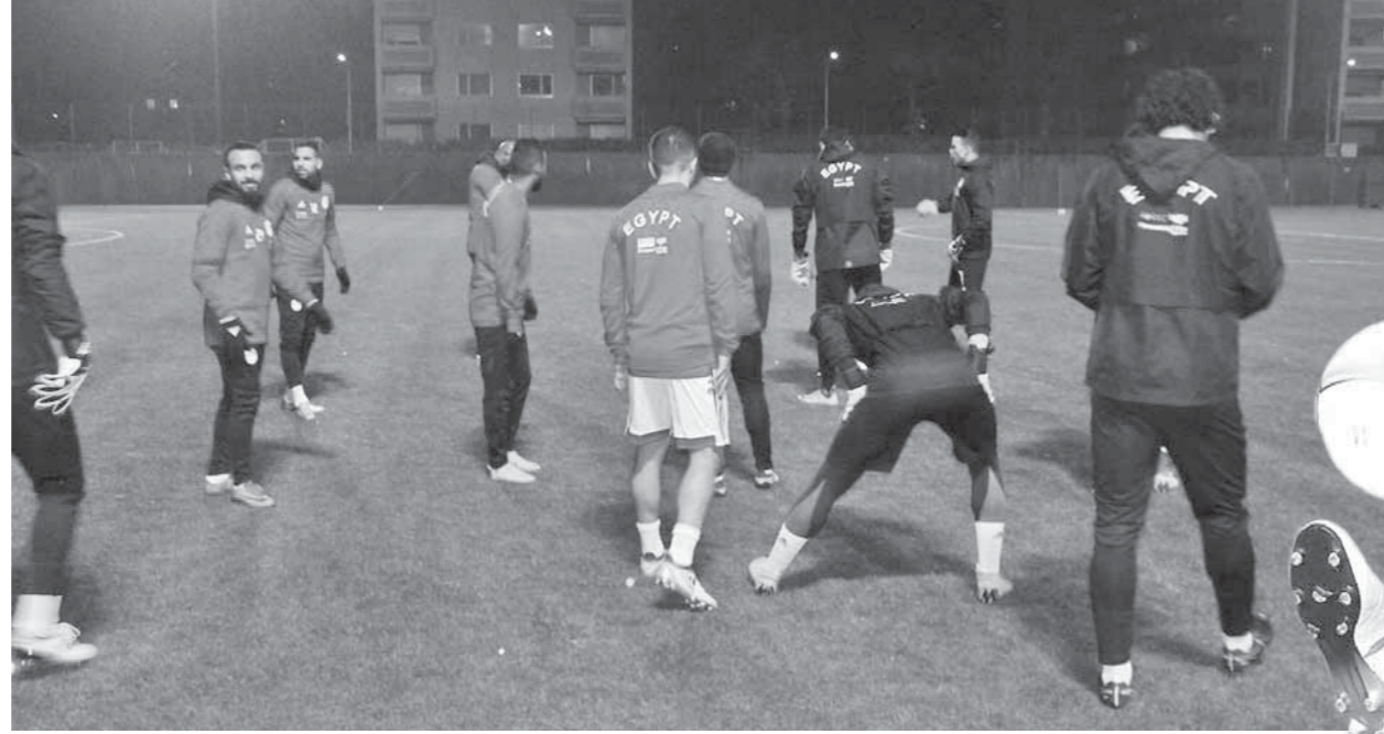
المنتخب يخوض مرانه الأخير الليلة استعداداً للبرتغال