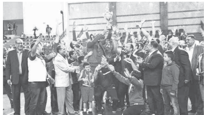
فرحة فريق سلة الأهلي بعد التتويج بالكأس