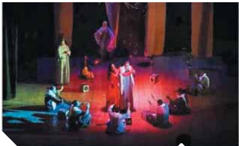
جانب من العرض المسرحى

محافظة أسبوط في الفترة من ٩ إلى ١٥ ابريل المقبل، زيادة جوائز دعم الإنتاج للفرق المصرية إلى ٦٠ ألف جنيه ضمن برنامج تطوير صناعة المسرح في جنوب مصر الذى تنتهجه مؤسسة «س» للثقافة والإبداع طوال السنوات الماضية.