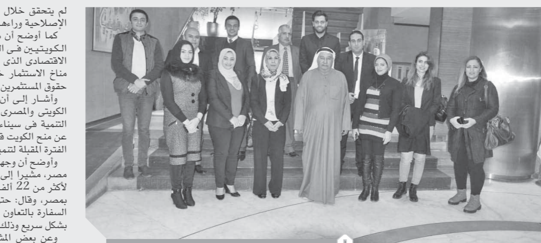
سفير الكويت خلال المؤتمر الصحفي

لم يتحقق خلال نصف قرن مضى، مؤكداً أن الخطوات الإصلاحية ورأها رجال مخلصون محبون لوطنهم. كما أوضح أن هناك تطلعاً كبيراً من جانب المستثمرين الكويتيين في القطاع الخاص في ضوء الاستقرار الاقتصادي الذي تتمتع به مصر حالياً، فضلاً عن تحسن مناخ الاستثمار خاصة بعد القانون الذي يكفل ويحفظ حقوق المستثمرين. وأشار إلى أن علاقة الأخوة والترابط بين الشعبين الكويتي والمصري تجعل دولة الكويت حريصة على دعم التنمية في سيناء من خلال دعم المشروعات بها، كاشفاً عن منح الكويت قرضاً بمصر بقيمة 15 مليون دينار خلال الفترة المقبلة لتنمية مشاريع في شمال سيناء. وأوضح أن وجهة الطلاب والبعثتين الكويتيتين الأولى هي مصر، مشيراً إلى أن عدد الطلاب الكويتيين بمصر وصل لأكثر من 22 ألف طالب، مؤكداً أنهم يتألون معاملة طيبة بمصر، وقال: حتى المشاكل البسيطة التي تواجههم تعمل السفارة بالتعاون مع الجهات المعنية بمصر على احتوائها بشكل سريع وذلك بقوة الترابط بين مصر والكويت. وعن بعض المشروعات الخيرية التي تدعمها السفارة بمصر، أكد السفير محمد صالح الزيبي أن السفارة تدعم المشروعات الصغيرة للشباب والمرأة والتي يكون لها عائد من دوره الحفاظ على تلاحم الأسرة المصرية، مشيراً إلى ارتفاع أعداد المساحين الكويتيين من 130 ألفاً إلى ١٦٠ ألف مساح العام الماضي، منوهاً إلى وعى السائح الكويتي الذي يدرك أهمية المدن الأثرية المصرية مثل