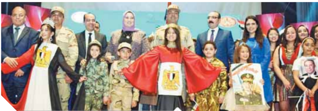
جانب من الندوة التثقيفية

كتبت- محمد صلاح وأبو زيد كمال وسامية فاروق: