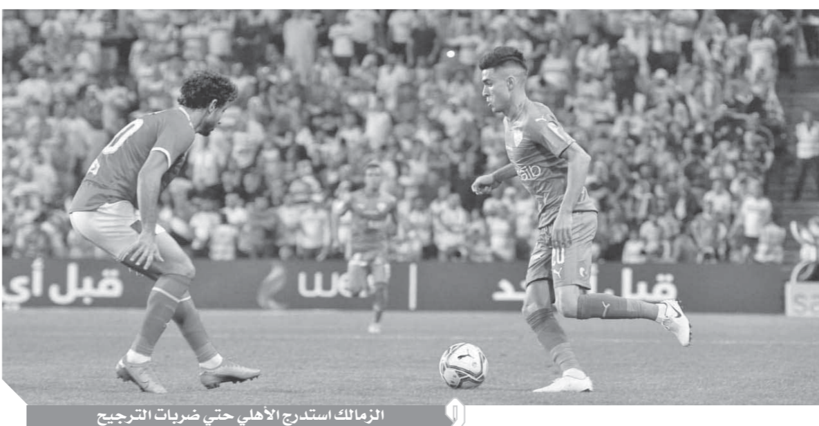
الزمالك استدرج الأهلي حتى ضربيات الترجيح

وأوضح أن الوسط الرياضي ينتقد للروح الرياضية وتقبل الهزيمة وهو ما جعله يطلب من اللاعبين استلام الميداليات والهدوء وهو ما كان سيحدث إذا كان يدرّب أي فريق آخر.