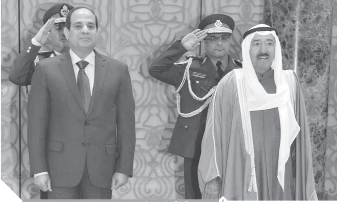
علاقات قوية وراسخة تربط بين الزعيمين السيسى وصباح الأحمد

والشيخ صباح الأحمد الحاكم الـ١٥ لدولة الكويت مكانة خاصة جداً في جميع المحافل الخليجية والعربية والإقليمية والدولية لما له من صفات واضحة، وجوه بارزة، ومشاركات إيجابية في جميع القضايا التي تواجه الأمتان العربية والإسلامية، كما أن له دوراً كبيراً في خدمة القضايا الإنسانية وحل الخلافات بين الأشقاء، والمتابع لدور الكويت السياسي إقليمياً وعالمياً يؤكد بما لا يدع مجالاً للشك، نجاح سياسة الشيخ صباح الأحمد، الدبلوماسية في نصرة القضايا العادلة للشعوب وحماية الدولة من أي تأثير يهدد كيانها والوصول بها إلى بر الأمان في ظل مجيد مضطرب بالمشاكل والتحديات، وقد حظى الشيخ صباح الأحمد بعد وفاة الأمير الراحل الشيخ جابر الأحمد الجابر الصباح، بتأييد شعبي ورمسي كبير وتمت مبايعته بالإجماع من قبل أعضاء السلطين التنفيذية والتشريعية في ٢٩ يناير