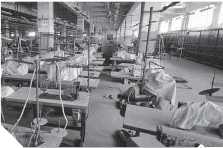
عناير ماكينات الحياكة تحولت إلى مقبرة