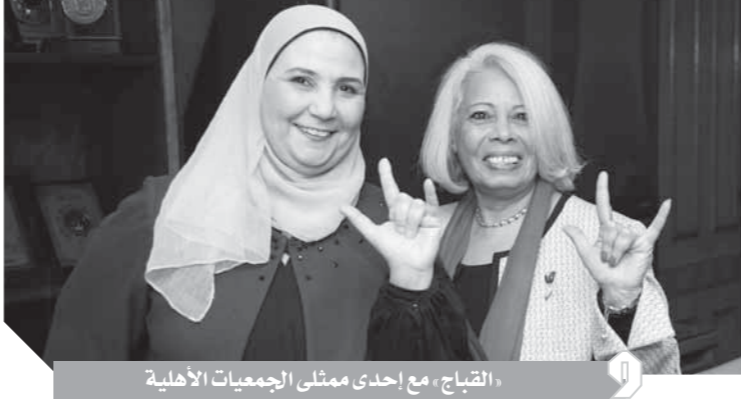
القباج مع إحدى ممثلي الجمعيات الأهلية

شكاوى ذوي الإعاقة ١٥٠٤٤ . وأشارت القباج إلى أنه سيتم خلال المرحلة المقبلة التأكد من قياس سمع المواليد الجديدة، خاصة في المناطق الريفية وتوفير خدمات تأمين صحي يشمل ذوي الإعاقة جميعاً، كما سيتم إطلاق حملة كبيرة لتوفير السماعات وتركيب النوقفة وصيانتها وتدوين لغة الإشارة في الجامعات وأشارت القباج إلى أنه سيتم خلال المرحلة المقبلة التأكد من قياس سمع المواليد الجديدة، خاصة في المناطق الريفية وتوفير خدمات تأمين صحي يشمل ذوي الإعاقة جميعاً، كما سيتم إطلاق حملة كبيرة لتوفير السماعات وتركيب النوقفة وصيانتها وتدوين لغة الإشارة في الجامعات