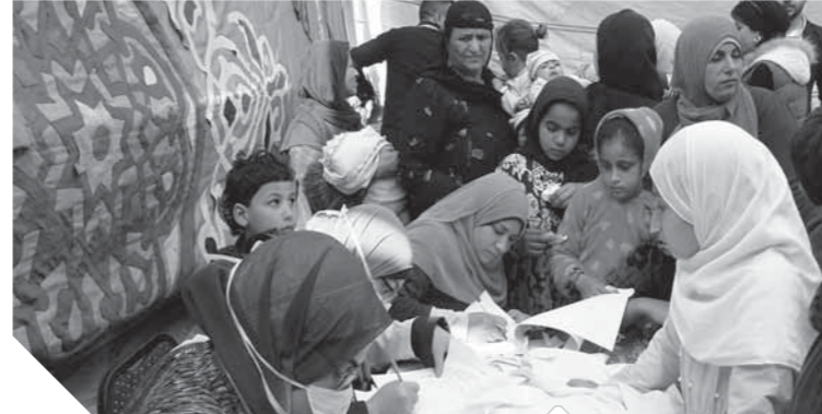
مشاركة كئيبة من سيدات الوفد

«بدير»: «السيسى» قائد مسيرة التنمية.. ويوفر حياة كريمة للمواطن