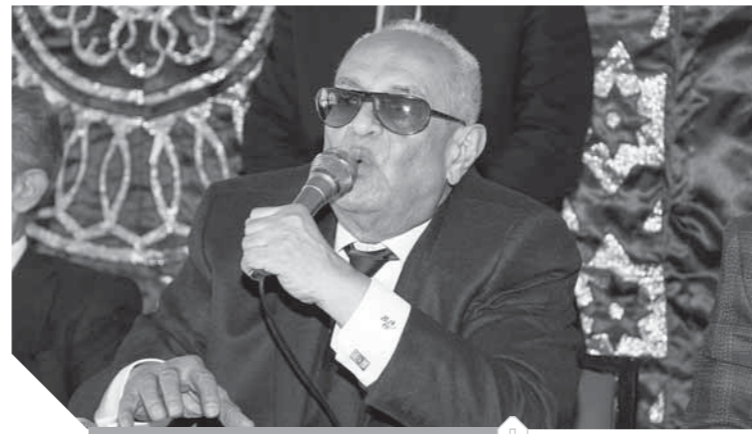
المستشار أبوشقة رئيس الوفد