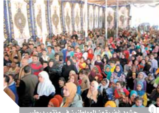
حشود غصيرة من المواطنين في مؤتمر برطس