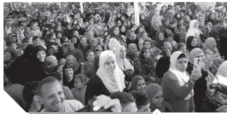
جانب من الجماهير

المشروعات العملاقة والمشروع الوطني الذي يتبناه الرئيس عبدالفتاح السيسي لبناء دولة ديمقراطية حديثة هي أمل كل المصريين، مشيدا باهتمامه بالطبقات الكادحة، وصحة المواطنين، من خلال مشروع صحة لكل مواطن، الذي قضى على فيروس سي، وقانون التأمين الصحي الشامل. والى نص كلمة المستشار بهاء الدين أبوشقة رئيس حزب الوفد: بسم الله الرحمن الرحيم أحيى جميع الحاضرين، إذ يؤكد الكم الهائل من الحضور، وشعبية الوفد وشعبية النائب الشاب سعد بدير، في دائرته، ويؤكد أيضاً أن حزب الوفد يملك نوابًا وطنيين يحرسون على تلبية مطالب المواطنين، ويتلاحمون ويلتقون بالمواطن البسيط، ويحرصون على التواصل المستمر مع المواطن وهو قمة العمل الحزبي الاحترافي، فالنائب ليس بمجرد انتخابه ينفضل عن القواعد الانتخابية، وإنما ما زياره يؤكد أن سعد بدير كان دائماً متواصلاً ومجيباً ومتفاعلاً مع كل متطلبات الدائرة الانتخابية وشعب أوسيم وعلى وجه الخصوص هذا الجمع في قرية برطس. نحى الجميع ونرى أن هذا الحشد هو تأكيد لشعبية حزب الوفد وتأكيد بأن حزب الوفد مع تاريخه الذي يزيد على ١٠٠ عام هو دائماً حزب الشعب الذي يتواصل دائماً مع الشعب والقواعد الجماهيرية، والوفد هو حزب الجلايلب الزرقاء، وحزب الفلاح وحزب العمال، والمدافع دائماً عن الطبقات