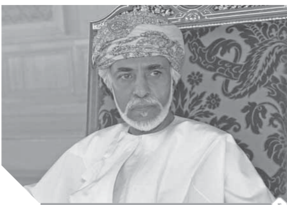
الغفور له السلطان قابوس بن سعيد سيظل حاضراً في قلوب وعقول وعيون العمانيين

المنطقة والعالم والمكانة التي بناها عُمان في عالم اليوم، وهو ما يشعر به المواطن ويستمتع بنتائج بصور عديدة، لدى انتقاله في أرجاء العالم، وعند تقاعله مع الشعوب الأخرى. وفي الوقت الذي تمكن فيه السلطان الراحل بجهد وتصميم وإرادة ومثابرة من إرساء أسس دولة عُمانية حديثة تقوم على المؤسسات وحكم القانون وعلى مبادئ المواطنة والمساواة والتكامل بين مؤسسات الدولة من أجل تحقيق مصالح الوطن والمواطن وحماية مكتسبات النهضة العمانية الحديثة، فإن الشعب العماني الوهي عبر على نحو بالغ الوضوح عن عزمه السير على النهج القويم الذي إرساه السلطان قابوس في كل المجالات، وهو ما أكد عليه السلطان هيثم بن طارق سلطان عُمان في أول خطاب له عقب توليه مقاليد الحكم في الحادي عشر من شهر يناير الماضي، بناء على ترقية السلطان الراحل له لتولي هذا المنصب الرفيع ووفق الإجراءات القانونية التي حددها النظام الأساسي للدولة في هذا المجال. صفات وقدرات لقد كتب السلطان قابوس طيب الله ثراه عبارة: «وذلك لما توصلنا فيه من صفات