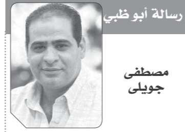
رسالة أبو ظبي

وأكد «مرتضى» أن الزمالك لن يخوض مباراة القمة أمام الأهلي بعد غد الاثنين ضمن منافسات بطولة الدوري، مشدداً أنه لن يلعب اللقاء حفاظاً على مصلحة الأهلي والزمالك بسبب مباريات إفريقيا الصعبة في الفترة المقبلة». وأكد «الزمالك مقبل على مباراة قوية وصعبة أمام الترجي التونسي والأهلي يستعد لخوض مواجهة صن داويز الجنوب إفريقي». وأشار إلى أن الأهلي كان ينتظر موقف الزمالك وطلبه تأجيل القمة ونحن نعلم الآن رغبتنا في تأجيل القمة». وأضاف «أرسلت كأس السوبر الإفريقي للاعبين قبل مباراة الأهلي وطالبتهم بالنظر