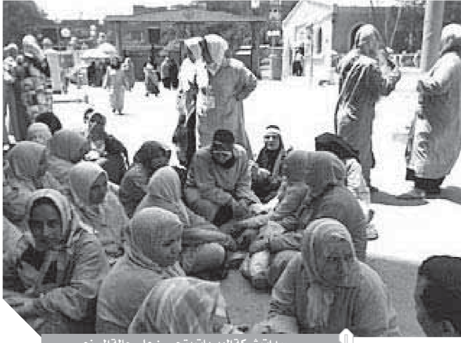
سيدات شركة الوبريات يتحسنن على حالة المصنع