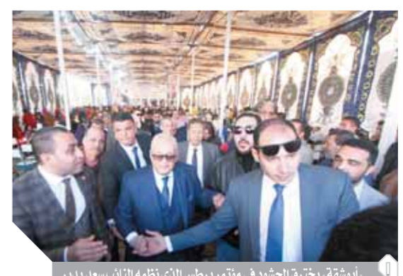
أبو شقة، يفتتح الحشود في مؤتمر برطس الذى نظمه النائب سعد بدير