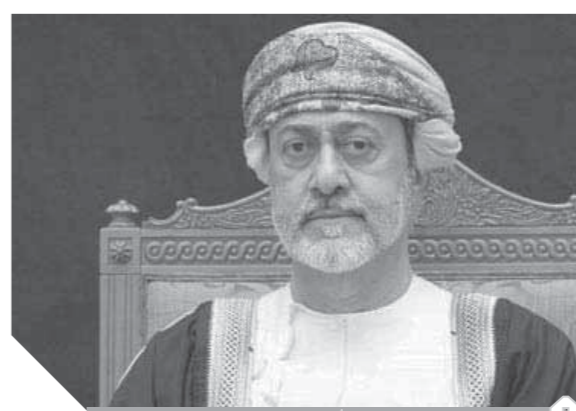
السلطان هيثم بن طارق سلطان عُمان سيقدّم السلطنة إلى مستقبل باهر