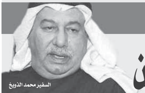
السفير محمد الزيبي

الأقصر وأسوان، ولم يعد مقصراً على زيارة القاهرة فقط، كما أعرب «الذويخ» عن حزنه لما وصلت له الأوضاع في بعض الدول العربية مثل ليبيا وسوريا، متمنياً عودة الأمن والاستقرار للدول الشقيقة. كما أكد «الذويخ» أن جهود الكويت مستمرة في محاولة احتواء قطع العلاقات من دول الرباعي العربي ومصر والسعودية والإمارات والبحرين، لتطهر، وأن جهود الوساطة الكويتية مستمرة، ولم تياس بهدف راب الصدع، ولفت إلى أن الأزمة الخليجية لن تطول، مشيراً إلى أن إطالة أمد الأزمة يؤثر سلباً على آلية العمل العربي المشترك. وقال «الذويخ» إن الفترة المقبلة في السفارة ستركز على خدمة الشباب وإقامة مشروعات إنتاجية ومشروعات التنمية في سيناء من خلال دعم المشروعات بها، كاشفاً عن منح الكويت قرضاً بمصر بقيمة 15 مليون دينار خلال الفترة المقبلة لتنمية مشاريع في شمال سيناء. وأوضح أن وجهة الطلاب والبعثتين الكويتيتين الأولى هي مصر، مشيراً إلى أن عدد الطلاب الكويتيين بمصر وصل لأكثر من 22 ألف طالب، مؤكداً أنهم يتألون معاملة طيبة بمصر، وقال: حتى المشاكل البسيطة التي تواجههم تعمل السفارة بالتعاون مع الجهات المعنية بمصر على احتوائها بشكل سريع وذلك بقوة الترابط بين مصر والكويت. وعن بعض المشروعات الخيرية التي تدعمها السفارة بمصر، أكد السفير محمد صالح الزيبي أن السفارة تدعم المشروعات الصغيرة للشباب والمرأة والتي يكون لها عائد من دوره الحفاظ على تلاحم الأسرة المصرية، مشيراً إلى ارتفاع أعداد المساحين الكويتيين من 130 ألفاً إلى ١٦٠ ألف مساح العام الماضي، منوهاً إلى وعى السائح الكويتي الذي يدرك أهمية المدن الأثرية المصرية مثل