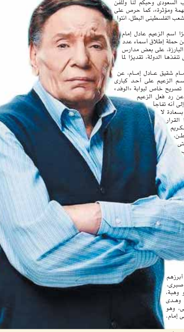
بقلم: جدير بالذكر أن آخر أعمال النجم عادل إمام كان مسلسل «فلانتينو» الذي خاض به موسم دراما رمضان لعام ٢٠١٩، وشاركه البطولة نخبة مميزة من النجوم أبرزهم الراحلة دلال عبدالعزيز والراحل سمير صبري، بالإضافة إلى داليا البحيري، وعمرو وهدي ورائيا محمود ياسين، وهدية طلحة، وهدي الفتحي، وسليمان عيد، وحمدي الميرغني، وهو من تأليف أيمن بهجت قمر، وإخراج رامى إمام.

كتب - آية عادل: أعلن المخرج رامى إمام نجل الزعيم عادل إمام اعتزال والده الفن نهائياً بعد مسيرة فنية دامت ٦٠ عاماً، حافلة بالأعمال الناجحة والمميزة ما بين السينما والدراما والمسرح، تاركاً من خلفها بصمة في قلوب الجمهور، مؤكداً إنه بخير ويتمتع بصحة جيدة، ولكنه قرر التفرغ للحياة الأسرية واستكمال حياته القادمة وسط أسرته والاستمتاع مع أبنائه وأحفاده في المنزل.