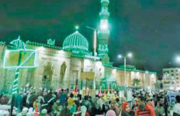
سُميت السيدة زينب باسم جدتها، السيدة زينب بنت النبي محمد، وكان اسمها يعني الفتاة القوية المكتوبة بالوعد المعاقبة.

كتبت - أحمد الجعفرى: يبدأ الاحتفال بمولد السيدة زينب رضى الله عنها الثلاثاء المقبل الموافق ٢٣ يناير من عام ٢٠٢٤، على أن يحتتم الاحتفال يوم ٢٧ من شهر رجب، وأقامت الطرق الصوفية الشوادر والسراود للاحتفال بالمولد، وتوافد المئات من المحبين من شتى محافظات الجمهورية للمشاركة في الاحتفال الكبير. ولدت السيدة زينب في المدينة المنورة في السنة الخامسة أو السادسة للهجرة، وكانت ابنة سيدنا علي بن أبي طالب والسيدة فاطمة الزهراء، وشقيقة الإمام الحسن والإمام الحسين.