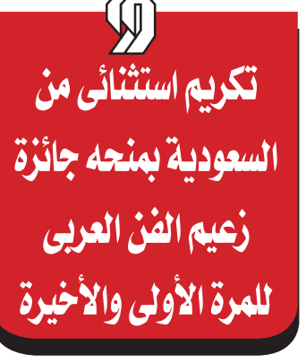
تكريم استثنائي من السعودية بمنحه جائزة زعيم الفن العربي للمرة الأولى والأخيرة

ومن جانبه، وجه الفنان محمد عادل إمام كلمة شكر للشعب السعودي