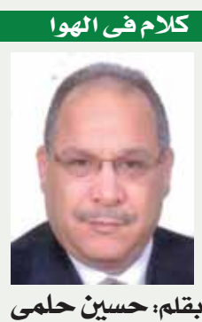
بقلم: حسين حلمي