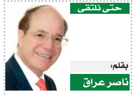
بقلم: ناصر عراقة