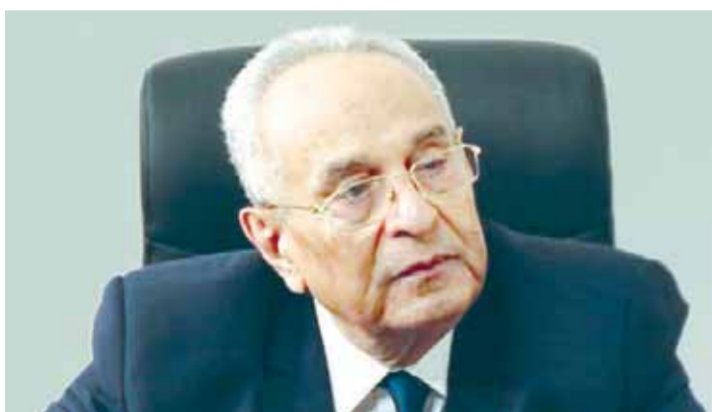
المستشار بهاء الدين أبو شقة رئيس الوفد

بمحاوره الأربعة المتمثلة في إنشاء الهيئة العامة لتنمية جنوب مصر، وإطلاق المشروع القومي لإنشاء مناطق صناعية متكاملة في الصعيد، والتوسع في إجراءات الحماية المجتمعية. وأشار رئيس حزب الوفد وكيل أول مجلس الشيوخ إلى أن أهل الصعيد - الذين وصفهم الرئيس السيسي بحراس الأمة وخلقاً لخير سلف - هم في بؤرة اهتمامه، خصوصاً في توجيهاته أن يكون صعيد مصر أحد أهم أذرع التنمية الاقتصادية. واعتبر أن توجيهات الرئيس عبدالفتاح السيسي بالاهتمام بتنمية صعيد مصر تأتي في إطار صعيد جديد يكون أحد أذرع التنمية الاقتصادية في مصر. مشيراً إلى أنه مازال في حاجة إلى مزيد من الاستثمارات خصوصاً في السياحة، وأوضح أن محافظات الصعيد حظيت باستثمارات حكومية قدرها ٤٧ مليار بخطة عام ٢٠٢١/٢٠٢٠ تشكل ٢٠٪ من جملة الاستثمارات الحكومية الموزعة وزيادة قدرها ٥٥٪ عن الموازنة السابقة. لافتاً إلى أن هذه الخطوة تعد سابقة لم تحدث من قبل، بأن يتم توجيه قدر كبير من استثمارات الدولة لمحافظة الصعيد فقط. وأكد «أبو شقة» أن الصعيد وما به من موارد أساسية تعتبر ركيزة أساسية لضخ مزيد من الاستثمارات، نظراً لوجود زراعات متنوعة تعول عليها الحكومة في صناعات المواد التحويلية الرئيسية، والكثير من الموارد الطبيعية والسياحية.