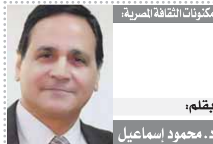
مكتوبات الثقافة المصرية: بقلم: د. محمود إسماعيل