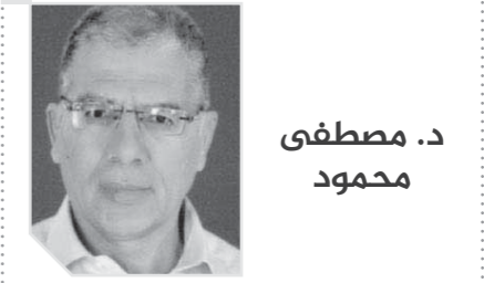
د. مصطفى محمود