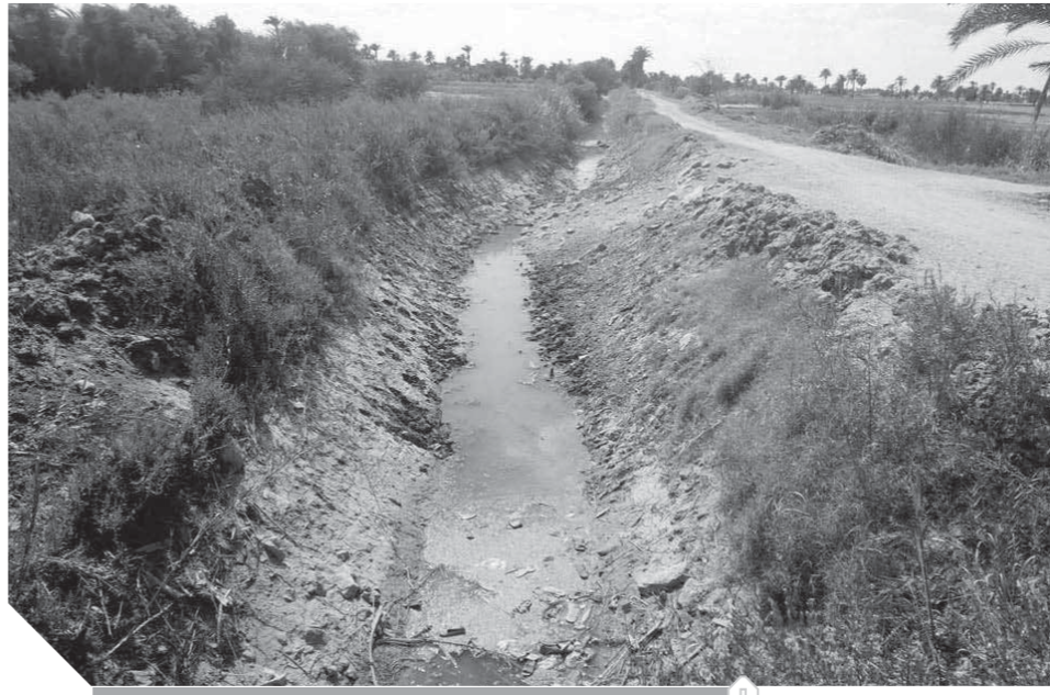
اختفاء المياه من الجداول والمصارف

ازدادت سوءا عقب عودة الشباب من ليبيا وأصبحوا ليس لهم مصدر رزق سوى الزراعة والثروة الحيوانية ولكنهم فوجئوا بأباطرة أملاك الدولة وهوأة الثراء السريع يتغولون عليهم ويستولون على حصتهم من مياه الري دون النظر إلى هؤلاء البسطاء الجرجية والمسؤولين عن مساحات واسعة من الأراضي الصحراوية وقيامهم بسرقة المياه من بحر الغرق الرئيسي وبحر الجرجية والمسؤولين عن الري بالفيوم عجزوا عن إيجاد حل لهذه الكارثة التي حلت على المزارعين حتى وصلنا إلى مرحلة الجفاف وبوار رقعة من أجود الأراضي الزراعية بالفيوم.