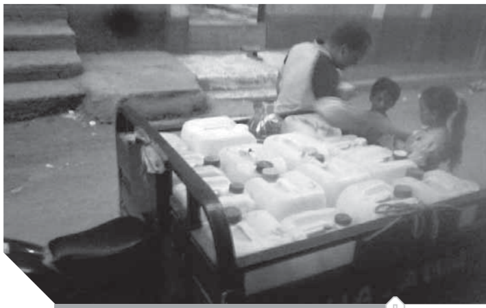
تلوث مياه الشرب في المنوفية

يتمتعون بشكل دائم على مياه الجراكن بسبب تلوث المياه فلا نستطيع شراء الفلتر بسبب ارتفاع سعره والجراكن تكلفنا مبالغ كبيرة شهريا لذلك نطالب شركة المياه بالعناية والإهتمام بنظافة المياه حفاظا على أرواح وسلامة المواطنين.