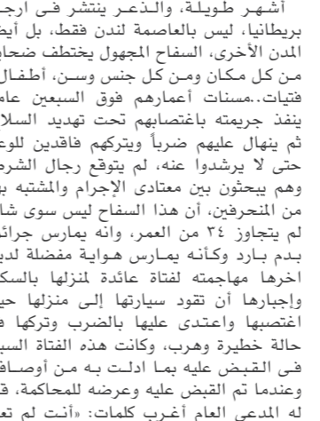
السفاح الأخطر في بريطانيا

أشهر طويلة، والذعر ينتشر في أرجاء بريطانيا، ليس بالعاصمة لندن فقط، بل أيضاً المدن الأخرى، السفاح المجهول يخطف ضحاياه من كل مكان ومن كل جنس وسن، أطفال.. فتيات.. سنات أعمارهم فوق السبعين عاماً، ينفذ جريمته باغتصابهم تحت تهديد السلاح، ثم يبالغ عليهم ضرباً ويتركم فاقدين للوعي حتى لا يرشدوا عنه، لم يتوقع رجال الشرطة وهم يبحثون بين معتادي الإجرام والمشتبه بهم من المنحرفين، أن هذا السفاح ليس سوى شاب لم يتجاوز 2٤ من العمر، وأنه يمارس جرائمه بدم بارد وكأنه يمارس هواية مفضلة لديه، أخرها مهاجمته لفتاة عائدة لمنزلها بالسكين واجبارها أن تقود سيارتها إلى منزلها حيث اغتصبها واعتدى عليها بالضرب وتركها في حالة خطيرة وهرب، وكانت هذه الفتاة السبب في القبض عليه بما ادلت به من أوصاف، وعندما تم القبض عليه وعرضه للمحاكمة، قال له المدعي العام أغرب كلمات: «أنت لم تعبر أبداً عن كلمة ندم أو قلق، أنت مهوس تماماً بنفسك، وتعتقد أنه يحق لك استخدام أشخاص آخرين بأي طريقة، أنت مختل عقلياً، ومهوس جنسياً، ولا اعتقد أنك ستوقف عن ارتكاب جرائمك حتى بعد فضائلك فترة العقوبة، أنت تشكل أكبر خطر على المجتمع ويجب أن نسجن باقي عمرك».