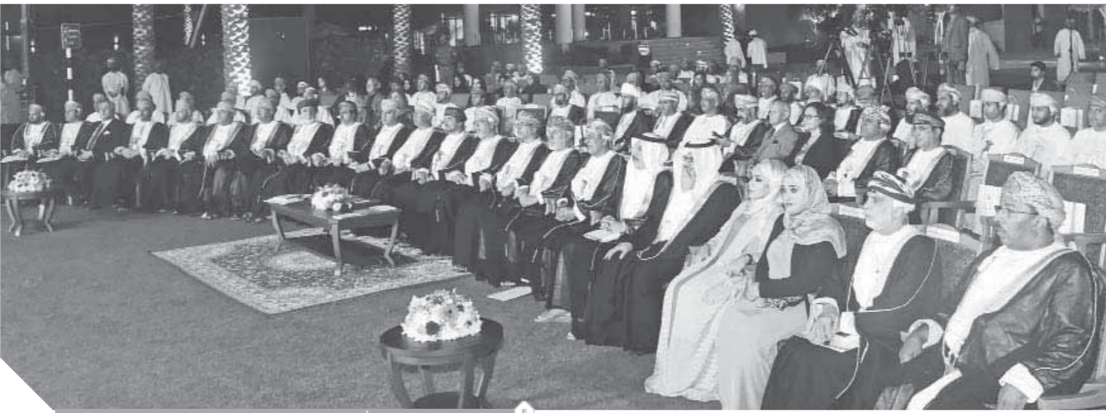
اهتمام كبير من سلطنة عُمان بجائزة السلطان قابوس للثقافة والفنون والآداب

وتمنح الجائزة للفائزين في مجالات الثقافة والفنون والآداب، بحيث يتم اختيار فرع من كل مجال في كل دورة من دورات الجائزة، ليصبح عدد الفائزين ثلاثة في كل عام من المثقفين والفنانين والأدباء، بواقع فائز واحد في كل مجال. وحول مجالات الجائزة، فلها أفرع ثلاثة، أولها الثقافة حيث تمنى بالأعمال والكتابات الثقافية المختلفة في مجالات المعارف الإنسانية والاجتماعية بشكل عام كاللغة والتاريخ والتراث والفلسفة والترجمة ودراسات الفكر، والفرع الثاني خاص بالفنون وتعنى بالموسيقى والفن التشكيلي والنحت والتصوير الضوئي وغيرها من النماذج الفنية بشتى صورة المعروفة عالمياً، أما الفرع الثالث فهو الآداب ويضم الشعر والرواية والقصة القصيرة والنقد الأدبي والتأليف المسرحي وغيرها. وضمت لجان التحكيم عدداً من الأكاديميين والأدباء والنقاد والفنانين، ممن لهم خبرة طويلة في المجالات المطروحة.