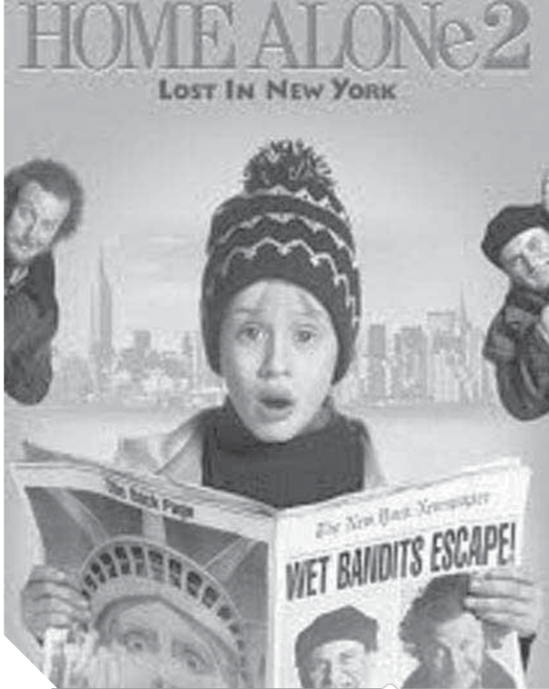
مشهد من فيلم HOME ALONE 2

أما فيلم سانتا كلوز فيدور حول سكوت كالفين «تيم ألين»، وهو الرجل الذي يقتل سانتا كلوز في عشية عيد الميلاد دون قصد منه، فيجد نفسه منذ لحظتها مُجنّداً بطريقة سحرية لأن يحل محل سانتا كلوز ويقوم بجميع مهامه، تمت كتابة دور سانتا كلوز على الورق باعتباره أن من سيحسد دوره هو الممثل الكوميدي «بييل موراى»، لكن يذهب الدور إلى «تيم ألين»، أما بابا نويل فيهم المريخيين هو فيلم خيال علمي أنتج عام ١٩٦٤ وكثيراً ما يظهر على قوائم أسوأ الأفلام على الإطلاق ويظهر في قائمة «أسوأ ١٠٠» على قاعدة بيانات الأفلام على الإنترنت، وعرض عام ١٩٨٦ في حلقة من مسلسل كاند فستيفال، وأخرجه نيكولاس بيستر، وهو من تمثيل جون كول في دور بابا نويل، يشكل الفيلم أول ظهور لشخصية السيدة كلوز في الأفلام، وذلك قبل ثلاثة أسابيع من عرض الفيلم التلفزيوني «دودولف الرنة ذو الأنف الأحمر»، ويصوّغ المخرج «جيرى روجيوف» في «سانتا الشرير» أو «Santa Bad» والذي حقق نجاحاً باهراً بل ويعتبر من أفضل أفلام روجيوف على الإطلاق، والذي علق في الأذهان كواحد من أفضل أفلام الكريسماس، ويصنّف من روائع أفلام السينما الأمريكية، الفيلم من بطولة «بيلى بوب ثورنتون» وقام بدور «سانتا» ذو الشخصية المثيرة للاشمئزاز الشريرة، ويعتبر أداء ثورنتون في دور «سانتا الشرير» راقياً ومميزاً جداً منذ أول ظهور لتلك الشخصية.. أما فيلم «You While Sleeping Were» عندما كنت نائماً فهو فيلم كوميدى رومانس بطولة ساندرا بولك.