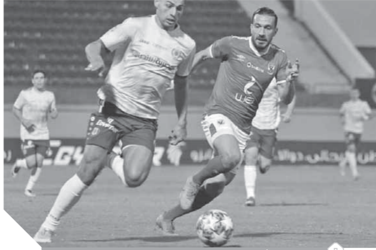
الأهلي فاز على الإسماعيلي ويستعد للاتحاد