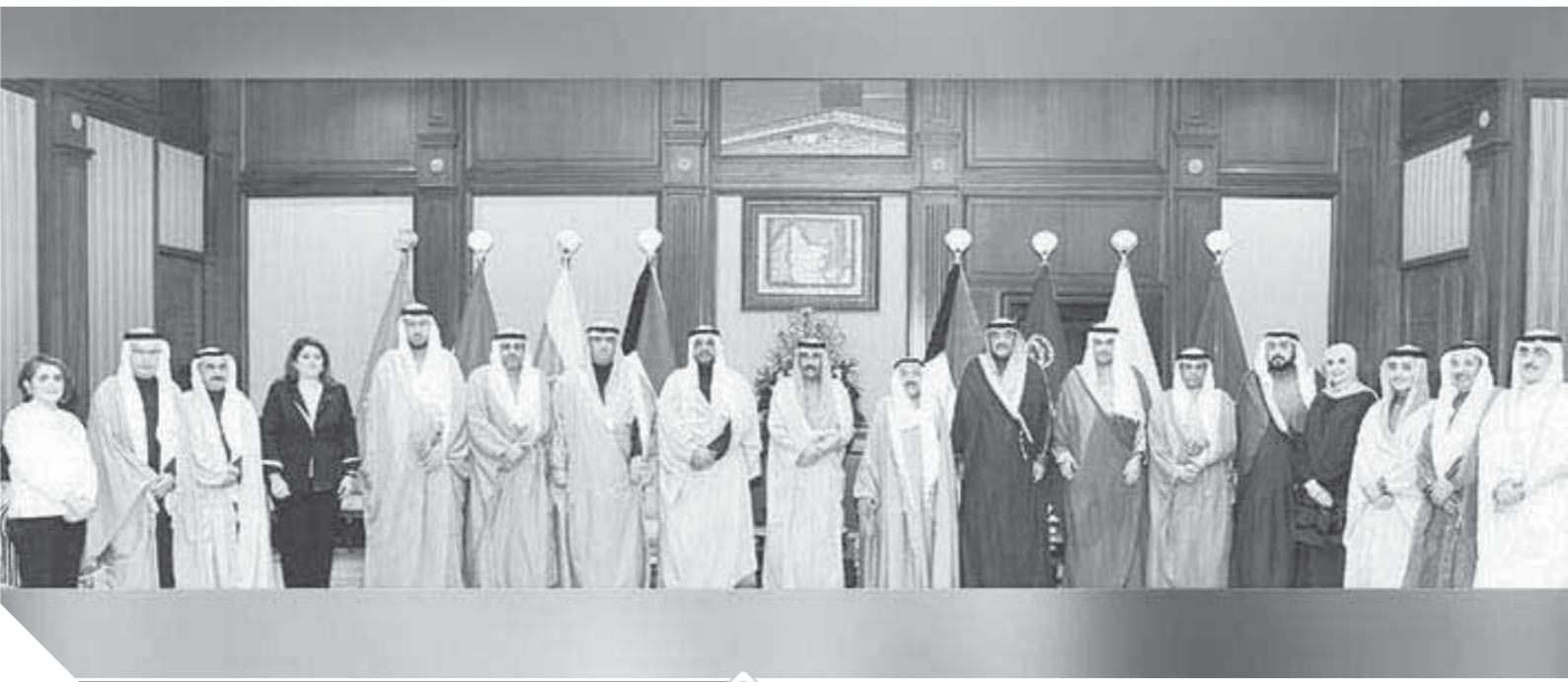
الحكومة الكويتية الجديدة

وقد باشرت الحكومة الجديدة عملها وشهد أول يوم عمل للوزراء اجتماعات مكثفة مع القياديين لمناقشة الأولويات والمستجدات والقضايا العالمة. وكان من اللافت في خطاب الوزراء التأكيد على محاربة الفساد وأن مسطرة القانون على الجميع وتطبيق توجيهات رئيس مجلس الوزراء باتخاذ إجراءات عاجلة وحازمة لترجع كل من تسول له نفسه كسر القانون، فضحلة البلاد فوق أي اعتبار، وكشفت مصادر مطلعة أن جملة ملفات على طاوله رئيس الوزراء الخالد وقضايا تنتظر وضع حلول جذرية لها للمساهمة في الانجاز، ومن أهمها إعطاء الوزراء عموماً والجدد على وجه الخصوص الفرصة لوضع انجازهم، ودعم قراراتهم الاصلاحية بعيداً عن أي ضغوط نيابية، وتطبيق القانون على الجميع، وتذكرت أن النهج الجديد والانجازات التي تراعى التطلعات الشعبية اوبوية، لأن هناك ترقباً شعبياً لإنجازات الحكومة.