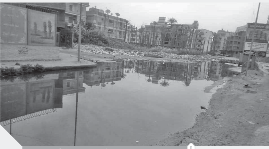
المجاري تجتاح شوارع الاسمايلية

انتاب حالة من الغضب الشديد أهالي حى السلام بمحافظة الإسمايلية وخاصة شارع العشرين أكبر شوارع المحافظة، وذلك بسبب طفح مياه الصرف الصحي، وعدم استجابة مسؤولي فى الشركة القابضة لشكاوى المواطنين المتكررة، رغم تصريحات المهندس ممدوح رسلان، رئيس الشركة القابضة لمياه الشرب والصرف الصحي المتكررة بأن مشاكل المواطنين على رأس أولوياته، التي أصبحت حبرا على ورق.