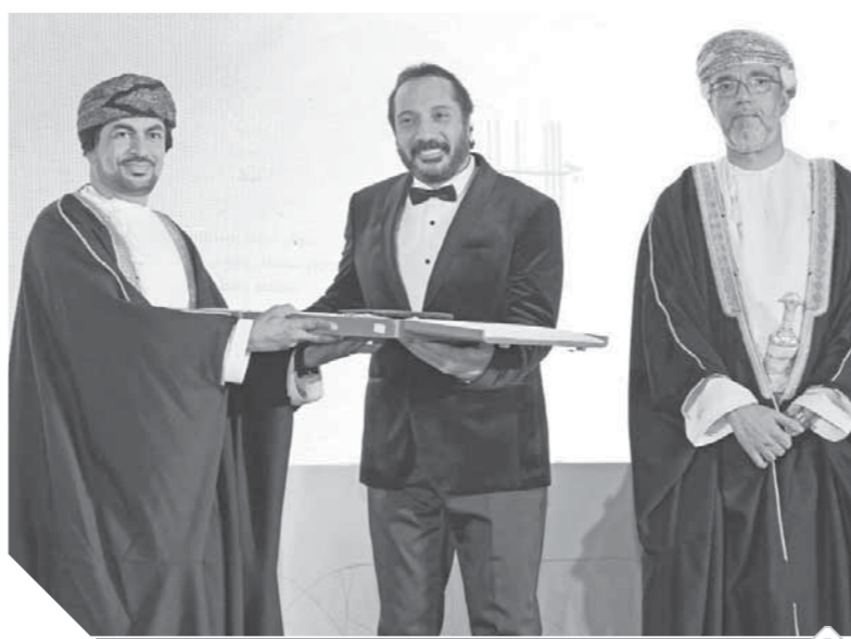
الفنان علي الحجار يتسلم جائزة السلطان قابوس عن فرع الفنون

وتهدف الجائزة إلى دعم المجالات الثقافية والفنية والأدبية في الوطن العربي، باعتبارها سبيلًا لتعزيز التواصل الإنساني والإسهام في حركة التطور العلمي والإثراء الفكري، وترسيخ عملية التراكم المعرفي إلى جانب غرس قيم الأصالة والتجديد لدى الأجيال المقبلة، من خلال توفير بيئة خصبة قائمة على التناغم المعرفي والفكري، وفتح أبواب التناغم في عدة مجالات تقوم على البحث والتجديد، إلى جانب تكريم الفنانين والمثقفين والأدباء على