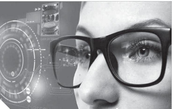
النظارات الإلكترونية ستحل مكان الهواتف الذكية

على مدى المستقبل القريب، ستجتاح الهواتف الذكية من بين أيدينا، لتحل كل التقنيات والصلاحيات التي تقدمها هذه الهواتف وأكثر في نظارات الكمبيوتر، وتقدم خدمات إلكترونية أكبر بكثير مما تقدمها لنا الهواتف الذكية، ويمكن ارتدائها النظارة الذكية لتضيف معلومات إلى من يرتديها، وتتمتع بقدرات لتغيير خصائصها البصرية أثناء وقت التشغيل، وفقاً لطرف الإضاءة حول مستخدمها. وتعد هذه النظارات ثورة برزت فوئها مؤخرا، وأصبحت كبرى الشركات التقنية تتنافس على إنتاجها والاستحواذ على من يطوونها، وفي هذه النظارة يتم تركيب المعلومات على مجال الرؤية، وذلك من خلال شاشة عرض مثبتة على الرأس، وتتمتع بالقدرة على عكس الصور الرقمية المسطحة عليها، وقادرة على أداء مهام أساسية، بالإضافة إلى الاستجابة للأوامر الصوتية، بجانب وجود زر لمس يتم من خلاله أيضا توجيه الأوامر للحصول على الخدمات والمعلومات على غرار أجهزة الكمبيوتر والهواتف الذكية، وتجمع النظارة المعلومات من أجهزة استشعار داخلية أو خارجية، ويمكنها أيضا أن تتحكم أو تسترجم البيانات من أدوات أو أجهزة كمبيوتر أخرى، كما تتمتع بكافة التقنيات الأساسية مثل «البلوتوث» وشبكة الإرشاد اللاسلكية إلى الطريق «جي بي إس»، تتيج إرسال واستقبال الرسائل ورؤية الاتجاهات خطوة بخطوة والاتصال بأوبر والتحدث إلى اليكسا، وبها كل إمكانيات كاميرا الهاتف الذكي، ويمكن من خلالها أيضا ممارسة الألعاب الإلكترونية، وبدلاً من النظر