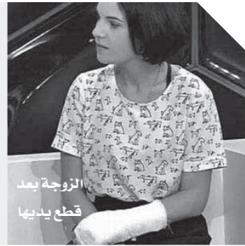
الزوجة بعد قطع يديها