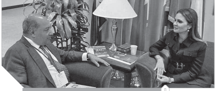
مصر لدى البنك الأوروبى

أعلن البنك الأوروبى لإعادة الإعمار والتنمية، اختياره مصر كأكبر دولة فى عمليات البنك للعام الثالث على التوالي، حيث وصل حجم استثمارات البنك فى مصر خلال عام ٢٠١٩ إلى أكثر من مليار يورو. وأكد البنك اهتمامه بالفرض الاستثمارية فى مصر خلال المرحلة المقبلة، مع الاستثمار فى دعم برنامج الإصلاح الاقتصادى الملوح للحكومة المصرية، خاصة فى قطاع البنية الأساسية.