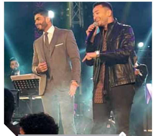
حمادة هلال شارك خالد سليم الغناء