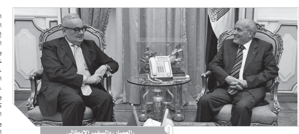
العصر، والسفير الإيطالى

أشاد السفير الإيطالى بالتطورات الإيجابية فى العلاقات بين الدولتين، وأثنى على الدور الذى تلعبه وزارة الإنتاج الحربى لدعم وتشجيع الاستثمار فى مصر، وفى إطار استراتيجىة الهيئة العربية للتصنيع لزيادة القيمة المضافة للصناعات التى تدعم خطط التنمية الشاملة وزيادة فرص الاستثمار، تم توقيع مذكرة التفاهم مع شركة «جوان جو تكتوريك» الكورية الجنوبية وأكد الفريق عبدالمعظم التراس رئيس الهيئة العربية للتصنيع أهمية التعاون مع الخبرات العالمية تفصيلاً لتوجيهات الرئيس عبدالفتاح السيسى بشأن أهمية توطين التكنولوجيا وزيادة نسب التمكين المحلى فى الصناعات القومية، وكشف «التراس» عن أن مذكرة التفاهم تمت فى ضوء استراتيجىة الهيئة العربية للتصنيع لتطوير منتجاتها وقدراتها التصنيعية من خلال الاستعانة بأحدث التقنيات التكنولوجية العالمية.