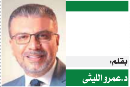
د. عمرو الليثي

التعديل الرحيم يتيح فرص العلاج لعدد أكبر من مرضى الفشل الكلوى بما يسهم فى الحفاظ على حياتهم وتقليل الأهم وتخصيص