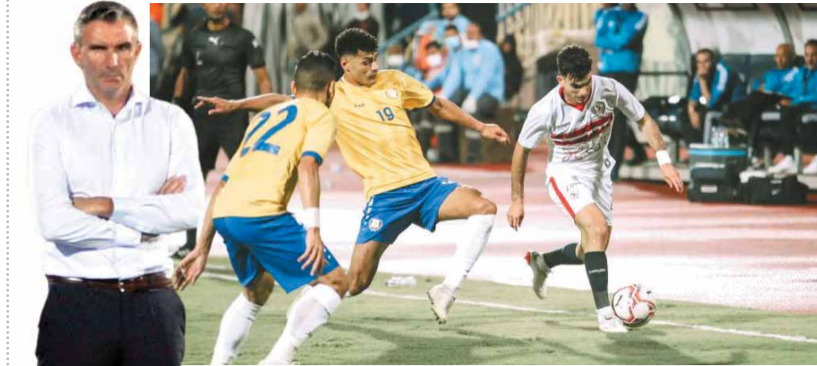
الزمالك عاد بـ ٣ نقاط غالية من الإسماعيلية