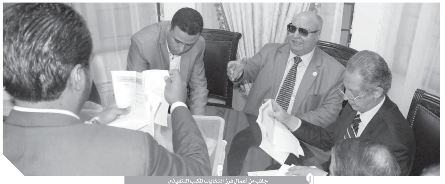
جانب من أعمال فرز انتخابات المكتب التنفيذي