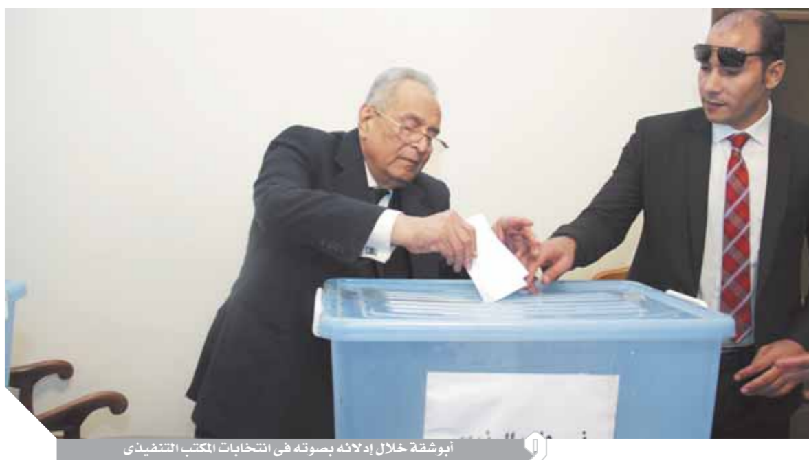
أبوشقة خلال إدلائه بصوته فى انتخابات المكتب التنفيذى