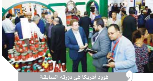
فودود أفريقيا في دورته السابقة

المملكة العربية السعودية، الإمارات، الصين، فرنسا، جنوب إفريقيا، بيلاروسيا، بولندا، أوكرانيا، الهند، باكستان. كما أوضحت المدير العام لكونسبت أن من بين الشركات المحلية الكبيرة المشاركة في المعرض الشركة الدولية لإنتاج البيض المبستر، جهينة، فرج الله، بايرفود، آزما، المراعى، راية، رادنا،