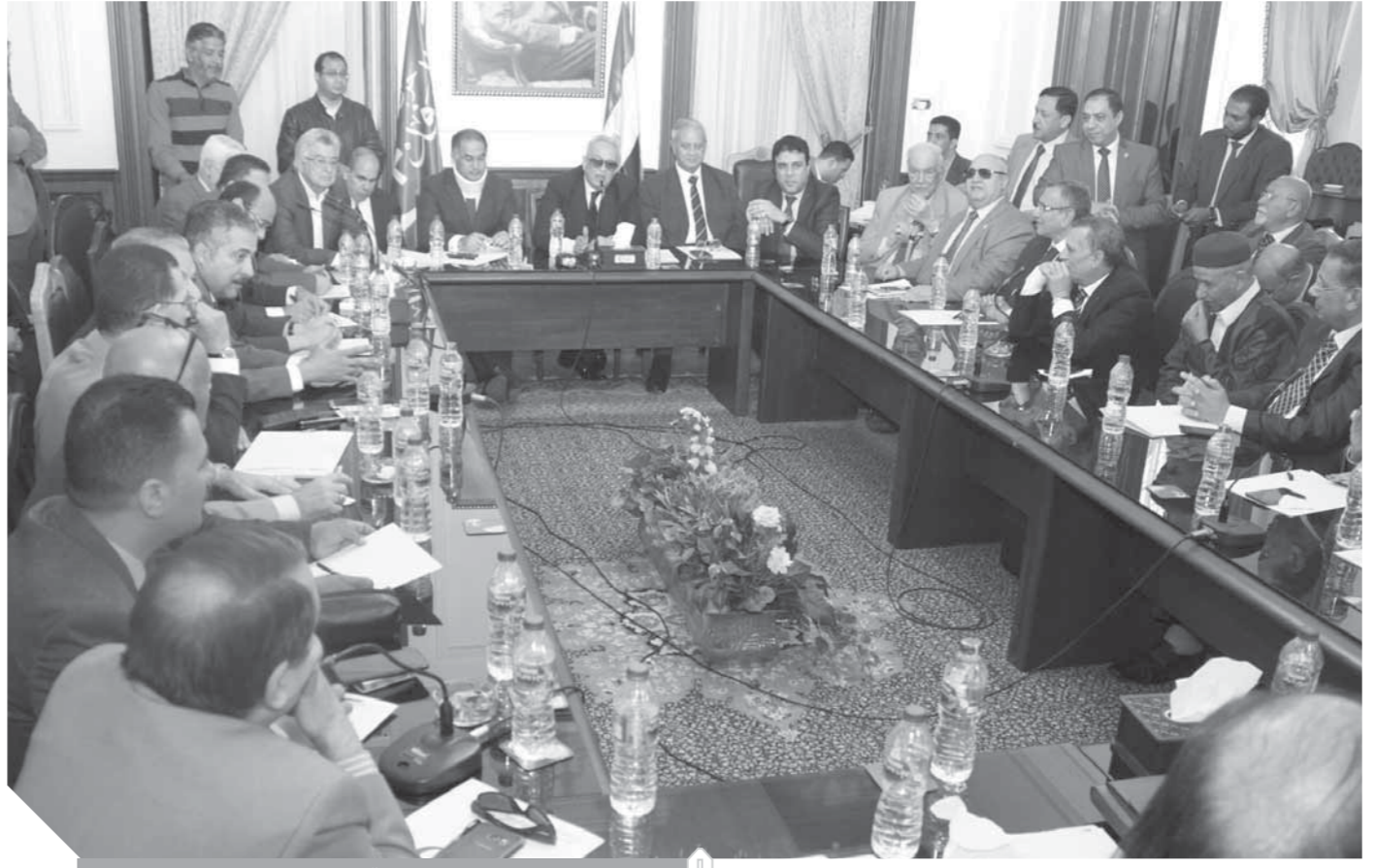
جانب من اجتماع الهيئة العليا لحزب الوفد