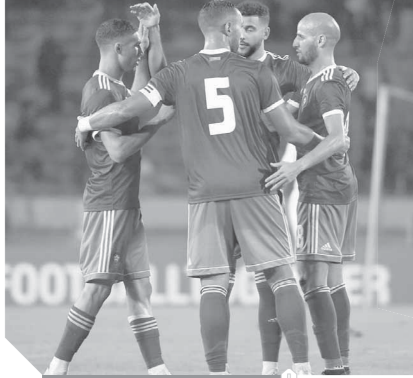
منتخب المغرب حقق فوزاً تاريخياً على الكاميرون

لحقت ثلاثة منتخبات عربية بمنتخبى مصر وتونس إلى نهائيات كأس الأمم الأفريقية، المقرر إقامتها في الكاميرون، ليرتفع رصيد العرب في البطولة المقبلة إلى 5 منتخبات، وربما يرتفع العدد إلى 6 حال صعود ليبيا، المتوقف على الجولة الأخيرة، ليحقق العرب إنجازاً تاريخياً في البطولة التي ستجرى بمشاركة 24 منتخباً للمرة الأولى في تاريخها. وحجزت منتخبات تونس ومصر والمغرب والجزائر وموريتانيا، مقاعد في النهائيات من إجمالي 13 منتخباً حسوماً مشاركتهم في البطولة، بعد إسدال الستار على فعاليات الجولة الخامسة للتصفيات المؤهلة للمسابقة. وحسمت العديد من القوى الكبرى الأخرى مشاركتها في البطولة، فيخلف ضمان المنتخب الكاميروني (حامل اللقب) التأهل بصفته البلد المنظم للبطولة، شهدت البطولة، صعود منتخبات كوت ديفوار ومالي وأوغندا والسنگال ومدغشقر. وسيشكل العرب قوة كبيرة للمنافسة على اللقب، فهنذ انطلاق النسخة الأولى للبطولة عام 1957، لم يتعد عدد المتبلين العرب حاجز 4 منتخبات وهو الأمر الذي تكرر في 8 نسخ لتشهد النسخة القادمة رقماً قياسياً جديداً للمشاركة العربية. وينتظر العرب اكتمال الشمل وزيادة الحضور إلى 6 منتخبات حال تأهل المنتخب الليبي إلى النهائيات بعدما تأجل حسم تأهله إلى الجولة السادسة (الأخيرة) التي ستجرى في مارس المقبل. يملك منتخب ليبيا، حظوظاً لا بأس فيها في التأهل لكأس الأمم الأفريقية، حال فوزه على نظيره الجنوب أفريقي، في الجولة الأخيرة من التصفيات. وعقب تأهل نيجيريا، بصدارتها للمجموعة، فإن الصراع على البطولة الثانية عن تلك المجموعة أصبح مقصوراً على منتخبى جنوب أفريقيا وليبيا.