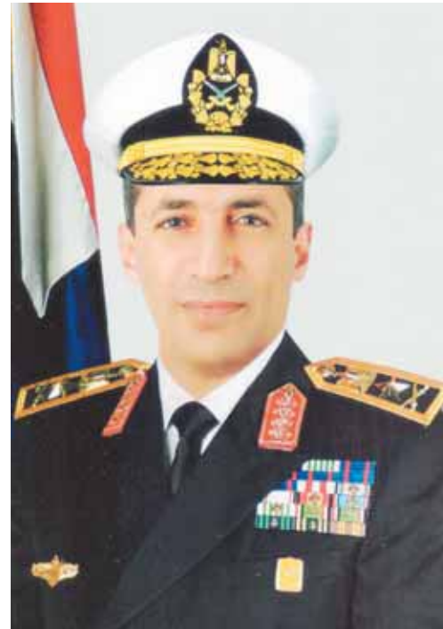
الفريق اشرف ابراهيم عطوة قائد القوات البحرية