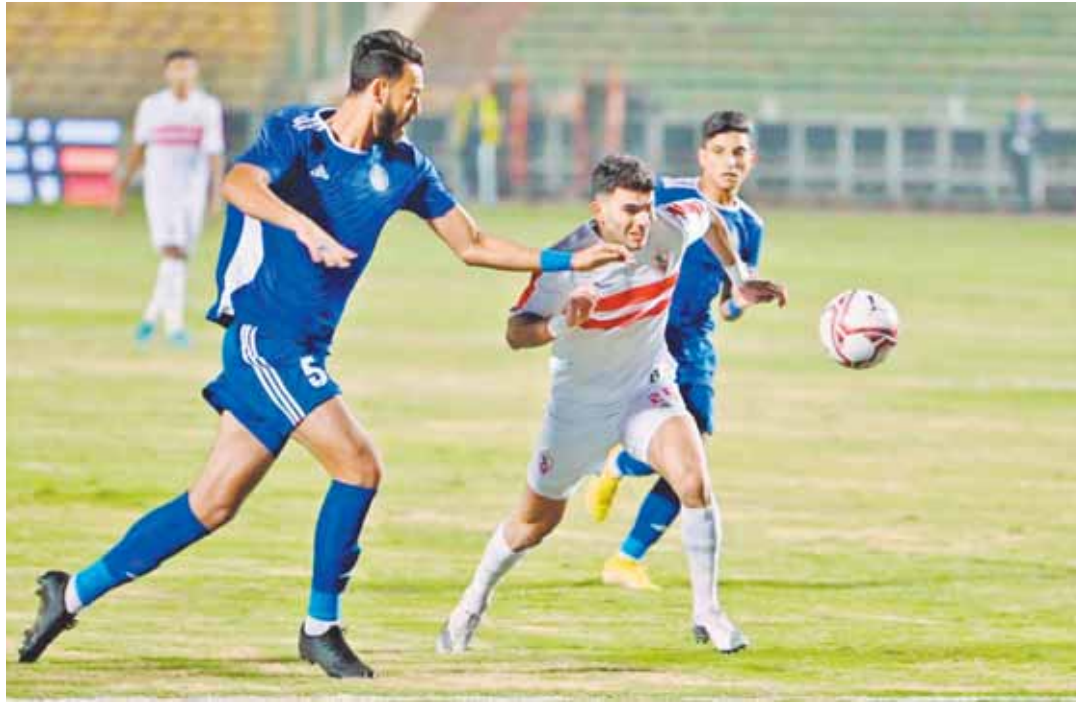
الزمالك لم يقدم الأداء المنتظر منه امام سموحة