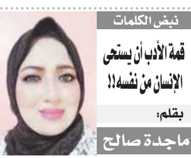
يقلم: ماجة صالح