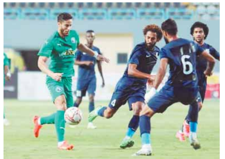
بييراميدز خسر اول نقطتين فى صراع الدورى بالتعادل مع انبى