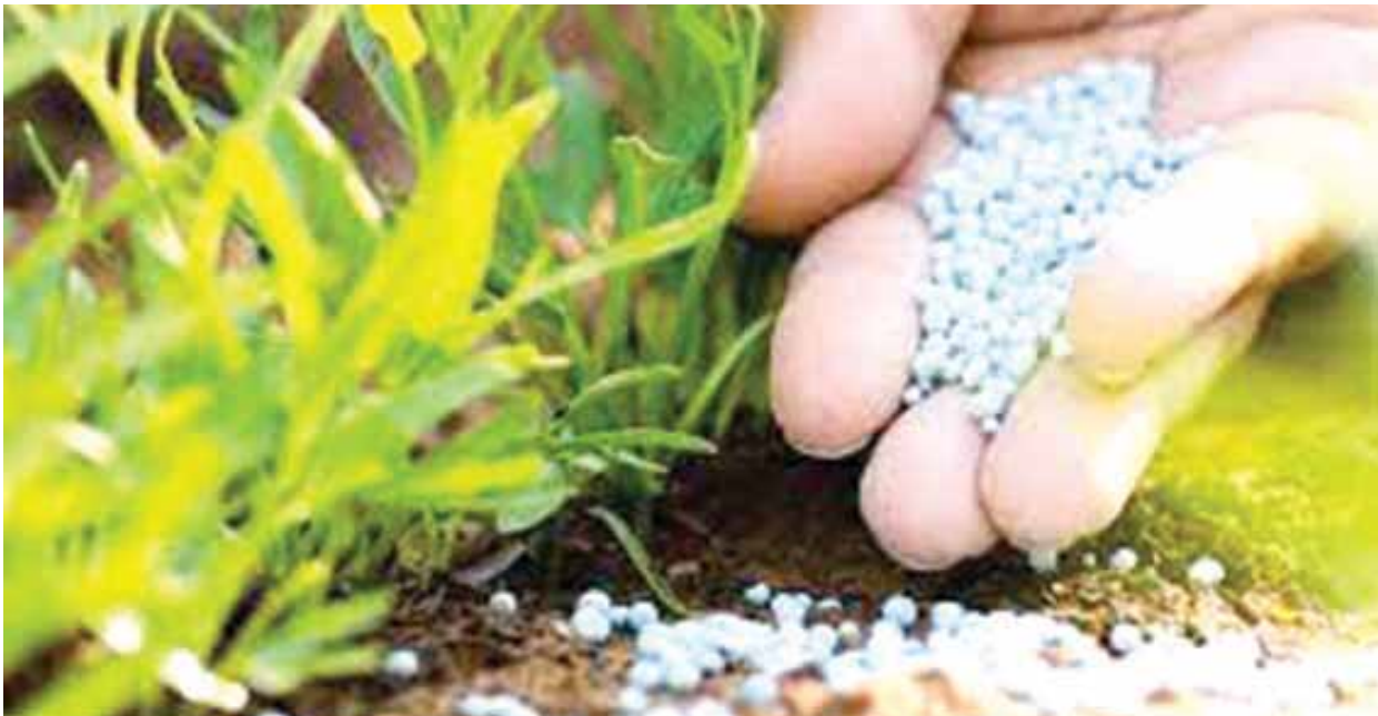
ارتفاع أسعار المبيدات يهدد حجم المساحات الزراعية

وأشارت النائبة إلى أن الفلاح خلال الفترة الماضية يعاني من نقص السماد وارتفاع الأسعار مما يؤثر على المحصول ويعرض الفلاح لخسائر كبيرة، مشيرة إلى أن هناك أسباباً كثيرة لظهور هذه الأزمة منها تحكم الشركات فى كمية المنتج وقلة العرض، بالإضافة إلى ارتفاع أسعار الغاز الطبيعى، وهو المادة الأولية الرئيسية لمعظم الأسمدة النيتروجينية فى العالم، مشيرة إلى أن ارتفاع أسعار الأسمدة يشكل خطراً داهماً على الأمن الغذائى. وأضافت: أن موسم الزراعة هذا الموسم قد بدأ بمشاكل كثيرة فى الأسمدة، مشيرة إلى أن الحرب الدائرة فى أوكرانيا أثرت بدرجة كبيرة فى البلدان المستوردة للقمح، غير أن الكثير من البلدان، ومن بينها بعض كبار مصدري الأسمدة، تتهافتت على شراء الأسمدة من أوكرانيا، مما يعرضها لخطر نقص الأسمدة. وقد تقدمت أسعار الأسمدة المرتفعة إلى مجموعة أكبر من المحاصيل، من بينها الأرز والقمح وهما من المحاصيل الأساسية، ونوهت إلى وجود عدة مشاكل يعاني منها الفلاح مثل: نقص الأسمدة وارتفاع أسعارها وزيادة أسعار مستلزمات الإنتاج بشكل عام، وأكدت السعيد أن لجنة الرى والزراعة بمجلس النواب قامت بتشكيل لجنة فى دور الانعقاد السابق وقامت باستدعاء الشركات للوقوف على أسباب المشاكل وقلة المعروض من الأسمدة، وسيتم تجديد المطالبة بإيجاد حل جذرى مع هذه الشركات ومع وزارة الزراعة.